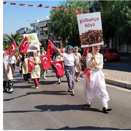
Şekil 3.4. Gülbahçe Kadın Girişimi, Üretim ve İşletme Kooperatifi (K9, K27)

Örneğin, göçmen kadınların mutfak kültürlerinin sürdürülebilirliği adına kurmuş oldukları bir kooperatif bulunmaktadır. Günümüzde de faaliyetlerine devam eden “Gülbahçe Kadın Kooperatifi”, göçmen kadınların bir araya gelerek kışlık yiyeceklerini yaptıkları, farklı tarifleri birbirleri ile paylaştıkları ve kültürlerini başkalarına öğretmek için düzenledikleri şenlikleri ile bilinirliklerini arttırmak için çeşitli çalışmalar yürütmektedir (K9, K27).