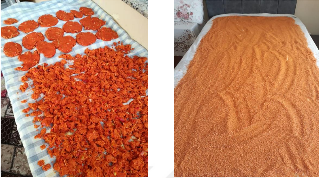
Şekil 3.2. Ekşi Macır Tarhanası Yapım Aşamaları

Katılımcılar, imece usulü gerçekleştirdikleri kış hazırlıklarında özellikle sütlü kuru yufka, erişte ve kuskus yaptıklarını belirtmişlerdir. Kimin hangi ürüne ne kadar ihtiyacı varsa belirlenmekte, sonrasında da toplu halde kışlık ürünler hazırlanmaktadır (K1, K9, K10, K11, K12, K27). Bunların haricinde Yunanistan göçmenlerinin çeşitli malzemelerden reçeller, turşular, domatesli ve biberli soslar hazırladıkları, yemeklerinde kullanmak için salça yaptıkları ve ihtiyaç olduğunda kullanabilmek için küplere kavurma et bastıkları bilinmektedir (K24, K25).