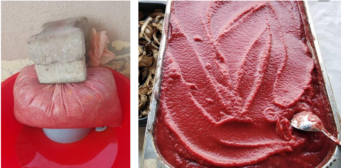
Şekil 3.3. Kışlık Salçanın Yapım Aşamaları

Katılımcılar, imece usulü gerçekleştirdikleri kış hazırlıklarında özellikle sütlü kuru yufka, erişte ve kuskus yaptıklarını belirtmişlerdir. Kimin hangi ürüne ne kadar ihtiyacı varsa belirlenmekte, sonrasında da toplu halde kışlık ürünler hazırlanmaktadır (K1, K9, K10, K11, K12, K27). Bunların haricinde Yunanistan göçmenlerinin çeşitli malzemelerden reçeller, turşular, domatesli ve biberli soslar hazırladıkları, yemeklerinde kullanmak için salça yaptıkları ve ihtiyaç olduğunda kullanabilmek için küplere kavurma et bastıkları bilinmektedir (K24, K25).