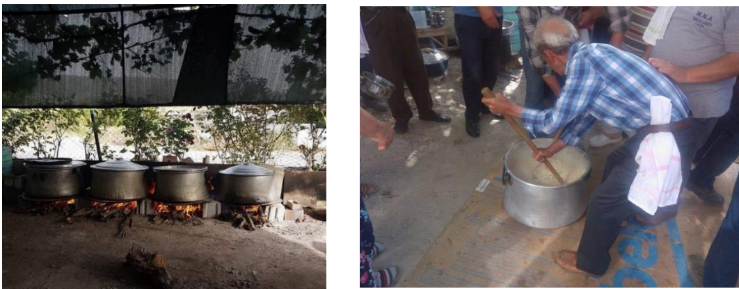
Şekil 3.1. Keşkek Kazanları ve Keşkek Dövme Geleneği

Yunanistan göçmenlerinin mutfak kültürlerinde iskân edildikleri bölgelere göre küçük farklılıkların bulunması düğün yemeklerine yansımıştır. Trakya'nın bazı bölgesinde yaşamakta olan göçmenlerin düğünlerinde keşkek tüketilmezken, kuzey kesimlerine doğru gelindiğinde kendilerine özgü adetler ile keşkek yapıp misafirlerine ikram ettikleri bilgisine ulaşılmıştır (K9, K10, K11, K12, K24, K25).