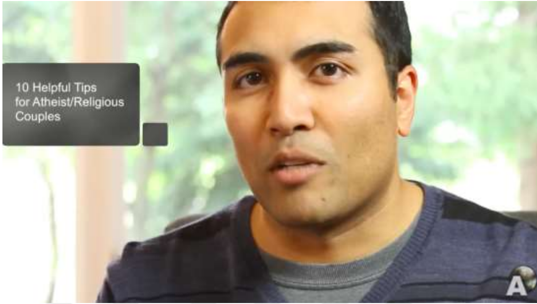
Şekil 10. The Atheist Voice Kanalı – “9 Problems in Atheist / Religious Relationships” Videosu ( https://www.YouTube.com/watch?v=GN52GroqQC4 )