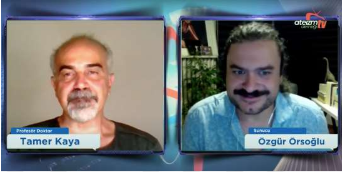
Şekil 1. Ateizm Derneği TV Kanalı – “Vücudumuzda Evrim İzleri” Videosu ( https://www.YouTube.com/watch?v=3gZ8gO_g03E )

Videoda, evrimin sosyo-psikolojik etkileri, ahlaki değerler ve toplumsal normlar bağlamında da ele alınmış ve evrimin genel olarak insanlık ve toplum üzerindeki etkileri tartışılmıştır. Bilim ve evrimin ateist perspektifte nasıl konumlandırıldığı ve bu perspektifin bilimsel araştırmalar ve tıbbi ilerlemeler için nasıl önemli olduğu vurgulanmıştır. Videoda sunulan bilgiler, ateizm ve evrim arasındaki ilişkiyi ve bu ilişkinin toplumsal ve kültürel bağlamdaki önemini geniş bir şekilde ele almaktadır.