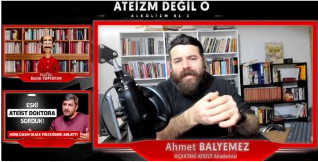
Şekil 8. Uçaktaki Ateist Akademisi Kanalı – “Din Bir Afyondur İspatı” Videosu ( https://www.YouTube.com/watch?v=pnMg2zyczEY&t=900s )