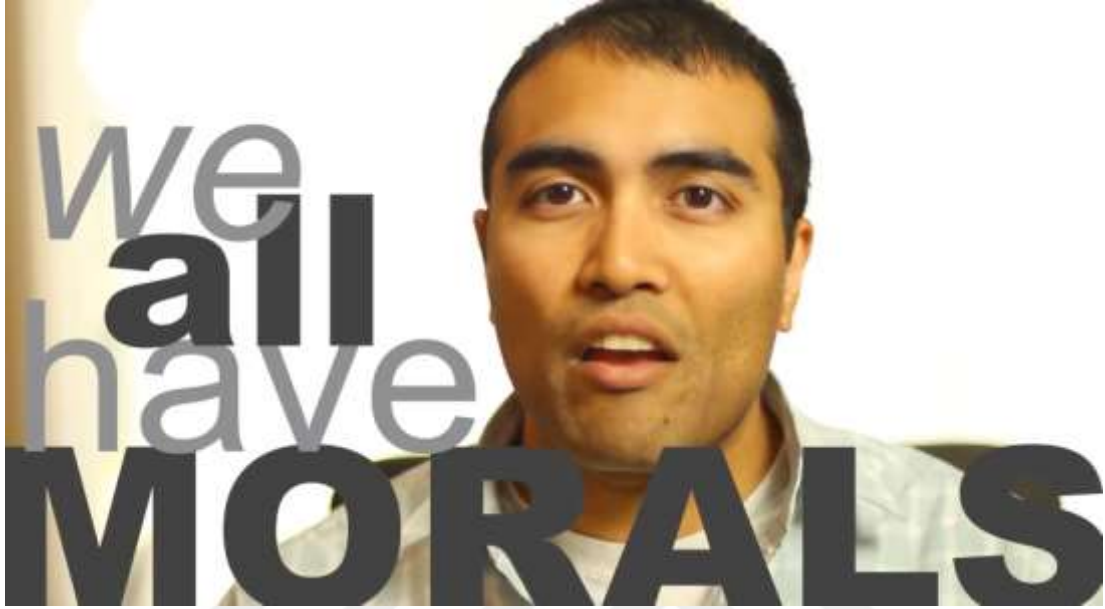
Şekil 9. The Atheist Voice Kanalı – “15 Things to Never Say to an Atheist” Videosu ( https://www.YouTube.com/watch?v=vNjEbPfc2d0&t=15s )

Ateist bireylerin sıkça vurguladığı veya eleştirdiği konular arasında kültürel ve manevi meseleler öne çıkmaktadır. Ahlak meselesi, analiz edilen diğer içeriklerde de sıklıkla karşımıza çıktığı gibi, bu videoda da önemli bir yer tutmaktadır.