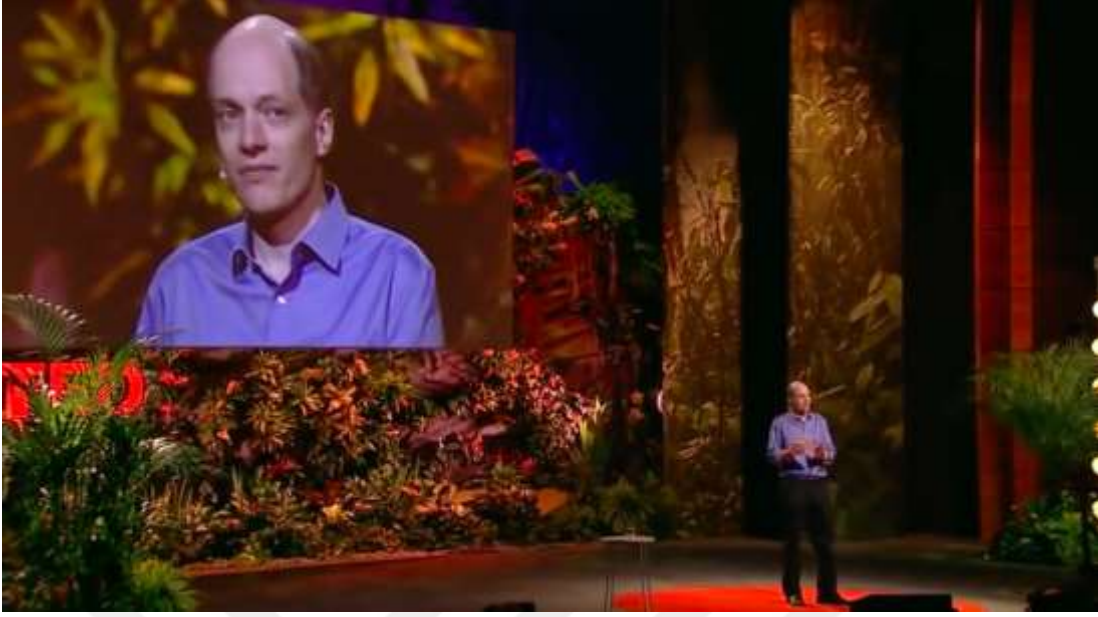
Şekil 14. TED Kanalı – “Alain de Botton: Ateizm 2.0” Videosu” ( https://www.YouTube.com/watch?v=2Oe6HUgrRIO&t=934s )

İnsan varoluşsal olarak sosyal bir varlık olduğundan başkasıyla birlikte olmak bir şeyler paylaşmak insana duygusal olarak iyi gelen bir faaliyet olmaktadır. Gerek bu video gerekse de Tanrısızlar için kilise videosu yabancı kaynaklardan alındığından İslamiyet’ten daha çok Hristiyanlar üzerinden tartışılmaktadır. Dolayısıyla da Hristiyanların Pazar buluşmaları ya da Pazar ayinleri çerçevesinde tartışılmaktadır. Benzer bir durum Müslümanların cuma günlerinde camilere yoğun gitmesi üzerinden de örneklendirilebilir. Bu faaliyetlerde teistler bir araya gelerek hem dayanışma hem de yardımlaşma duygularını geliştirmektedirler. Dini toplantılar insanların açlarını paylaşma yerleri olarak da duygusal yönden iyi hissetmenin önemli yollarından birisidir.