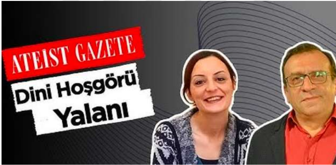
Şekil 2. Ateizm Derneği TV Kanalı – “Dini Hoşgörü Yalanı” Videosu ( https://www.YouTube.com/watch?v=4OfWy46T50k )