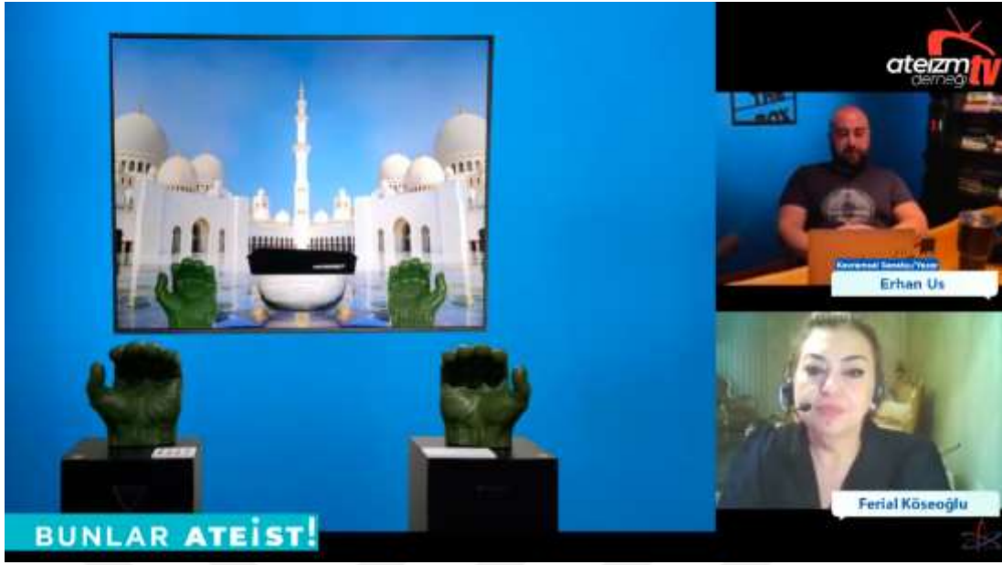
Şekil 4. Ateizm Derneği TV Kanalı – “Allahsız Sanat” Videosu ( https://www.YouTube.com/watch?v=ux-Wrgdw70E&t=5560s )