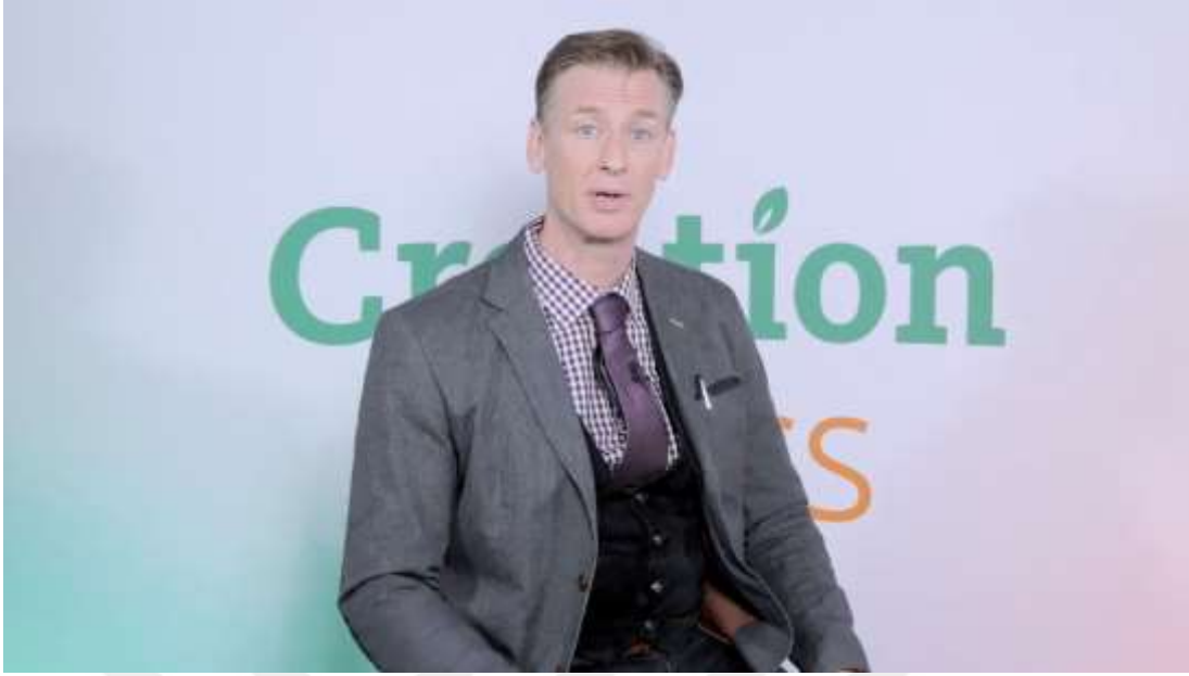
Şekil 11. Answers in Genesis Canada Kanalı – “What Does Atheism Produce in Society” Videosu ( https://www.YouTube.com/results?search_query=answers+in+genesis+canada )