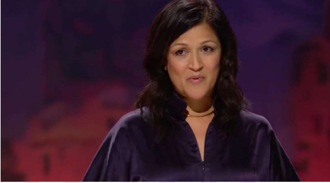
Şekil 13. TED Kanalı – “My Failed Mission to Find God” Videosu ( https://www.YouTube.com/watch?v=pgmiPXAwiLg&t=611s )

İnsanlar arasında her ne kadar dini, sosyal ya da etik açıdan farklılıklar olsa da diğer yandan da birbirine benzerlikler ve aynılıklar vardır. İşte önemli olan farklılıklara saygı duymakla birlikte aynılıkları ve benzerlikleri görmek gerekmektedir. Şu halde ateist ve teist ya da deist olarak birçok farklı dini görüş söz konusu olsa da bu insanların benzerlikleri de bulunmaktadır. Yukarıda videoya dair bir görsel sunulmaktadır. Videonun sosyal medya çerçevesi incelendiğinde 2 milyondan fazla izleyiciye ulaştığı gözlemlenmektedir. Videoda öne çıkan temel temalar ise şöyle özetlenmektedir.