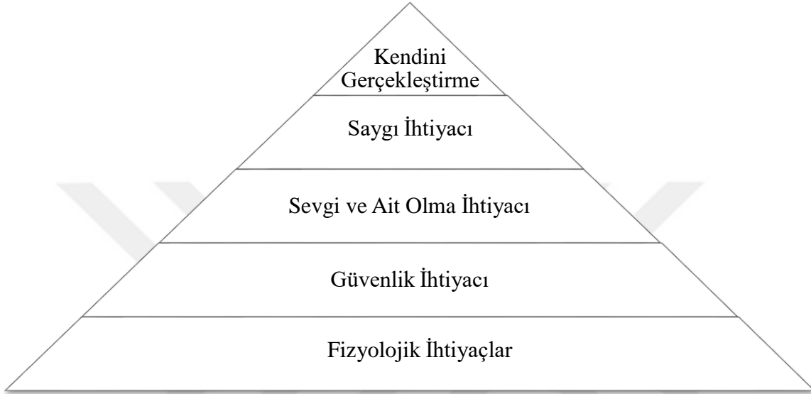
Şekil 2.1. Abraham Maslow'un İhtiyaçlar Hiyerarşisi (Maslow, 1987).

Maslow (1943), ilk dönemlerde bireyin daha üst düzeydeki büyüme ihtiyaçlarını karşılamaya devam etmeden önce daha düşük düzeydeki eksiklik ihtiyaçlarını karşılaması gerektiğini belirtmiştir. Daha sonra, bir ihtiyaç tatmininin “ya hep ya hiç” olgusu olmadığını ve önceki açıklamalarının “bir sonraki ihtiyaç ortaya çıkmadan önce bir ihtiyacın tamamının karşılanması gerektiği fikrinin yanlış bir değerlendirme” olabileceğini kabul etmiştir (Maslow, 1987).