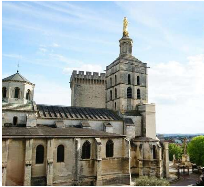
Ek 3: Notre-Dame-Des-Doms Katedrali 439