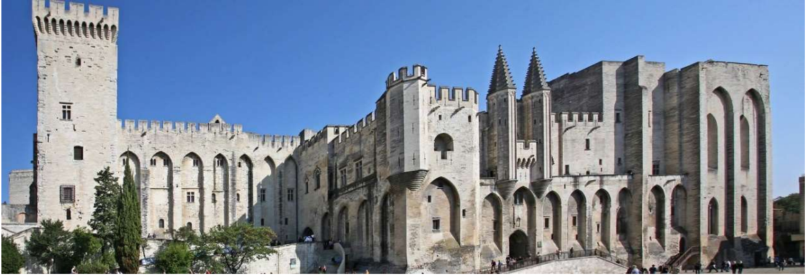
Ek 6: Avignon'daki Papalık Sarayı 442