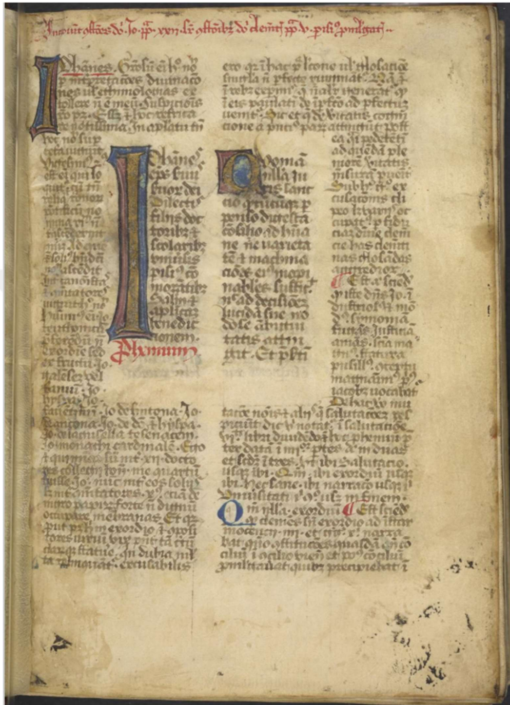
Ek 11: Constitutiones Clementinae , V. Clément'in almış olduğu kararların en eski yazılı örneğidir. XIV. yy'da yaşamış olan Giovanni d'Andréa'nın açıklamaları da bulunmaktadır. 448