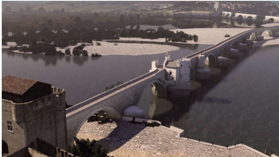
Ek 4: Aziz Bénézet Köprüsü'nün 3D hali 440