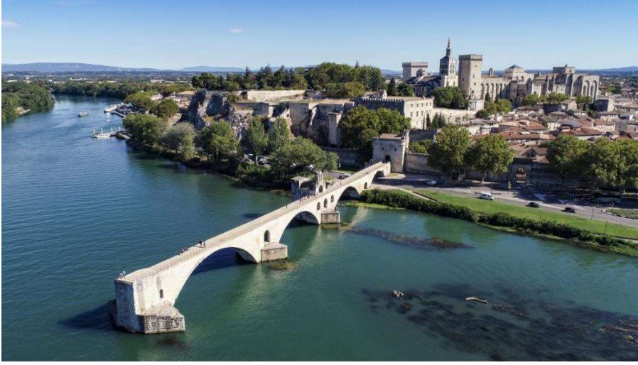
Ek 5: Aziz Bénézet Köprüsü'nün günümüzdeki hali 441