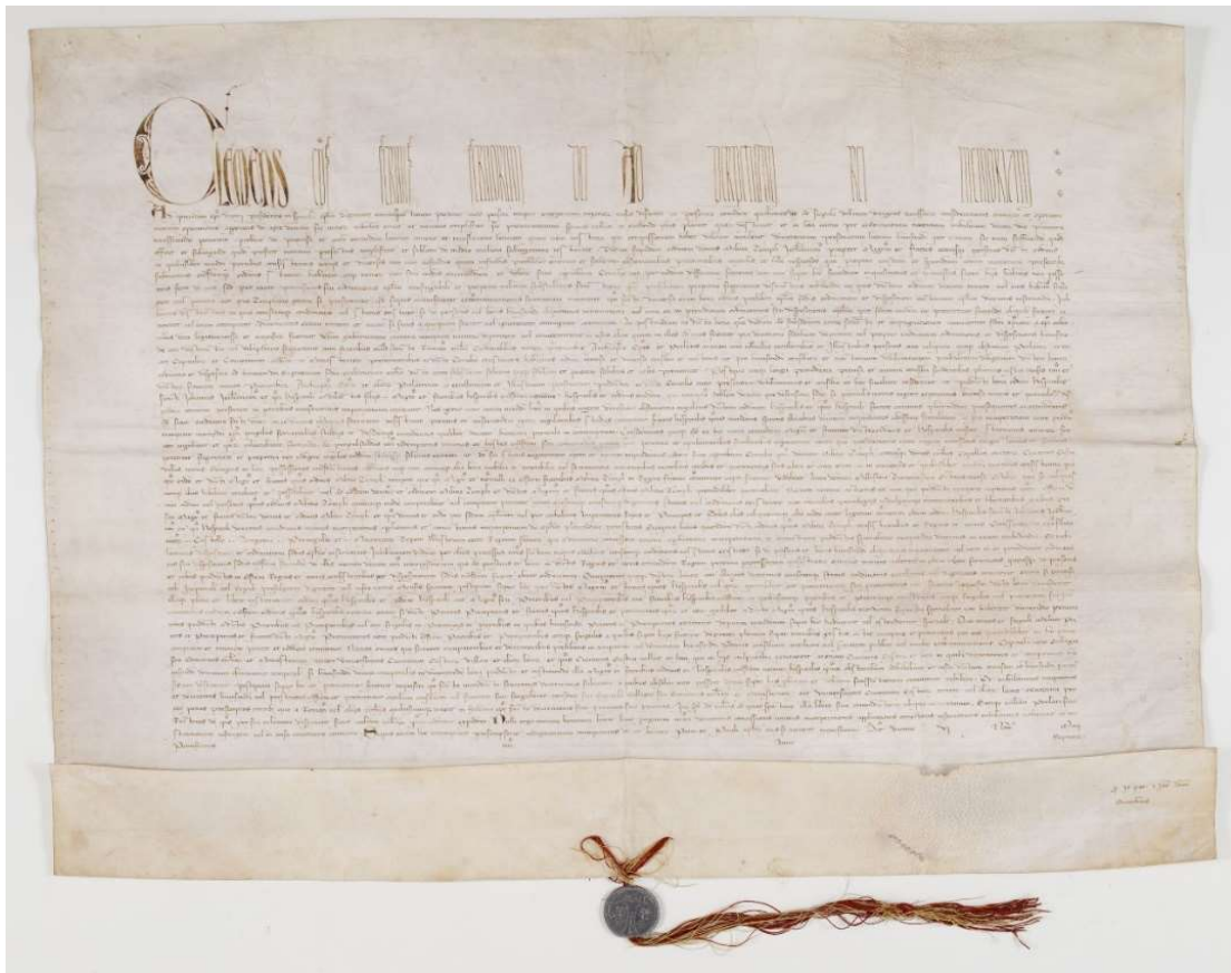
Ek 8: Ad Providam , Tapınak Şövalyeleri Tarikatı Hazinesinin Hospitaliers Tarikatına devredildiğini bildiren belge. 445