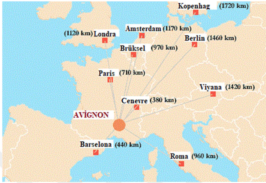
Ek 1: Günümüzde Avignon'un Avrupa'daki konumu 437