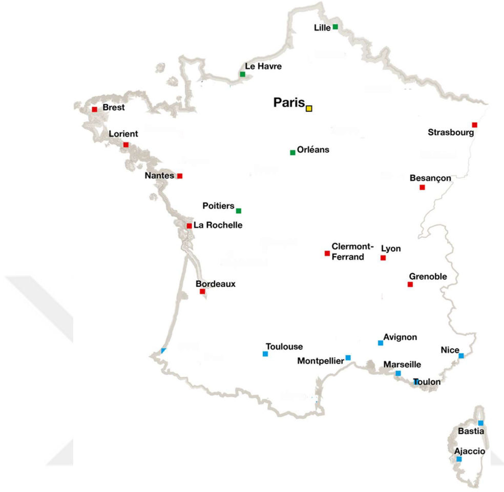
Harita 1: Fransa Haritası 4