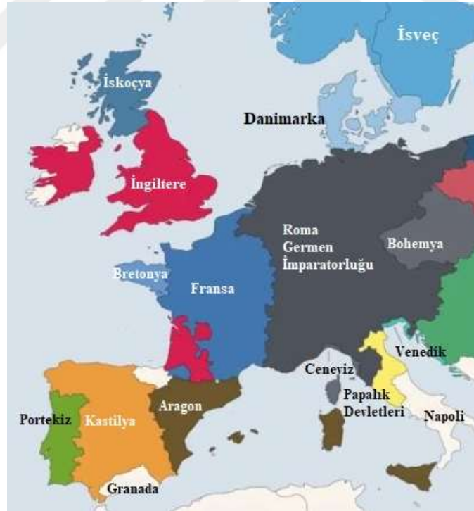
Ek 2: 1330 yılında Avrupa haritası (yıl: 1330) 438