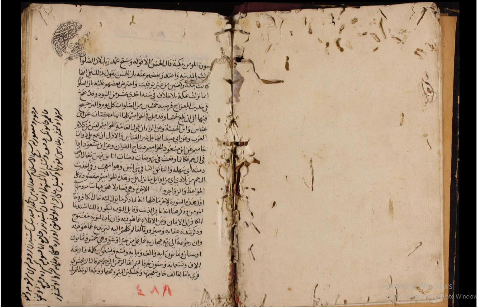
Resim 4: Beyazıt B488 numaralı nüshanın zahriyesi ve ilk sayfası