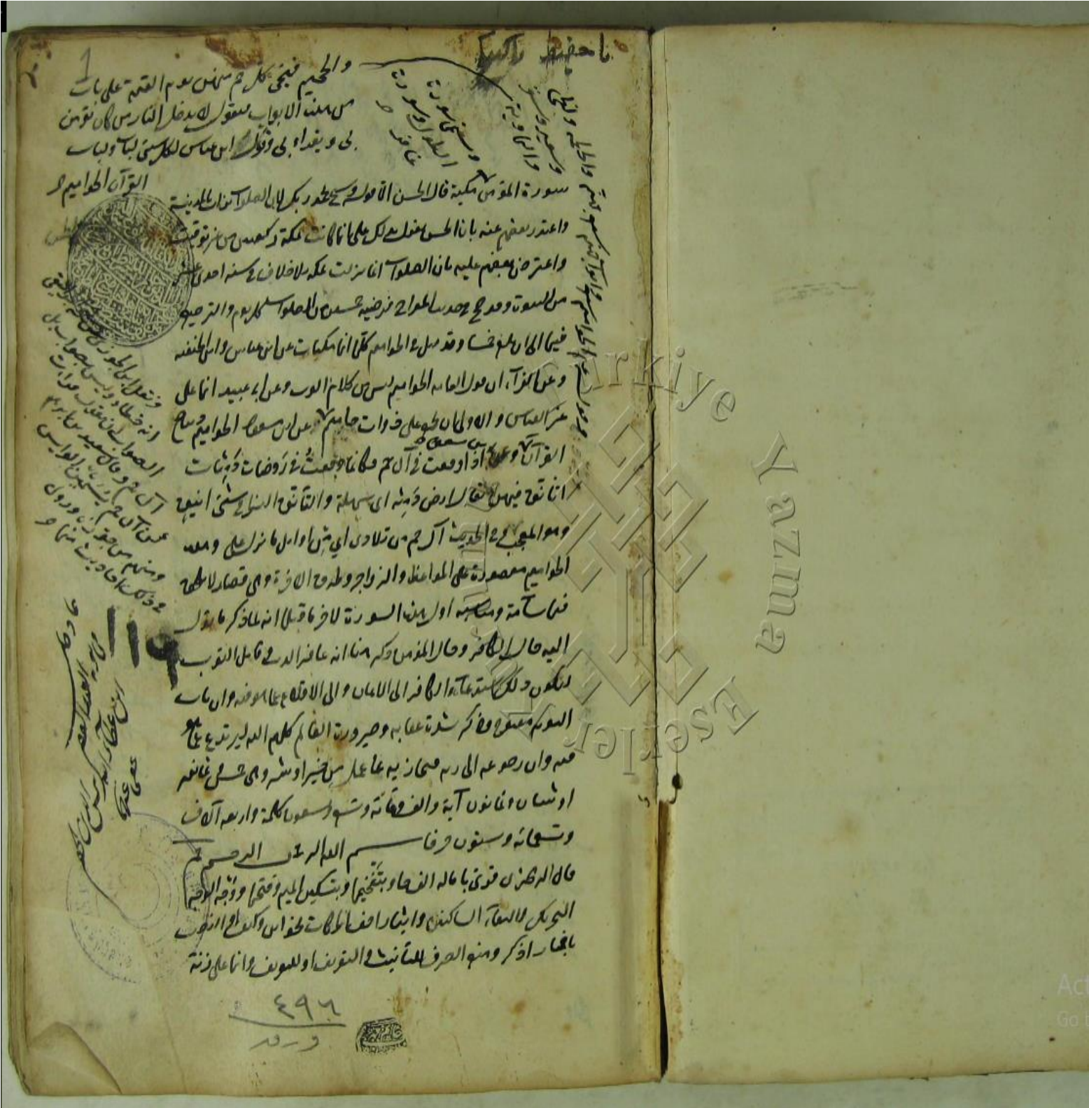
Resim 1: Cârullah Efendi dokuzuncu cilt, 112 numaralı nüshanın zahriyesi