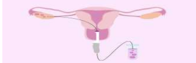
Şekil 1.2. Yumurta toplama 18

“Oosit Retrieval (yumurta toplama)” denilen ikinci aşamada, yumurtalar, ultrason eşliğinde yapılan bir işlemle kadının yumurtalıklarından toplanır. Aynı zamanda, erkekten de sperm örneği alınır.