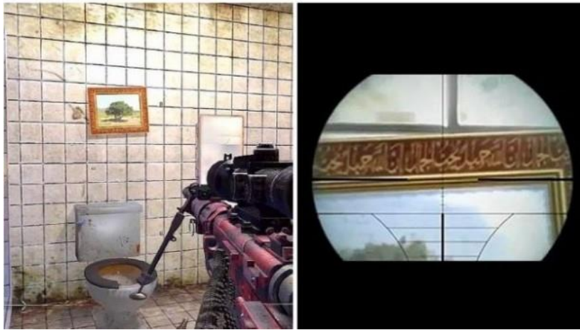
Görsel 2: Call of Duty 2007 oyunundan bir görüntü.

"Call Of Duty" 2007 'de Amerika'da Activision Game firması tarafından çıkartılan oyunda Arapça yazılarla süslenmiş resim çerçevesi tuvaletin üzerinde yerleştirilmiştir.