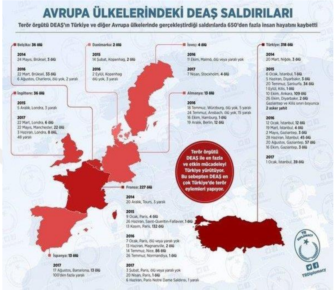
Görsel 7: Daeş saldırıları