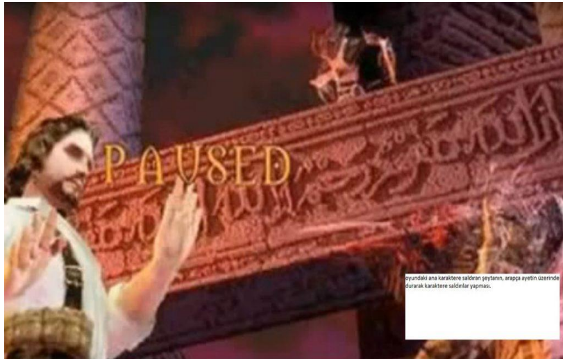
Görsel 4: Clive Barkers Undying oyunundan bir görüntü.

“Clive Barkers Undying” isimli oyun tek başına kavga etme ve öldürme üzerine kurulmuş. Oyunda ana figüre saldıran şeytan, Arapça ayetler üzerinde saldırılar gerçekleştiriyor.