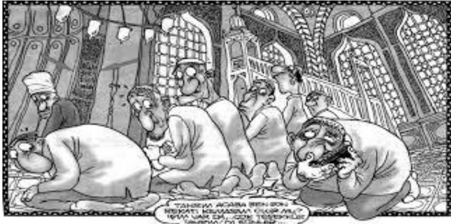
Görsel8: Penguen Dergisi Karikatürü. 9 Şubat 2011, s.10

İyi bir ilim taliminden sonra ilmi doğru tebliğ etmemiz gerekmektedir. Zira İslamofobi konusunda sadece Müslüman olmayan ülkelerde değil, Müslüman ülkelerde bile peşin ve yanlış hükümlerin yer aldığını görmekteyiz. Türkiye’de ki bazı mizah dergilerinde yer alan İslam’la ilgili karikatürler bu düşüncemizi teyit etmemizi sağlamıştır. Konuyla ilgili birkaç örnek verecek olursak şu karikatürleri gösterebiliriz.