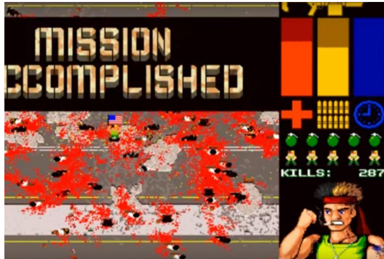
Görsel 6: Muslim Massacre oyunundan bir görüntü.

“Muslim Massacre” 2008 Amerikan yapımı oyunda, tek kişilik yok etme türünde oyunda hedef Hz. Muhammed’in (s.a.v.) gösteriliyor ve O’nun öldürülmesi isteniyor. 80