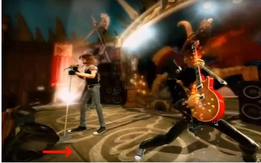
Görsel 3: Gitar Hero 3 oyunundan bir görüntü.

“Guitar Hero 3”, 2007 yılında Amerika’da çıkan oyunda bir eğlence ortamında şarkı söyleyen ve gitar çalan karakterlerin üzerinde durduğu zeminde Arapça “ALLAH” yazıyor.