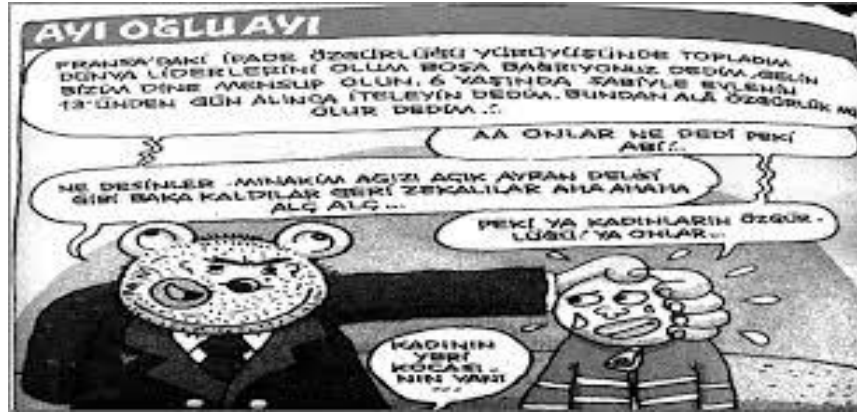
Görsel 9: UykusuzDergisi Karikatürü. 2015, 2