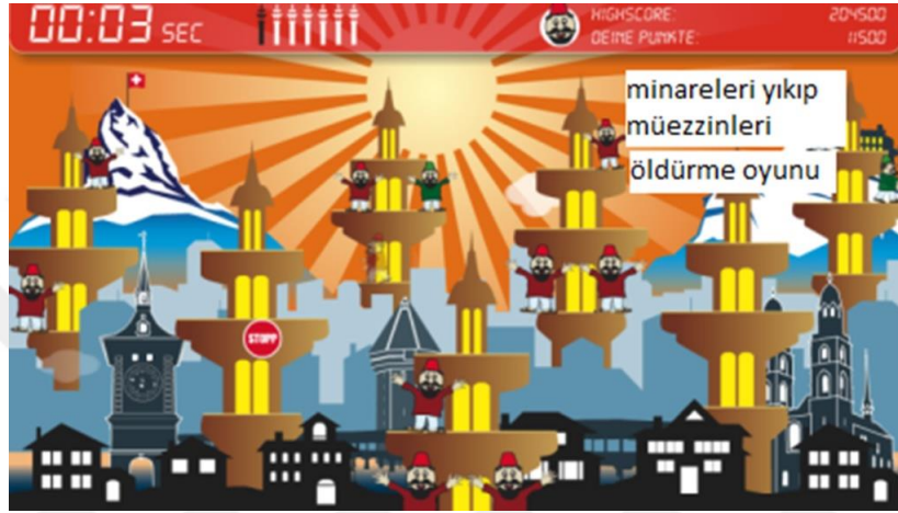
Görsel 1: Getready Minarett Attack Resident Evil oyunundan bir görüntü

“Getready Minarett Attack” İsviçre’de geliştirilen oyun ülkedeki minare referandumu öncesinde piyasaya sürülmüştür. Aşırı sağcı politikacıların seçim faaliyetlerinde rol oynayan oyunda amaç minarelerin yükselmesini engellemek, müezzinin ezan okumasına karşı koymaktır. Oyunu kazanmak için müezzinin üzerine gidilip düğmeye basılır. Ayrıca Minare üzerinde sakallı ve fesli müezzinler tasvir edilmiştir.