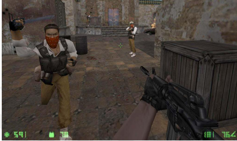
Görsel 5: Countur Strike oyunundan bir görüntü.

“Counter Strike” isimli oyunda teröristlerle komandolar arasında geçen mücadelede komandolar teröristleri öldürürken, teröristler “Lailahe illallah, Allahuekber,” nidalarıyla bağıyorlar. Gelen tepkiler üzerine firma oyunu yeniledi ve bu ses efektlerini kaldırdı.