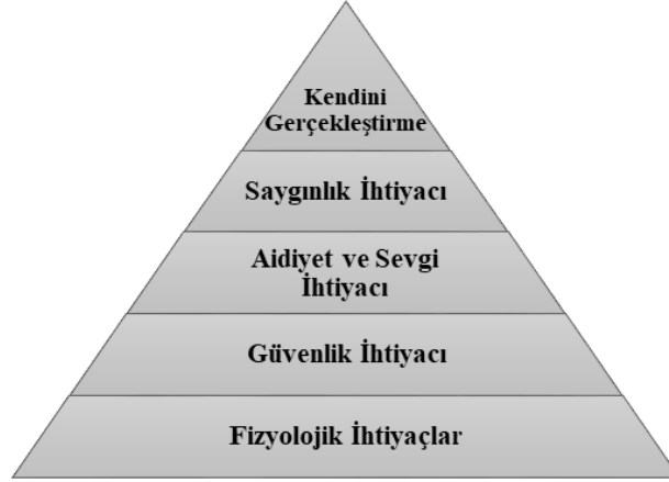
Şekil 1.1. Maslow'un ihtiyaçlar hiyerarşisi