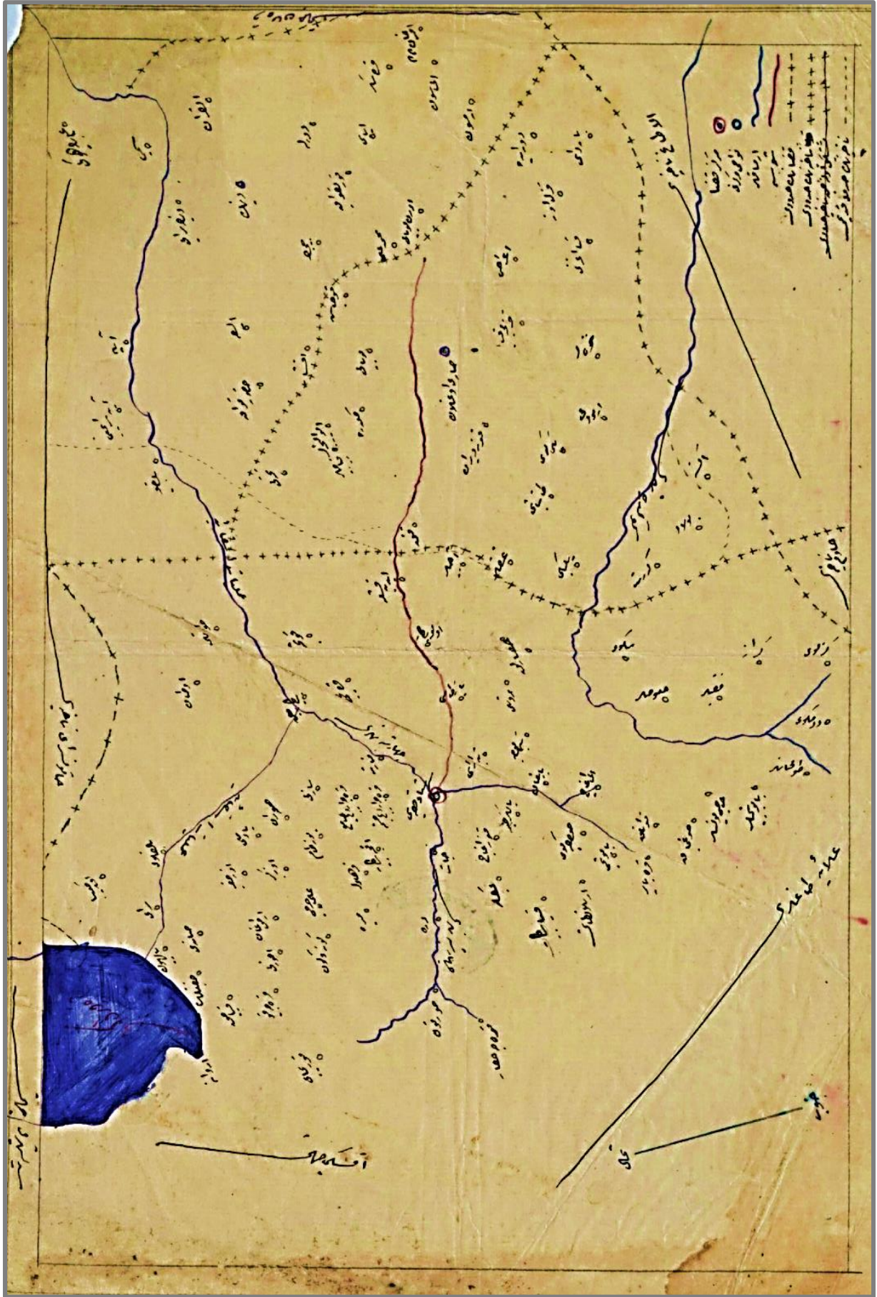
Harita: 1 29 Zilhicce 1341/12 Ağustos 1923'te Belviran Nahiyesi'nin merkezi Sarroğlan (BOA, HRT, gömlek: 01117)