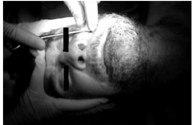
Şekil 1. Sol tripod kırığı olan hastanın zigoma gövdesinin altına Volkmann kemik kancanın yerleştirilmesi.

Sedoanaljezi altında, cerrahi alanın temizliğini takiben izole zigomatik ark kırıklarında deprese ark palpe edildi, Volkmann kemik kancası perkütan yaklaşımla kırık ark altına, tripod kırıklarda ise zigoma gövdesinin altına yerleştirildi (Şekil 1). Kontrollü kuvvet ile yer değiştirmiş ve deprese olmuş kemik kaldırılırken diğer el ile kemik yapı devamlı muayene edilerek kemiğin normal pozisyona gelip gelmediği kontrol edildi. Kemik sesi duyulduktan sonra hem palpasyonla hem de inspeksiyonla sağlam olan diğer tarafla simetri kontrol edilerek deprese kemik yapının doğru pozisyona geldiğinden emin olundu.