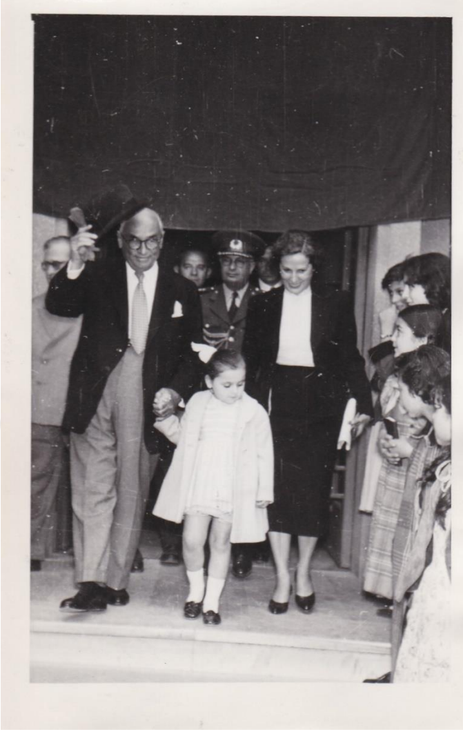
Cumhurbaşkanı Celal Bayar ve Mükerrerrem Kâmil Su- Radyo Çocuk Saati Çıkışı /1957