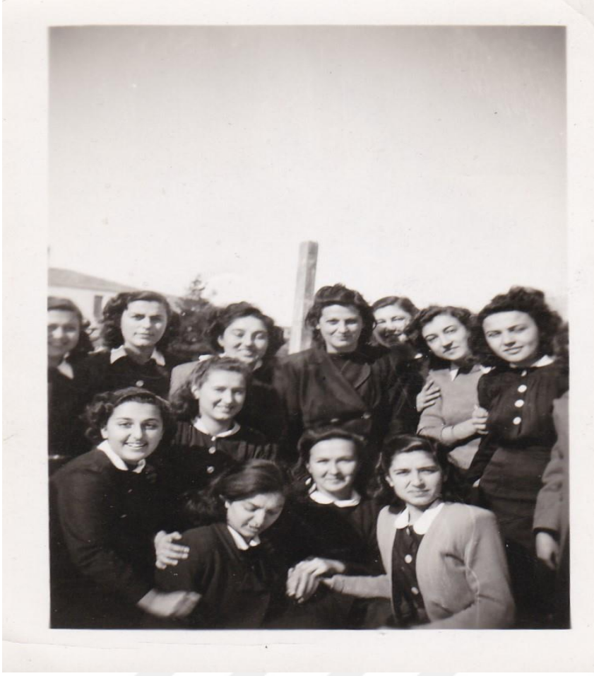
Ankara Kız Lisesi (Ocak 1947)