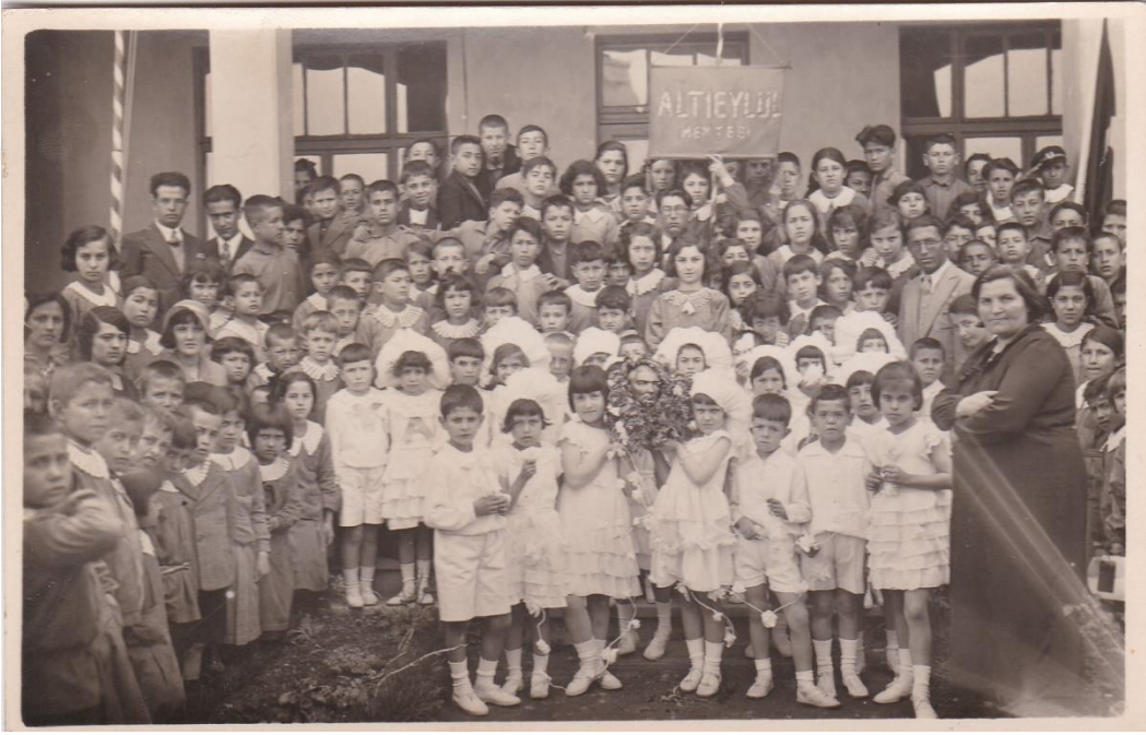
6 Eylül İlkokulu Balıkesir /1935