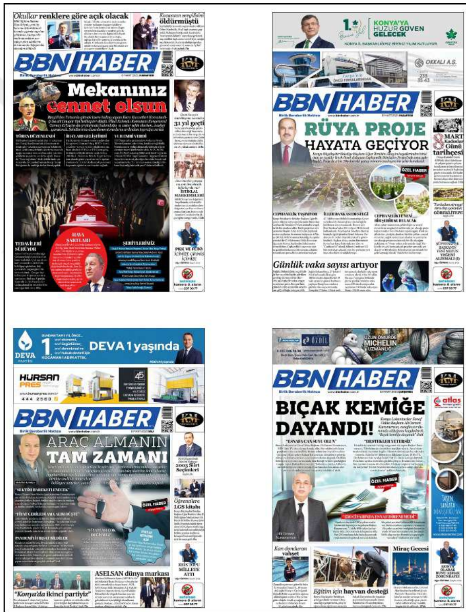
Resim 20: (6.03.2021), (08.03.2021), (09.03.2021), (10.03.2021), BBN Haber gazetesi Şerifli (tırnaklı) yazı karakteri kullanımı.

BBN Haber Gazetesi 5 Mart 2021 tarihli Resim 19'da ana kapak tasarımında görüldüğü üzere haber metinlerinde küçük puntolu tırnaklı font karakterleri kullanıldığı tespiti yapılmış olup, haber başlıkları kendi içlerinde ince ve kalın büyük puntolu tırnaklı küçük font dizilimlerinden oluşturulmakla birlikte manşet haber başlığı büyük puntolu tırnaklı büyük harf kullanımı tercih edilerek, manşet alt başlıkları tırnaklı kalın ve büyük harflerden oluşturulduğu görülmüştür. Ayrıca haber metinlerinde dar sütün kullanımı uygulanmıştır.