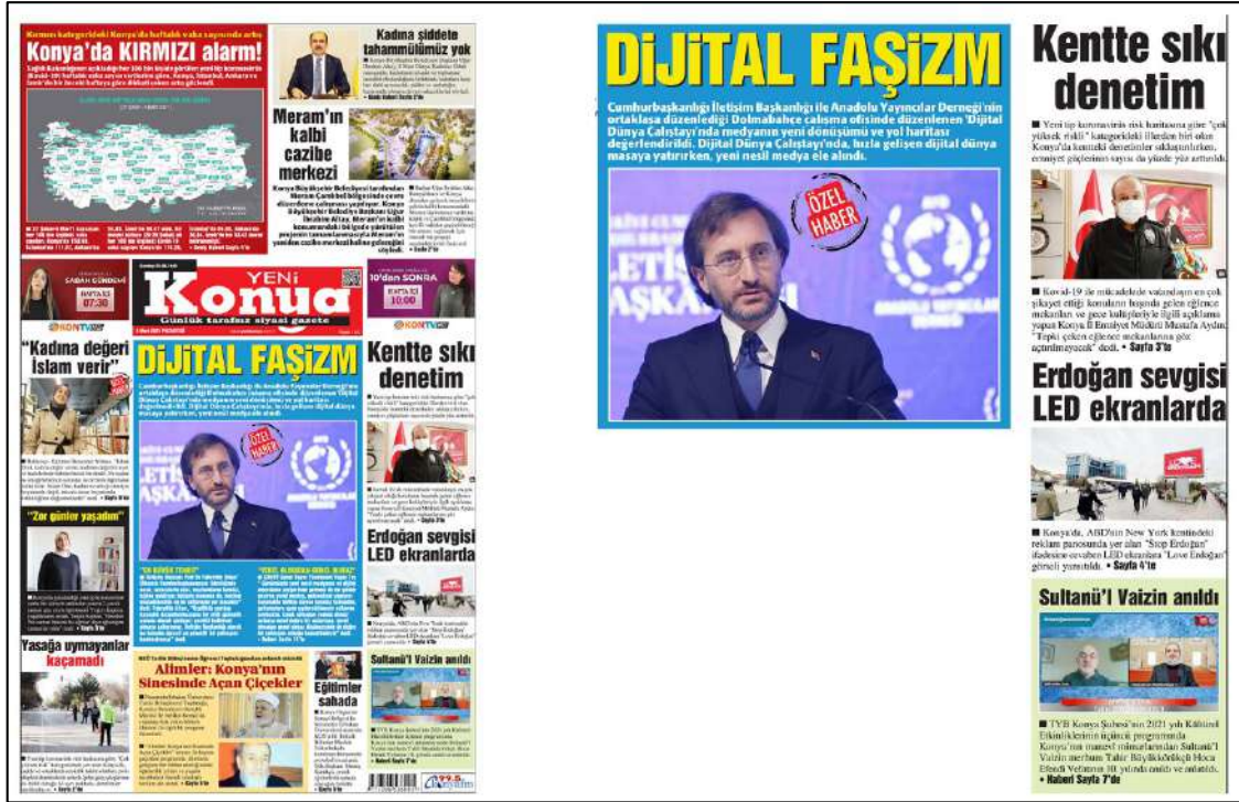
Resim 38: Yeni Konya gazetesi 08.03.2021, Tipografik Açıdan Ana ve Ara Başlıkların Kullanımı.

başlıklarının haber alanına göre düzenlendiği düzgün bir şekilde yerleştirildiği inceleme sonucunda tespit edilmiştir