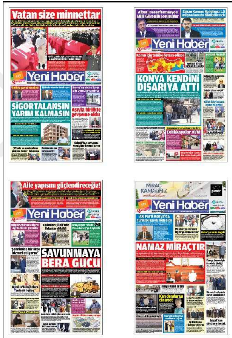
Resim 12: (6.03.2021), (08.03.2021), (09.03.2021), (10.03.2021), Yeni Haber gazetesi Şerifli, Şerifsiz (tırnaklı-tırnaksız) yazı karakteri kullanımı.

Yeni Haber gazetesi 5 Mart 2021 tarihli ana kapak tasarımında Resim 11’de görüldüğü üzere sütunlar arası haber dizilimlerinde tırnaklı ve ağırlıklı olarak tırnaksız küçük font kullanımı uygulanmış olup haber başlıkları büyük puntolu küçük harf dizilimlerinden oluşturulmuş ve manşet haber başlığında tırnaksız büyük puntolu büyük harf dizilimi tercih edilerek haber sütunları kullanımı dar kullanılmaya çalışılmıştır.