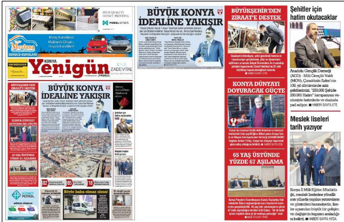
Resim 55: Konya Yenigün Gazetesi 10.03.2021, Tipografik Açıdan Ana ve Ara Başlıkların Kullanımı.

Resim 55'te örneklerde görüldüğü üzere Konya Yenigün gazetesinin 10 Mart 2021 tarihli kapak tasarımındaki ana başlık ve ara başlıkların tipografik kullanım yönünden incelemesi yapılmıştır. Bu bağlamda gazete manşet başlığının büyük puntolarla yazılıp haberin en önemli haber olduğu ortaya çıkartılmış ve manşet başlığının haber alanını genişliğinde olduğunun tespitine varılmıştır.