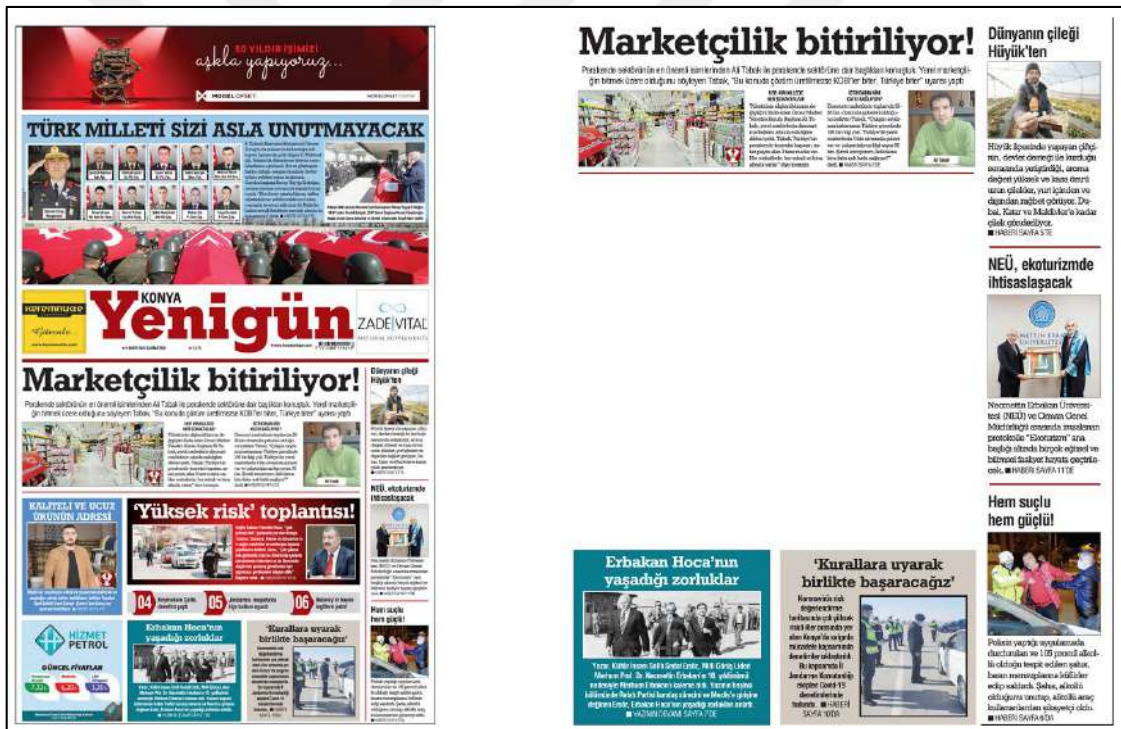
Resim 52: Konya Yenigün gazetesi 06.03.2021, Tipografik Açından Ana ve Ara Başlıkların Kullanımı.

Haber ara başlıkları incelendiğinde alt alta ve yan yana gelen haber başlıklarının punto büyüklüklerinin ve harf kalınlıklarının birbirinin aynısı olduğunun tırnaklı ve tırnaksız yazı karakteri kullanıldığı, haber önem sırasına göre yerleştirilmediği ve ana başlık tırnaklı font karakterinden oluşturulurken ara başlıkların tırnaklı ve tırnaksız font karakterinden oluşturulduğu görülmüştür. Haber başlıklarının haber alanına göre düzenlenmediği düzgün bir şekilde yerleştirilmediği görülmüştür.