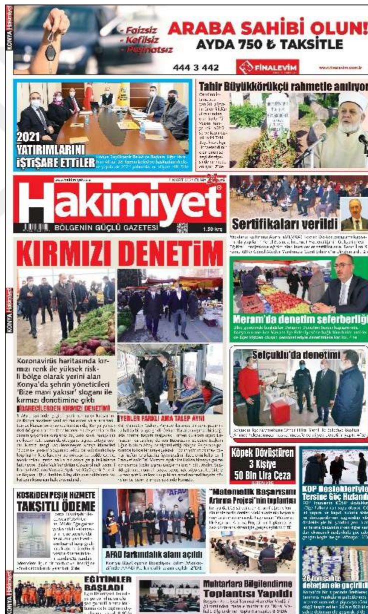
Resim 15: 5.03.2021, Hakimiyet gazetesi Şerifsiz (tırnaksız) yazı karakteri kullanımı.