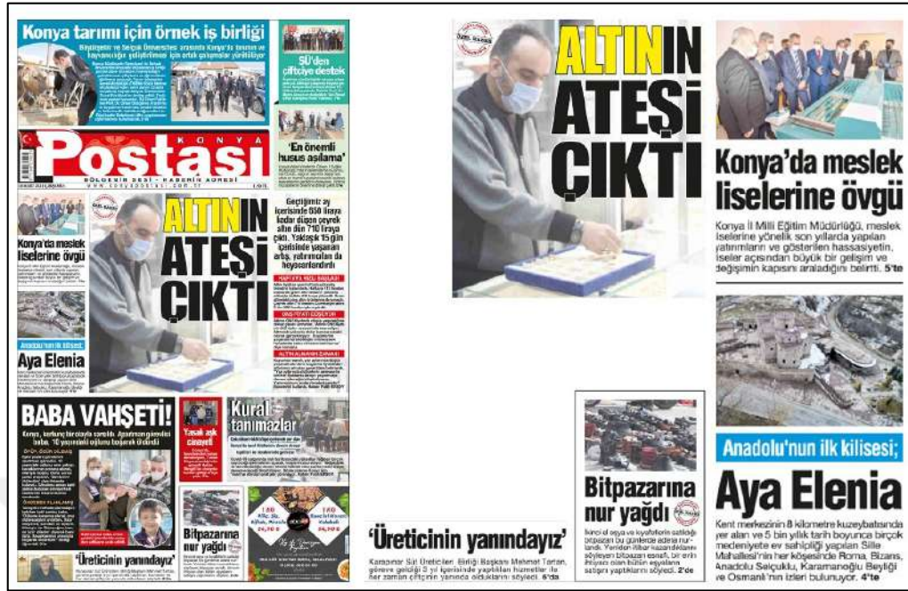
Resim 45: Konya Postası gazetesi 10.03.2021, Tipografik Açıdan Ana ve Ara Başlıkların Kullanımı

Resim 45'te örneklerde görüldüğü üzere Konya Postası gazetesinin 10 Mart 2021 tarihli kapak tasarımındaki ana başlık ve ara başlıkların tipografik kullanım yönünden incelemesi yapılmıştır. Buna göre gazete manşet başlığının büyük puntolarla yazılıp haberin en önemli haber olduğu ortaya çıkartılmış ve manşet başlığının haber alanını genişliğinde olmadığı yanlış bir kullanım hatası olduğu anlaşılmıştır.