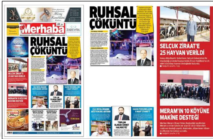
Resim 25: Merhaba gazetesi 10.03.2021, Tipografik Açıdan Ana ve Ara Başlıkların Kullanımı.

Gazete kapak tasarımında ana başlık ve ara haber başlıklarının font seçimi incelenmiş ve başlıklarda kullanılan font karakterlerinin tırnaksız büyük puntolu ve küçük puntolu iki farklı font karakterinden dizildiği görülmüştür.