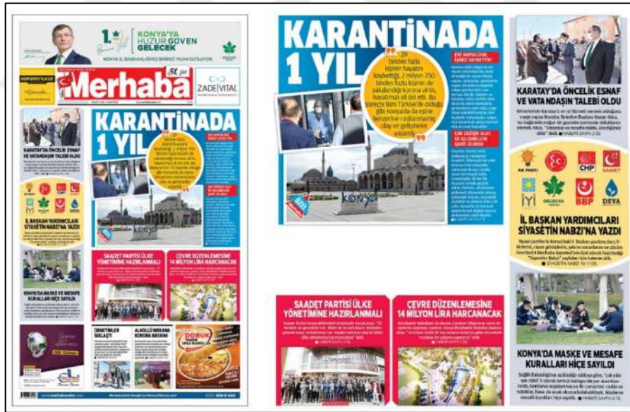
Resim 23: Merhaba gazetesi 08.03.2021, Tipografik Açından Ana ve Ara Başlıkların Kullanımı.

Gazete kapak tasarımında ana başlık ve ara haber başlıklarının font seçimi incelenmiş, başlıklarda kullanılan font karakterlerinin tırnaksız büyük puntolu, küçük puntolu tek bir font karakterinden dizildiği görülmüştür.