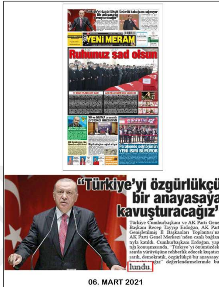
Resim 102: Yeni Meram gazetesi 6 Mart 2021, Dul ve Yetim Sözcük Hatası.