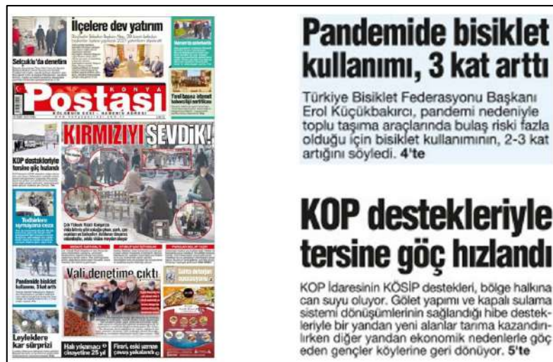
Resim 95: Konya Postası gazetesi 5 Mart 2021, Boşluk Yapısı ve Kullanımı.