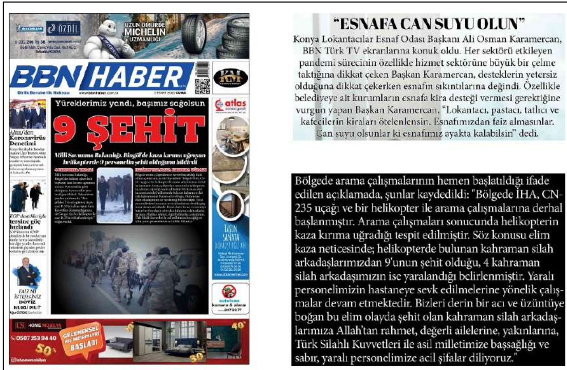
Resim 100: BBN Haber gazetesi 5 Mart 2021, Boşluk Yapısı ve Kullanımı.

BBN Haber gazetesinin 5,6,8,9,10 Mart 2021 ana kapak sayıları boşluk (espas) düzenlemeleri incelenmiş ve inceleme sonucunda metinlerin soldan ve ortadan blok yöntemi tercih edildiği görülmüş olup, bu inceleme sonucunda soldan ve ortadan metinleri bloklama düzeninde herhangi bir espas boşluk hatasına rastlanmamıştır.