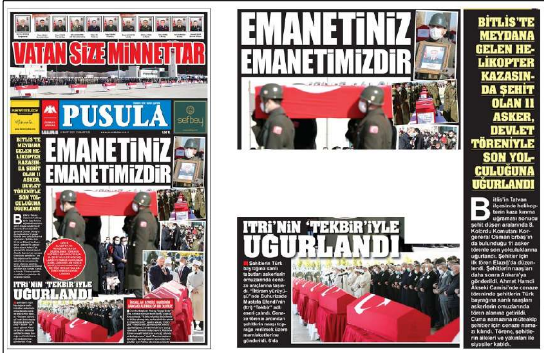
Resim 32: Pusula gazetesi 06.03.2021, Tipografik Açıdan Ana ve Ara Başlıkların Kullanımı.

yapıldığı saptanmış olup, ara haber başlıklarının haber alanına göre düzenlendiği düzgün bir şekilde yerleştirildiği inceleme sonucunda tespit edilmiştir.