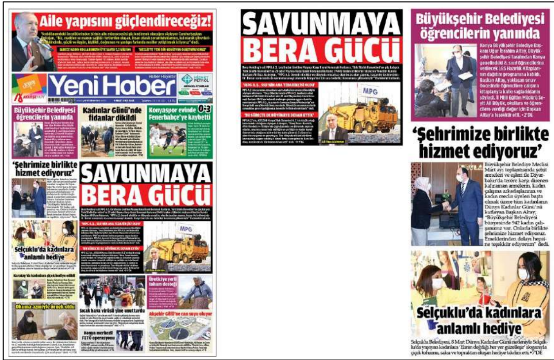
Resim 49: Yeni Haber gazetesi 09.03.2021, Tipografik Açıdan Ana ve Ara Başlıkların Kullanımı.

Resim 49'da örneklerde görüldüğü üzere Yeni Haber gazetesinin 9 Mart 2021 tarihli kapak tasarımındaki ana başlık ve ara başlıkların tipografik kullanım yönünden incelemesi yapılmıştır. Bu doğrultuda gazete manşet başlığının büyük puntolarla yazılıp haberin en önemli haber olduğu ortaya çıkartılmış ve manşet başlığının haber alanını genişliğinde olduğunun tespitine varılmıştır.