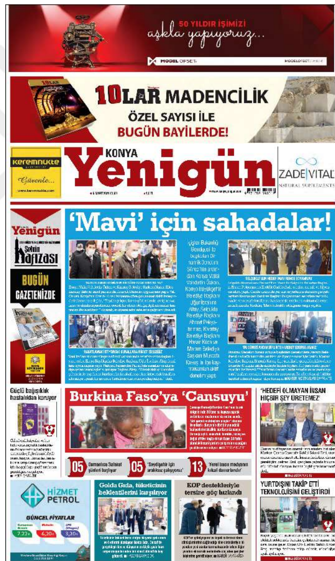
Resim 13: 5.03.2021, Konya Yenigün gazetesi Şerifli, Şerifsiz (tırnaklı-tırnaksız) yazı karakteri kullanımı.