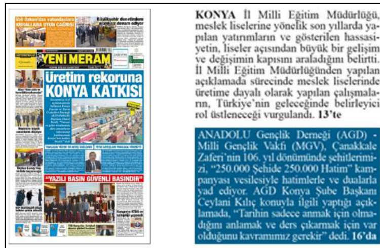
Resim 92: Yeni Meram gazetesi 5 Mart 2021, Boşluk Yapısı ve Kullanımı.