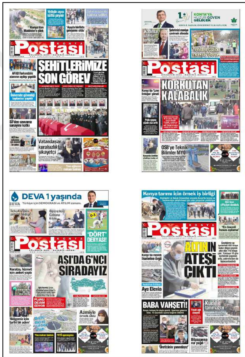
Resim 10: (06.03.2021), (08.03.2021), (09.03.2021), (10.03.2021), Konya Postası gazetesi Şerifli, şerifsiz (tırnaklı-tırnaksız) yazı karakteri kullanımı.

Manşet haber başlığı büyük puntolu tırnaksız büyük harflerden oluşturulmuştur ve ayrıca haber metinlerinde dar sütun kullanıldığının tespiti yapılmıştır.