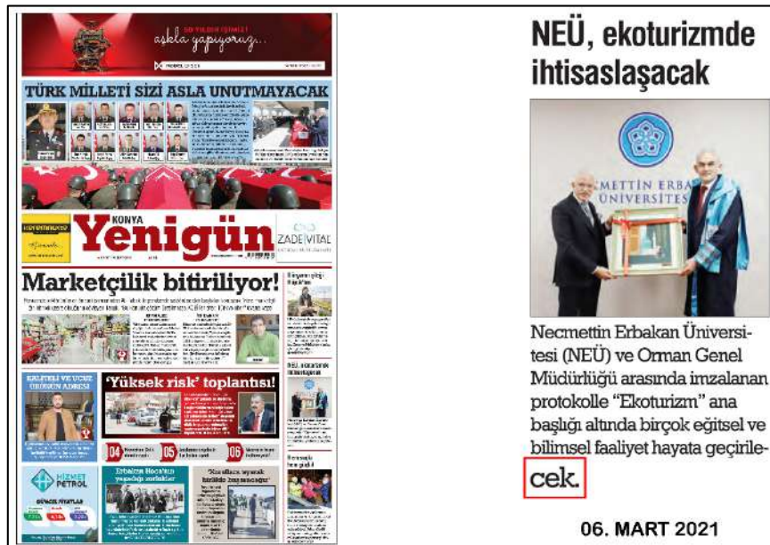
Resim 103: Konya Yenigün gazetesi 6 Mart 2021, Dul ve Yetim Sözcük Hatası.