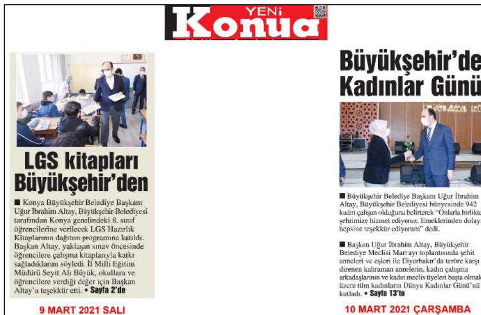
Resim 78: Yeni Konya gazetesi 9,10 Mart 2021, Metin Düzeni ve Sütun Yapısı.

Resim 77'de Yeni Konya gazetesi metin düzeni değerlendirmesinde 5,6,8 Mart 2021 ana kapak sayılarında örneklerde görüldüğü üzere, metinlere soldan bloklama şeklinin uygulandığı görülmektedir.