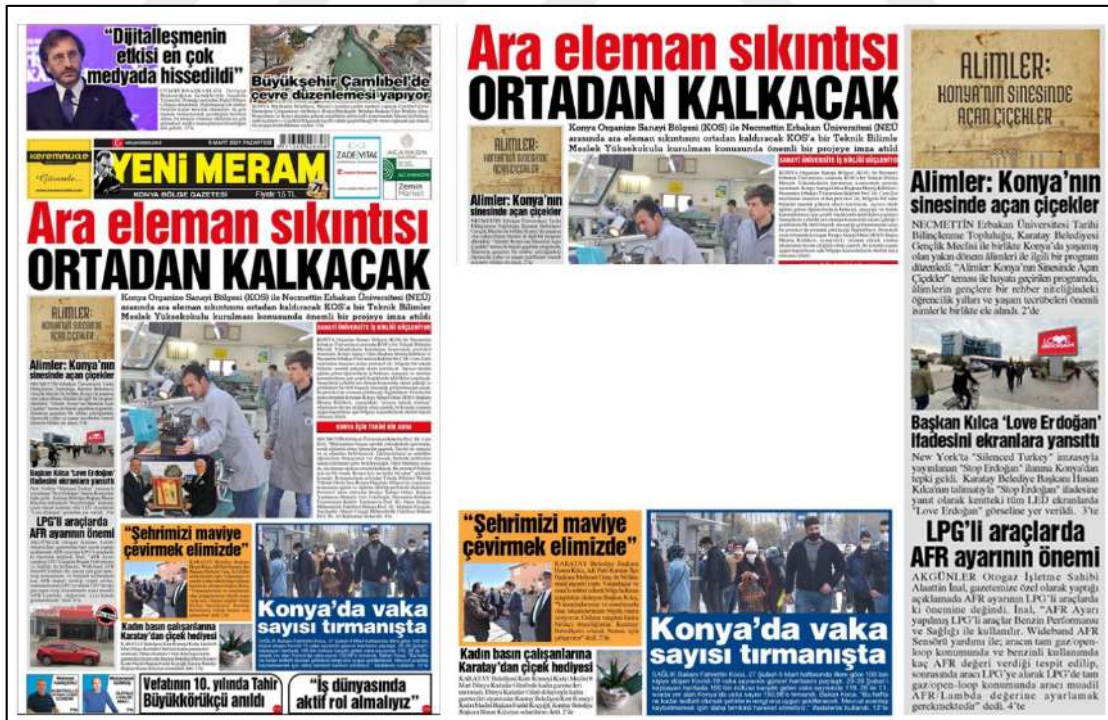
Resim 28: Yeni Meram gazetesi 08.03.2021, Tipografik Açından Ana ve Ara Başlıkların Kullanımı.

Gazete kapak tasarımında ana başlık ve ara haber başlıklarının font seçimi incelenmiş, başlıklarda kullanılan font karakterlerinin tırnaksız büyük puntolu, küçük puntolu iki farklı tırnaksız font karakterinden dizildiği tespit edilmiştir. Ayrıca haber başlıklarının haber alanına göre düzenlendiği düzgün bir şekilde yerleştirildiği inceleme sonucunda tespit edilmiştir