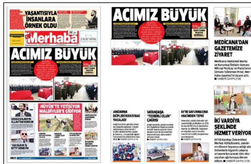
Resim 22: Merhaba gazetesini 06.03.2021, Tipografik Açından Ana ve Ara Başlıkların Kullanımı.

Gazete kapak tasarımında ana başlık ve ara haber başlıklarının font seçimi incelenmiş ve başlıkların kullanılan font karakterlerinin tek bir font karakterinden oluşturulduğunun tespiti yapılmıştır.