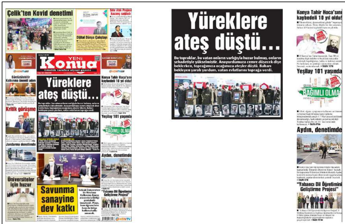
Resim 37: Yeni Konya gazetesi 06.03.2021, Tipografik Açıdan Ana ve Ara Başlıkların Kullanımı.

Ayrıca haber ara başlıkları incelendiğinde alt alta gelen haber başlıklarının punto büyüklüklerinin ve harf kalınlıklarının birbirine yakın olduğunu ve tırnaksız yazı karakteri kullanıldığı, haber önem sırasına göre yerleştirilmediği ve ana başlık ile ara başlıkların tırnaksız aynı font karakterinden oluşturulduğu görülmüştür. Haber başlıklarının haber alanına göre düzenlendiği düzgün bir şekilde yerleştirildiği inceleme sonucunda tespit edilmiştir