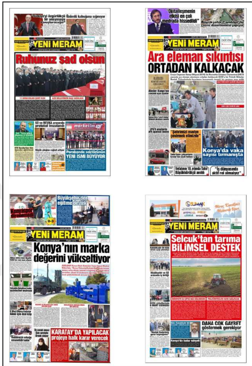
Resim 4: (6.03.2021), (08.03.2021), (09.03.2021), (10.03.2021), Yeni Meram gazetesi Şerifli (tırnaklı) yazı karakteri kullanımı

Resim 4'te Yeni Meram Gazetelerinin 6,8,9,10 Mart 2021 baskılı ana kapak tasarımlarında Resim 3'te olduğu üzere haber metinlerinde tırnaklı font karakteri tercih edilerek okuyucuya daha akıcı okuma imkânı sağlanmıştır ve ayrıca haber başlıkları daha büyük puntolarla yazılıp tırnaksız harf karakterleri kullanılarak haberin okuyucuya aktarılması bakımından vurgu yapılmıştır.