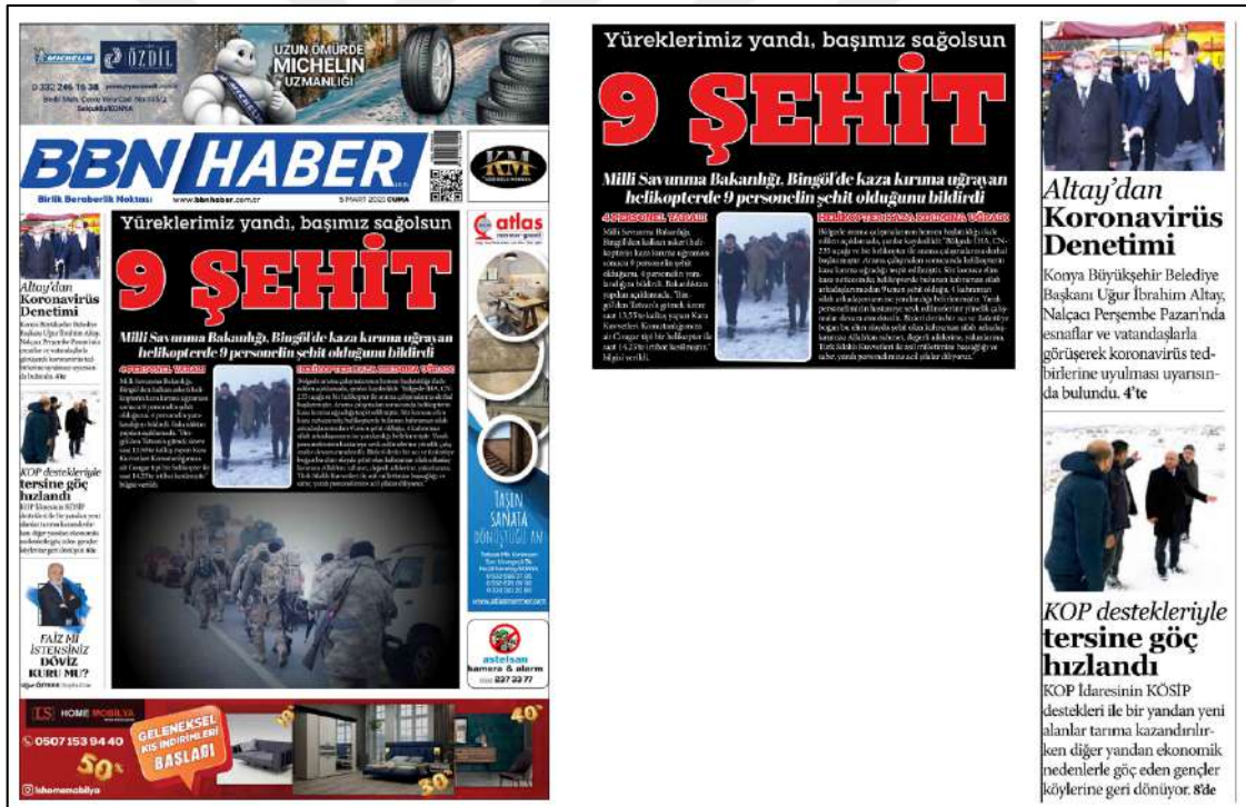
Resim 66: BBN Haber gazetesi 05.03.2021, Tipografik Açından Ana ve Ara Başlıkların Kullanımı.

Resim 66'da örneklerde görüldüğü üzere BBN Haber gazetesinin 5 Mart 2021 tarihli kapak tasarımındaki ana başlık ve ara başlıkların tipografik kullanım yönünden incelemesi yapılmıştır. Bu bağlamda gazete manşet başlığının büyük