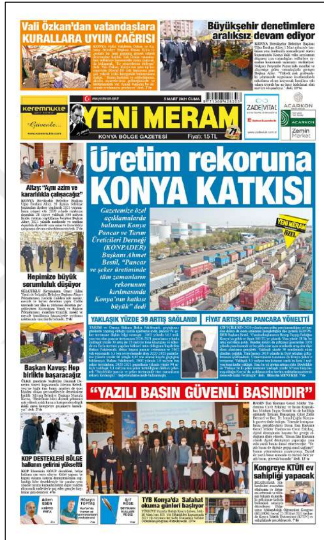
Resim 3: 5.03.2021, Yeni Meram gazetesi Şerifli (tırnaklı) yazı karakteri kullanımı.

Yeni Meram gazetesinin Resim 3'te 5 Mart 2021 tarihli ana kapak tasarımında görüldüğü üzere haber metinlerinde küçük puntolu tırnaklı font karakterleri kullanıldığı tespiti yapılmış olup, haber başlıkları tırnaksız kalın ve büyük font diziliminden oluşturulmuştur. Ayrıca haber metinlerinde dar sütun kullanımı uygulanmıştır.