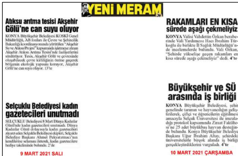
Resim 74: Yeni Meram gazetesi 9,10 Mart 2021, Metin Düzeni ve Sütun Yapısı.

Resim 73'te Yeni Meram gazetesi metin düzeni değerlendirmesinde 5,6,8 Mart 2021 ana kapak sayılarında örneklerde görüldüğü üzere, her iki yana dayalı bloklama şeklinin tercih edildiği görülmektedir.