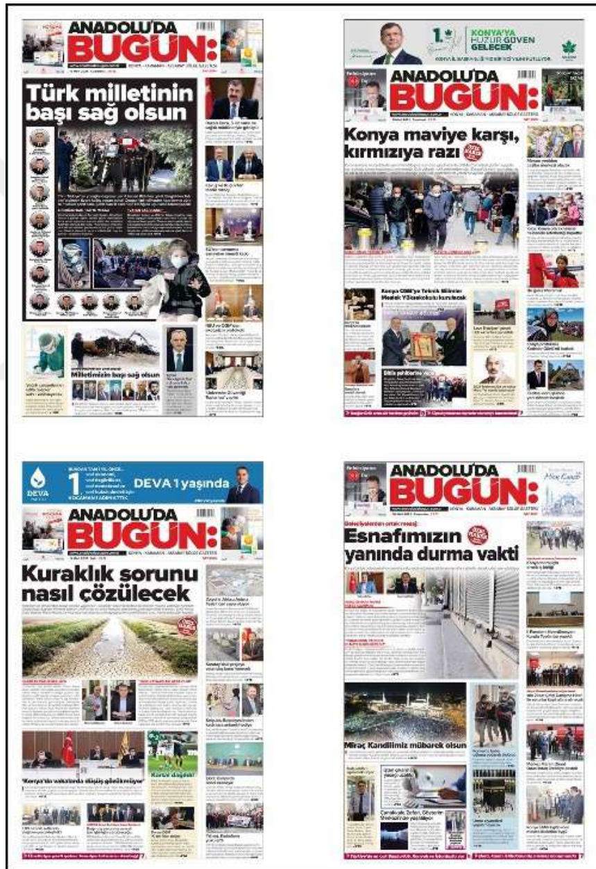
Resim 18: (08.03.2021), (09.03.2021), (10.03.2021), Anadolu'da Bugün gazetesi Şerifsiz (tırnaksız) yazı karakteri kullanımı.

Anadolu'da Bugün gazetesi Resim 17'de 5 Mart 2021 tarihli ana kapak tasarımında inceleme sonucunda tespit edildiği üzere sütunlar arası haber metinlerinde küçük puntolu tırnaksız küçük font karakterleri kullanıldığı görülmüş. Ayrıca haber başlıkları manşet haber başlığı dahil olmak üzere tırnaksız büyük puntolu kalın ve küçük font diziliminden oluştuğu saptanmış olup haber metinlerinde dar sütun uygulaması yapılmıştır.