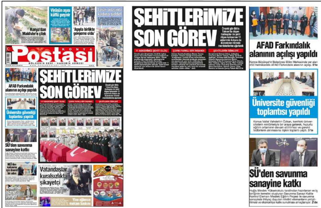
Resim 42: Konya Postası gazetesi 06.03.2021, Tipografik Açıdan Ana ve Ara Başlıkların Kullanımı.

Ayrıca haber ara başlıkları incelendiğinde alt alta gelen haber başlıklarının punto büyüklüklerinin ve harf kalınlıklarının birbirine yakın olduğunu ve tırnaksız yazı karakteri kullanıldığı, haber önem sırasına göre yerleştirilmediği ve ana başlık ile ara başlıkların tırnaksız aynı font karakterinden oluşturulduğu görülmüştür. Haber başlıklarının haber alanına göre bazısının düzenlendiği bazısının ise düzenlenmediği düzgün bir şekilde yerleştirilmediği ayrıca haber metinlerinin de uygunsuz yerleştirildiği inceleme sonucunda gözlemlenmiştir.