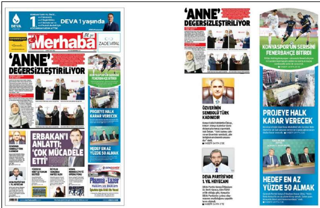
Resim 24: Merhaba gazetesi 09.03.2021, Tipografik Açından Ana ve ara Başlıkların Kullanımı.

Gazete kapak tasarımında ana başlık ve ara haber başlıklarının font seçimi incelenmiştir. Başlıkların kullanılan font karakterlerinin tırnaksız büyük puntolu ve küçük puntolu tek bir font karakterinden dizildiği görülmüştür.