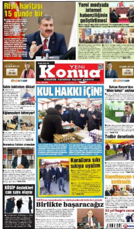
Resim 7: 5.03.2021, Yeni Konya gazetesi Şerifli, Şerifsiz (tırnaklı-tırnaksız) yazı karakteri kullanımı.

Yeni Konya gazetesi 5 Mart 2021 tarihli ana kapak tasarımında Resim 7’de görüldüğü üzere sütunlar arası haber dizilimlerinde tırnaklı ve tırnaksız küçük font