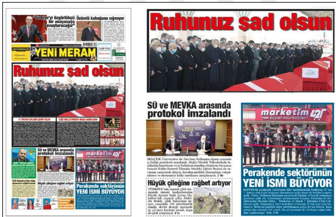
Resim 27: Yeni Meram gazetesi 06.03.2021, Tipografik Açıdan Ana ve Ara Başlıkların Kullanımı.

Gazete kapak tasarımında ana başlık ve ara haber başlıklarının font seçimi incelenmiş ve başlıklarda kullanılan font karakterlerinin tırnaksız büyük puntolu ve küçük puntolu iki ayrı font karakterinden dizildiği görülmüştür. Ara haber başlıklarının bazılarının haber alanına göre düzenlenmediği düzgün bir şekilde yerleştirilmediği inceleme sonucunda görülmüştür.