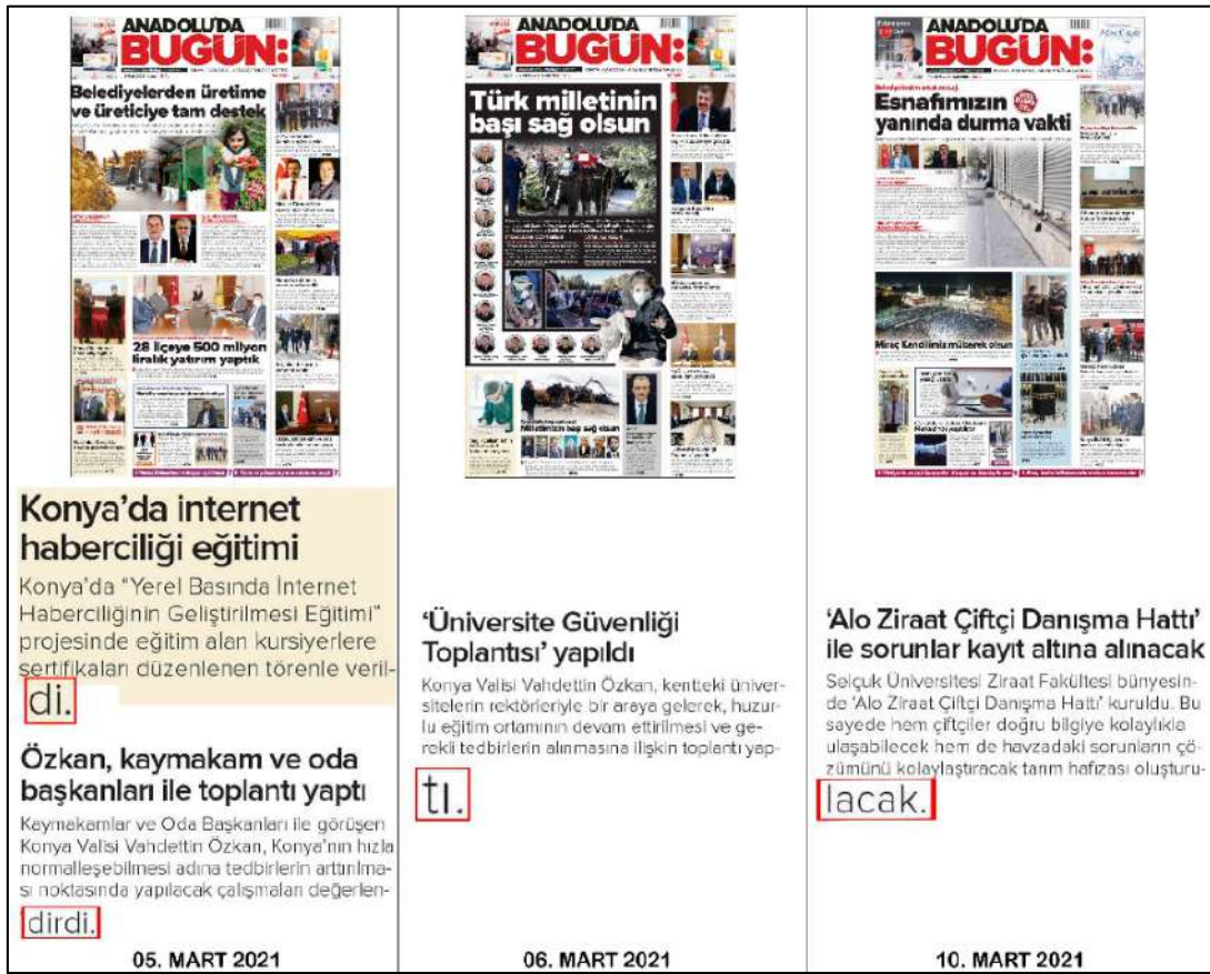
Resim 104: Anadolu'da Bugün gazetesi 5,6,10 Mart 2021, Dul ve Yetim Sözcük Hatası.

İster dijital yayın ister basılı yayınlar olsun, bloklama yapılan haber metinlerinin sonlarında, farkında olarak ya da olmayarak yapılan tipografik dul ve yetim sözcük hataları, (yalnız başına kalan kelimeler) okunan ve okura aktarılmak istenen haberi anlayabilme bakımından okuyucu zihninde sıkıntı oluşturabilmektedir.