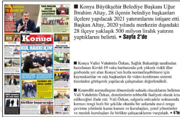
Resim 94: Yeni Konya gazetesi 5 Mart 2021, Boşluk Yapısı ve Kullanımı.

Yeni Konya gazetesinin 5,6,8,9,10 Mart 2021 ana kapak sayıları boşluk (espas) düzenlemeleri incelenmiş ve inceleme sonucunda metinlerin soldan bloklanmasından dolayı espas hatalarının olmadığı tespit edilmiştir. Resim 94'te görüldüğü üzere 5 Mart 2021 örnek olarak konulmuştur diğer 6,8,9,10 Mart 2021 ana kapak sayılarında da espas kullanım hatası olmadığından dolayı örnekleri konulmamıştır.