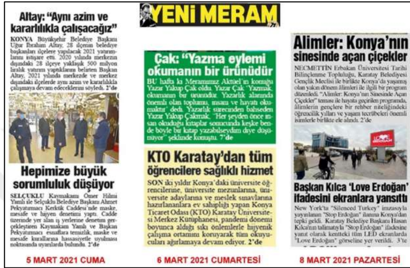
Resim 73: Yeni Meram gazetesi 5,6,8 Mart 2021, Metin Düzeni ve Sütun Yapısı.

Resim 73'te Yeni Meram gazetesi metin düzeni değerlendirmesinde 5,6,8 Mart 2021 ana kapak sayılarında örneklerde görüldüğü üzere, her iki yana dayalı bloklama şeklinin tercih edildiği görülmektedir.