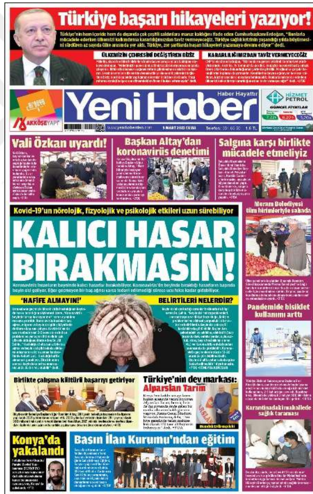
Resim 11: 5.03.2021, Yeni Haber gazetesi Şerifli, Şerifsiz (tırnaklı-tırnaksız) yazı karakteri kullanımı.