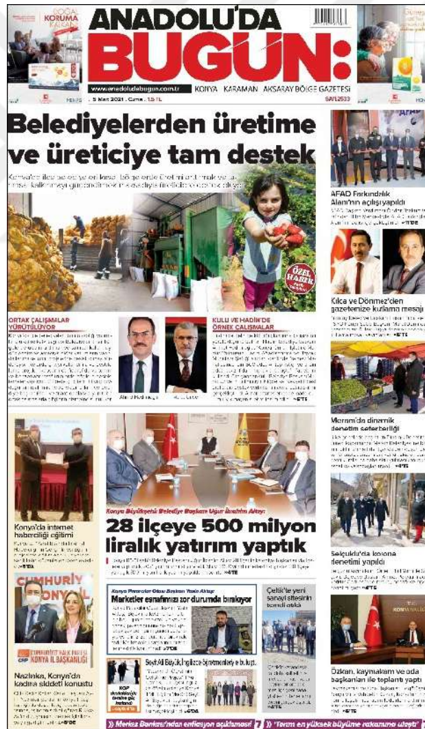
Resim 17: 5.03.2021, Anadolu'da Bugün gazetesi Şerifsiz (tırnaksız) yazı karakteri kullanımı.