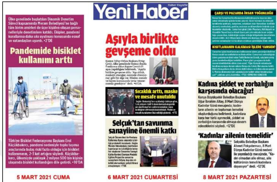
Resim 81: Yeni Haber gazetesi 5,6,8 Mart 2021, Metin Düzeni ve Sütun Yapısı.

Resim 81'de Yeni Haber metin düzeni değerlendirmesinde 5,6,8 Mart 2021 ana kapak sayılarında metinlere soldan bloklama şeklinin uygulandığı görülmektedir.