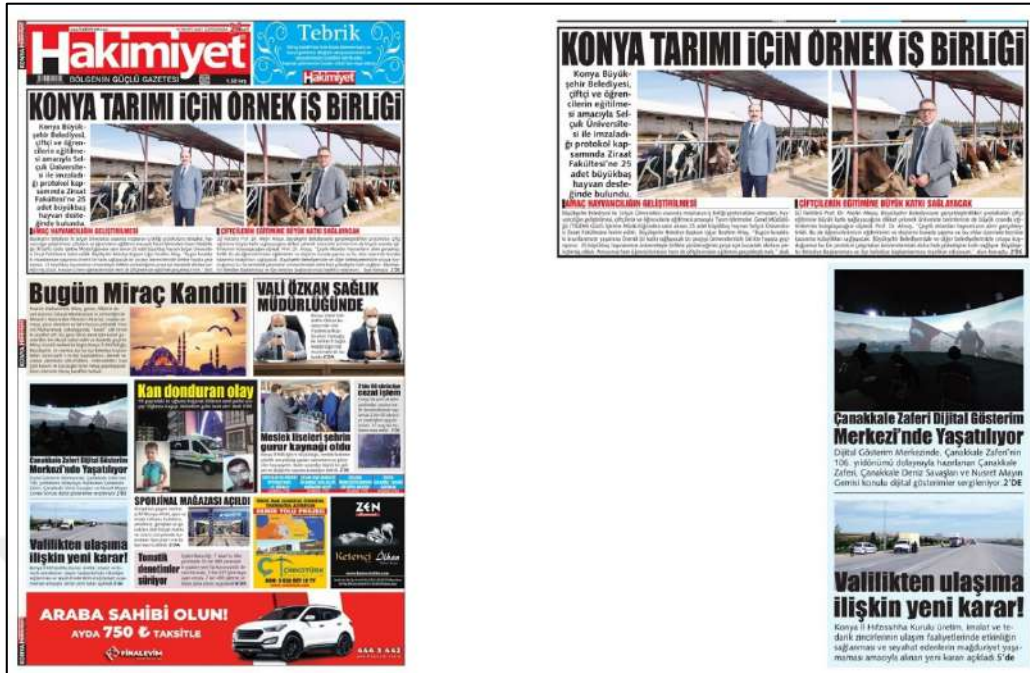
Resim 60: Hakimiyet gazetesinin 10.03.2021, Tipografik Açından Ana ve Ara Başlıkların Kullanımı.

Resim 60'ta örneklerde görüldüğü üzere Hakimiyet gazetesinin 10 Mart 2021 tarihli kapak tasarımındaki ana başlık ve ara başlıkların tipografik kullanım yönünden incelemesi yapılmıştır. Böylece gazete manşet başlığının büyük puntolarla yazılıp haberin en önemli haber olduğu ortaya çıkartılmış ve manşet başlığının haber alanı genişliğinde olduğu görülmüştür.