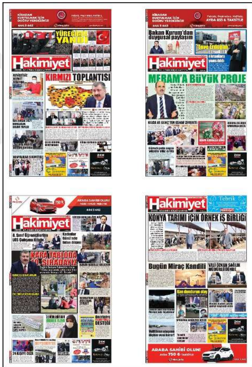
Resim 16: (06.03.2021), (08.03.2021), (09.03.2021), (10.03.2021), Hakimiyet gazetesi Şerifsiz (tırnaksız) yazı karakteri kullanımı.

Manşet haber başlığı büyük puntolu tırnaksız büyük harflerden oluşturulmuştur ve ayrıca haber metinlerinde dar sütun uygulaması yapılmaya çalışılmıştır.