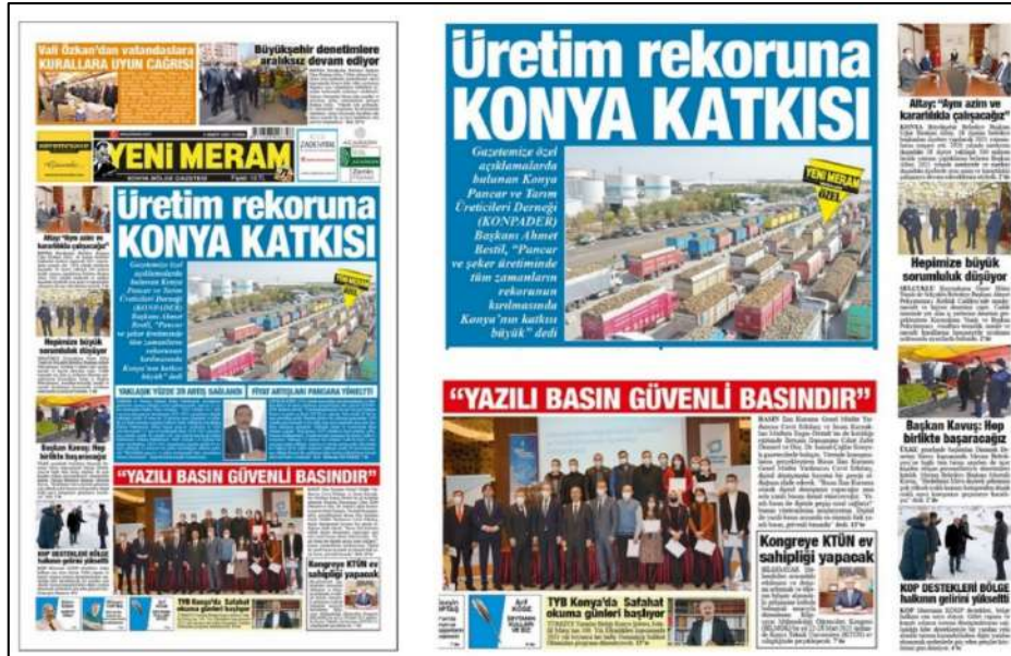
Resim 26: Yeni Meram gazetesi 05.03.2021, Tipografik Açıdan Ana ve Ara Başlıkların Kullanımı.