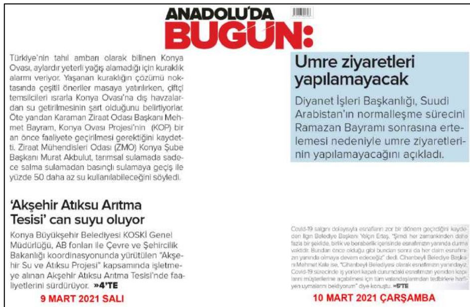
Resim 88: Anadolu'da Bugün gazetesi 9,10 Mart 2021, Metin Düzeni ve Sütun Yapısı.

Resim 87'de Anadolu'da Bugün gazetesi metin düzeni değerlendirmesinde 5,6,8 Mart 2021 ana kapak sayılarında örnekte görüldüğü üzere her iki yana dayalı ve soldan bloklama şeklinin tercih edildiği görülmüştür.