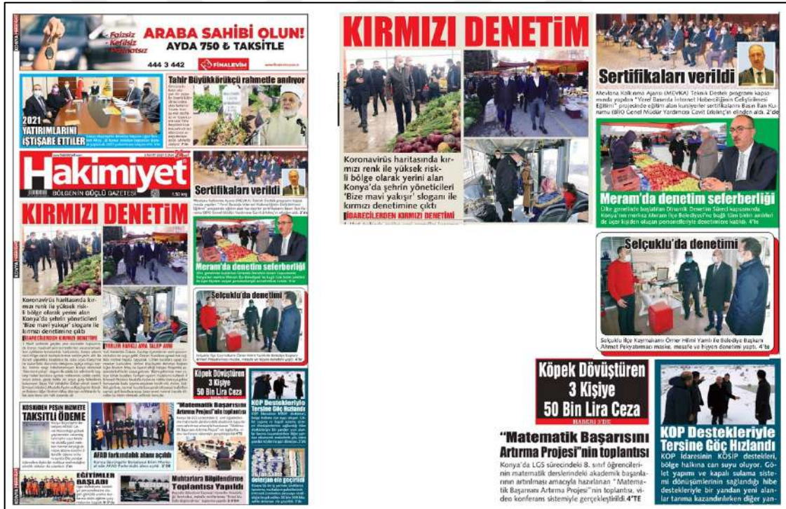
Resim 56: Hakimiyet gazetesi 05.03.2021, Tipografik Açından Ana ve Ara Başlıkların Kullanımı.

Resim 56'da örneklerde görüldüğü üzere Hakimiyet gazetesinin 5 Mart 2021 tarihli kapak tasarımındaki ana başlık ve ara başlıkların tipografik kullanım yönünden incelemesi yapılmıştır. Yapılan incelemede gazete manşet başlığının büyük puntolarla yazılıp haberin en önemli haber olduğu ortaya çıkartılmış ve manşet başlığının haber alanını genişliğinde olduğunun tespitine varılmıştır.