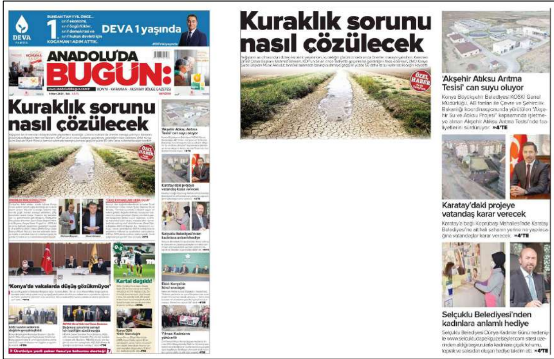
Resim 64: Anadolu'da Bugün gazetesi 09.03.2021, Tipografik Açıdan Ana ve Ara Başlıkların Kullanımı.

haber başlıklarının tırnaksız tek bir font karakterinden oluşturulduğu görülmüş, haber başlıklarının haber alanına düzgün bir şekilde yerleştirilmediği saptanmıştır.