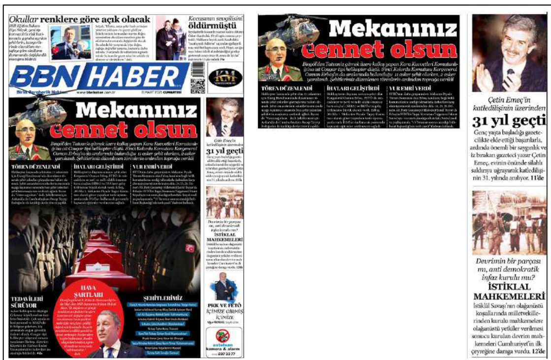
Resim 67: BBN Haber Gazetesi 06.03.2021, Tipografik Açından Ana ve Ara Başlıkların Kullanımı.

Haber ara başlıkları incelendiğinde alt alta gelen haber başlıklarının punto büyüklüklerinin ve harf kalınlıklarının birbirinin aynı olduğu, tırnaklı yazı karakteri kullanıldığı, haber önem sırasına göre yerleştirilmediği, ana başlık ve ara başlıkların tırnaklı iki ayrı font karakterinden oluşturulduğu görülmüş Haber başlıklarının haber alanına düzgün bir şekilde yerleştirildiği tespit edilmiştir