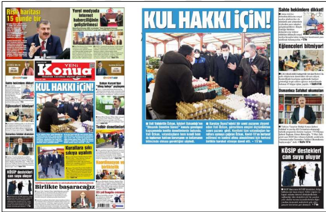
Resim 36: Yeni Konya gazetesi 05.03.2021, Tipografik Açıdan Ana ve Ara Başlıkların Kullanımı.

Resim 36'da örneklerde görüldüğü üzere Yeni Konya gazetesinin 5 Mart 2021 tarihli kapak tasarımındaki ana başlık ve ara başlıkların tipografik kullanım yönünden gözlemlenmiş. Bu bağlamda gazete manşet başlığının büyük puntolarla yazılıp haberin en önemli haber olduğu ortaya çıkartılmış ve manşet başlığının haber alanını genişliğinde olduğunun tespitine varılmıştır.