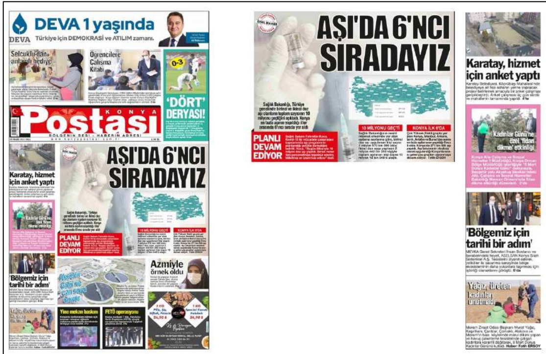
Resim 44: Konya Postası gazetesi 09.03.2021, Tipografik Açından Ana ve Ara Başlıkların Kullanımı.

ana başlık ile ara başlıkların tırnaksız aynı font karakterinden oluşturulduğu görülmüştür. Haber başlıklarının haber alanına göre bazısının düzenlendiği bazısının düzenlenmediği düzgün bir şekilde yerleştirilmediği saptanmıştır.