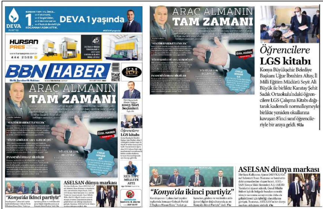
Resim 69: BBN Haber gazetesi 09.03.2021, Tipografik Açından Ana ve Ara Başlıkların Kullanımı.

Resim 69'da örneklerde görüldüğü üzere BBN Haber gazetesinin 9 Mart 2021 tarihli kapak tasarımındaki ana başlık ve ara başlıkların tipografik kullanım yönünden incelemesi yapılmıştır. Bu doğrultuda gazete manşet başlığının büyük puntolarla yazılıp haberin en önemli haber olduğu ortaya çıkartılmış ve manşet başlığının haber alanı genişliğinde olmadığı tespit edilmiştir.