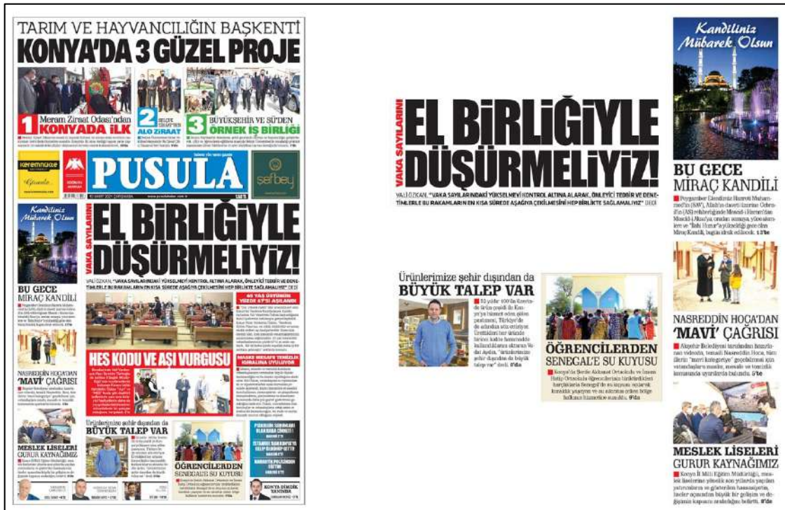
Resim 35: Pusula gazetesi 10.03.2021, Tipografik Açından Ana ve Ara Başlıkların Kullanımı.

Resim 35'te örneklerde görüldüğü üzere Pusula gazetesinin 10 Mart 2021 tarihli kapak tasarımındaki ana başlık ve ara başlıkların tipografik kullanım yönünden incelemesi yapılmıştır. Bu doğrultuda gazete manşet başlığının büyük puntolarla yazılıp haberin en önemli haber olduğu ortaya çıkartılmış ve manşet başlığının haber alanını genişliğinde olduğu gözlemlenmiştir.