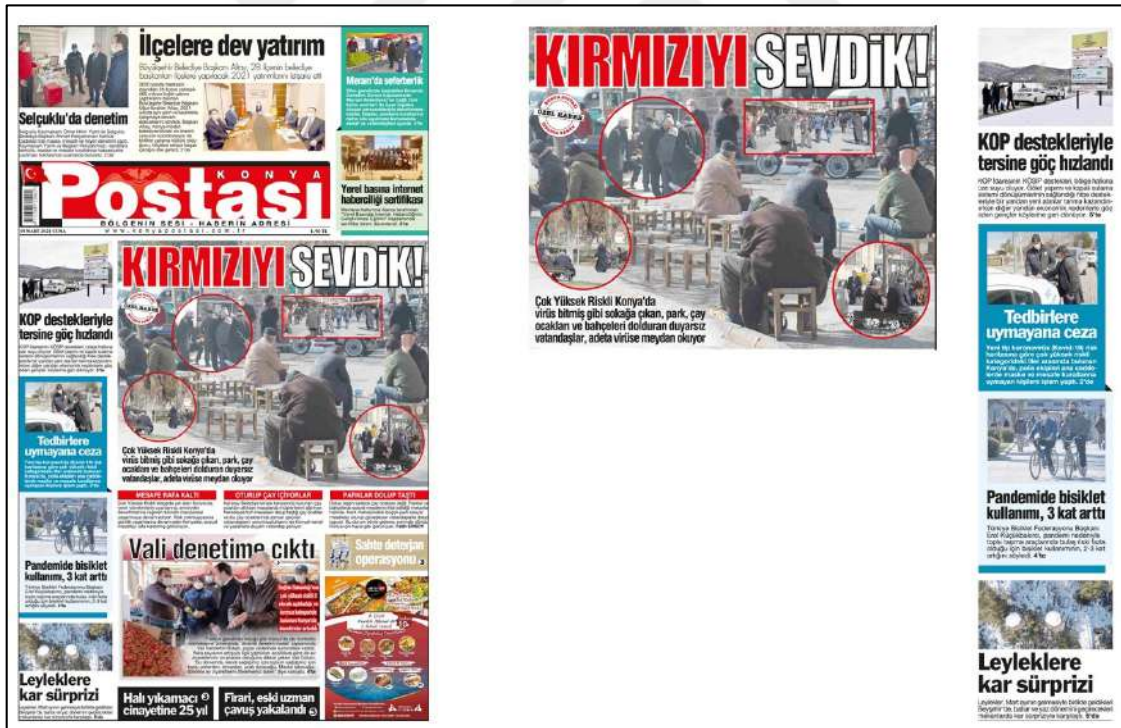
Resim 41: Konya Postası gazetesi 05.03.2021, Tipografik Açından Ana ve Ara Başlıkların Kullanımı.

Resim 41'de örneklerde görüldüğü üzere Konya Postası gazetesinin 5 Mart 2021 tarihli kapak tasarımındaki ana başlık ve ara başlıkların tipografik kullanım