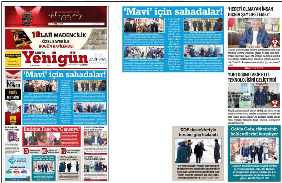
Resim 51: Konya Yenigün gazetesi 05.03.2021, Tipografik Açından Ana ve Ara Başlıkların Kullanımı.

Resim 51’de örneklerde görüldüğü üzere Konya Yenigün gazetesinin 5 Mart 2021 tarihli kapak tasarımındaki ana başlık ve ara başlıkların tipografik kullanım