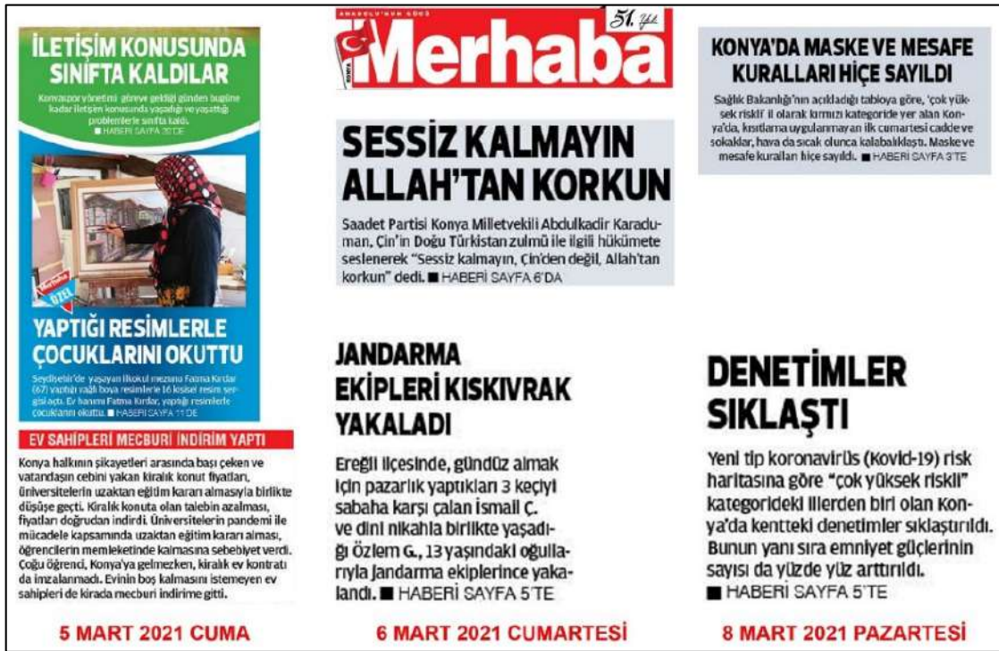
Resim 71: Merhaba gazetesi 5,6,8 Mart 2021, Metin Düzeni ve Sütun Yapısı.

Resim 71'de Merhaba gazetesi metin düzeni değerlendirmesinde 5 Mart 2021 ana kapak sayısında görüldüğü üzere ortadan blok, her iki yana dayalı ve soldan bloklanmış olduğu görülmektedir. Gazete'nin 6,8 Mart 2021 tarihli ana kapak sayılarında bloklama şeklinin her iki yana yaslı ve soldan bloklanmış olduğu tespit edilmiştir.