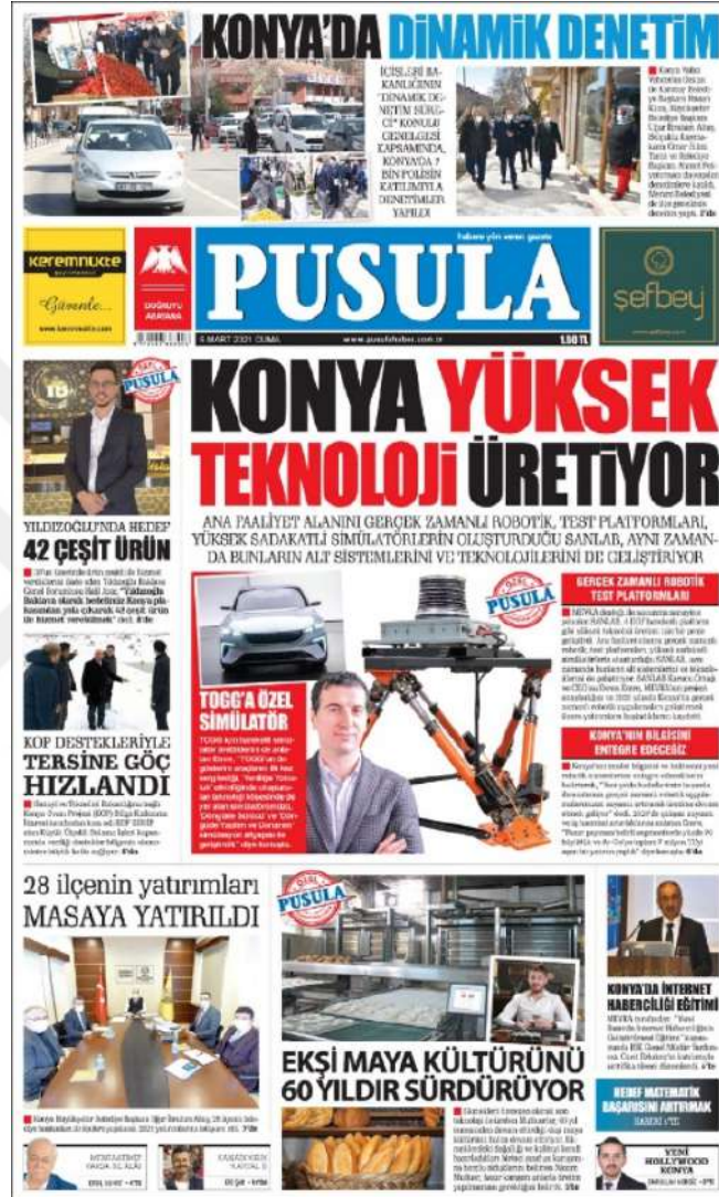
Resim 5: 5.03.2021, Pusula gazetesi Şerifli (tırnaklı) yazı karakteri kullanımı.

Pusula gazetesinin 5 Mart.2021 tarihli ana kapak tasarımında, Resim 5'te görüldüğü üzere sütun haber metinlerinde tırnaklı font dizilimi kullanıldığı ve haber başlıklarının büyük puntolarla okuyucuya aktarıldığı görülmekle birlikte, haber başlık kullanımının da font seçiminin tırnaklı ve tırnaksız büyük yazı karakterleri