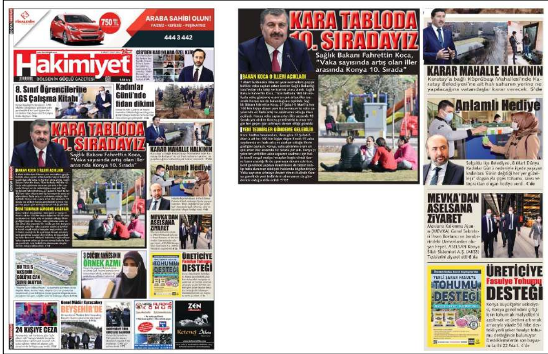
Resim 59: Hakimiyet gazetesi 09.03.2021, Tipografik Açıdan Ana ve ara Başlıkların Kullanımı

oluşturulduğu tespit edilmiştir. Haber başlıklarının haber alanına düzgün bir şekilde yerleştirildiği görülmüştür.