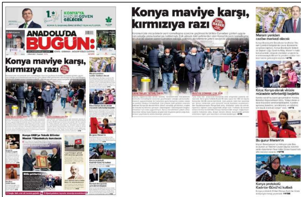
Resim 63: Anadolu'da Bugün gazetesi 08.03.2021, Tipografik Açıdan Ana ve Ara Başlıkların Kullanımı.

Haber ara başlıkları incelendiğinde alt alta gelen haber başlıklarının punto büyüklüklerinin ve harf kalınlıklarının birbirinin aynısı olduğu, tırnaksız yazı karakteri kullanıldığı, haber önem sırasına göre yerleştirilmediği, ana başlık ve ara haber başlıkların tırnaksız tekbir font karakterinden oluşturulduğu görülmüş Haber başlıklarının haber alanına düzgün bir şekilde yerleştirilmediği tespit edilmiştir.