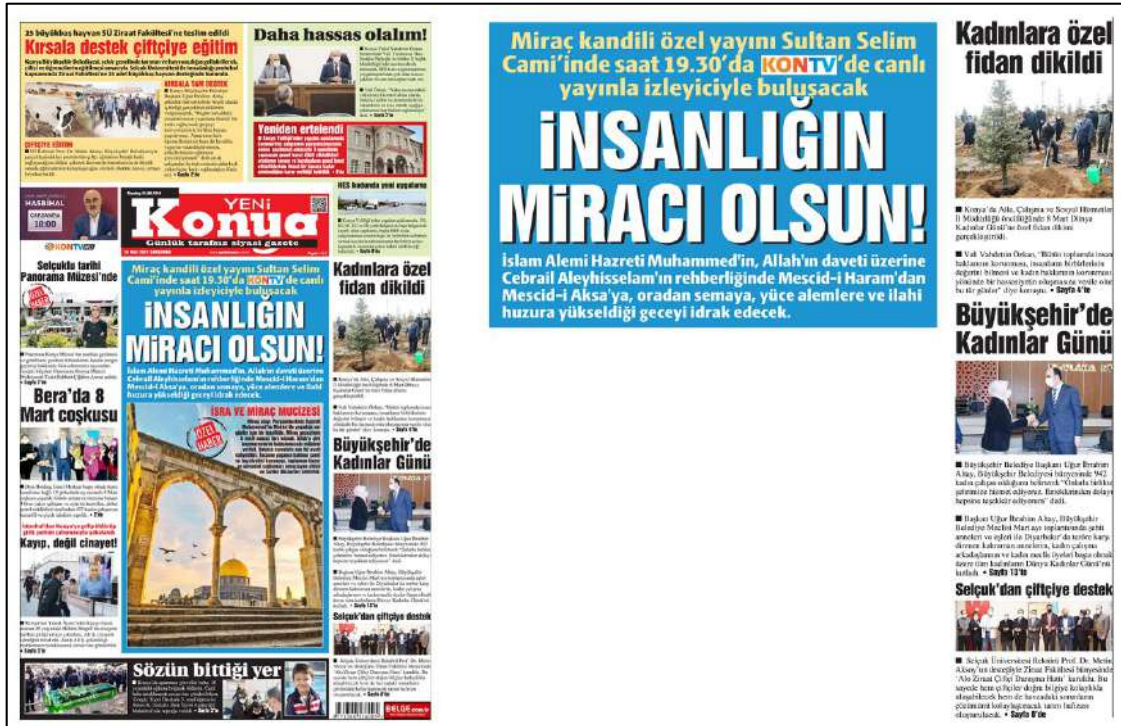
Resim 40: Yeni Konya gazetesi 10.03.2021, Tipografik Açından Ana ve Ara Başlıkların Kullanımı.

Resim 40'ta örneklerde görüldüğü üzere Yeni Konya gazetesinin 10 Mart 2021 tarihli kapak tasarımındaki ana başlık ve ara başlıkların tipografik kullanım yönünden incelemesi yapılmıştır. Bu bağlamda gazete manşet başlığının büyük puntolarla yazılıp haberin en önemli haber olduğu ortaya çıkartılmış ve manşet başlığının haber alanını genişliğinde olduğunun tespitine varılmıştır.