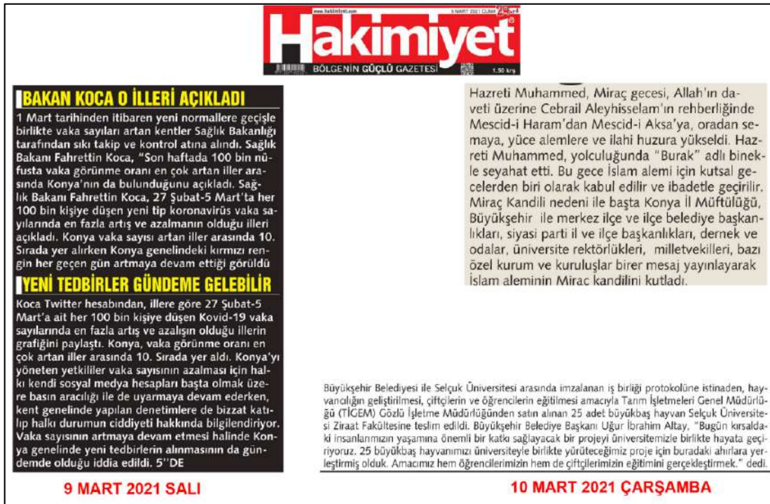
Resim 86: Hakimiyyet gazetesi 9,10 Mart 2021, Metin Düzeni ve Sütun Yapısı.

Resim 86'da Hakimiyyet gazetesi metin düzeni değerlendirmesinde 9 Mart 2021 ana kapak sayısında örnekte görüldüğü üzere metinlere soldan bloklama şekli uygulanırken; 10 Mart 2021 kapak sayısında her iki yana dayalı ve soldan bloklama şeklinin tercih edildiği görülmektedir.