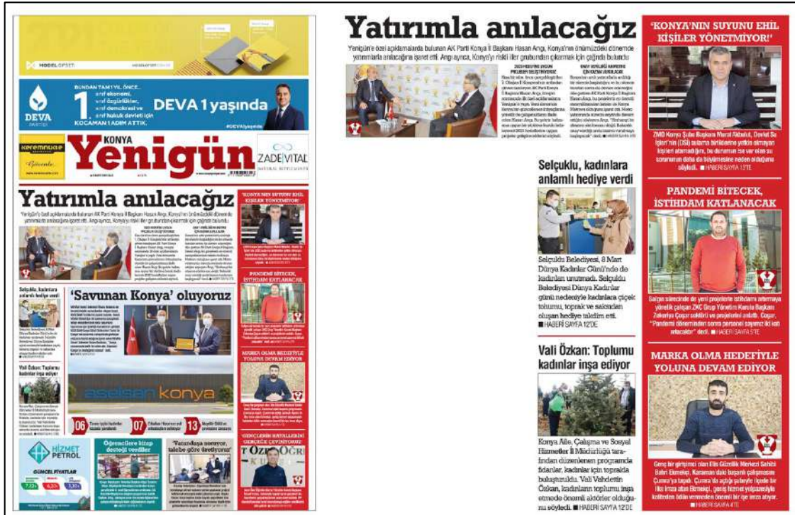
Resim 54: Konya Yenigün gazetesi 09.03.2021, Tipografik Açından Ana ve Ara Başlıkların Kullanımı.

tırnaklı font karakterinden oluşturulurken ara başlıkların tırnaklı ve tırnaksız font karakterinden oluşturulduğu görülmüştür. Haber başlıklarının haber alanına göre düzenlenmediği düzgün bir şekilde yerleştirilmediği tespitine varılmıştır.