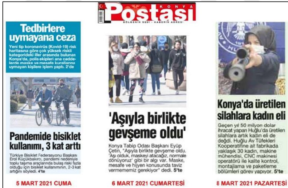
Resim 79: Konya Postası gazetesi 5,6,8 Mart 2021, Metin Düzeni ve Sütun Yapısı.

Resim 79’da Yeni Konya gazetesi metin düzeni değerlendirmesinde 5,6,8 Mart 2021 ana kapak sayılarında örneklerde görüldüğü üzere, metinlere soldan bloklama şeklinin uygulandığı görülmektedir.