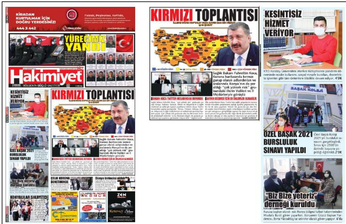
Resim 57: Hakimiyet gazetesini 06.03.2021, Tipografik Açıdan Ana ve Ara Başlıkların Kullanımı

Ana başlık ve ara haber başlıkların tırnaksız tek bir font karakterinden oluşturulduğu görülmüştür. Haber başlıklarının bazılarının haber alanına göre düzenlenmediği, bazılarının ise haber alanına düzgün bir şekilde yerleştirildiğinin tespiti yapılmıştır.