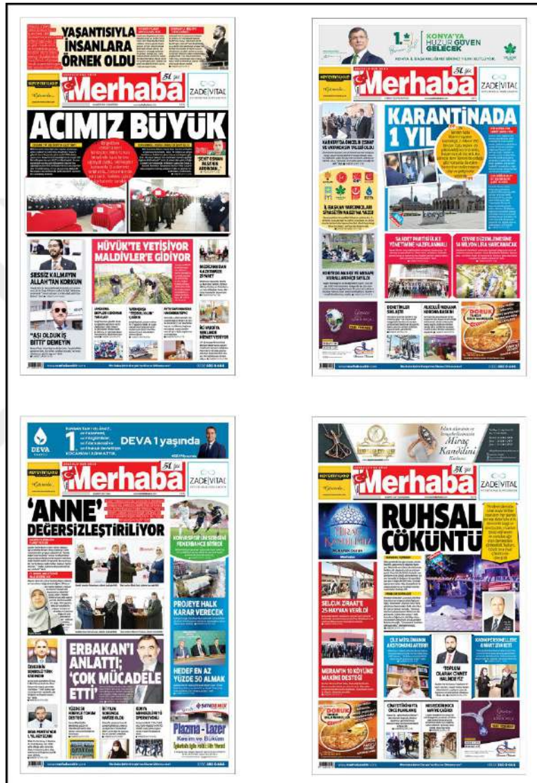
Resim 2: (06.03.2021), (08.03.2021), (08.09.2021), (10.03.2021), Merhaba gazetesi Şerifsiz (tırnaksız) yazı karakteri kullanımı.

sütunlarda küçük harf dizilimlerinde tırnaklı yazı karakteri kullanmak okunurluğu ve akıcılığı daha rahat sağladı araştırmalar sonucunda kanıtlanmıştır. Ayrıca haber başlıklarında tırnaksız yazı karakterini daha büyük puntolu ve kalın kullanarak tipografik vurgu oluşturulmaya çalışılmıştır.