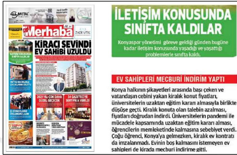
Resim 91: Merhaba gazetesi 5 Mart 2021, Boşluk Yapısı ve Kullanımı.

Merhaba gazetesinin 5,6,8,9,10 Mart 2021 ana kapak sayıları boşluk (espas) düzenlemeleri incelenmiş ve inceleme sonucunda metinlerin genelde soldan ve ortadan bloklanmasından dolayı espas hatalarının olmadığı tespit edilmiştir. Resim 90'da görüldüğü üzere 5 Mart 2021 ana kapak sayısı sadece örnek olarak konulmuştur diğer 6,8,9,10 Mart 2021 ana kapak sayılarında da espas kullanım hatası olmadığından sebep örnekleri konulmamıştır.