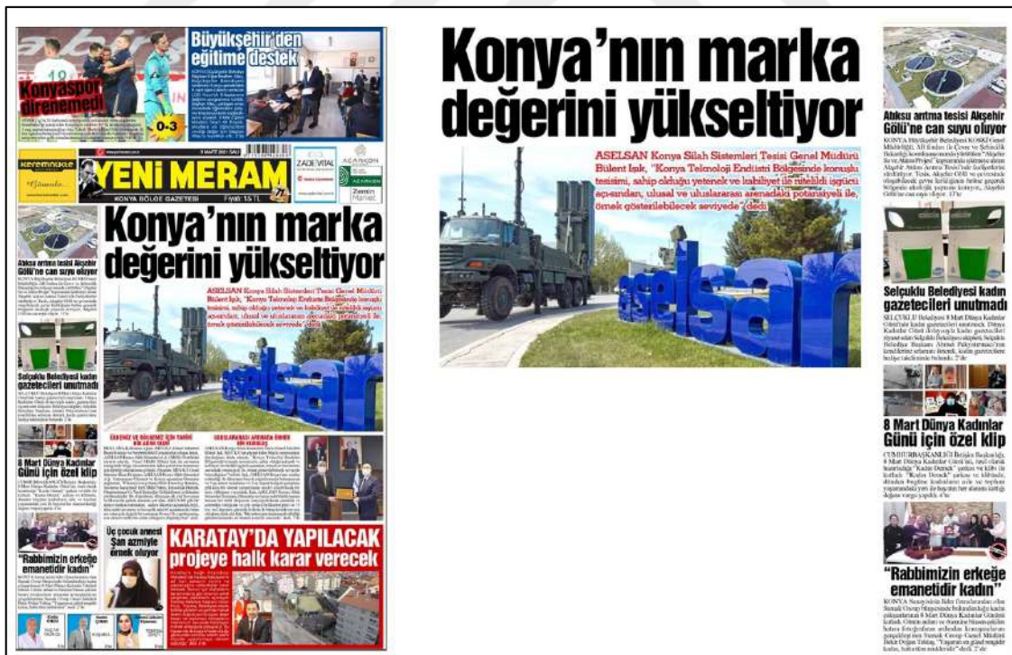
Resim 29: Yeni Meram gazetesi 09.03.2021, Tipografik Açıdan Ana ve Ara Başlıkların Kullanımı.