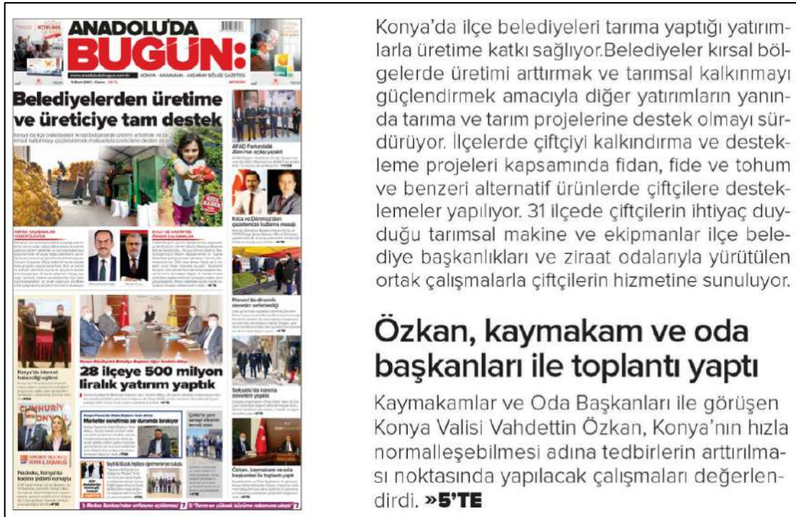
Resim 99: Anadolu'da Bugün gazetesi 5 Mart 2021, Boşluk Yapısı ve Kullanımı.

Anadolu'da Bugün gazetesinin 5,6,8,9,10 Mart 2021 ana kapak sayılarındaki metinlerin boşluk (espas) düzenlemeleri incelenmiş ve inceleme sonucunda metinlerin soldan ve her iki yana yaslı bloklama yönteminin kullanıldığı görülmüştür. Bu inceleme sonucunda soldan ve her iki yana yaslı metinleri bloklama düzeninde herhangi bir espas boşluk hatasına rastlanmamıştır.