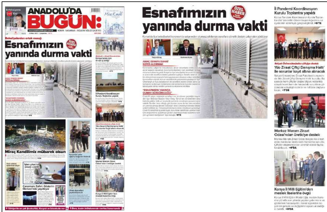
Resim 65: Anadolu'da Bugün gazetesi 10.03.2021, Tipografik Açıdan Ana ve Ara Başlıkların Kullanımı.

Resim 65'te örneklerde görüldüğü üzere Anadolu'da Bugün gazetesinin 10 Mart 2021 tarihli kapak tasarımındaki ana başlık ve ara başlıkların tipografik kullanım yönünden incelemesi yapılmıştır. Bun doğrultuda manşet başlığının büyük puntolarla yazılıp haberin en önemli haber olduğu ortaya çıkartılmış ve manşet başlığının haber alanı genişliğinde olduğu tespit edilmiştir.