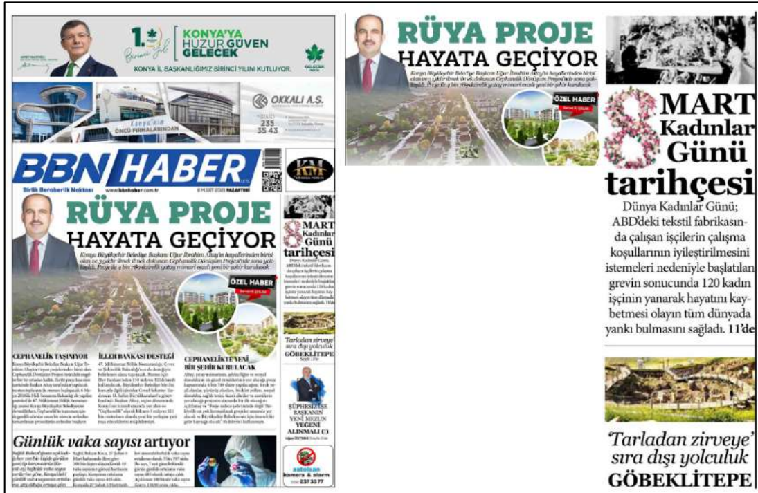
Resim 68: BBN Haber gazetesi 08.03.2021, Tipografik Açıdan Ana ve Ara Başlıkların Kullanımı.

kullanıldığı, haber önem sırasına göre yerleştirilmediği, ana başlık ve ara haber başlıklarının tırnaklı iki farklı font karakterinden oluşturulduğu görülmüş Haber başlıklarının haber alanına düzgün bir şekilde yerleştirilmediği görülmüştür.