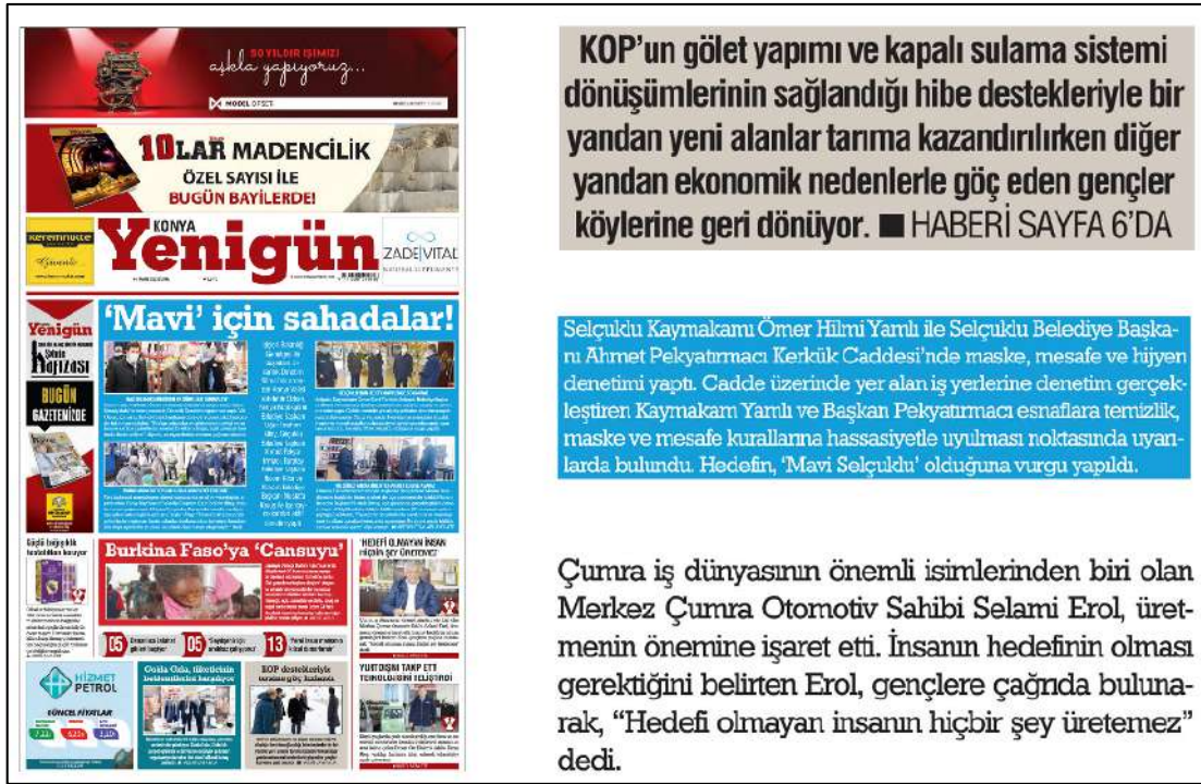
Resim 97: Konya Yenigün gazetesi 5 Mart 2021, Boşluk Yapısı ve Kullanımı.

Yeni Haber gazetesinin 5,6,8,9,10 Mart 2021 ana kapak sayıları boşluk (espas) düzenlemeleri incelenmiş ve inceleme sonucunda metinlerin soldan, ortadan ve her iki yana yaslı bloklanmış olduğu görülmüştür. Bu inceleme sonucunda soldan, ortadan ve her iki yana yaslı metinleri bloklama düzeninde herhangi bir espas boşluk hatasına rastlanmamıştır.