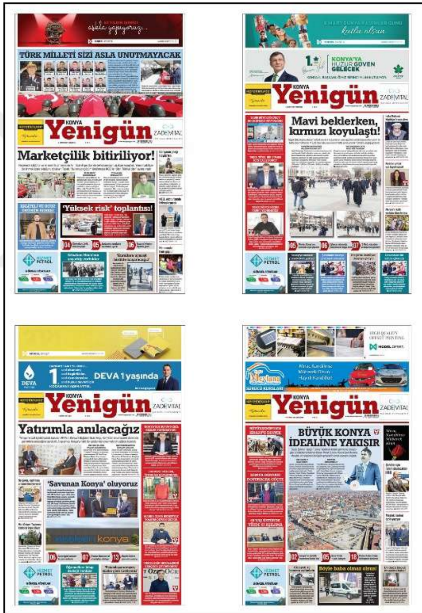
Resim 14: (6.03.2021), (08.03.2021), (09.03.2021), (10.03.2021), Konya Yenigün gazetesi Şerifli, Şerifsiz (tırnaklı-tırnaksız) yazı karakteri kullanımı.

Konya Yenigün gazetesi 5 Mart 2021 tarihli kapak tasarımı haber dizilimlerinde tırnaklı ve tırnaksız küçük harf kullanımının tercih edildiği ve haber başlık kullanımların da tırnaklı-tırnaksız büyük puntolu küçük harf kullanımı tercih edildiği saptanmakla beraber, bazı haber başlıklarında tırnaksız büyük harf uygulamasına rastlanmıştır. Haber metin sütunlarının dar kullanılmaya çalışıldığı gözlemlenmiştir.