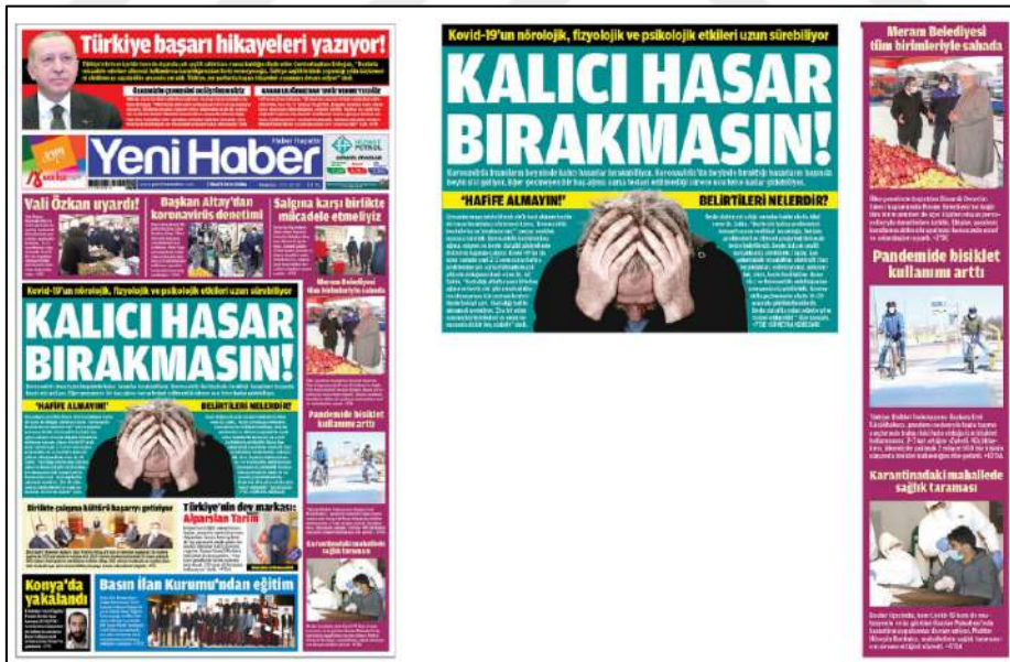
Resim 46: Yeni Haber gazetesi 05.03.2021, Tipografik Açından Ana ve Ara Başlıkların Kullanımı

Resim 46'da örneklerde görüldüğü üzere Yeni Haber gazetesinin 5 Mart 2021 tarihli kapak tasarımındaki ana başlık ve ara başlıkların tipografik kullanım yönünden incelenmesi yapılmıştır. Bu doğrultuda gazete manşet başlığının büyük