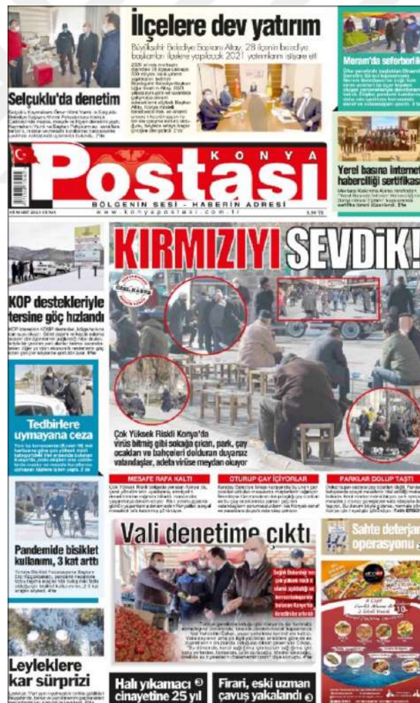
Resim 9: 5.03.2021, Konya postası gazetesi Şerifsiz (tırnaksız) yazı karakteri kullanımı.