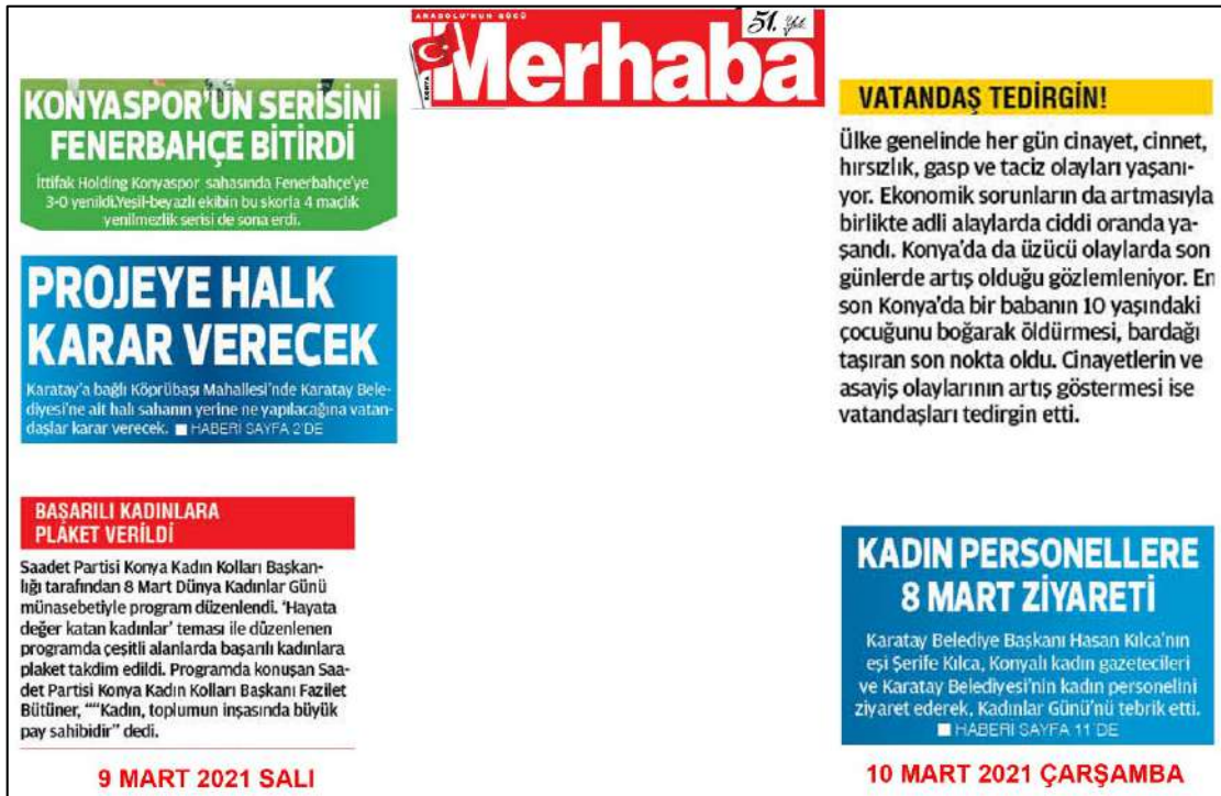
Resim 72: Merhaba gazetesi 9,10 Mart 2021, Metin Düzeni ve Sütun.

Resim 72’de Merhaba gazetesi metin düzeni değerlendirmesinde 9 Mart 2021 ana kapak sayısında örnekte görüldüğü üzere metinler ortadan blok, her iki yana dayalı ve soldan bloklanmış olduğu görülmektedir. Gazete’nin 10 Mart 2021 tarihli ana kapak sayılarında biloklama şeklinin ortadan blok ve soldan bloklanmış olduğu tespit edilmiştir.