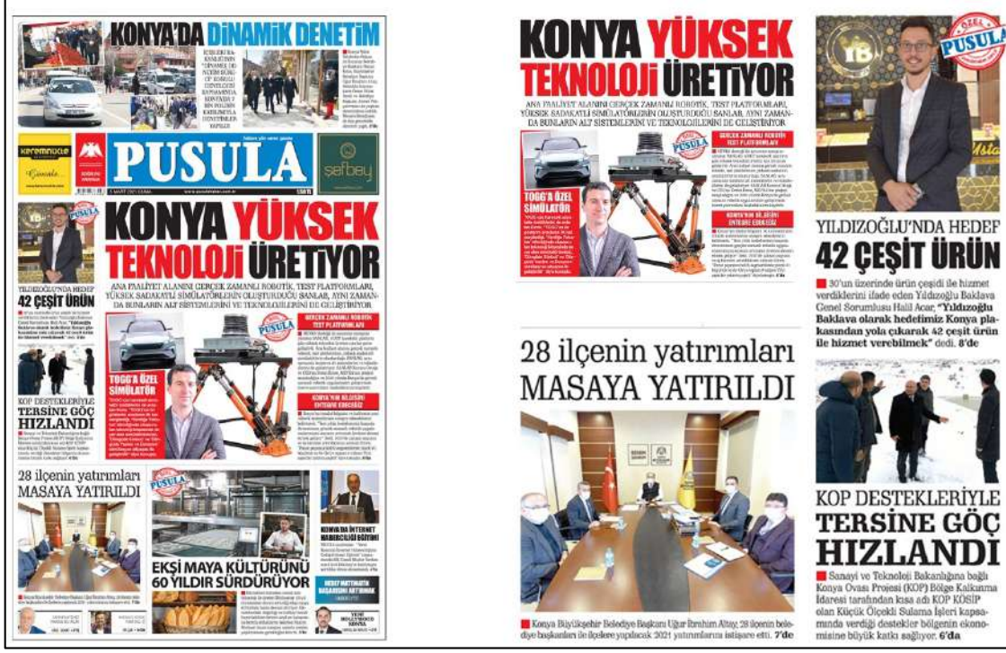
Resim 31: Pusula gazetesi 05.03.2021, Tipografik Açıdan Ana ve Ara Başlıkların Kullanımı.

Resim 31’de örneklerde görüldüğü üzere Pusula gazetesinin 5 Mart 2021 tarihli kapak tasarımındaki ana başlık ve ara başlıkların tipografik kullanım yönünden incelemesi yapılmıştır. Bu bağlamda gazete manşet başlığının büyük puntolarla yazılıp haberin en önemli haber olduğu ortaya çıkartılmış ve manşet başlığının haber alanını genişliğinde olduğunun tespitine varılmıştır.