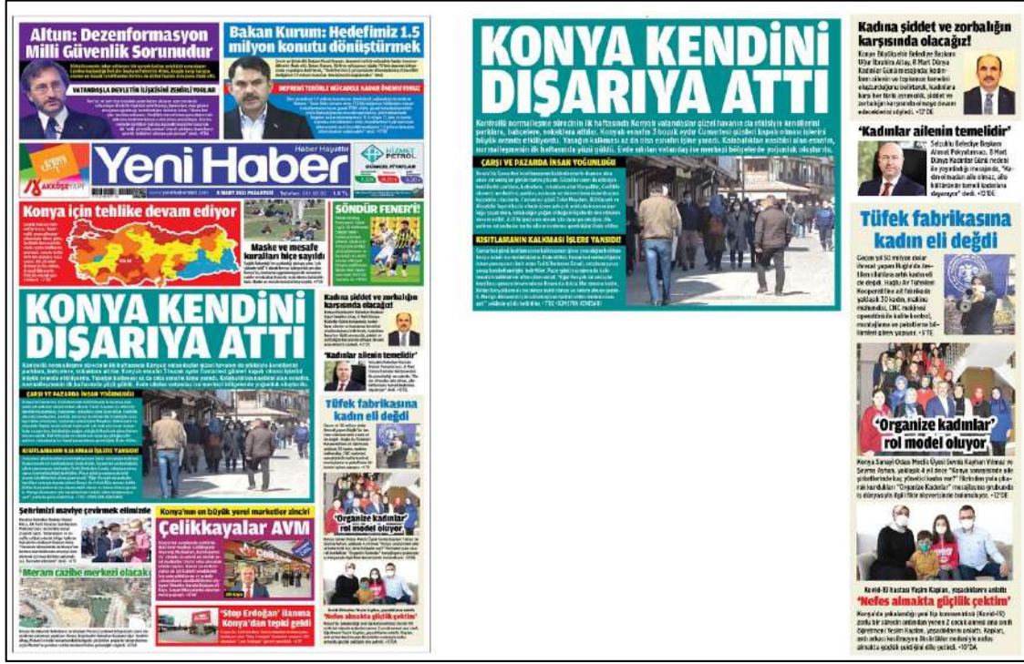
Resim 48: Yeni Haber gazetesi 08.03.2021, Tipografik Açından Ana ve Ara Başlıkların Kullanımı.

tırnaksız yazı karakteri kullanıldığı, haber önem sırasına göre yerleştirilmediği ve ana başlık ile ara başlıkların tırnaksız aynı font karakterinden oluşturulduğu görülmüştür. Haber başlıklarının haber alanına göre düzenlendiği düzgün bir şekilde yerleştirildiği saptanmıştır.