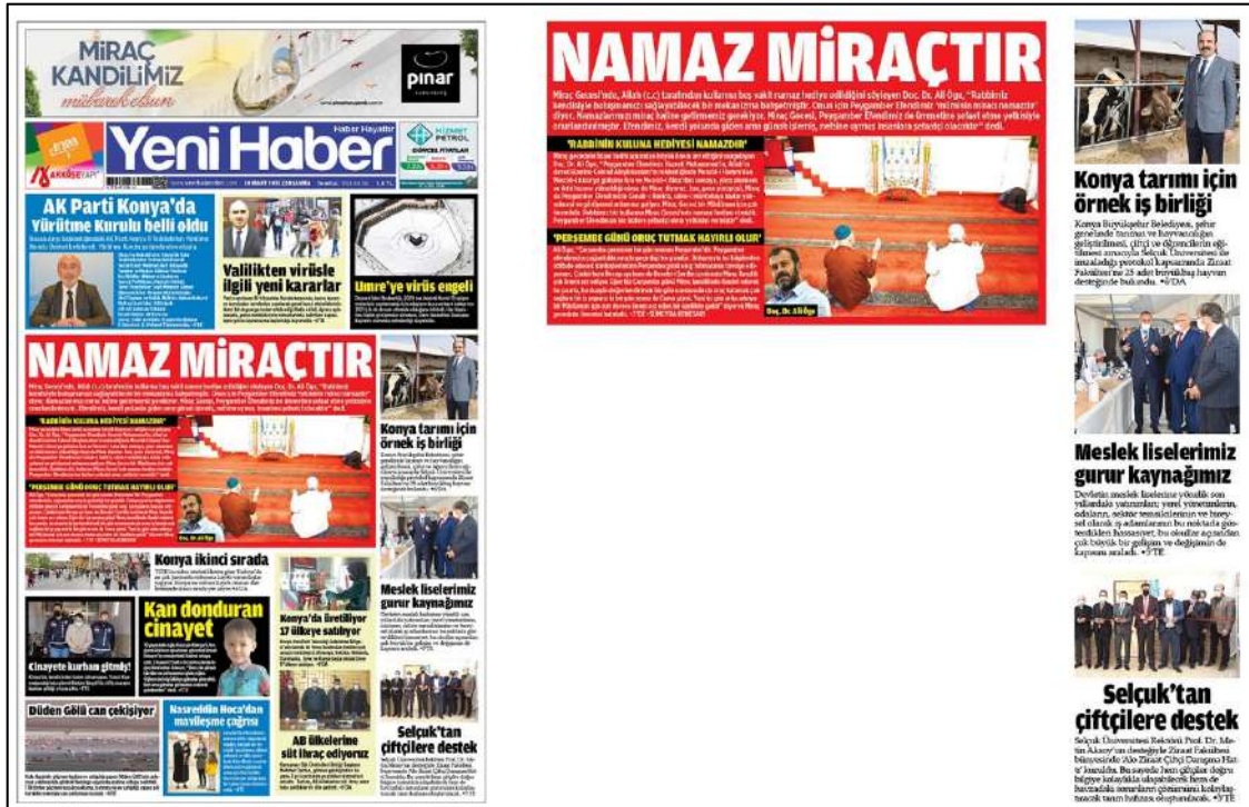
Resim 50: Yeni Haber gazetesi 10.03.2021, Tipografik Açıdan Ana ve Ara Başlıkların Kullanımı.

Resim 50’de örneklerde görüldüğü üzere Yeni Haber gazetesinin 9 Mart 2021 tarihli kapak tasarımındaki ana başlık ve ara başlıkların tipografik kullanım yönünden incelemesi yapılmıştır. Böylece gazete manşet başlığının büyük puntolarla yazılıp haberin en önemli haber olduğu ortaya çıkartılmış ve manşet başlığının haber alanını genişliğinde olduğunun tespitine varılmıştır.