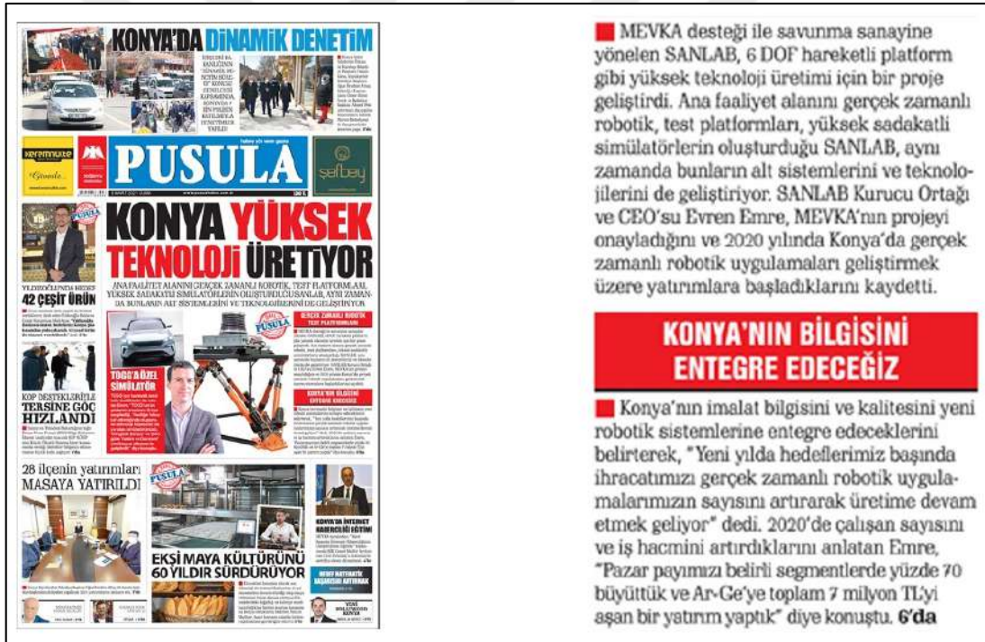
Resim 93: Pusula gazetesi 5 Mart 2021, Boşluk Yapısı ve Kullanımı.

Pusula gazetesi 5,6,8,9,10 Mart 2021 ana kapak sayıları boşluk (espas) düzenlemeleri incelenmiş ve inceleme sonucunda metinlerin soldan bloklama olmasından dolayı espas hatalarının olmadığı tespit edilmiştir. Resim 93'te 5 Mart 2021 ana kapak sayısı örnek olarak konulmuştur diğer 6,8,9,10 Mart 2021 ana kapak sayılarında da espas kullanım hatası olmadığından sebep örnekleri konulmamıştır.