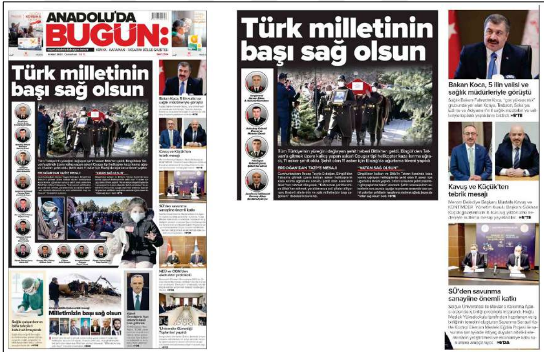
Resim 62: Anadolu’da Bugün gazetesi 06.03.2021, Tipografik Açından Ana ve Ara Başlıkların Kullanımı.

Ayrıca haber ara başlıkları incelendiğinde alt alta gelen haber başlıklarının punto büyüklüklerinin ve harf kalınlıklarının birbirinin aynısı olduğu, tırnaksız yazı karakteri kullanıldığı, haber önem sırasına göre yerleştirilmediği, ana başlık ve ara haber başlıkların tırnaksız tek bir font karakterinden oluşturulduğu görülmüş Haber başlıklarının haber alanına düzgün bir şekilde yerleştirilmediği saptanmıştır.