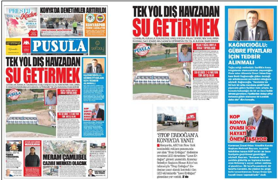
Resim 33: Pusula gazetesi 08.03.2021, Tipografik Açıdan Ana ve Ara Başlıkların Kullanımı.

Resim 33'te örneklerde görüldüğü üzere Pusula gazetesinin 8 Mart 2021 tarihli kapak tasarımındaki ana başlık ve ara başlıkların tipografik kullanım yönünden incelemesi yapılmıştır. Buna göre gazete manşet başlığının büyük puntolarla yazılıp haberin en önemli haber olduğu vurgulanmış ve manşet başlığının haber alanını genişliğinde olduğu görülmüştür.