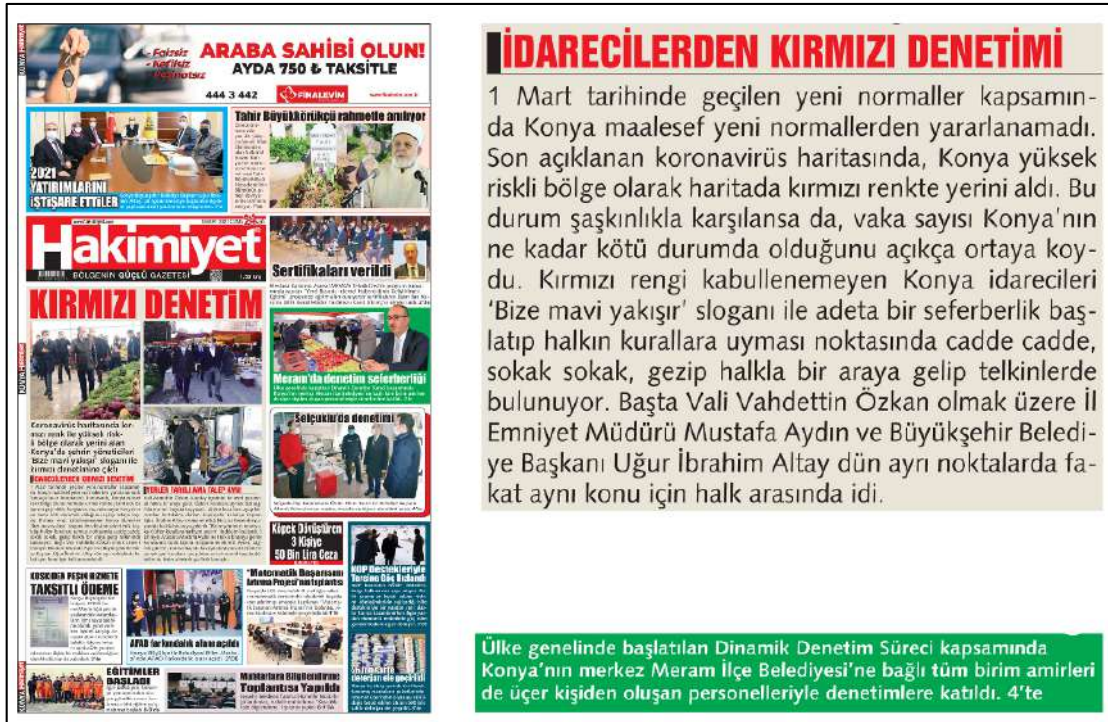
Resim 98: Hakimiyet gazetesi 5 Mart 2021, Boşluk Yapısı ve Kullanımı.

Hakimiyet gazetesinin 5,6,8,9,10 Mart 2021 ana kapak sayıları boşluk (espas) düzenlemeleri incelenmiş ve inceleme sonucunda metinlerin soldan ve her iki yana yaslı bloklama olduğu tespit edilmiş, bu inceleme sonucunda soldan ve her iki yana yaslı metinleri bloklama düzeninde herhangi bir espas boşluk hatasına rastlanmamıştır.