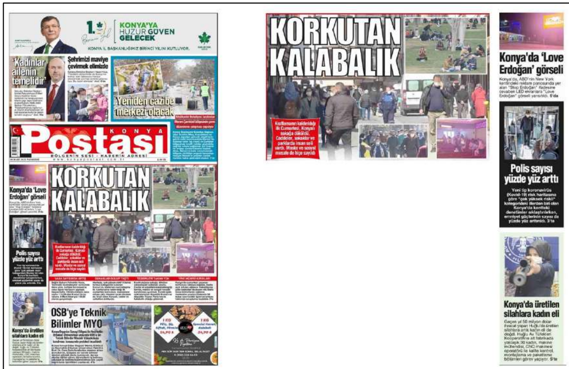
Resim 43: Konya Postası gazetesi 08.03.2021, Tipografik Açından Ana ve Ara Başlıkların Kullanımı

Ayrıca haber ara başlıkları incelendiğinde alt alta gelen haber başlıklarının punto büyüklüklerinin ve harf kalınlıklarının birbirine yakın olduğunu ve tırnaksız yazı karakteri kullanıldığı, haber önem sırasına göre yerleştirilmediği ve ana başlık ile ara başlıkların tırnaksız iki ayrı font karakterinden oluşturulduğu görülmüştür. Haber başlıklarının haber alanına göre bazısının düzenlendiği bazısının düzenlenmediği düzgün bir şekilde yerleştirilmediği saptanmıştır.