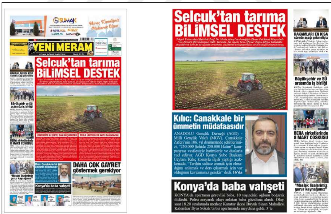
Resim 30: Yeni Meram gazetesi 10.03.2021, Tipografik Açıdan Ana ve Ara Başlıkların Kullanımı.

Gazete kapak tasarımında ana başlık ve ara haber başlıklarının font seçimi incelenmiş ve başlıklarda kullanılan font karakterlerinin tırnaksız büyük puntolu ve küçük puntolu tek bir font karakterinden dizildiği gözlemlenmiştir. Haber başlıklarının haber alanına göre düzenlendiği düzgün bir şekilde yerleştirildiği inceleme sonucunda tespit edilmiştir.