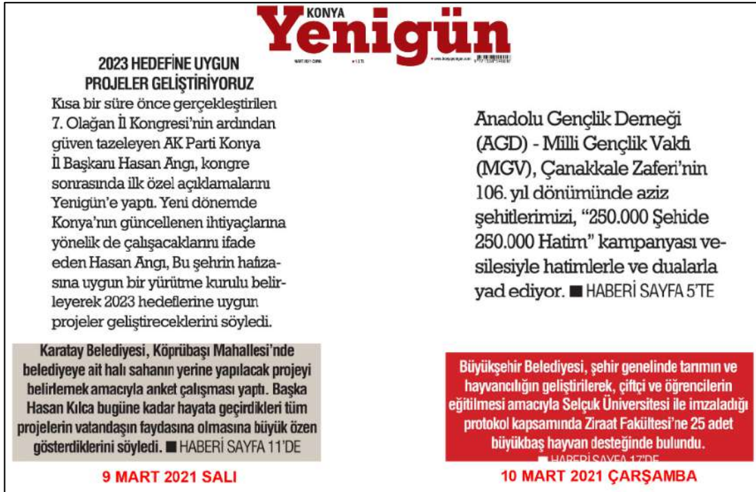
Resim 84: Konya Yenigün gazetesi 9,10 Mart 2021, Metin Düzeni ve Sütun Yapısı.

Resim 83'te Konya Yenigün gazetesi metin düzeni değerlendirmesinde 5 Mart 2021 ana kapak sayısında görüldüğü üzere ortadan blok, her iki yana dayalı ve soldan bloklanmış olduğu görülmektedir. Gazetenin 6,8 Mart 2021 tarihli ana kapak sayılarında metinlerde biloklama şeklinin ortadan ve soldan bloklanmış olduğu tespit edilmiştir.