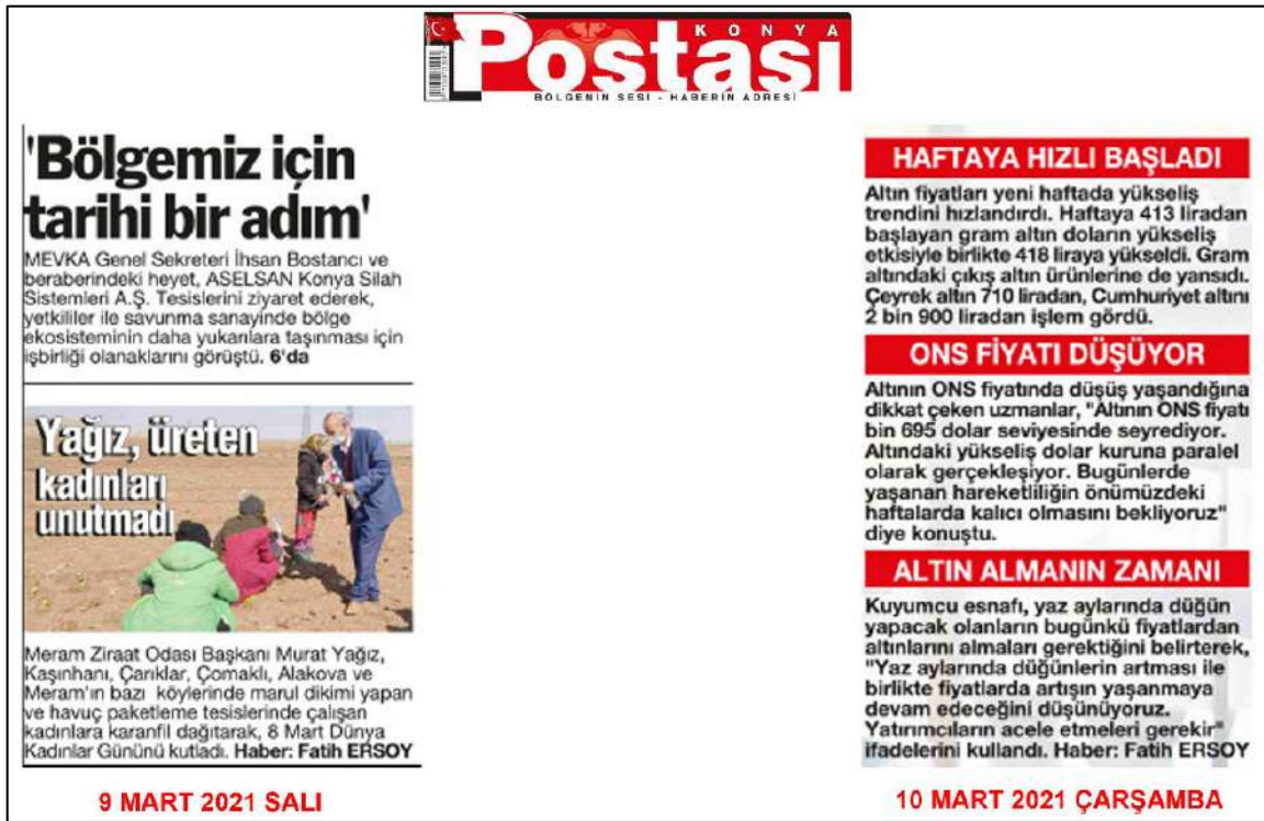
Resim 80: Konya Postası Gazetesi 9,10 Mart 2021, Metin Düzeni ve Sütun Yapısı.

Resim 80'de Konya Postası metin düzeni değerlendirmesinde 9,10 Mart 2021 ana kapak sayılarında örnekte görüldüğü üzere, metinlere soldan bloklama şeklinin uygulandığı görülmektedir.