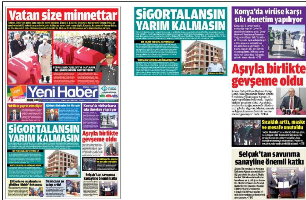
Resim 47: Yeni Haber gazetesi 06.03.2021, Tipografik Açıdan Ana ve Ara Başlıkların Kullanımı.

Ayrıca haber ara başlıkları incelendiğinde alt alta gelen haber başlıklarının punto büyüklüklerinin ve harf kalınlıklarının birbirine yakın olduğunu ve tırnaksız yazı karakteri kullanıldığı, haber önem sırasına göre yerleştirilmediği ve ana başlık ile ara başlıkların tırnaksız aynı font karakterinden oluşturulduğu görülmüştür. Haber başlıklarının haber alanına göre düzenlendiği düzgün bir şekilde yerleştirildiği saptanmıştır.