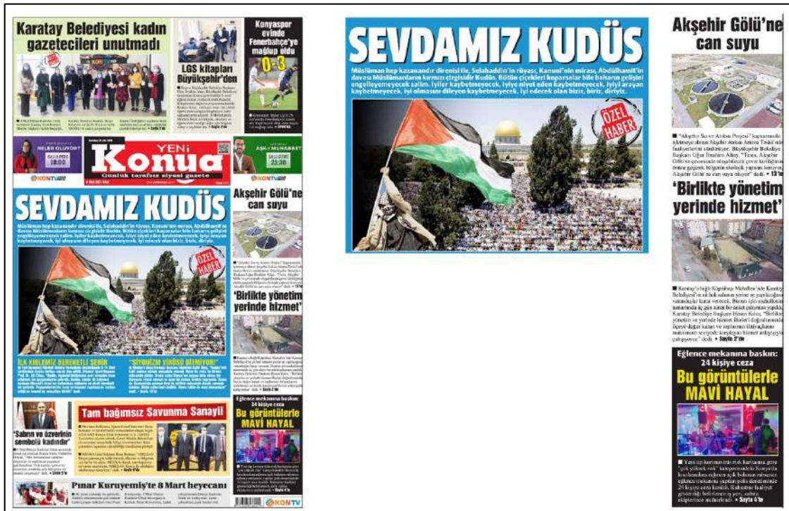
Resim 39: Yeni Konya gazetesi 09.03.2021, Tipografik Açıdan Ana ve Ara Başlıkların Kullanımı.

Resim 39'da örneklerde görüldüğü üzere Yeni Konya gazetesinin 9 Mart 2021 tarihli kapak tasarımındaki ana başlık ve ara başlıkların tipografik kullanım yönünden incelemesi yapılmıştır. Buna göre Gazete manşet başlığının büyük puntolarla yazılıp haberin en önemli haber olduğu ortaya çıkartılmış ve manşet başlığının haber alanını genişliğinde olduğunun tespitine varılmıştır.