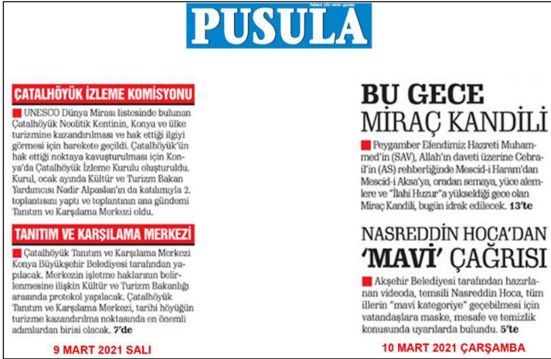
Resim 76: Pusula gazetesi 9,10 Mart 2021, Metin Düzeni ve Sütun Yapısı.

Resim 75’de Pusula gazetesi metin düzeni değerlendirmesinde 5,6,8 Mart 2021 ana kapak sayılarında görüldüğü üzere, metinlere soldan bloklama şeklinin uygulandığı örneklerde görülmektedir.