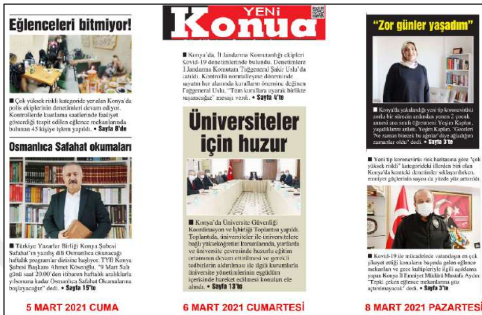
Resim 77: Yeni Konya gazetesi 5,6,8 Mart 2021, Metin Düzeni ve Sütun Yapısı.

Resim 77'de Yeni Konya gazetesi metin düzeni değerlendirmesinde 5,6,8 Mart 2021 ana kapak sayılarında örneklerde görüldüğü üzere, metinlere soldan bloklama şeklinin uygulandığı görülmektedir.