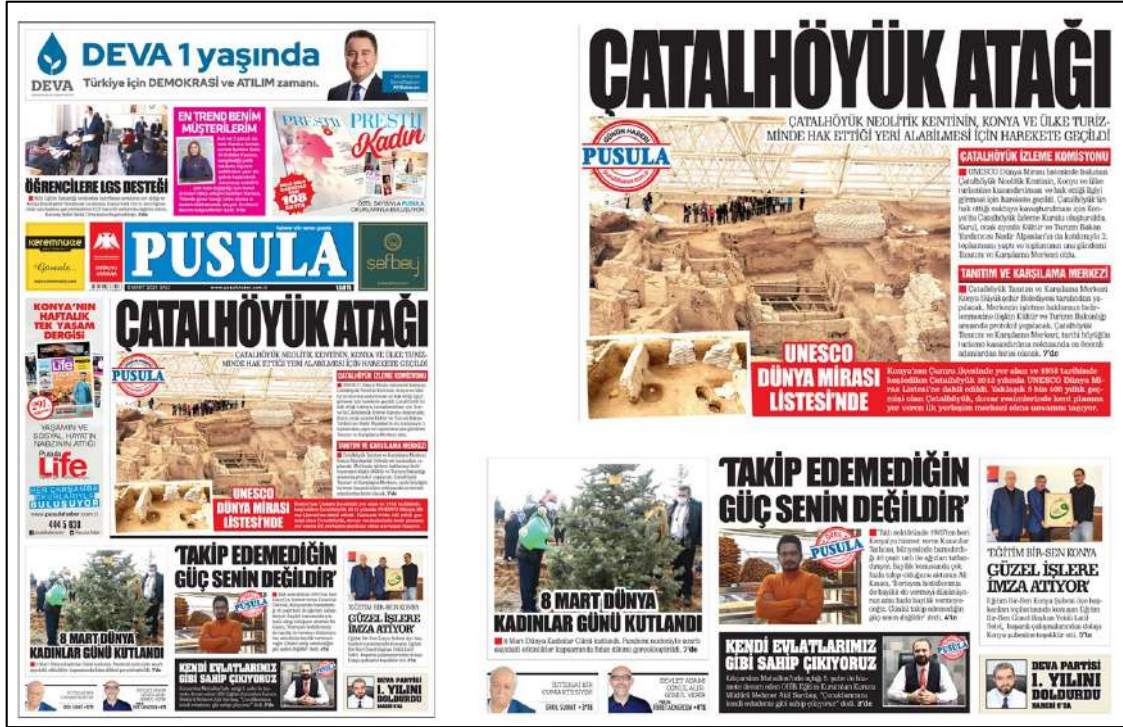
Resim 34: Pusula gazetesi 09.03.2021, Tipografik Açıdan Ana ve ara Başlıkların Kullanımı.

Resim 34’te örneklerde görüldüğü üzere Pusula gazetesinin 9 Mart 2021 tarihli kapak tasarımındaki ana başlık ve ara başlıkların tipografik tercih yönünden incelemesi yapılmış, gazete manşet başlığının büyük puntolarla yazılıp haberin en önemli haber olduğu ortaya çıkartılmış ve manşet başlığının haber alanını genişliğinde olduğunun tespitine varılmıştır.