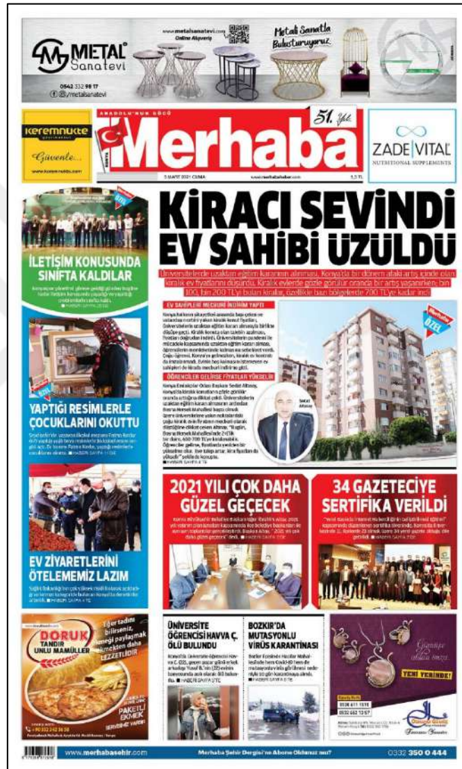
Resim 1: 05.03.2021, Merhaba gazetesi Şerifsiz (tırnaksız) yazı karakteri kullanımı.

Resim 1 ve Resim 2'de yer alan Merhaba gazetesinin 5,6,8,9,10 Mart 2021 günlük gazetede ana kapak haber metinlerinde küçük harf dizilimi tercih edilmiş ve sütunlarda tırnaksız yazı karakterleri kullanılmıştır. Bu durumun akıcılık ve okunurluk seviyesini minimum düzeye düşürdüğünü söyleyebiliriz. Çünkü