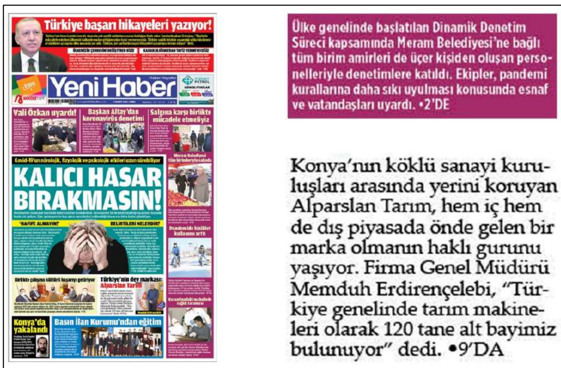
Resim 96: Yeni Haber gazetesi 5 Mart 2021, Boşluk Yapısı ve Kullanımı.

Yeni Haber gazetesinin 5,6,8,9,10 Mart 2021 ana kapak sayıları boşluk (espas) düzenlemeleri incelenmiş ve inceleme sonucunda metinlere soldan blok sistemi uygulanmasından dolayı espas hatalarının olmadığı tespit edilmiştir. Resim 96'da görüldüğü üzere 5 Mart 2021 ana kapak sayısı örnek olarak konulmuştur diğer 6,8,9,10 Mart 2021 ana kapak sayılarında da espas kullanım hatası olmadığından dolayı örnekleri konulmamıştır.