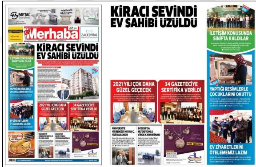
Resim 21: Merhaba gazetesi 05.03.2021, Tipografik Açından Ana ve Ara Başlıkların Kullanımı.