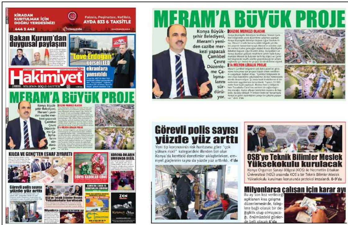
Resim 58: Hakimiyet gazetesi 08.03.2021, Tipografik Açıdan Ana ve Ara Başlıkların Kullanımı

Ara haber başlıkları incelendiğinde alt alta gelen haber başlıklarının punto büyüklüklerinin ve harf kalınlıklarının birbirine yakın olduğunu tırnaksız yazı karakteri kullanıldığı, haber önem sırasına göre yerleştirilmediği, ana başlık ve ara haber başlıklarının tırnaksız tek bir font karakterinden oluşturulduğu görülmüştür. Haber başlıklarının haber alanına düzgün bir şekilde yerleştirilmediği tespiti yapılmıştır.