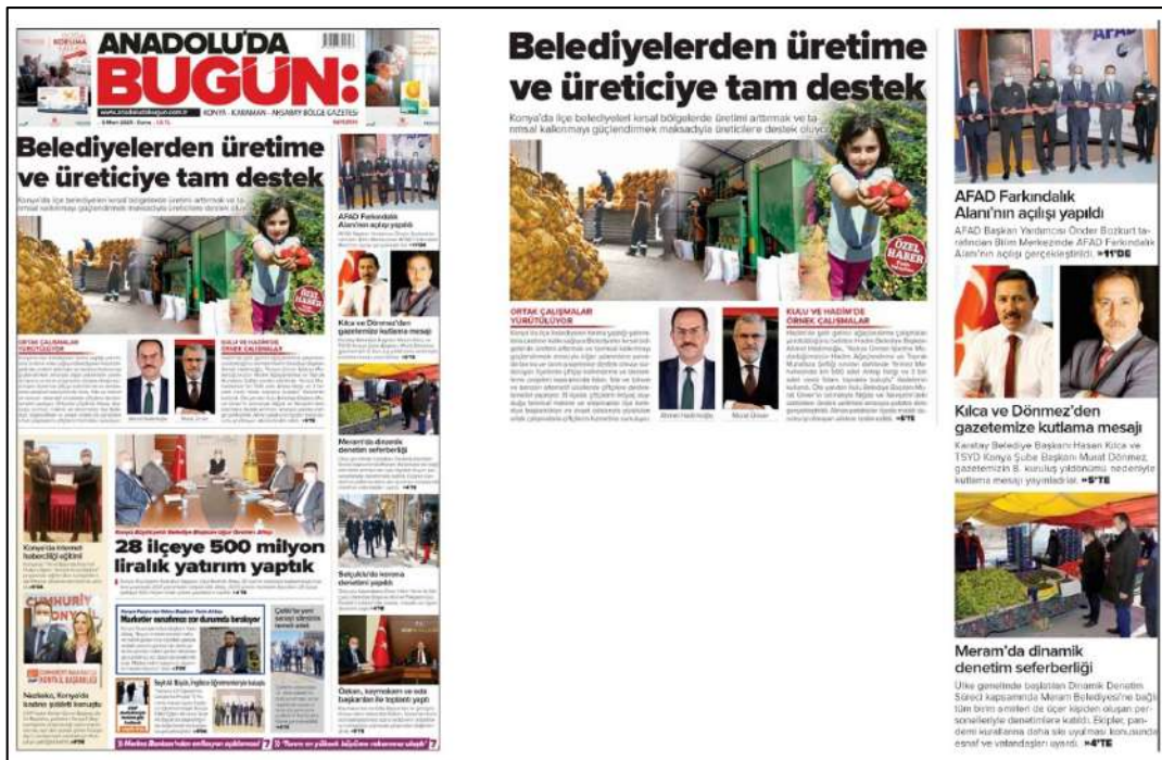
Resim 61: Anadolu'da Bugün gazetesi 05.03.2021, Tipografik Açıdan Ana ve Ara Başlıkların Kullanımı.