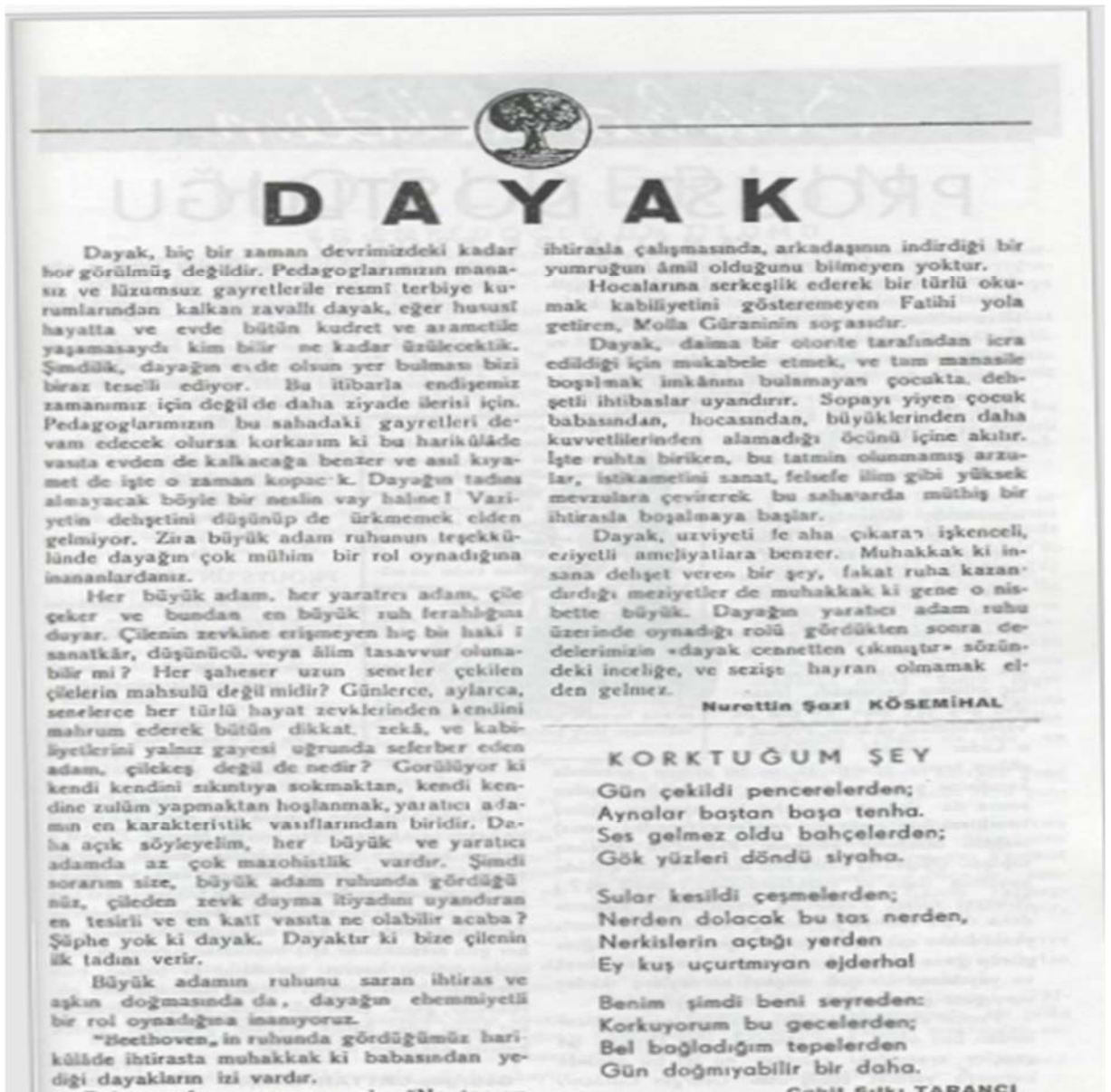
Şekil 3: Ağaç Dergisi, 23 Mayıs 1936, Sayı: 8.

Sanatın pek çok alanında çalışmalar ortaya koyan Kösemihal’in bir diğer özelliği de kendisinin bir öykü yazarı olmasıdır. Necip Fazıl Kısakürek’in sahibi olduğu “Ağaç -Sanat, Fikir, Aksiyon- Dergisi’nde”, “Dayak” adlı çalışması yer almaktadır. Bu dergide Hilmi Ziya Ülken’den Sait Faik Abasıyanık’a kadar pek çok düşünür, edebiyatçı eserler kaleme almıştır.