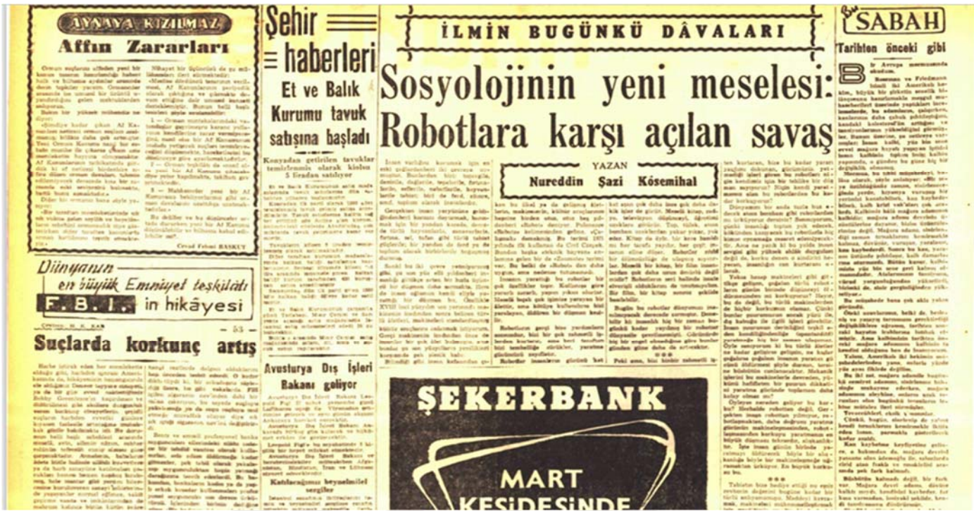
Şekil 4: “Sosyolojinin Yeni Meselesi: Robotlara Karşı Açılan Savaş”, Cumhuriyet Gazetesi, 25 Şubat 1958.