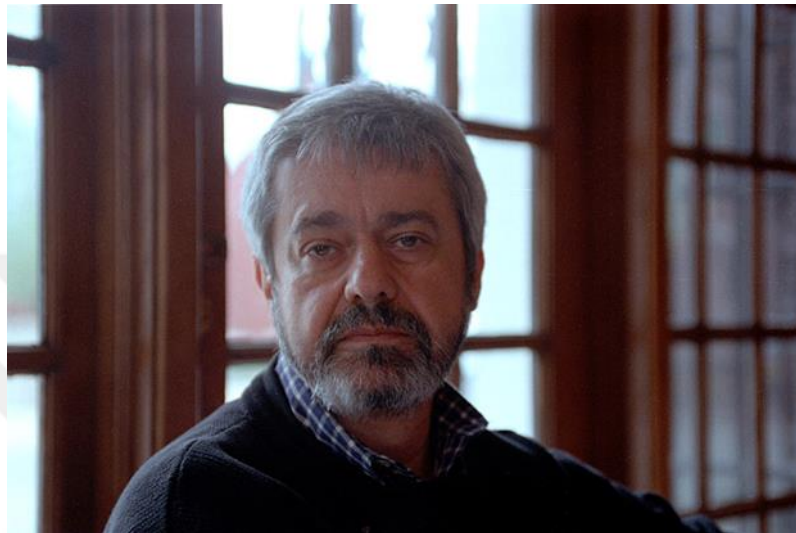
Abb. 1: Jurek Becker, Nisan 1993 (wikipedia.org).

Judentum gezwungen, der immer die Synagoge besuchte. Einmal hat er eine Synagoge besucht, um in seiner Arbeit zu verwenden und zu sehen, was abspielt sich (Vgl. Çoraklı, 2000: 221).