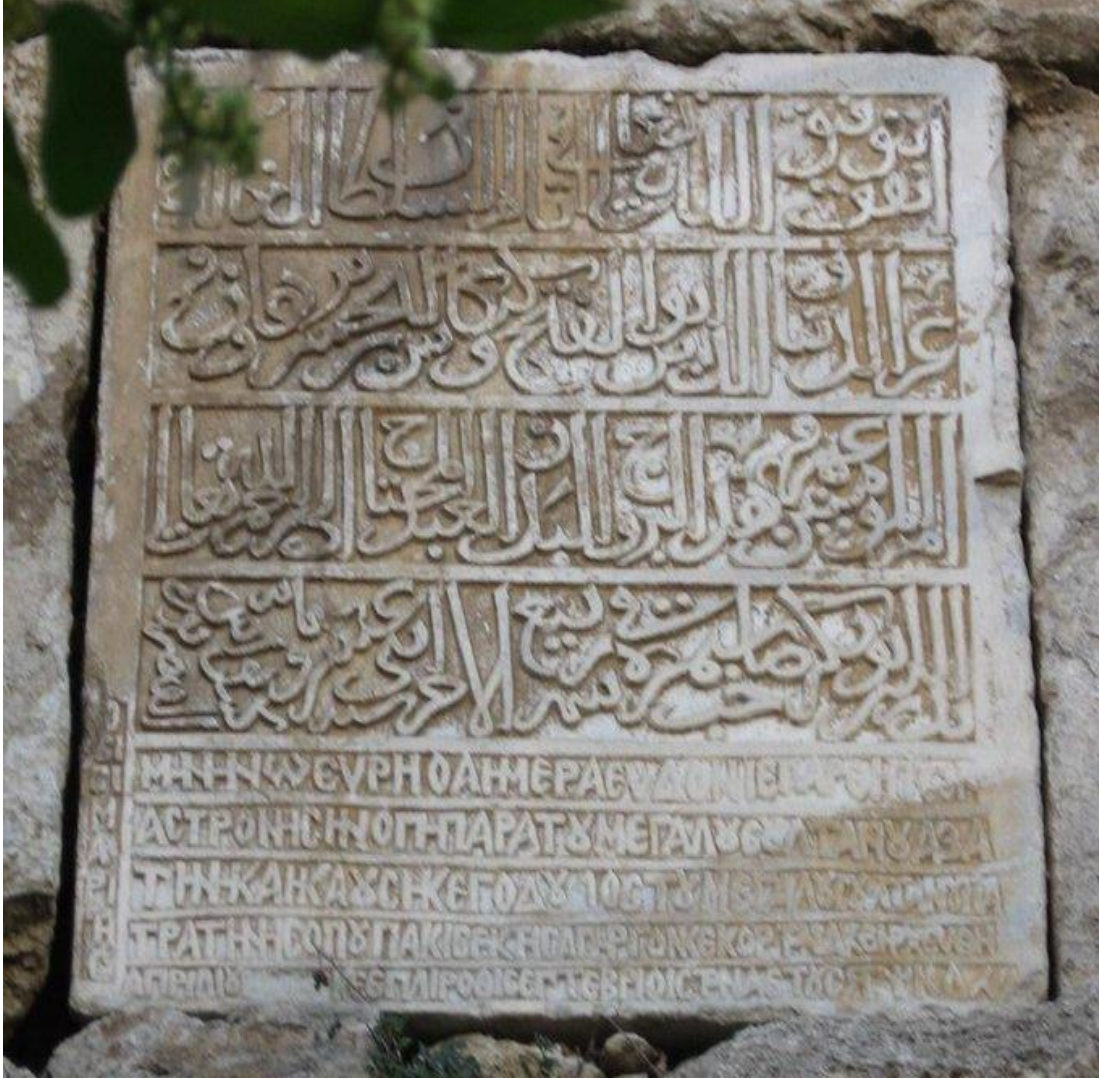
Resim 1.2. Sinop kalesinden bir feth kitabe 330