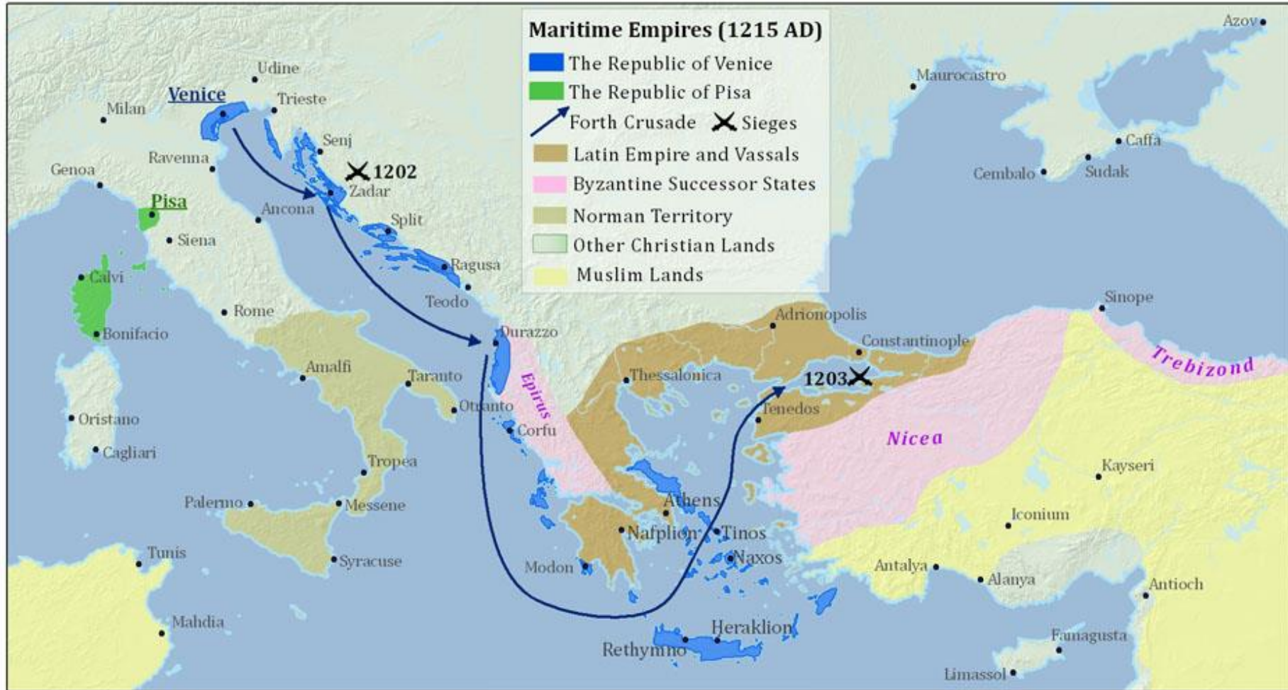
Harita 1.1. IV. Haçlı Seferinde izlenen yol. ( xplorethemed.com/Venice.asp?c=1/2023 )