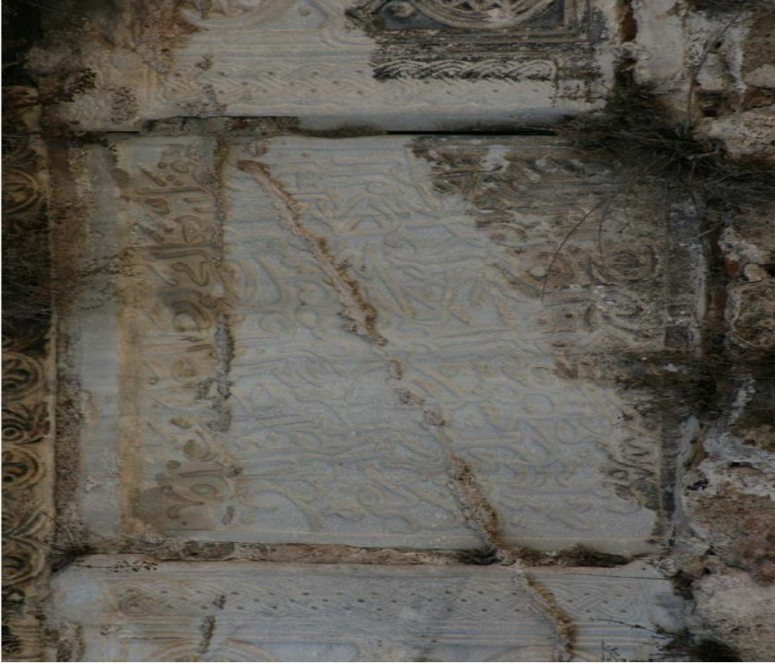
Resim.1.1. Antalya kalesinden bir fetih kitabesi. 329