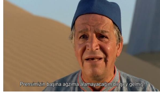
Fotoğraf 15: Prens'in uşağının üzüntülü hali (Time Code: 00.14.03)