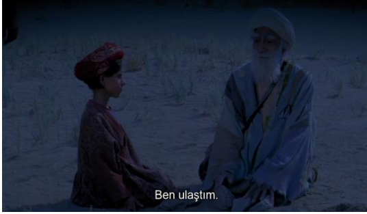
Fotoğraf 45: Bab'Aziz'in menziline ulaşması (Time Code: 01.16.50)