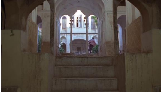
Fotoğraf 23: Osman'ın kaçıışı ve bir kapıdan içeriye girişi (Time Code: 00.41.48)

çalışmaktadır. Bu amaçla para biriktirip kaçakçılarla anlaşır. Çöldeki özel kumlardan getirerek hattatlara satmaktadır. Bu faaliyetle yaşamını idame ettirmektedir.