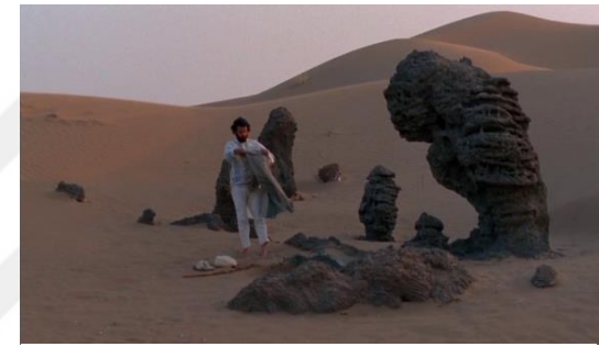
Fotoğraf 48: Prens'in ruhunu izleme sürecinin bitişi (Time Code: 01.18.31)