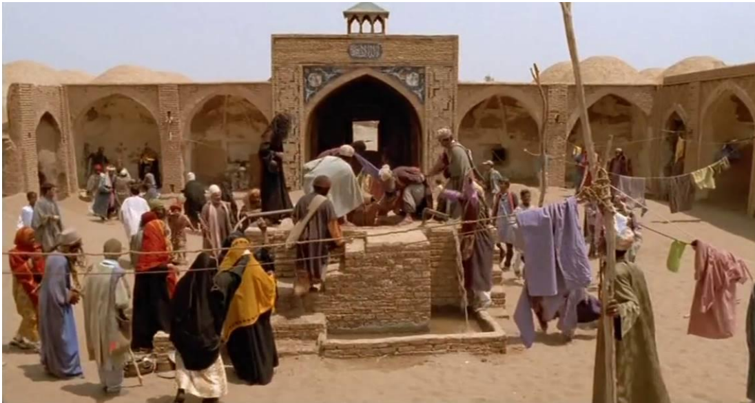
Fotoğraf 22: Dervişlerin mola yeri, Osman'ın kuyuya atlaması (Time Code: 00.30.55)

Bu sahnede, Prens terli ve yağlanmış cildinden, suyun başında çok uzun zamandır oturduğu izlenimi oluşturulmaktadır (Fotoğraf 20). Prensi, uşağı dâhil herkes unutmuş, ondan umudu kesmiştir. Prens baktığı suda etraftaki nesnelere yansıması olduğu halde, prensin yansıması bulunmamaktadır. Bu yansımanın bulunmaması, Prens başka bir âlemde olduğunun göstergesidir.