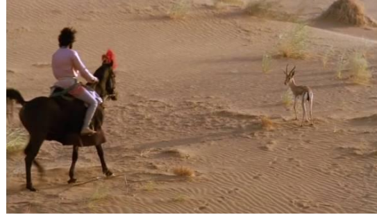
Fotoğraf 13: Prensın atıyla ceylanın peşinden gitmesi (Time Code: 00.12.57)