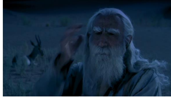
Fotoğraf 50: Bab'Aziz'in hazırlanması ve arkadaki ceylan (Time Code: 01.26.31)