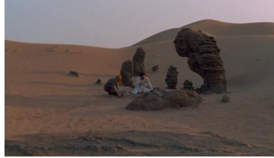
Fotoğraf 46: Dervişin prensin yanına yeni kıyafetler getirmesi (Time Code: 01.17.33)