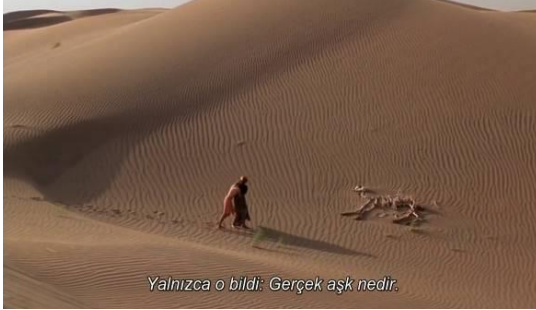
Fotoğraf 39: Kızıl Derviş ve bitkin haldeki Hasan (Time Code: 01.12.10)