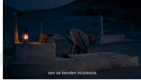
Fotoğraf 42: Kızıl Derviş’in mezar odasını kapatması (Time Code:01.13.43)