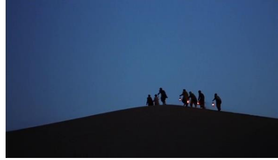
Fotoğraf 17: El fenerleriyle tepenin üstündeki insanlar (Time Code:00.16.20)