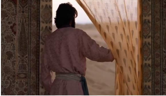
Fotoğraf 10: Prens'in çadırın kapısından çıkması (Time Code:00.12.01)

yeşil kalması ve uzun süre yaşaması sebebiyle tasavvuf düşüncesinde ölümle bağdaştırılmıştır (Çetin, Yayık, 2021: 489). Tasavvuf kültüründe ölüm bir son değildir. Ölümle birlikte geçici dünya sona ermektedir ve sonsuz dünya başlamaktadır (Çelik, 2009: 122). Bu sahnede servi ağaçlarının dikkat çekici bir şekilde görünür olması sahnenin bir geçiş aşaması olarak kurgulandığı düşüncesini uyandırmaktadır.