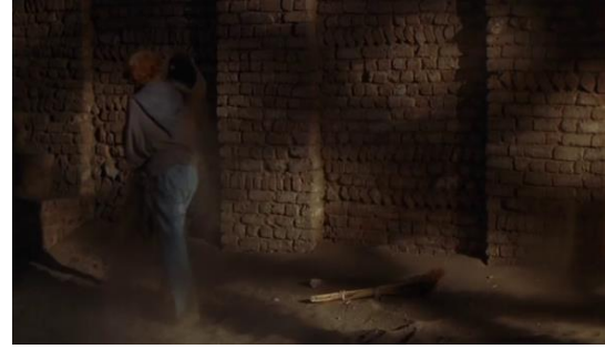
Fotoğraf 28: Kızıl Derviş cami avlusunu temizlemektedir (Time Code: 00.47.56)