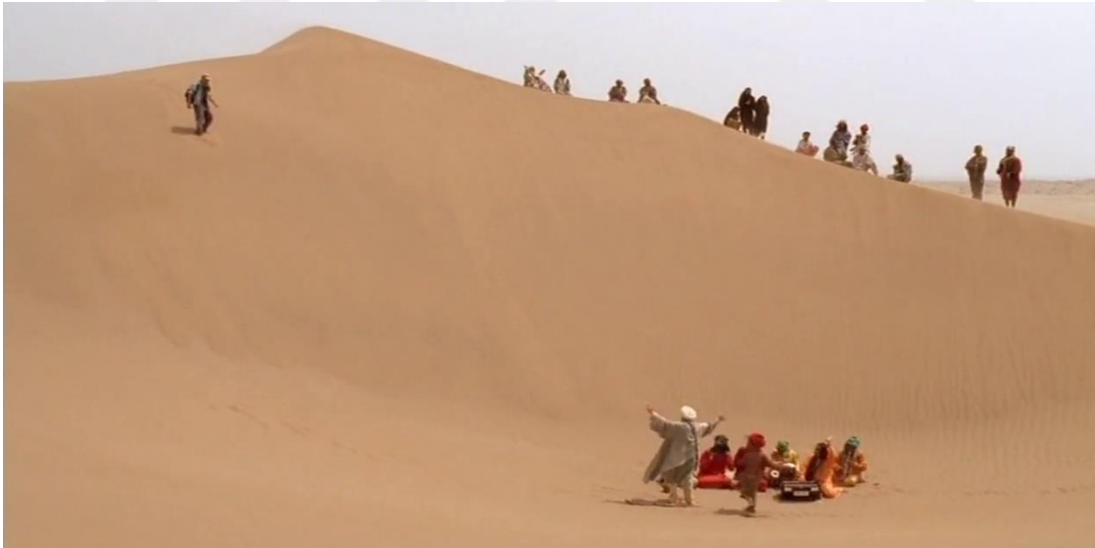
Fotoğraf 19: Dervişlerin buluşması görüntüsel göstergeler (Time Code: 00.27.03)

Bu sahnede prensin arkasında duran kayalar, onu koruma, kollama görevi üstleniyormuş hissi uyandırmaktadır. Kayalar, rüzgârın aşındırması ile sanki kumun üstünde oturan birer insan şekline dönüşmüştür.