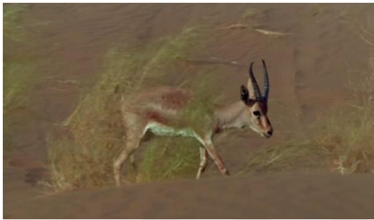
Fotoğraf 47: Ceylan'ın prensin bulunduğu alana gelişi (Time Code: 01.17.51)