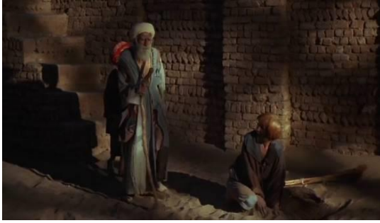
Fotoğraf 27: Bab'Aziz, Kızıl Derviş ile karşılaşır (TimeCode: 00.47.31)