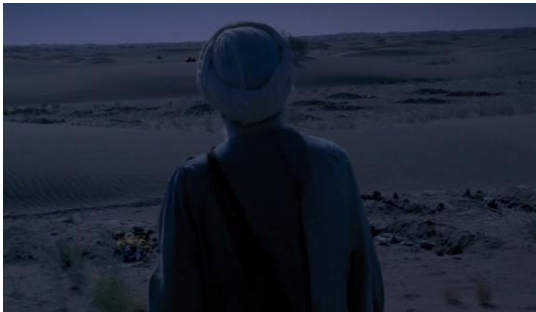
Fotoğraf 43: Bab'Aziz'in bir mezarlık alanda duruşu (Time Code: 01.14.26)

Şarkı, Hüseyin ve sevdiği kadına söyleniyor gibidir ama aslında durum öyle değildir. Şarkı, iki kardeş Hüseyin ve Hasan'a seslenmektedir. Hüseyin, daha çok maddi âlemle; Hasan, manevi âlemle iştigal olmaktadır. Hüseyin ortadan kaybolduktan sonra, Hasan kardeşinin yokluğunu hissetmiş ve onsuz bir bütün olamayacağı kanısına varmıştır. Dünyevi zevkleri bırakarak, kardeşinin katilini bulmak için çöllere düşmüştür. Hüseyin'in mezar odasına girişi Hasan'ın manevi âlemle hemhal olmasının yolunu açmıştır (Fotoğraf 37).