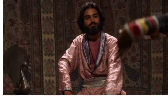
Fotoğraf 9: Prens'in çadırda düşünceli bakışı (Time Code: 00.11.02)