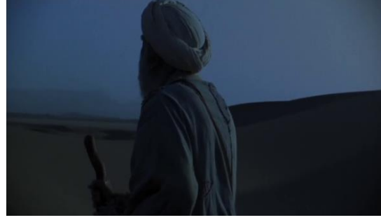
Fotoğraf 35: İshar'ın çölde kaybolması ve korkması (Time Code: 00.54.09)