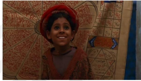
Fotoğraf 32: İshar'ın bölmeye girdikten sonra yüzündeki mutluluk ifadesi (Time Code: 00.49.05)