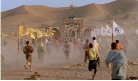
Fotoğraf 16 : Aceleyle hareket eden insanlar (Time Code:00.15.45)