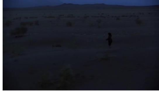
Fotoğraf 34: İshar'ın ceylanın peşinden gitmesi (Time Code: 00.52.20)