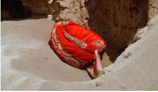
Fotoğraf 4: Kumun içinden çıkan el ve kırmızı şapka (Time Code: 00.02.48)