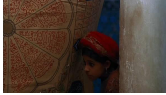
Fotoğraf 30: İshar'ın perdeden başka bir bölüme geçişi (Time Code: 00.49.00)