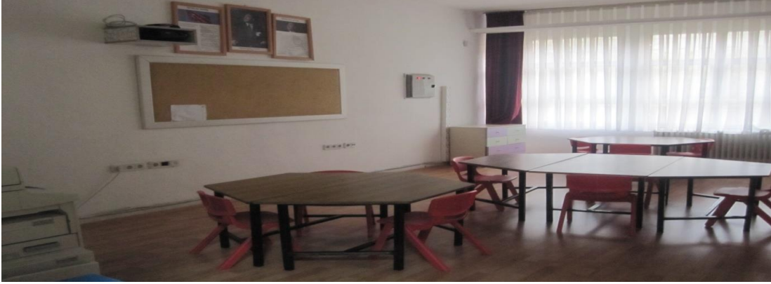
Şekil 10- Kemal Yurtbilir Özel Eğitim Anaokulu öğretmenler odasından bir görünüm