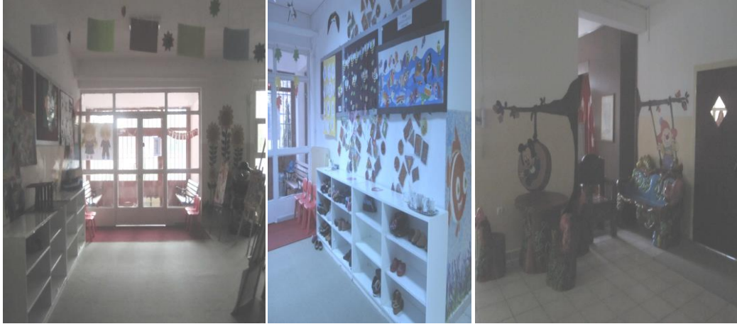
Şekil-4: Kemal Yurtbilir Özel Eğitim Anaokulu koridorlarından görünüm