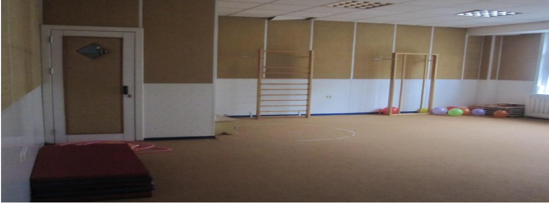
Şekil 8- Kemal Yurtbilir Özel Eğitim Anaokulu çok amaçlı salondan bir görünüm