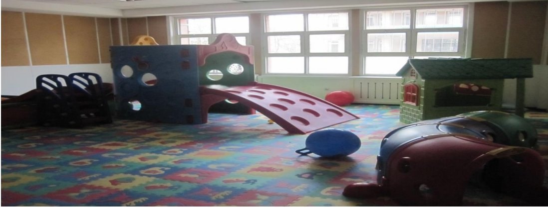
Şekil 7- Kemal Yurtbilir Özel Eğitim Anaokulu spor odasından bir görünüm