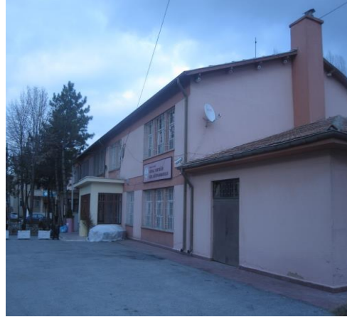
Şekil-2: Kemal Yurtbilir Özel Eğitim Anaokulu bahçesinden görünüm