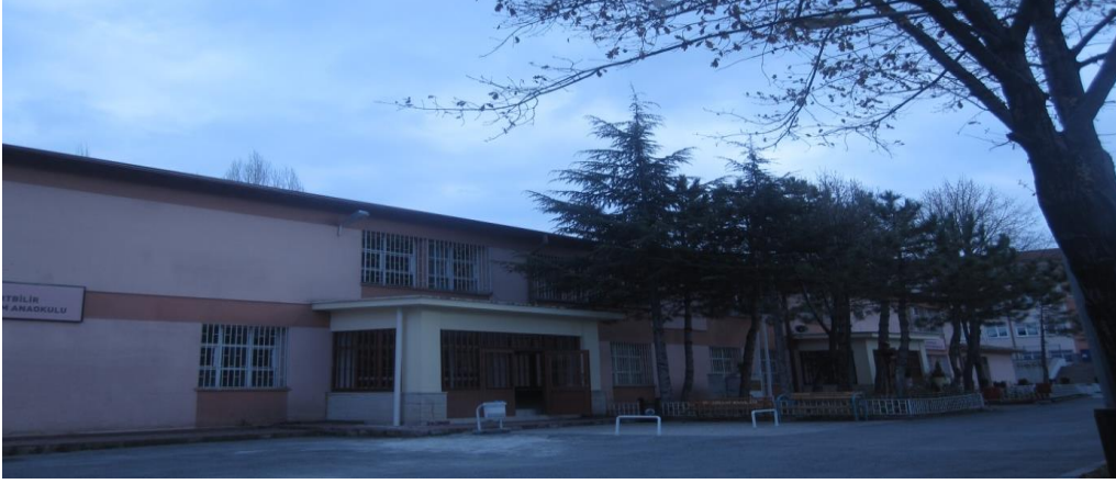
Şekil-1: Kemal Yurtbilir Özel Eğitim Anaokulu dış cepheden görünüm