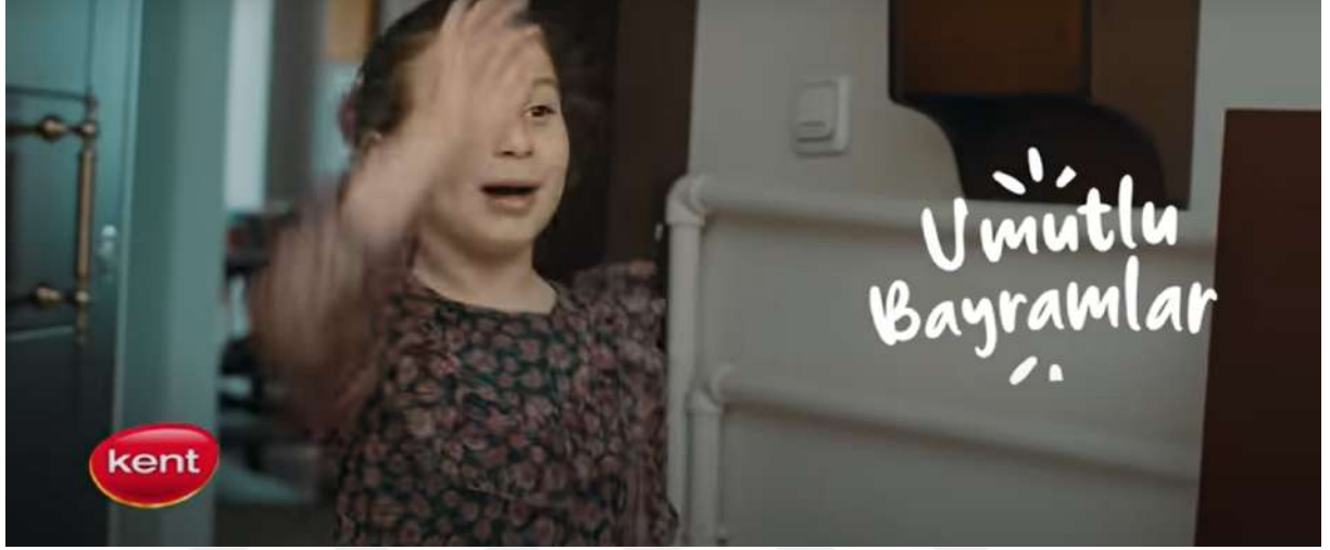
Resim 27- “Kent, Bayram” Reklamı Onbirinci Sahne

“İyi Bayramlar” notu, duygusal bir mesaj olarak, fiziksel olarak bir arada olunamasa bile sevginin ve bağlılığın ifade edilebileceğini gözler önüne sermiştir.