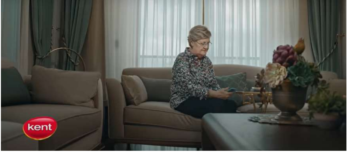
Resim 17- “Kent, Bayram” Reklamı Birinci Sahne