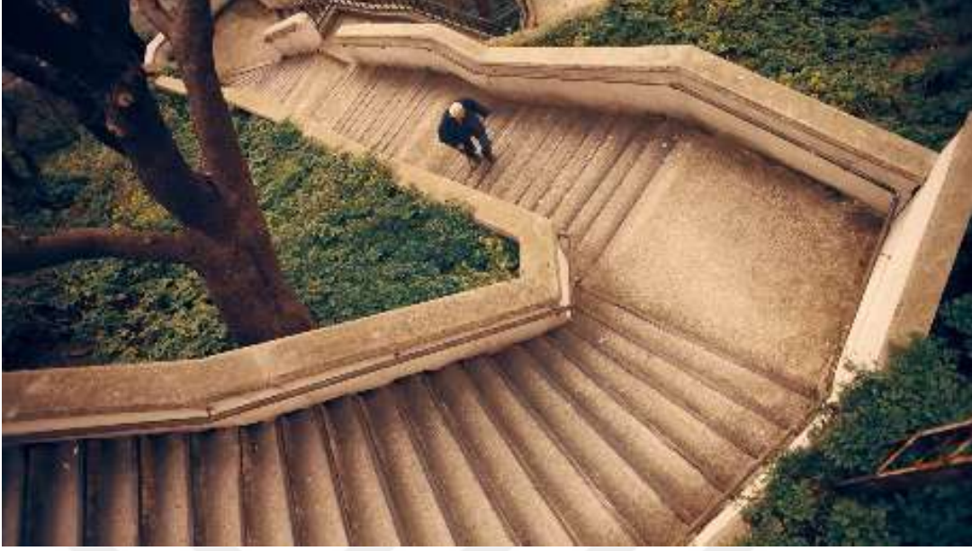
Resim 35- “Yaşın Kaç Olursa Olsun, Her Bayram Çocuk Olursun!” Reklamı Yedinci Sahne