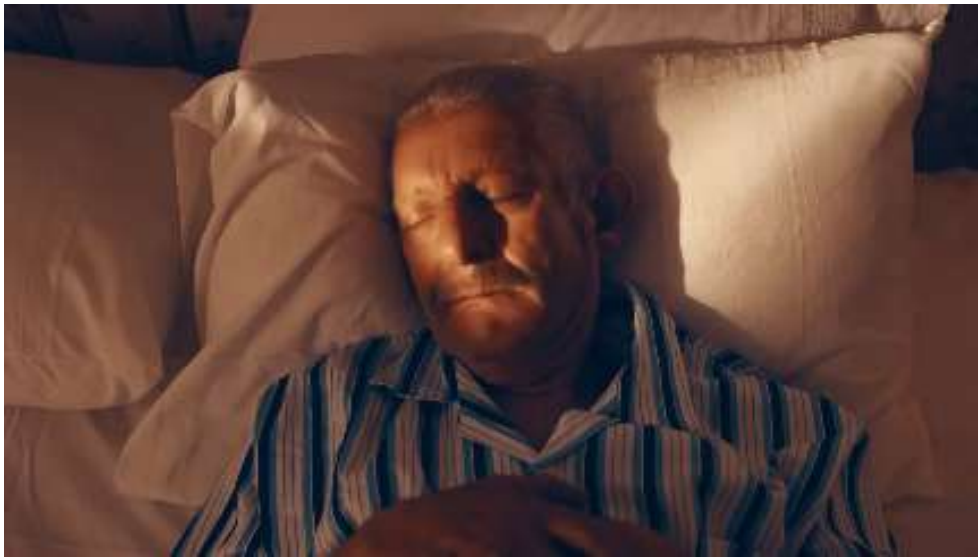
Resim 29- “Yaşın Kaç Olursa Olsun, Her Bayram Çocuk Olursun! ” Reklamı Birinci Sahne

Araştırmada, Kent markasının "Yaşın Kaç Olursa Olsun, Her Bayram Çocuk Olursun!" reklamı incelenmiştir. Bu reklam, 2021 yılında yayınlanmış olup, "Yaşın Kaç Olursa Olsun, Her Bayram Çocuk Olursun!" sloganını kullanmaktadır. Reklamda vurgulanan ana tema ise, "İnsan her yaşta çocuktur ve annesine özlem duyar" şeklinde özetlenebilir.