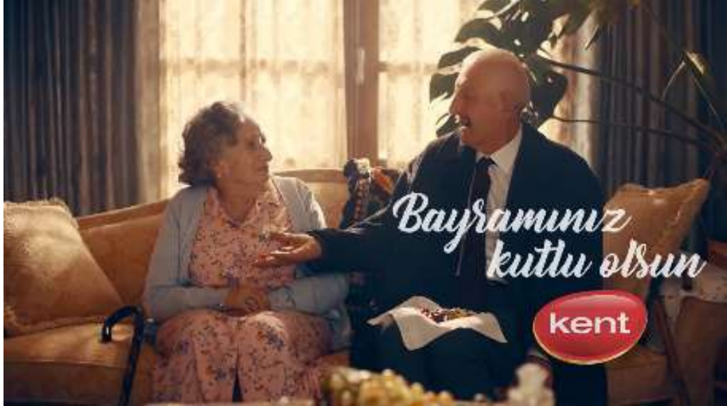
Resim 40- “Yaşın Kaç Olursa Olsun, Her Bayram Çocuk Olursun!” Reklamı Onikinci Sahne