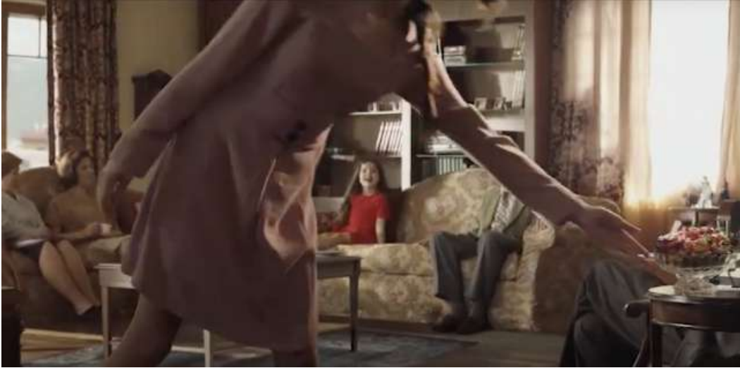
Resim 7- ‘Kent, Her Bayramın Şekeri Reklamı’ Birinci Sahne

Araştırmada, Kent markasının "Kent, Her Bayramın Şekeri" reklamı çözümlenmiştir. Bu reklamda, "Kent, Her Bayramın Şekeri" sloganı öne çıkmaktadır. Reklamın temel mesajı, "Yıllar geçse de Kent olan evlerdeki gülümseme değişmez ve Kent değişmez" şeklinde belirlenmiştir. Bu tema, markanın yıllar boyunca süregelen güvenilirliğini ve bayramların vazgeçilmezi olma özelliğini vurgulamaktadır. Kent'in değişmeyen kalitesi ve evlerdeki sıcak, mutlu atmosferle olan ilişkisi, reklamın ana odağını oluşturmuştur.