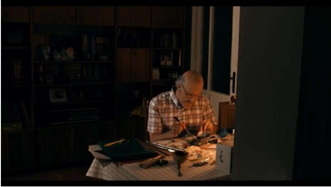
Resim 4- “Sevdiklerini Hatırlamaktır Bayram” Dördüncü Sahne

Sahnedeki aile, simgesel bir anlam taşır. Aile burada, toplumsal ve güçlü bağ olarak öne çıkar. Aile, aynı zamanda sevgi, fedakârlık ve güvenin simgesidir.