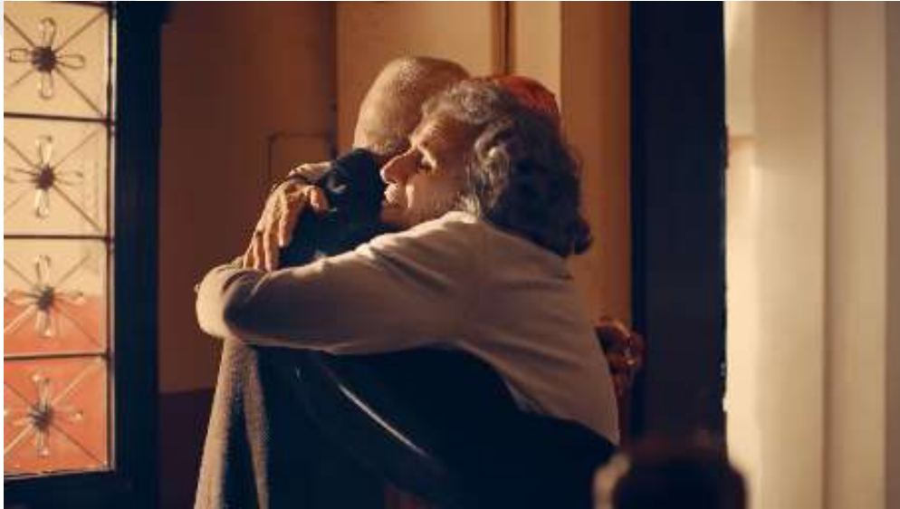
Resim 38- “Yaşın Kaç Olursa Olsun, Her Bayram Çocuk Olursun!” Reklamı Onuncu Sahne

Balon almak, çocukluk hatıralarını geri getirirken, kravatın kırmızı olması, bayram coşkusunu, canlılık ve enerjiyi simgelemiştir. Balonu eline alınca gülmesi, bayramın getirdiği neşeyi temsil etmiştir.