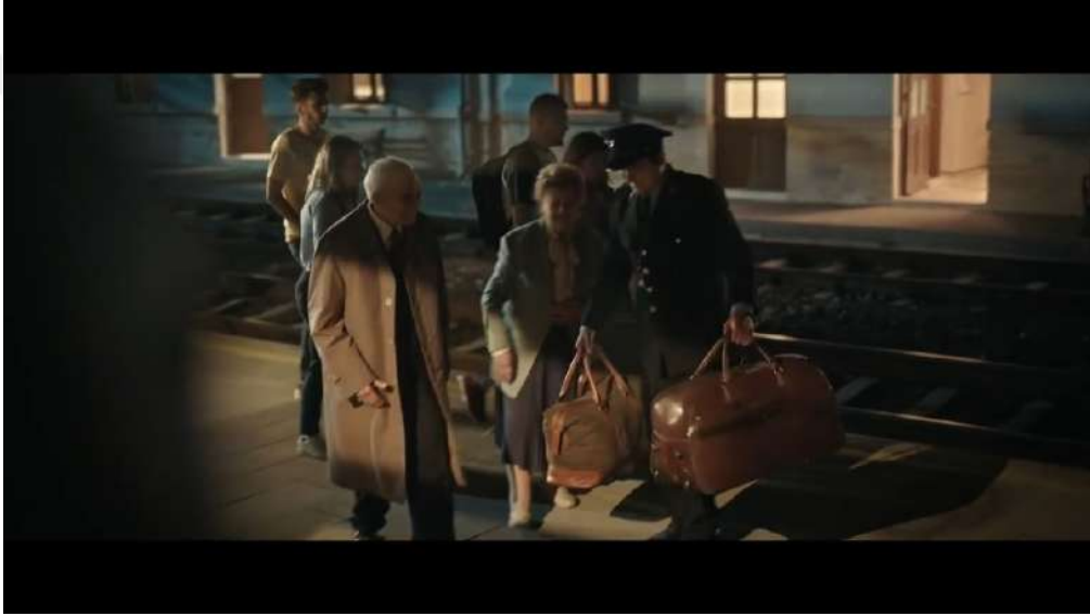
Resim 13- ‘‘Her Bayramın Şekeri’’ Reklamı Birinci Sahne

Araştırmada, Kent markasının "Her Bayramın Şekeri" reklamı çözümlenmiştir. Bu reklamda, ‘‘Bayramda ailemizle olamazsak, bayramlaşır aile oluruz’’ sloganı kullanılmaktadır. Reklamda bayramın, fiziksel mesafeler ne olursa olsun, aileyi bir araya getiren ve birbirine yakınlaştıran özel bir zaman dilimi olduğunu vurgulamaktadır. Reklam, bayramın yalnızca bir tatil değil, aynı zamanda duygusal bağları güçlendiren, insanları birleştiren bir değer olduğunu izleyiciye iletmeyi amaçlamaktadır.