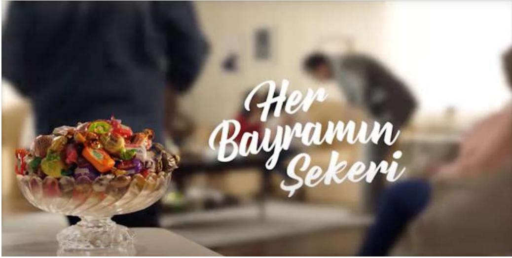
Resim 12- “Kent, Her Bayramın Şekeri Reklamı” Altıncı Sahnesi