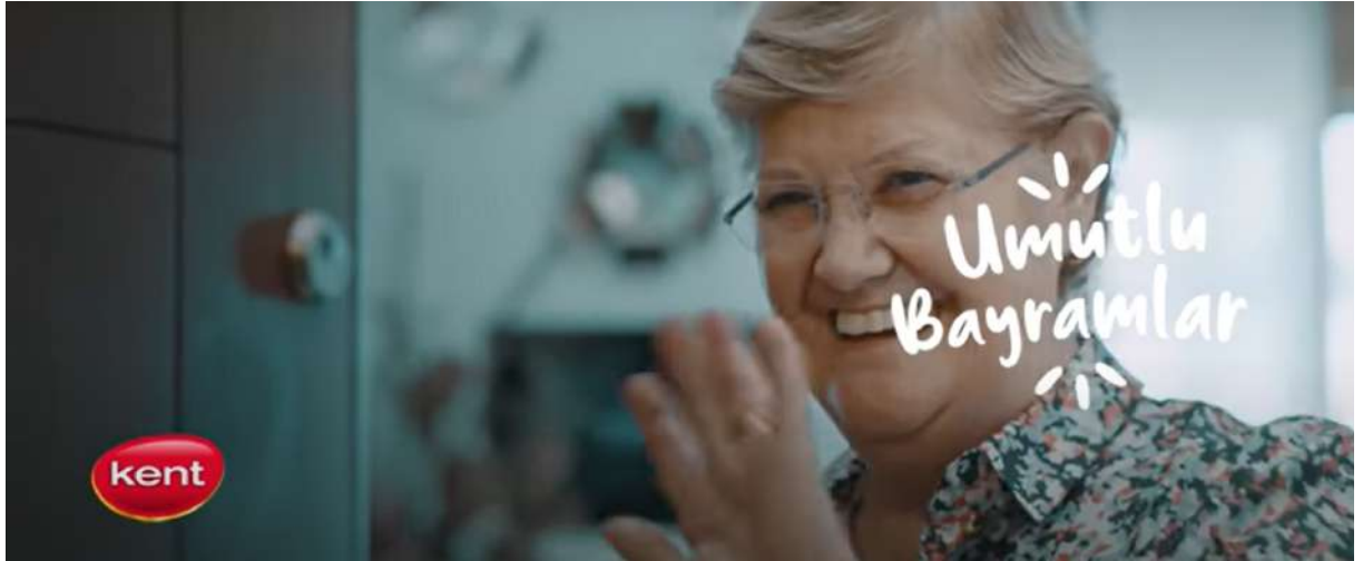
Resim 28- “Kent, Bayram” Reklamı Onikinci Sahne

Kaynak: Kent markasının resmi YouTube hesabından alındı. (Erişim Tarihi: 12.02.2024)