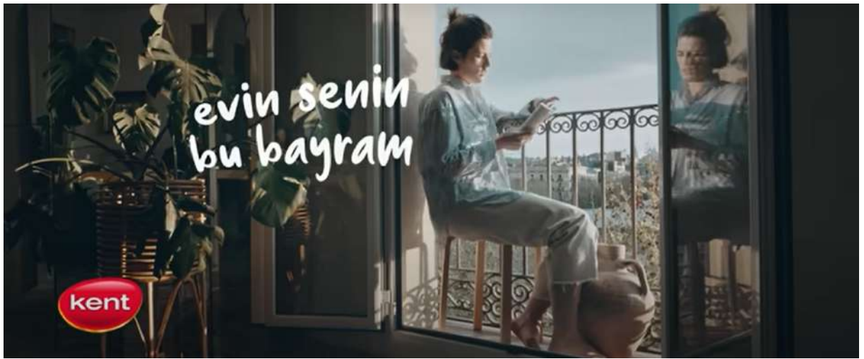
Resim 23- “Kent, Bayram” Reklamı Yedinci Sahne

Görüntülü konuşma yapan kadın ve sağlık çalışanı, fiziksel olarak uzak olunsa bile sevginin devam ettiğini göstermektedir. “Canımızda var olanlar” ifadesi, sadece sevdiklerimizi değil, aynı zamanda sağlık çalışanları gibi toplumun hayatta kalmasında kritik rol oynayanları içermiştir.