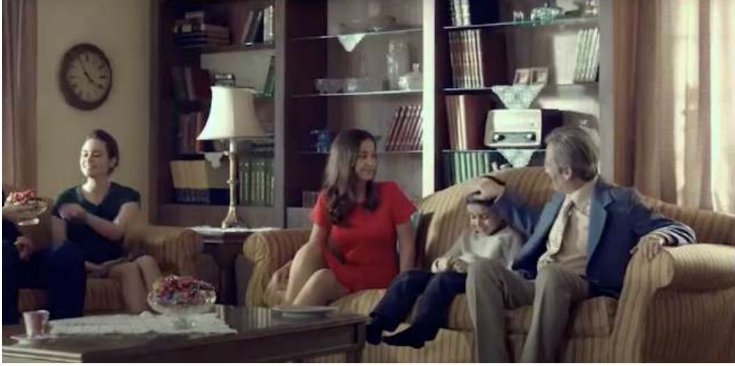
Resim 8- “Kent, Her Bayramın Şekeri Reklamı” İkinci Sahnesi