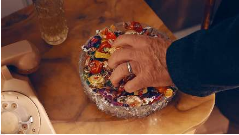
Resim 34- “Yaşın Kaç Olursa Olsun, Her Bayram Çocuk Olursun! ” Reklamı Altıncı Sahne