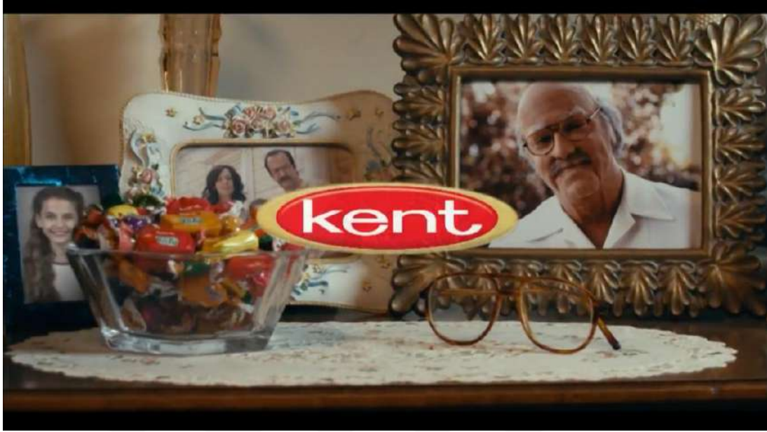
Resim 6- ‘‘Sevdiklerini Hatırlamaktır Bayram’’ Altıncı Sahne