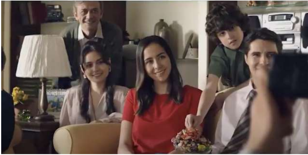
Resim 9- “Kent, Her Bayramın Şekeri Reklamı” Üçüncü Sahnesi