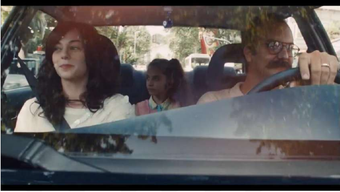
Resim 3- “Sevdiklerini Hatırlamaktır Bayram” Üçüncü Sahne

Kaynak: Kent markasının resmi YouTube hesabından alındı. (Erişim Tarihi: 02.01.2024)