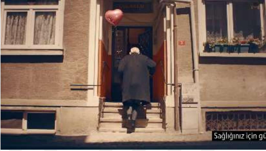
Resim 37- “Yaşın Kaç Olursa Olsun, Her Bayram Çocuk Olursun!” Reklamı Dokuzuncu Sahne

Kaynak: Kent markasının resmi YouTube hesabından alındı. (Erişim Tarihi: 21.02.2024)