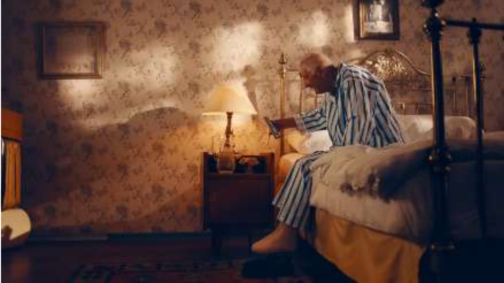
Resim 30- “Yařın Kaç Olursa Olsun, Her Bayram Çocuk Olursun!” Reklamı İkinci Sahne