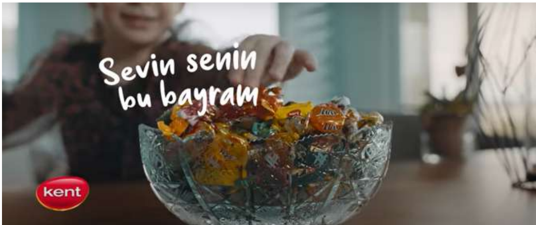
Resim 24- “Kent, Bayram” Reklamı Sekizinci Sahne

Kadının yalnız başına kitap okuması, yalnızlığın huzur verici bir şekilde karşılanabileceği ve içsel dünyayla barış yapılabileceği bir yan anlam taşımıştır. “Evin senin bu bayram” ifadesi, yalnız kalmanın aslında kişisel bir alan yaratma ve içsel tatmin sağlama fırsatı olduğuna dair çağrışım yapmıştır.