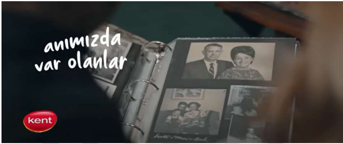
Resim 20- “Kent, Bayram” Reklamı Dördüncü Sahne

Reklamdaki Kent şekerleri, bayram sembolü olmuştur. Şeker, tatlı bir anı, mutluluk ve birliktelik simgesi olarak ele alınmıştır.