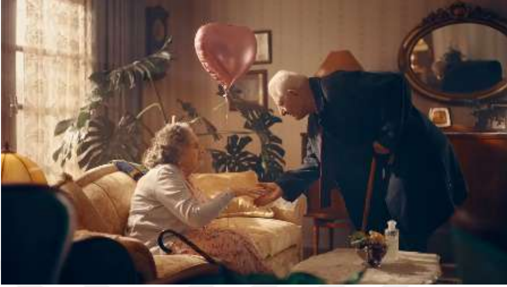
Resim 39- “Yaşın Kaç Olursa Olsun, Her Bayram Çocuk Olursun!” Reklamı Onbirinci Sahne