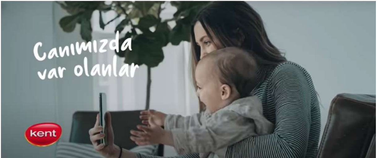
Resim 22- “Kent, Bayram” Reklamı Altıncı Sahne

Kaynak: Kent markasının resmi YouTube hesabından alındı. (Erişim Tarihi: 12.02.2024)