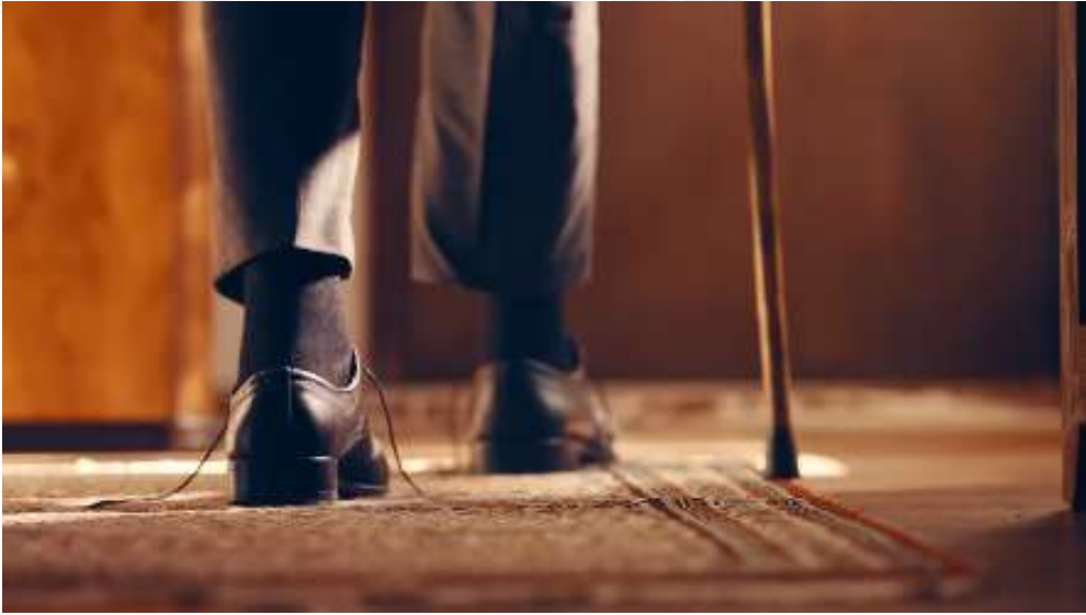
Resim 33- “Yaşın Kaç Olursa Olsun, Her Bayram Çocuk Olursun! ” Reklamı Beşinci Sahne