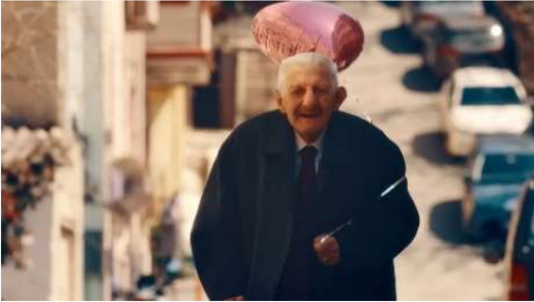
Resim 36- “Yaşın Kaç Olursa Olsun, Her Bayram Çocuk Olursun!” Reklamı Sekizinci Sahne

Kaynak: Kent markasının resmi YouTube hesabından alındı. (Erişim Tarihi: 21.02.2024)