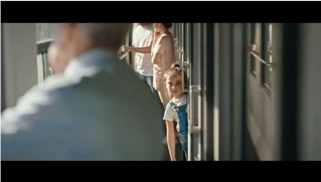
Resim 15- “Her Bayramın řekeri” Reklamı nc Sahnesi

Reklam, modern toplumda giderek unutulana saygıyı yeniden hatırlatarak, markanın yalnızca ticari bir amacının tesinde, toplumsal bir sorumluluk stlendięini ima etmiř, izleyiciyi geleneksel deęerlere ve aile baęlarına yeniden ynlendiren bir toplumsal mesaj vermiřtir. Bu sahnesiyle reklam, bireyleri gemiřle baę kurmaya, aile byklerine saygı gstermeye ve geleneksel baęları srdrmeye teřvik etmiřtir.