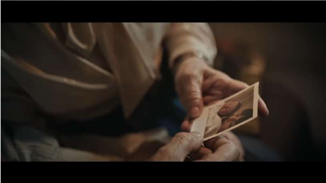
Resim 14- “Her Bayramın Şekeri” Reklamı İkinci Sahne

Demiryolu çalışanının yardım etmesi, toplumsal dayanışmanın önemini ve yaşlılara saygıyı anlatan bir yan anlam taşır. Bu, toplumun bir arada olma ve birbirine yardım etme değerlerini vurgulamıştır.