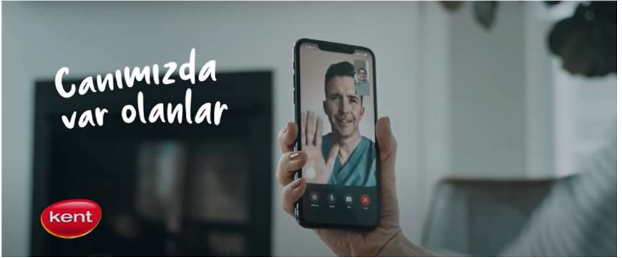
Resim 21- “Kent, Bayram” Reklamı Beşinci Sahne

Kaynak: Kent markasının resmi YouTube hesabından alındı. (Erişim Tarihi: 12.02.2024)