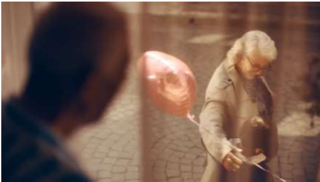
Resim 31- “Yařın Kaç Olursa Olsun, Her Bayram Çocuk Olursun!” Reklamı Üçüncü Sahne

Kaynak: Kent markasının resmi YouTube hesabından alındı. (Eriřim Tarihi: 21.02.2024)