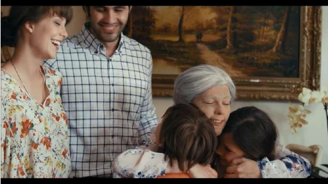
Resim 5- “Sevdiklerini Hatırlamaktır Bayram” Beşinci Sahne

Bu sahnenin miti, evlilik ve sadakattir. Yaşlanmak, sadece fiziksel değil, aynı zamanda ilişkilerdeki öğrenilmiş sadakat ve sevginin bir parçasıdır. Çiftin yaşlandıkça birbirlerine olan bağlılıkları değişmeyen bir aşkı simgelemiştir.