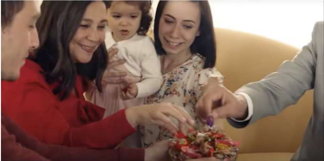
Resim 11- “Kent, Her Bayramın Şekeri Reklamı” Beşinci Sahnesi

"Evler, el öpenler, nesiller değişti her sene" ifadesi, Kent şekerlerinin evde, ailede, kutlamalarda ve geleneklerde hep var olduğunu ima etmiştir. Markanın toplumsal bağlamdaki değişime rağmen toplumda hâlâ sabırlı bir şekilde yerini koruduğunu anlatmıştır.