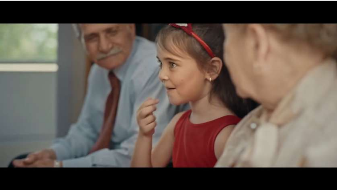
Resim 16- “Her Bayramın Şekeri” Reklamı Dördüncü Sahnesi

Yolcuların seyahatin kesintiye uğramasıyla ilgili olan hayal kırıklığı sabırsızlık, hayatın akışına karşı duyulan çaresizlik konusunda duyulan kaygıyı ifade etmiştir. Bu durum, özellikle yaşlılar için hayatta geri dönüş olmayan zamanın geçişini ve gençlerin bu geçişi anlamakta güçlük çekmesini simgelemiştir. Küçük kızın üzülen bakması, genç kuşağın, yaşlıları anlayışla karşılayıp, empatik bir tutum sergilemesi gerektiği yan anlamını taşımıştır.