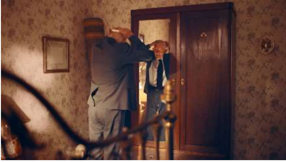
Resim 32- “Yaşın Kaç Olursa Olsun, Her Bayram Çocuk Olursun! ” Reklamı Dördüncü Sahne