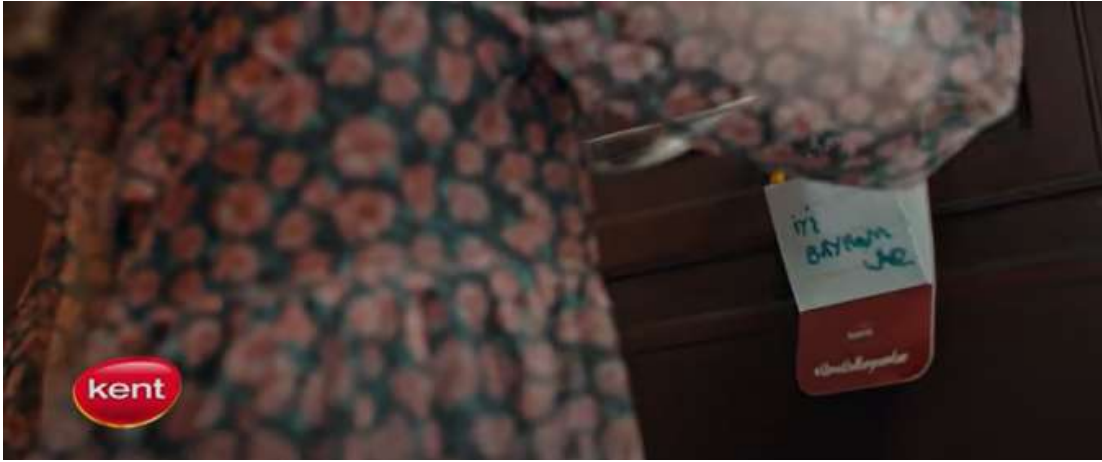
Resim 25- "Kent, Bayram" Reklamı Dokuzuncu Sahne