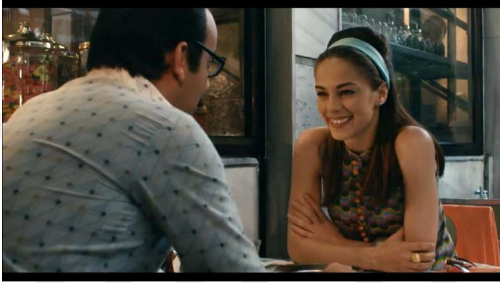
Resim 1- “Sevdiklerini Hatırlamaktır Bayram” Birinci Sahnesi

Araştırmada, Kent markasının “Sevdiklerini Hatırlamaktır Bayram” adlı reklamı çözümlenmiştir. Bu reklamda, “Sevdiklerini Hatırlamaktır Bayram” sloganı öne çıkarılmakta olup, reklamın ana teması olarak “aile” ve “aile içi iletişim” vurgulanmaktadır. Reklamda, duygusal bir atmosfer yaratmak için etkileyici müzikler kullanılmıştır.