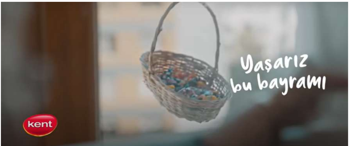
Resim 19- ‘Kent, Bayram’ Reklamı Üçüncü Sahne

Telefon ekranındaki eski aile fotoğrafları, pandeminin fiziksel mesafesine rağmen sevgi ve bağlılıkla aile bireylerini bir arada tutmanın mümkün olduğunu simgelemiştir. “Aşarız bu bayramı” mesajı, dayanışma ve umut simgesi olmuştur.