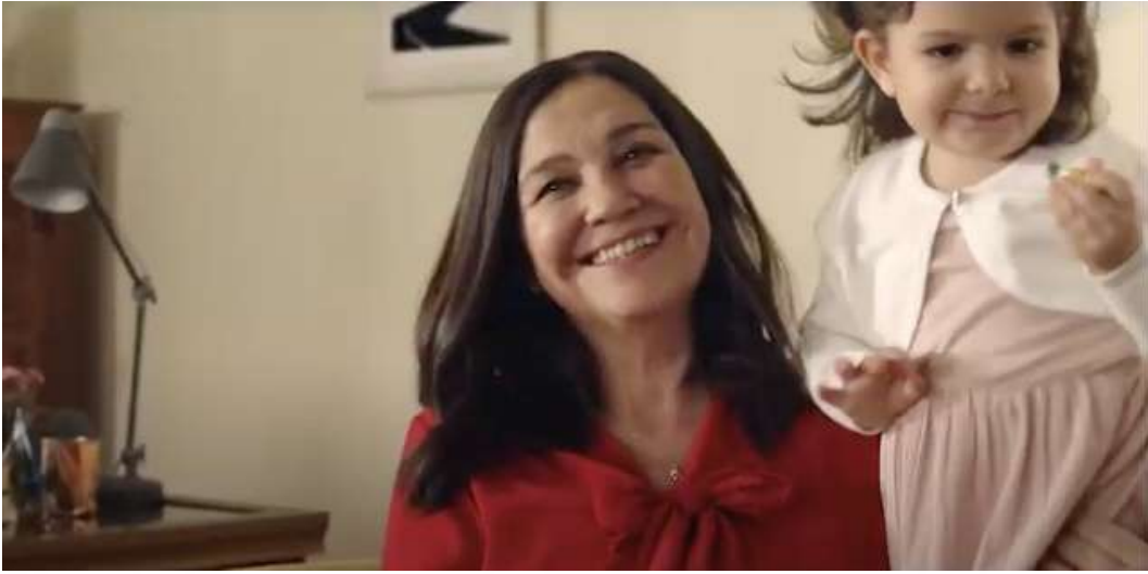
Resim 10- “Kent, Her Bayramın Şekeri Reklamı” Dördüncü Sahnesi