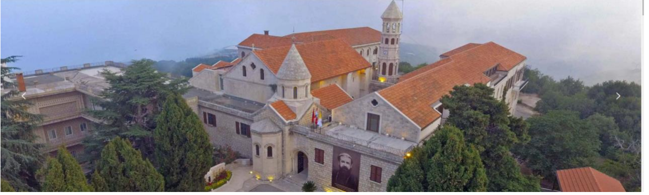
Resim 13: (Lübnan, Bzommar'daki Ermeni Katolikler'in Patriklik merkezi ) 329