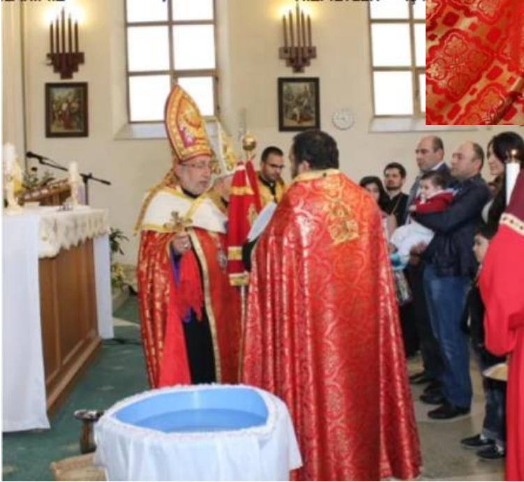
Resim 10, 11,12: (Ermeni Katolik Kilisesi'nin başı, Kilikya Patriği Katolikos Nerses Bedros XIX 'un Rusya'nın Soçi şehrine yaptığı ziyarette gerçekleştirdiği vaftiz ayininden kesit, 28 Nisan 2015, Soçi) 328