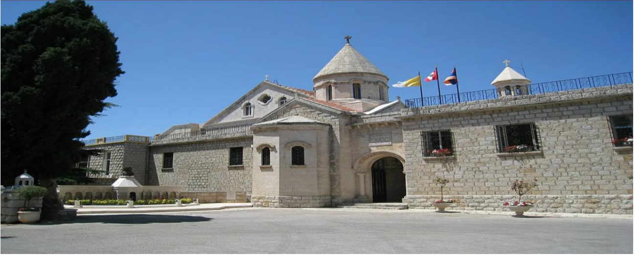
Resim 14: (Lübnan, Bzommar'daki Ermeni Katolikler'in Patriklik merkezi)