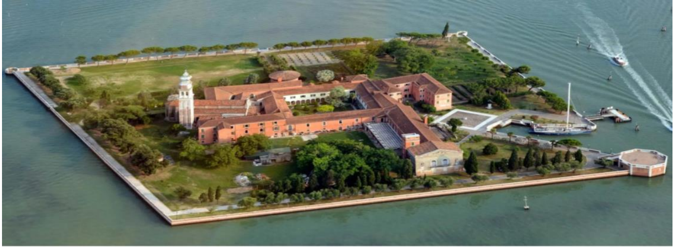
Resim 9 : ( Venedik'teki San Lazzaro Adasında Katolik Ermenilerden olan Mihitarist Cemaati'nin merkez manastırı) 327