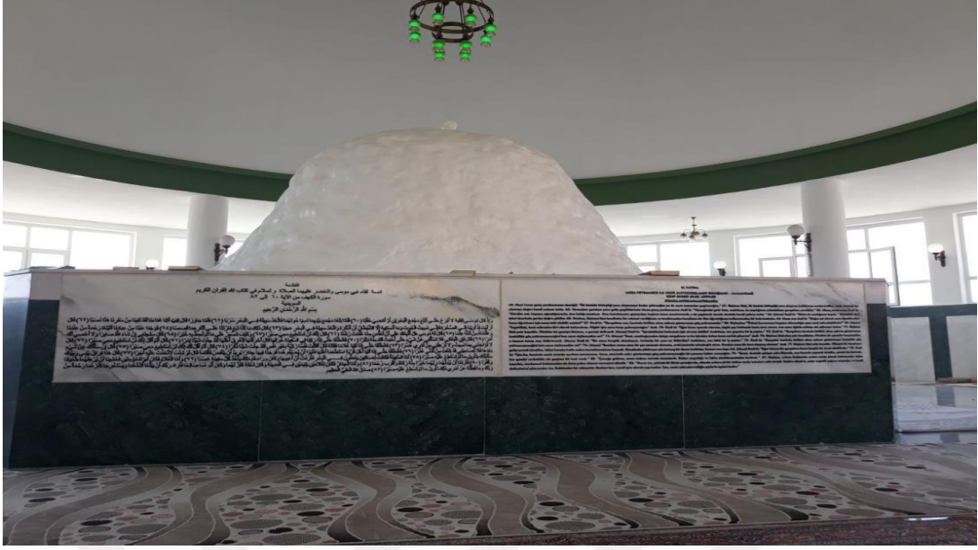
Resim - 7

-Hz. Hızır Türbesinin içerisinden bir görünüm