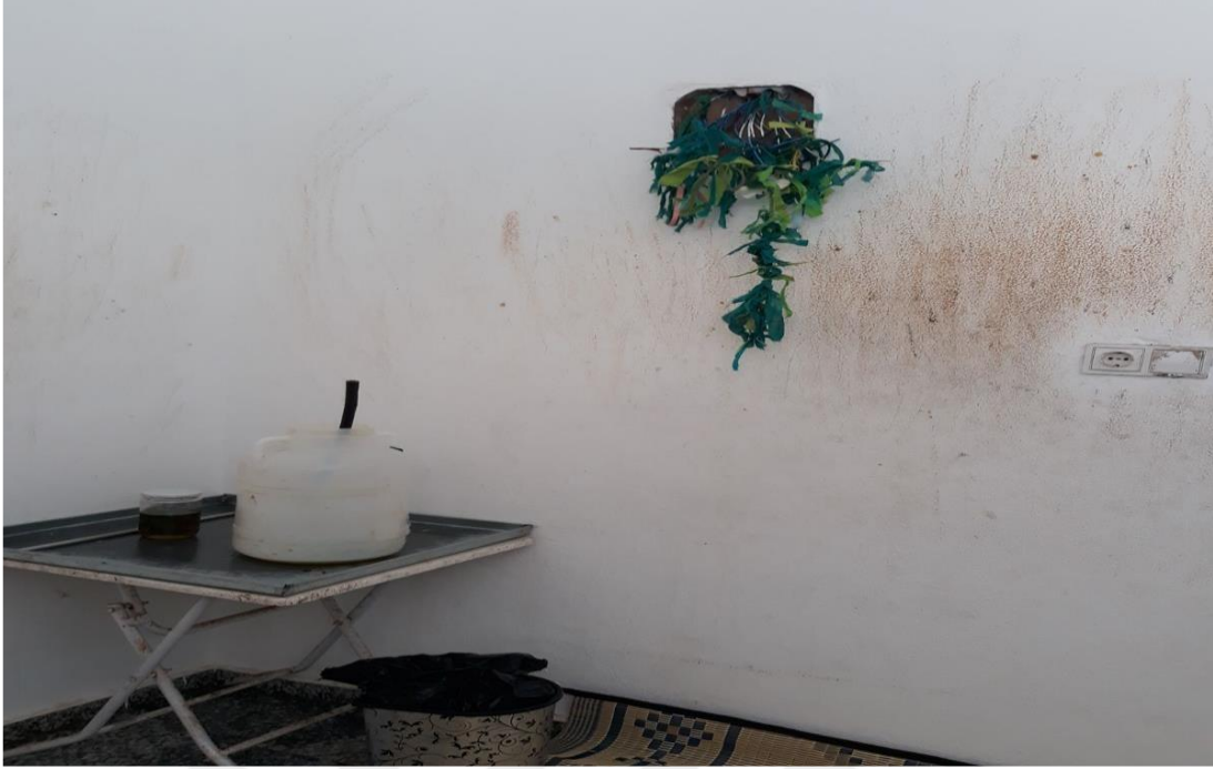
Resim – 9