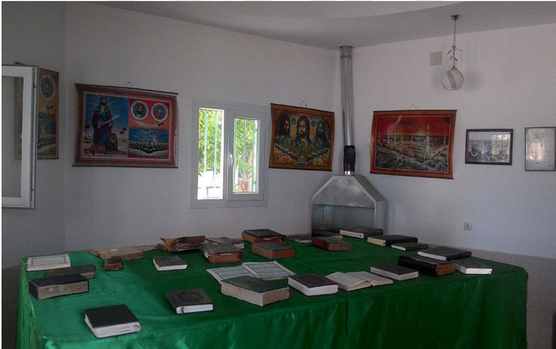
Resim -14 -Ziyarete bulunan Kur'an-ı Kerimler, çeşitli dua kitapları ve duvarda asılı olan 12 imamın temsili resimleri