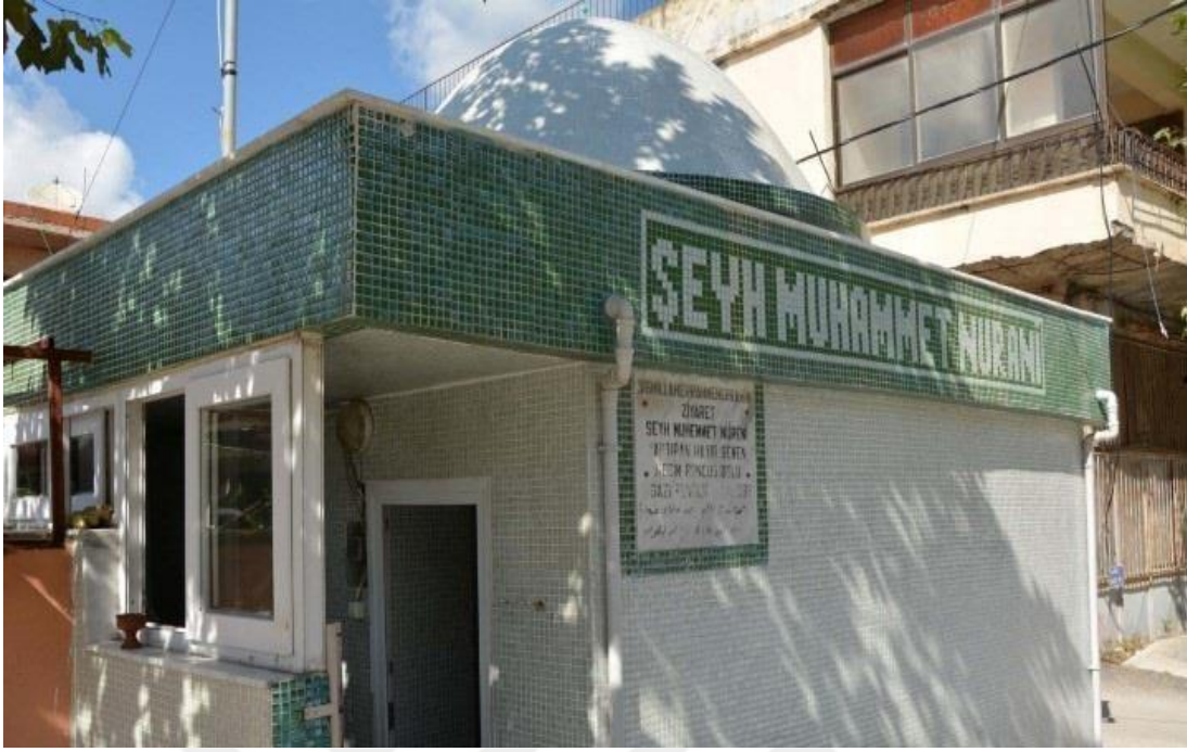
Resim - 11