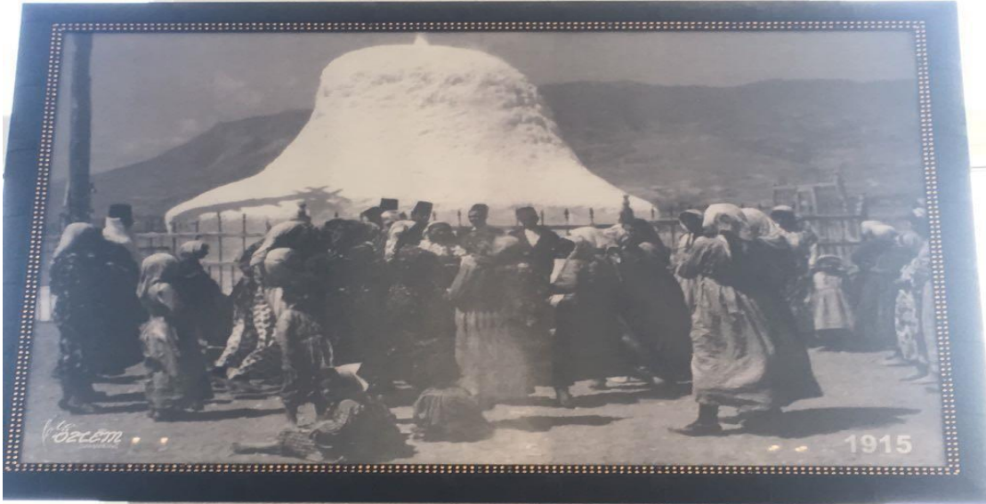
Resim - 8

-Hz. Hızır Türbesinin içerisinden bir görünüm