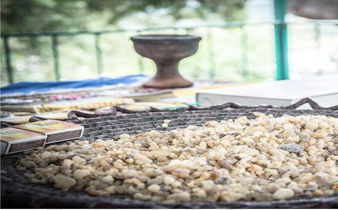
Resim – 3

-Bir ziyarette bulunan buhur ve buhurluk