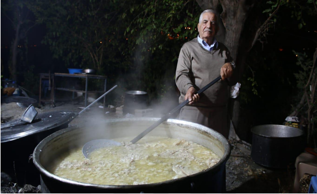
Resim - 1

-Hirisi pişirmekle görevli olan bir Nusayri