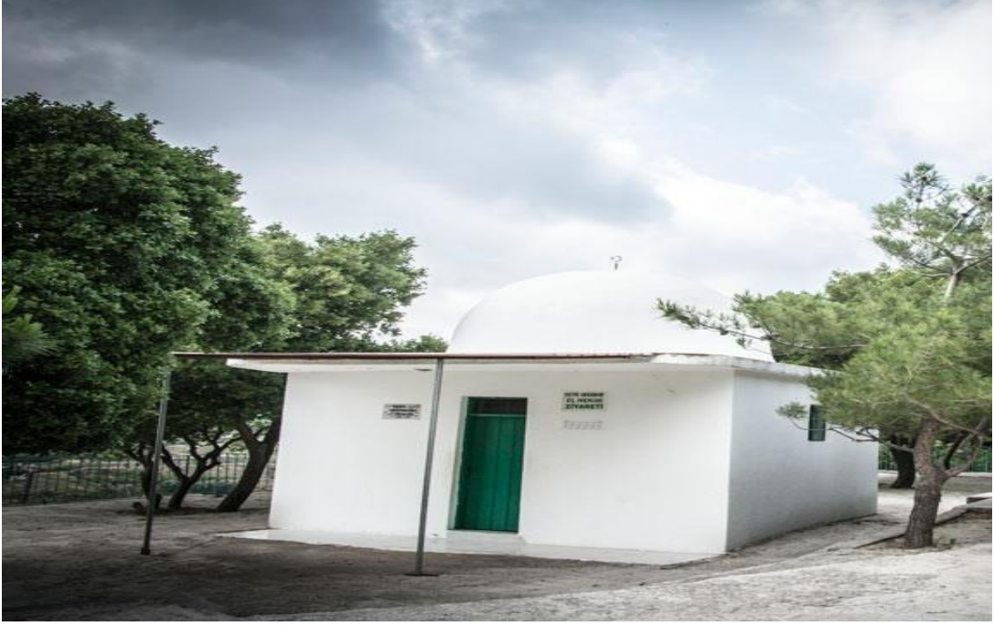
Resim - 19 -Şeyh İbrahim el-Hekim Ziyareti