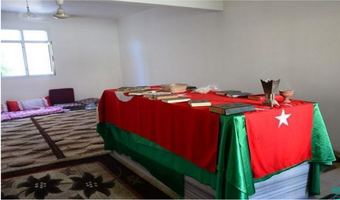
Resim – 16

-Ziyaretin içerisinde bulunan Türk Bayrağı ve yeşil kumaşlar