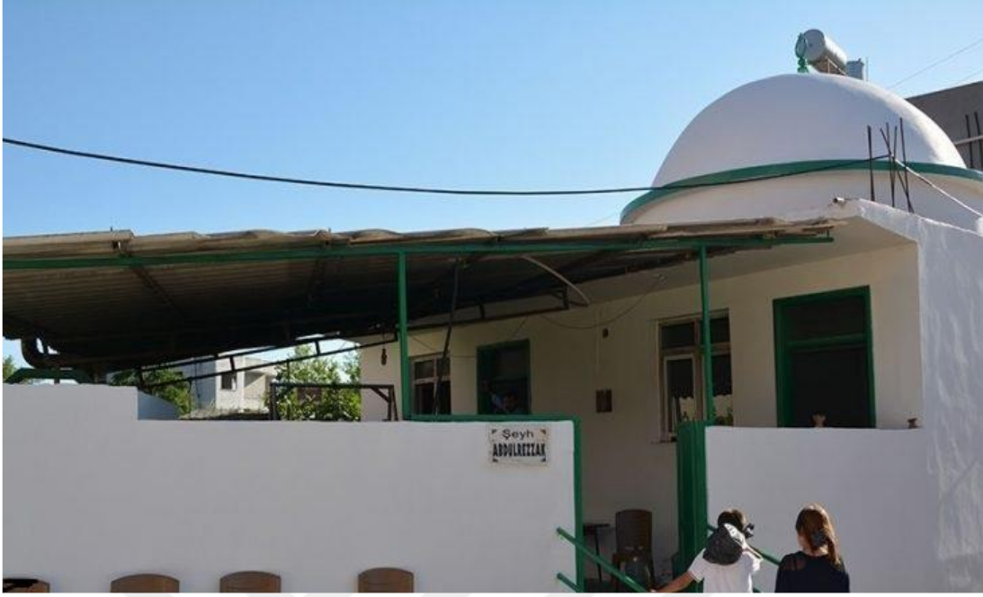
Resim - 15 - Şeyh Abdurrezak Türbesi