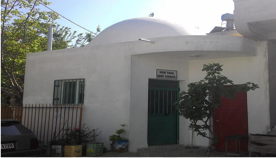
Resim -13 -Nebi Taha- Nebi Cebrail Ziyareti