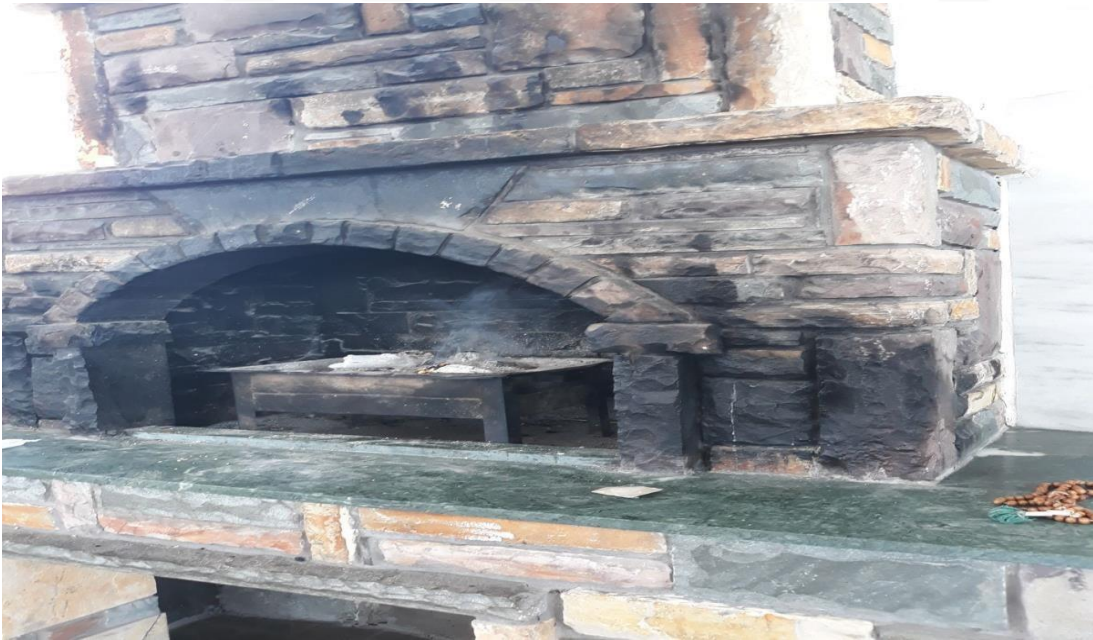
Resim - 10