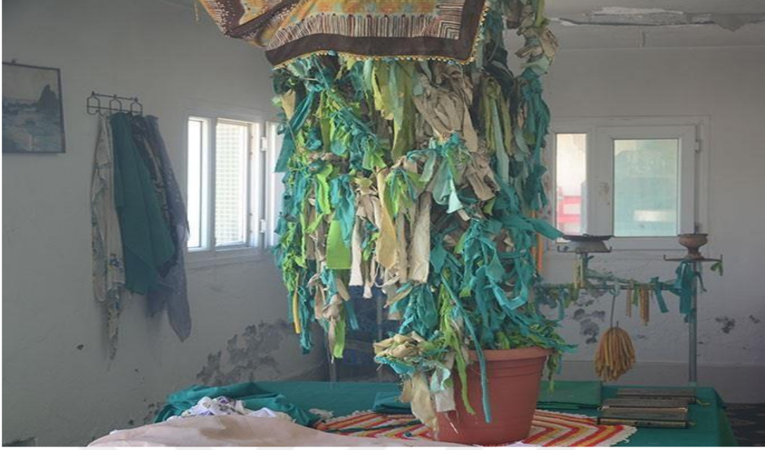
Resim – 17

-Ziyaretin içinde bulunan bitkiye dilek ve duaların kabulü için bez bağlanması