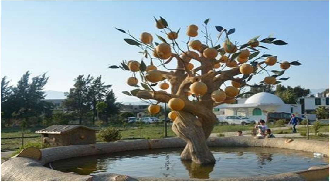
Resim – 18

-Ziyaretin içinde bulunan bitkiye dilek ve duaların kabulü için bez bağlanması