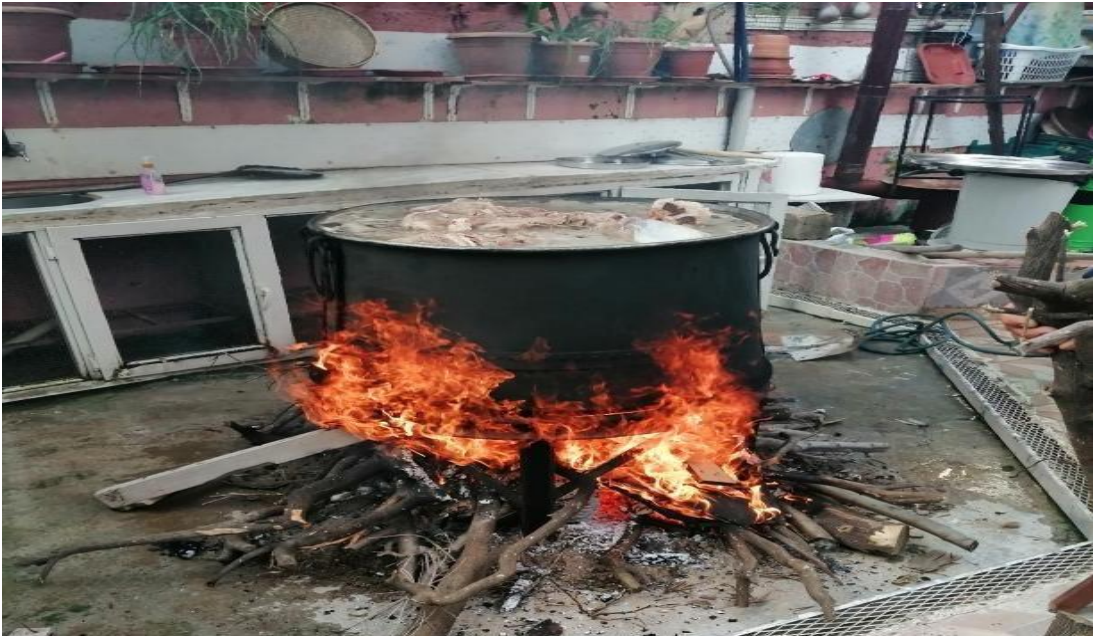
Resim – 2

-Hirisi pişirmekle görevli olan bir Nusayri