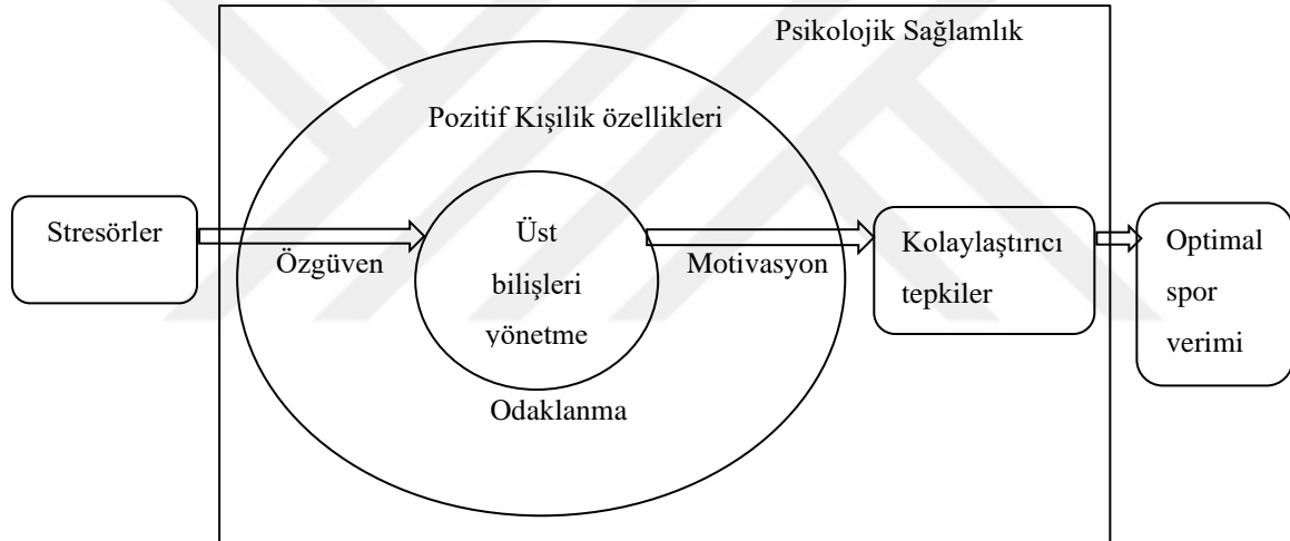
Şekil 2. Psikolojik sağlamlık temelli optimal spor performansı kuramı

Psikolojik sağlamlık üzerindeki bireysel koruyucu faktörlere değinen bu kuram Şekil 2'de özetlenmiştir.