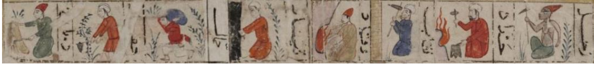
Resim 1: Kitâbü'l-Bülhân . Bodleian Library, Or. 133. 25b-26a.

Zuhal yıldızı ile ilişkilendirilmiş olan debbâğlık mesleğine de olumsuz bir şekilde bakıldığı muhakkaktır.