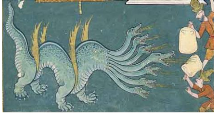
Resim 3: Levnî’nin çizimiyle 1720 şenliğinde bir gece gösterisi sırasında sergilenmiş olan her bir ağızdan ateşler saçan yedi başlı ejderha maketi (Atıl 1999: 200)

Âlî, Câmi‘ü’l-Buhûr der-Mecâlis-i Sûr , 1400-1403