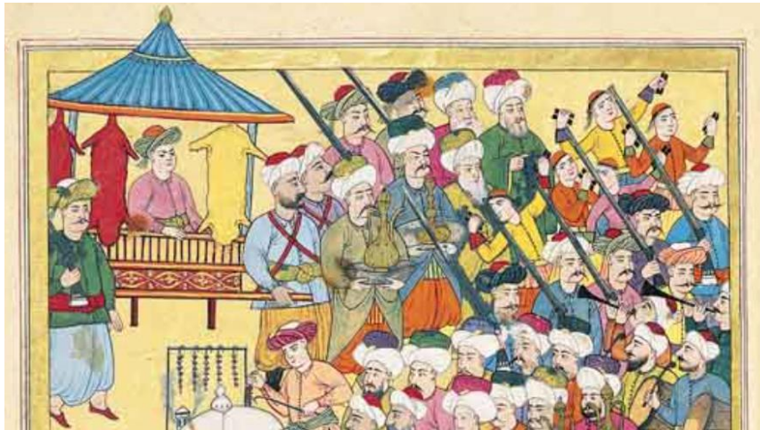
Resim 4: 1720 şenliğinde düğünün 6. gününde başlayan esnaf alaylarının ilk gününde geçiş yapan debbâğ esnafı (Atıl 1999: 180).

Ve bi'l-cümle anlar dahî ol zîbâ hediyye vü tuhfelerin kimi telâtîn-i reng-â-reng ki her birisi seyyâre-mânend nezâketle zîbâ dânelenmiş ve her dânesi şeffâf ciheti ile necm-i dürrî ve Süheyl-i yemîniyi alındurup a'lâ öründülenmiş. Mâ'îsinün her mevci letâfet ciheti ile dillerde cârî ... cûd u revâyah-i tayyibeleri şâm-ı zemîn ü zamânı mu'attar idüp dil husûli muhakkakdur ikdâm-ı tâm ile ele getürmüşler ve ol san'atda her ol hediyye ki Süheyl-i yemenî tabî'atı te'sîri ile müyesserdür envâ'-ı ihtimâm ile sûrete ırgürmüşler. Atebe-i aliyyeye ol hedâyâ-yı mütenevvi'a ve tehâyâ-yı müteberrikeyi îsâl idüp ba'de husûli'l-merâm bu ebyâtı okuyup revâne oldılar... (Arslan 2009a: 272-274)