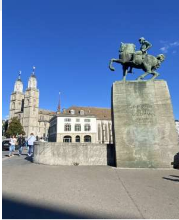
Resim 1.8. Grossmünster Kilisesi'nin dışı 260