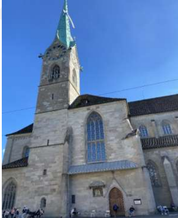
Resim 1.14. Fraumünster Kilisesi, Zürih 266