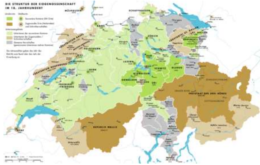
Resim 1.3. Eski İsviçre Konfederasyonu'nun Siyasi Haritası 255