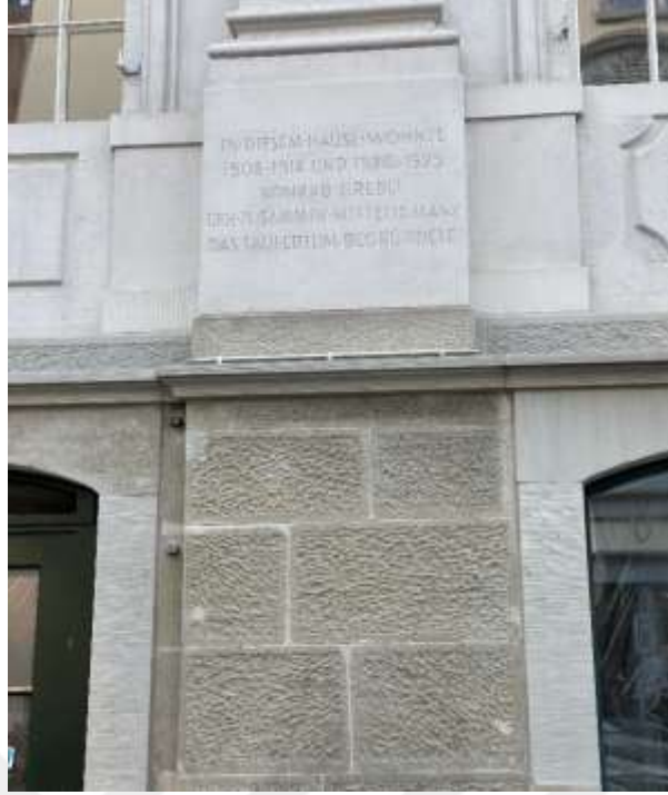
Resim 1.17. Anabaptist hareketinin kurucularından Kongrad Gebel ve Melix Manz evi 269