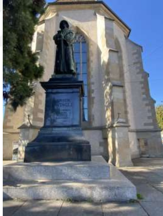
Resim 1.12. Zwingli'nin bir elinde kılıcını diğer ellinde İncil'i bulundurduğu anıtı 264