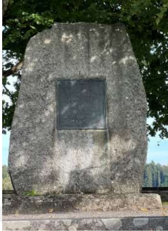
Resim 1.19. Zwingli'nin İkinci Kappel Savaşı'nda öldürüldüğü meydan 271