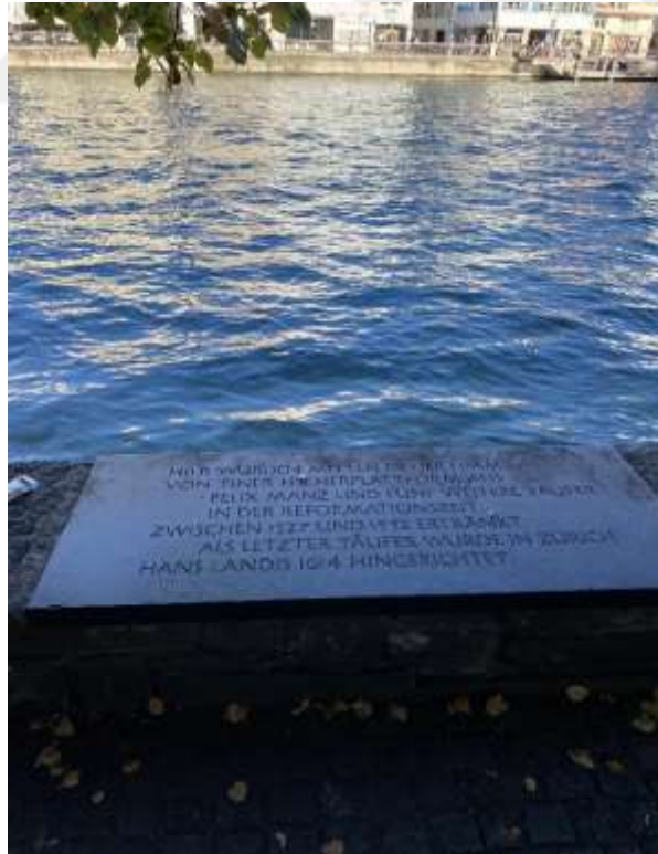
Resim 1.18. Vaftizcilerin boğularak öldürüldüğü yer, Zürih 270