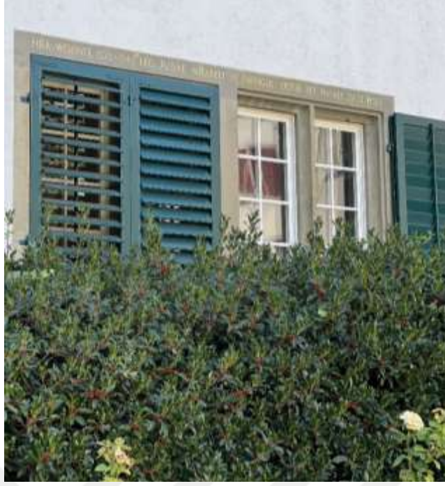
Resim 1.15. Zwingli'nin arkadaşı Leo Jud'un yaşadığı evi 267