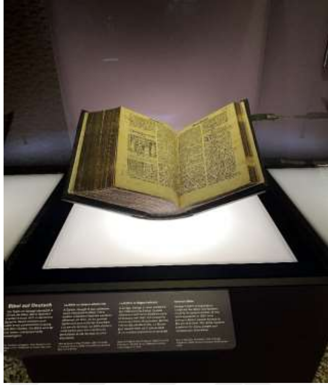
Resim 1.9. Zwingli'nin arkadaşlarıyla Almancaya tercüme ettiği tasvirli Zürih İncil'i 261