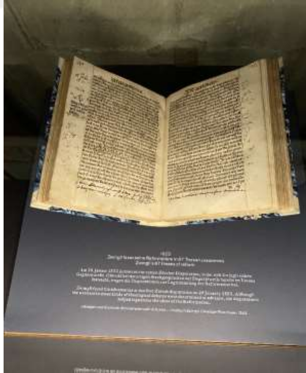
Resim 1.10. Zwingli'nin 1523'te oluşturmuş olduğu altmış yedi tezi 262