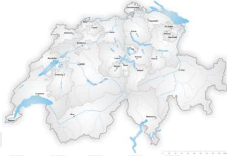
Resim 1.1. İsviçre'nin Coğrafi Haritası. 253