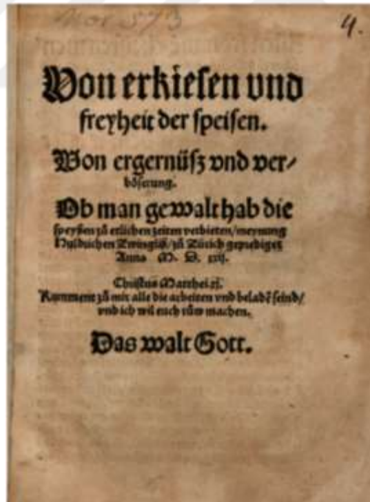
Resim 1.20. Zwingli'nin "Von Erkiesen und Freiheit der Speisen" adlı yazısı, Nisan 1522 272