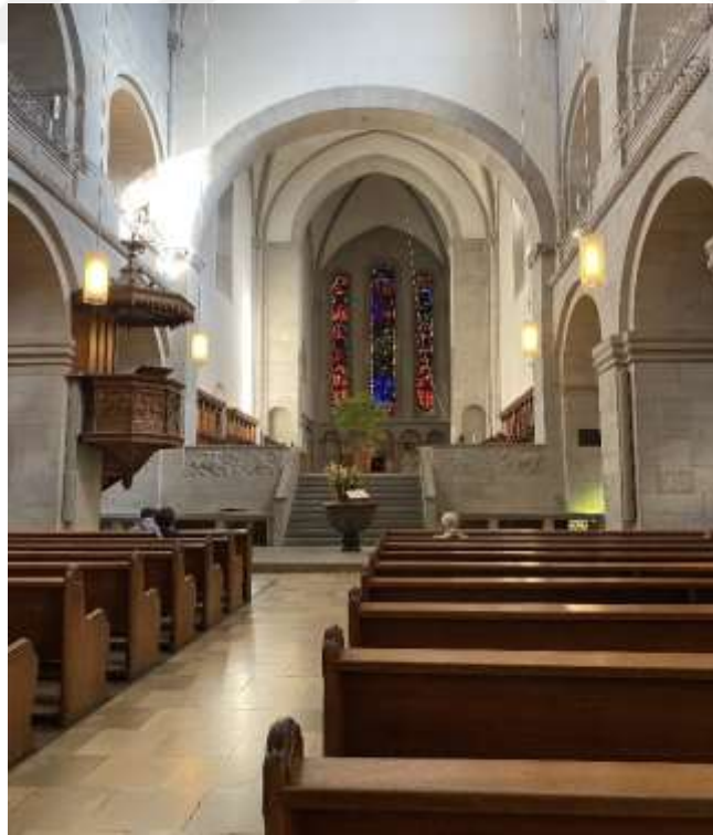
Resim 1.6. Grossmünster Kilisesi'nin içi 258