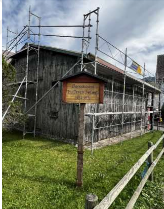
Resim 1.4. Huldreich Zwingli'nin Wildhaus'ta doğduğu ev 256