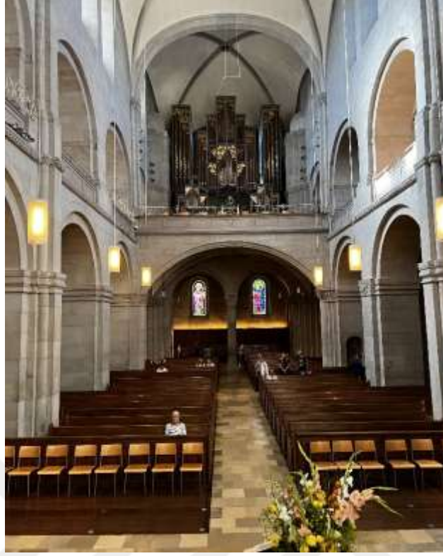
Resim 1.7. Grossmünster Kilisesi'nin içi 259