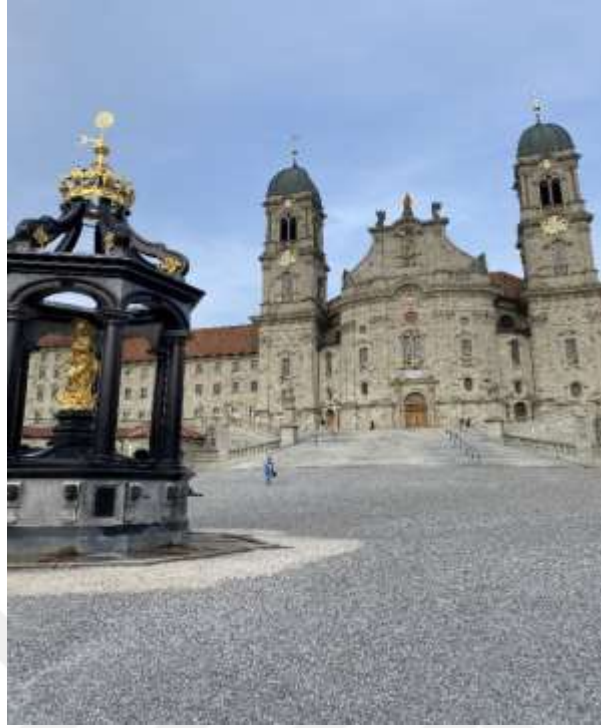
Resim 1.5. Zwingli'nin Einsiedeln'de rahiplik yaptığı manastır (Kloster Einsiedeln) 257