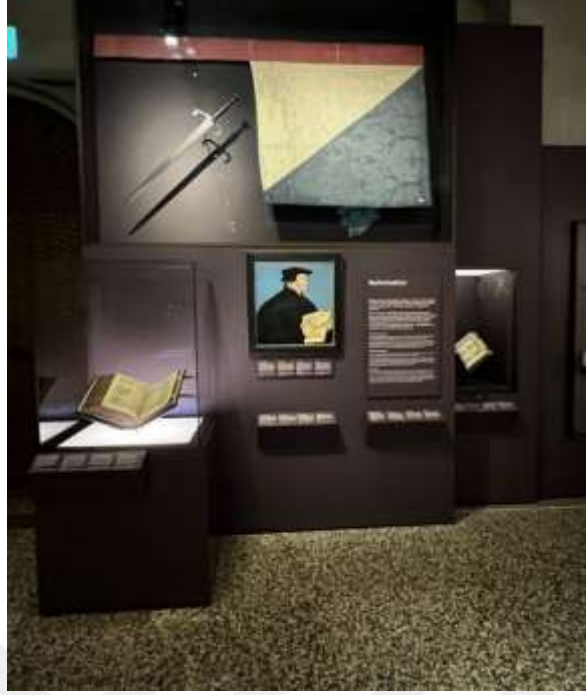
Resim 1.11. Zwingli'nin Kappel savaşında kullandığı kılıç ve sancağı 263