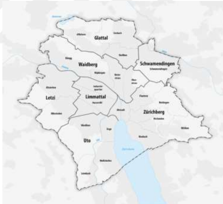
Resim 1.2. Zürih'in Coğrafi Haritası 254