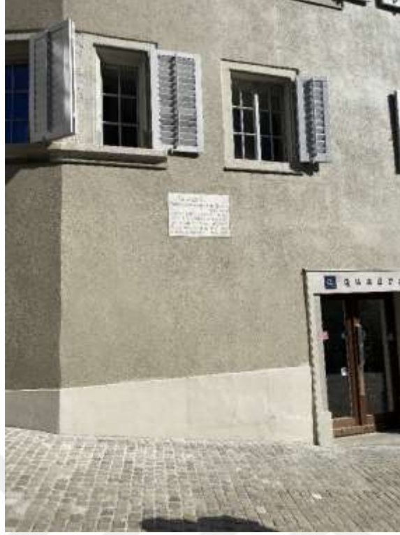
Resim 1.13. Zwingli'nin Zürih'teki evi 265