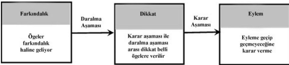
Şekil 2. Dikkat Süreci