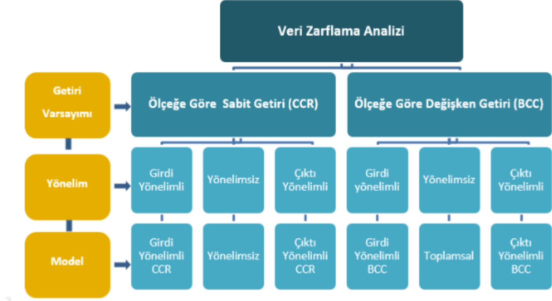
Şekil 1: VZA Yöntem ve Yaklaşımları