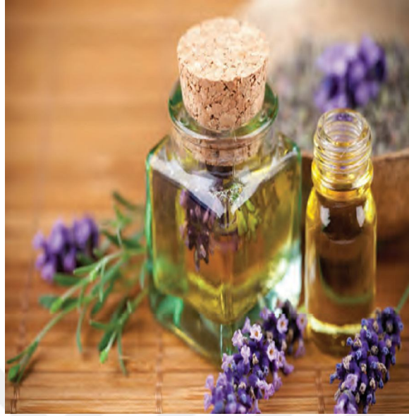
Resim 9: (2018) 5. Sınıf Sosyal Bilgiler Ders Kitabı Anadol Yay 141.

“Leyla’nın babası çiftçilikle uğraşan biridir. Tarlalarına ektikleri buğday iklim şartlarına göre olduğu için Leyla alternatif bir ürün araştırıp lavanta ile ilgili bilgi toplamıştır. Ziraat mühendisi Aysel Hanımdan bu ürünün yetiştirme şartlarını öğrenen Leyla ile anne babası ve kardeşi ile istişare ederek tarlalarına lavanta ekme kararı vermişlerdir.” (Metin 4, 2018: 5/142). Kitaptaki metinden özetlenen bu noktada dikkat çekilecek husus ailedeki kız çocuklarının fikirlerine ve görüşlerine önem verip bunu değerlendirmektir. Ayrıca sadece baba değil bu konuda tüm aile bireyleri karar vermiştir. Günümüz toplumsal cinsiyet eşitliğine dayanan aile yapısında istenilen ve önemsenen noktalar buralardır. Sadece erkeğin değil tüm ailenin düşünceleri değerlidir.