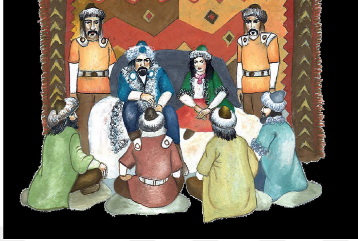
Resim 10: (2018) 6. Sınıf Sosyal Bilgiler Ders Kitabı Meb Yay 43.

Ders kitabında yer alan bu haberde Hunlarda kadın savaşçıların olduğu ve günümüzde yapılan kazılarda da bu kadınlara ait takılar bulunduğu belirtilmektedir. Bu haberden de kadınların savaşçı olmak için özel bir eğitim aldıkları sonucuna varabiliriz. Şimdilerde kadın- erkek eşitliğinin sağlanması, kadın haklarının korunması, eğitim hakkı vb konularda belli bir seviyeye gelmeye çalışırken eski Türklerde kadınların gayet mühim konumda yer aldıkları görülmektedir.