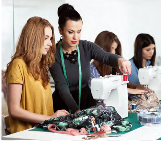
Resim 17: (2018). 7. Sınıf Sosyal Bilgiler Ders Kitabı Meb Yay.178.