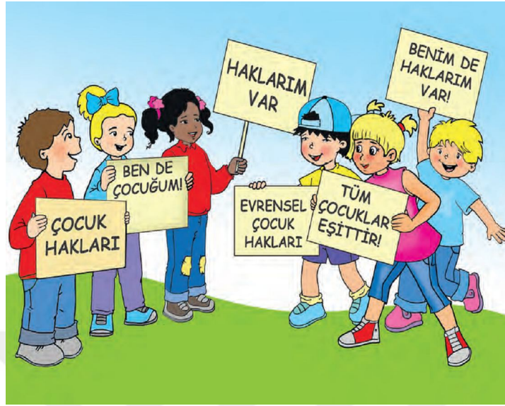
Resim 3: (2018) 4. Sınıf Sosyal Bilgiler Ders Kitabı, Tuna Yay. 152.

“... Biz kağınlarıyla yalın ayak cepheye mermi taşıyan annelerimizi, bu vatan uğruna canını veren şehitlerimizi unutamıyoruz...” (Metin 1, 2018: 4/169) cümleleriyle vatanın nasıl kurtarılp zaferin nasıl kazanıldığına vurgu yapılan yukarıdaki resim de esasen tüm zorluklarda kadınların en ön safta yer almaktan kaçınmadığına güzel bir örnek teşkil etmiştir.