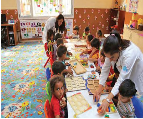
Resim 7: (2018) 5. Sınıf Sosyal Bilgiler Ders Kitabı Anadol Yay 28.

Adana'da mevsimlik tarım işçisi ailelerin çocuklarına yönelik okul öncesi eğitim sınıfı kuruldu. Yüreğir Belediyesinden yapılan yazılı açıklamaya göre Doğan kent Mahallesi'nde, tarım işçilerinin çocuklarına okul öncesi eğitim vermek üzere sınıf açıldı. Her gün 25 çocuğun kaldıkları yerlerden araçla alınarak sınıfa getirildiği, öğrencilerin çeşitli etkinliklere katıldığı belirtildi.