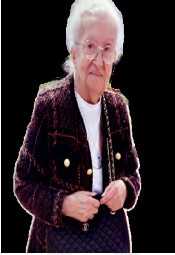
Resim 11: (2018) 6. Sınıf Sosyal Bilgiler Ders kitabı Meb Yay.130.

Nüzhet Gökdoğan, İstanbul'da doğmuş ve eğitiminin büyük bir bölümünü burada tamamladıktan sonra Fransa'ya gitmiştir. Gökdoğan, yurda döndüğünde İstanbul Üniversitesinde görev almıştır. Burada Gök Mekanığı ve Astronomi ile ilgilenmiş ve üniversitenin yerleşkesine bir de gözlemevi kurdurmuştur. O, aynı zamanda 1948'de bazı öğretim üyeleriyle birlikte Türk Matematik Derneğini, Türk Üniversiteli Kadınlar Derneğiyle Türk Astronomi Derneğini kurmuştur. Gökdoğan, aynı zamanda Astronomi bölümüne 46 yıl hizmet etmiştir.