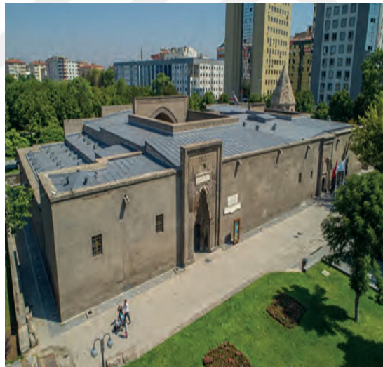
Gevher Nesibe Darüşşifası

Milli mücadele yıllarında da erkekleri cephede savaşan kadınların çok büyük fedakârlıkları olmuştur. Kara Fatma, Şerife bacı, Tayyar Rahmiye bunlardan sadece birkaçıdır. Günümüzde ise kadınlar iş yaşamında da aktif olarak yer almaya başlamış, çeşitli sektörlerde iş imkânına sahip olmuşlardır. Ders kitabında yer alan girişimci kadın ile ilgili haber güzel bir misal teşkil etmektedir.