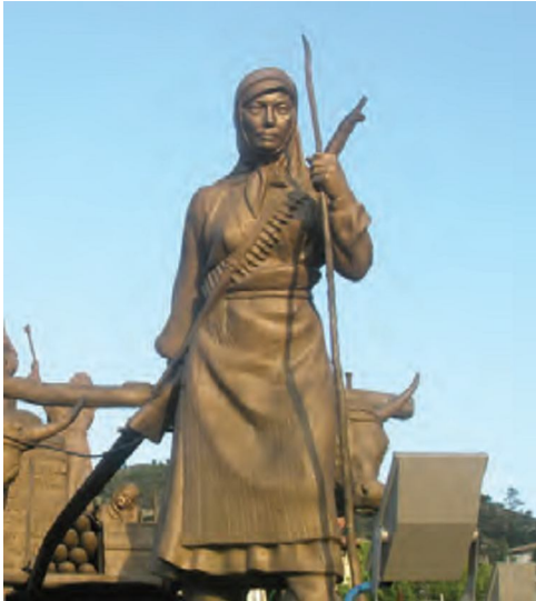
Resim 2: (2018) 4. Sınıf Sosyal Bilgiler Ders Kitabı, Tuna Yay. 57.

Şerife Bacı İnebolu'dan Kastamonu'ya kağınıyla cephaneyi taşıyordu. Genç kadın bir seferinde kafilisinin gerisinde kaldı. Buna rağmen sürekli yağın altında gece boyunca yoluna devam etti. Cephaneyi yüklü kağınısıyla Kastamonu Kışlası önüne kadar gelebildi. Ancak şehre girmeye gücü yetmedi. Bu kahraman Türk kadını, yorganını taşıdığı top mermilerinin üzerine örterek kıymetli yükünü korumak istemişti. Kendisi de kollarını açarak yorganın üzerine kapanmış hâlde soğuktan donakalmıştı.