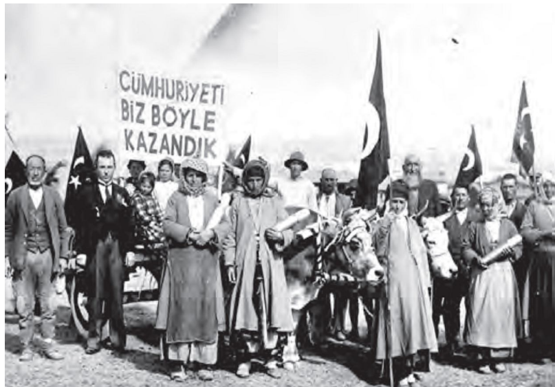
Resim 4: (2018) 4. Sınıf Sosyal Bilgiler Ders Kitabı, Tuna Yay 167.

“... Biz kağınlarıyla yalın ayak cepheye mermi taşıyan annelerimizi, bu vatan uğruna canını veren şehitlerimizi unutamıyoruz...” (Metin 1, 2018: 4/169) cümleleriyle vatanın nasıl kurtarılp zaferin nasıl kazanıldığına vurgu yapılan yukarıdaki resim de esasen tüm zorluklarda kadınların en ön safta yer almaktan kaçınmadığına güzel bir örnek teşkil etmiştir.