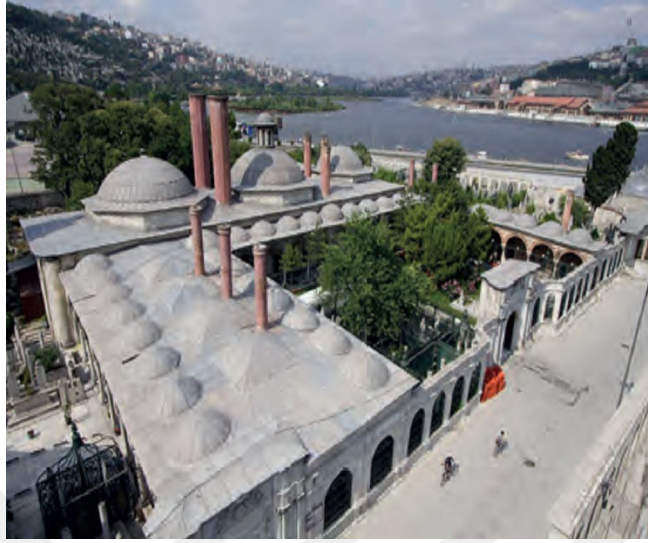
Mihrişah Sultan İmaretî