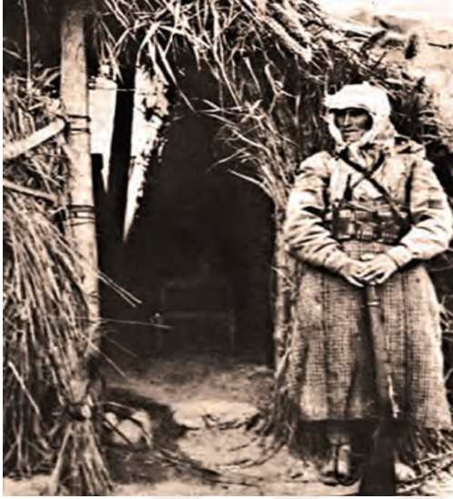
Resim 1: (2018) 4. Sınıf Sosyal Bilgiler Ders Kitabı, Tuna Yay. 52.