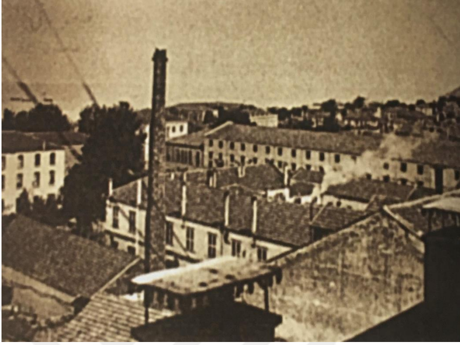
Şekil 2.3.1. 1887 yılında faaliyete geçen Samsun Reji Sigara Fabrikası