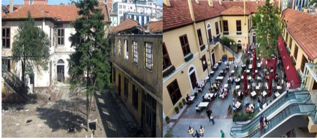
Şekil 2.4.1. Mekânın atıl hali ve alışveriş merkezine dönüşümü

merkezi şeklinde olmuştur. Mekânın yeniden değerlendirilmesi hususu başta belediyeye devredilirken kültür ve ticaret merkezi olarak düşünülse de bu projeye yatırım yapılmadığı için gerçekleştirilememiştir. 1997’de tasfiye edilen mekân, 2006 yılında yenileme alanı olarak ilan edilmiştir. 12 yılın ardından 2009’da belediye tarafından ihaleye açılmış ve Torunlar GYO ve Turkmall Şirketler Grubu tarafından 30 yıllık bir süre için kiralanmıştır. Bu süreçte de otel olarak değerlendirilmesi gibi farklı fikirler yer alsa da karar alışveriş merkezi olarak değerlendirilmesi yönünde alınmıştır. Mekân, 2012 yılında Bulvar Alışveriş ve Yaşam Merkezi adıyla halkın kullanımına açılmıştır.