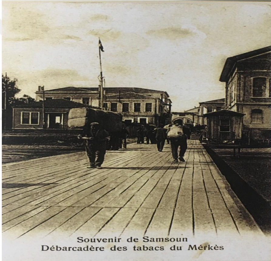
Şekil 2.3.5. Tütün iskelesi

Şehrin kalbinde yer alan fabrikanın ülkeye ve bölgeye ekonomik katkılarının yanı sıra kültürel olarak da bir dönüşümü beraberinde getirdiği anlaşılmaktadır. Sanayileşme ile paralel şekilde ortaya çıkan üretim mekânları yalnızca fabrikalarla sınırlı kalmamıştır. Fabrika henüz Reji İdaresi'ndeysen, tütün üretimi şehirde yaygınlaşmaya başladıkça özgül mekânlar ve birimler de oluşmuştur. Örneğin; tütün fabrikası yerleşkesinin yanında, tütün alım satımının yapıldığı Duhan (Tütün) Çarşısı, tütünlerin depolandığı ambarlar ve tütün iskelesi gibi mekânlar kentin önemli mekânları haline almıştır (Keskin ve Yaman, 2013: 155).