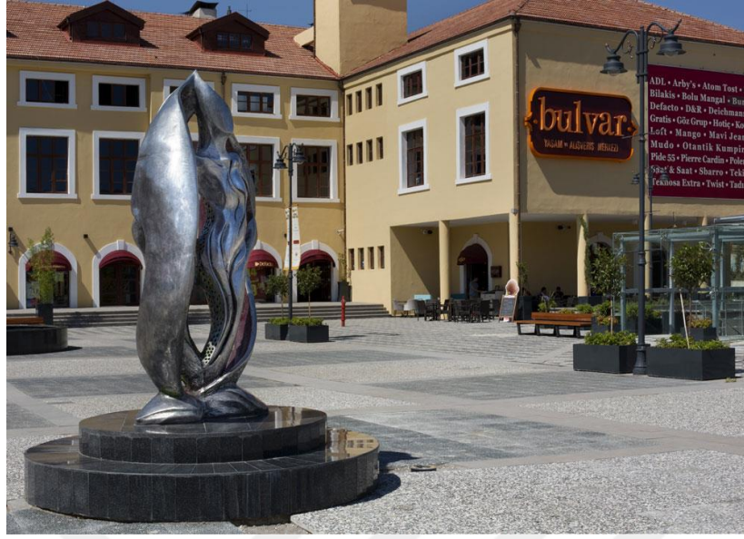
Şekil 2.4.3. Tütün Heykeli

(Bulvar Avm ve Yaşam Merkezi, Galeri, Erişim: 20.04.2021)