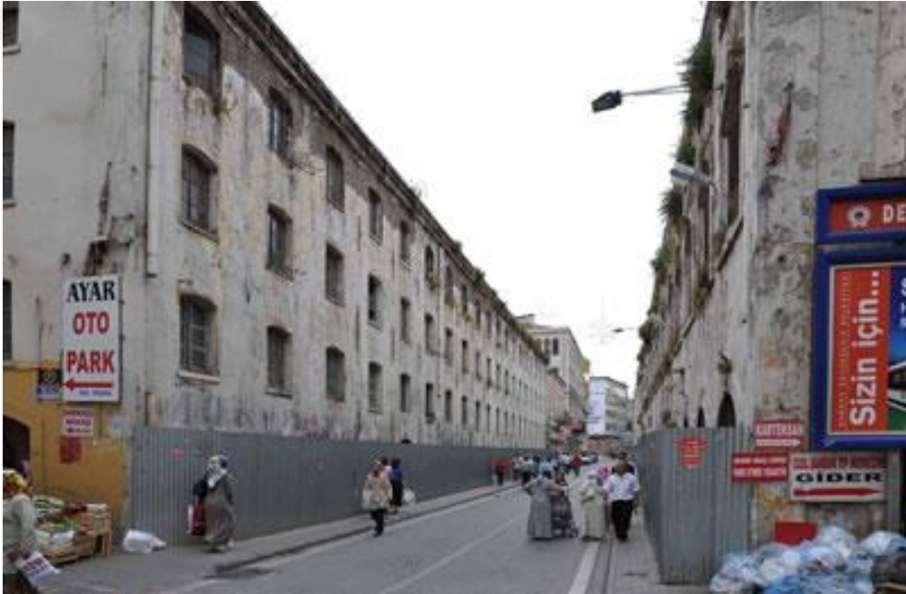
Şekil 2.3.6. Samsun Tütün Fabrikası atıl hali

Fabrika işlevini yitirmesinin ardından Samsun Büyükşehir Belediyesi'ne devredilmiştir ancak fabrika devredilmesinin ardından uzun yıllar atıl vaziyette kalmıştır. Atıl durumun bu mekânı zamanla yıprattığı ve tahrip ettiği çok açıktır. Çünkü mekânı caddeden ve insanlardan ayıran herhangi bir koruma uzun bir süre sağlanmamıştır. Son yıllarda görselde görüldüğü gibi metal bariyerler konulmuştur.