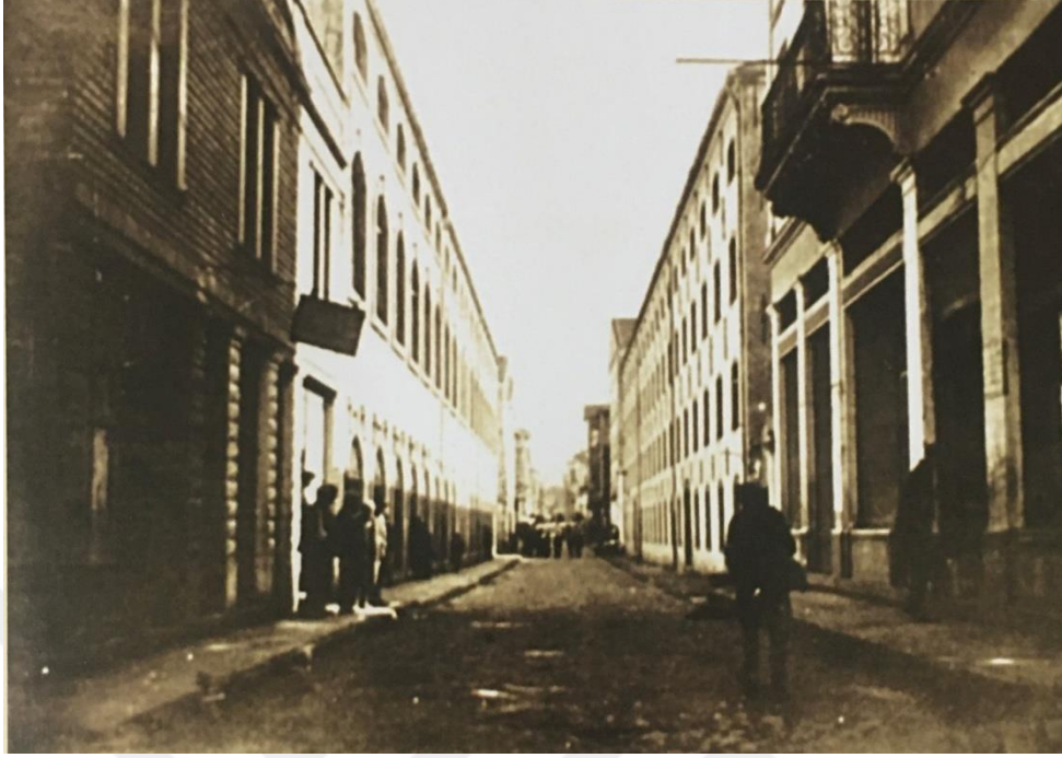
Şekil 2.3.2. Reji Sigara Fabrikası ve tütün depoları