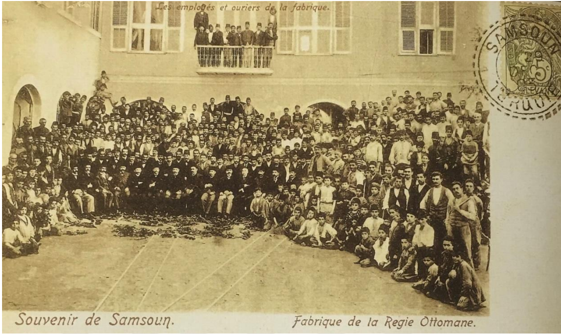
Şekil 2.3.3. Samsun Reji Sigara Fabrikası çalışanları toplu halde