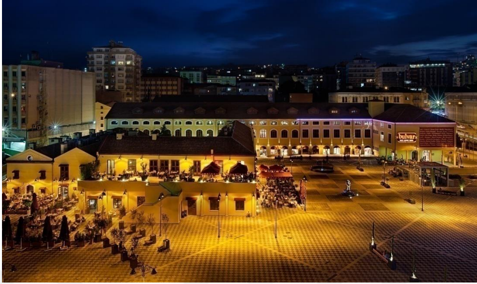
Şekil 2.4.2. Bulvar Alışveriş ve Yaşam Merkezi genel görünüm

(Bulvar Avm ve Yaşam Merkezi, Galeri, Erişim: 20.04.2021)