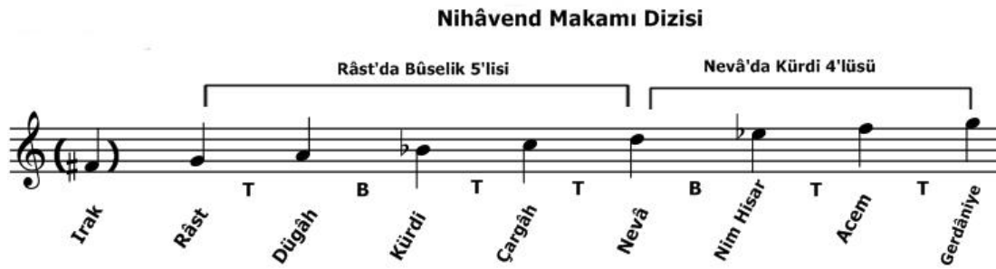
Şekil 4: Nihavend Makamı Dizisi

Kürdi ve Nim Hisar perdelerindeki bir bemollük fark dikkate alınmaz. Kararı: Sol-rast perdesidir.