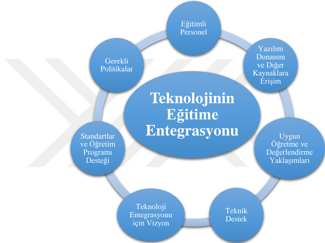
Şekil 1: Teknolojinin Eğitime Entegrasyonu

Kaynak: Roblyer, 2006, Akt. Mısırlı, 2013:9