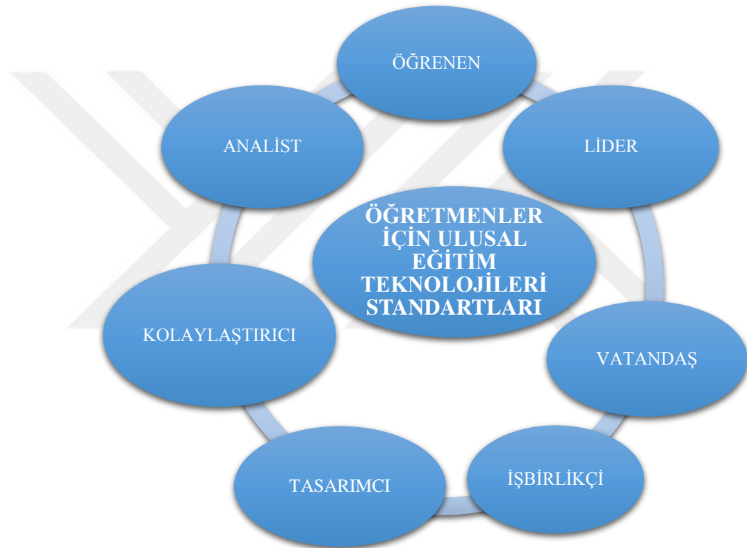
Şekil 3: NETS*E : Öğretmenler İçin Ulusal Eğitim Teknolojisi Standartları

Educators) olarak adlandırılmıştır ve son hali Şekil 3’te görülen, 7 ana başlık altında yer alan toplam 24 alt maddeye sahiptir. Bu alt maddelerin her biri öğretmenlerin sahip olması gereken eğitim teknolojisi standartlarını anlatmaktadır (ISTE, 2019).