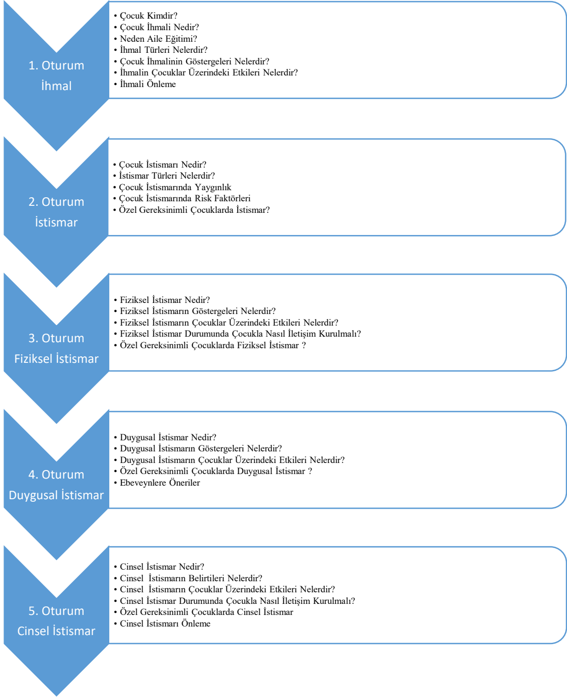
Şekil 3. 2 Eğitim oturumları ve kazanımları

Şekil 3. 2’ de belirtildiği şekilde ilk oturum “çocuk kimdir, çocuk hakları nelerdir ve neden bir aile eğitimine ihtiyaç var” kazanımları ile eğitim oturumuna başlanmıştır. İlk oturumda “ihmal nedir, ihmal türleri nelerdir, ihmalin göstergeleri ve çocuk üzerindeki etkileri nelerdir, ihmali önleme” alt başlıkları ile oturuma devam edilmiştir. Oturum sonunda bazı görseller verilerek hangi ihmal türüne örnek olduğunu bulma ile ilgili etkinlik yapılmıştır. İkinci oturumda istismar nedir, istismar türleri nelerdir,