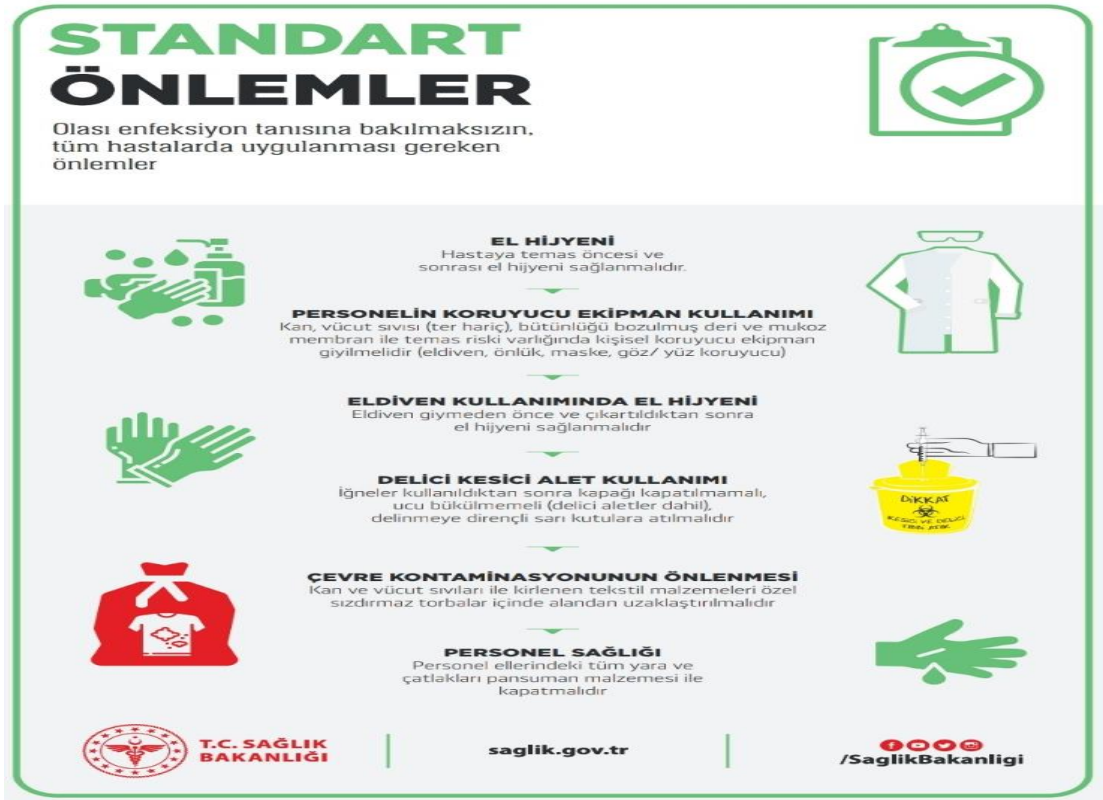
Şekil 2.1. T.C. Sağlık Bakanlığı COVID-19 Standart Önlemler Broşürü ( https://covid19.saglik.gov.tr/TR-66260/saglik-personeline-yonelik.html )

COVID-19 enfeksiyonlarında enfeksiyon tanısına bakılmaksızın, tüm hasta ve hasta olabilecek kişilerde uygulanması gereken önlemleri içerir. Ülkemizde Sağlık Bakanlığı hem vatandaşları, hem de olası enfeksiyona maruz kalabilecek herkesi bilgilendirmek amacıyla enfeksiyon önlemleri, izolasyonlar ve koruyucu ekipman kullanımı hakkında broşürler oluşturmuştur. Bu broşürler hastaneler, halk sağlığı merkezleri ve ağız ve diş sağlığı merkezleri gibi enfeksiyona daha yatkın yerlerde herkesin görebileceği yerlerde bulunmaktadır (Şekil 2.1).