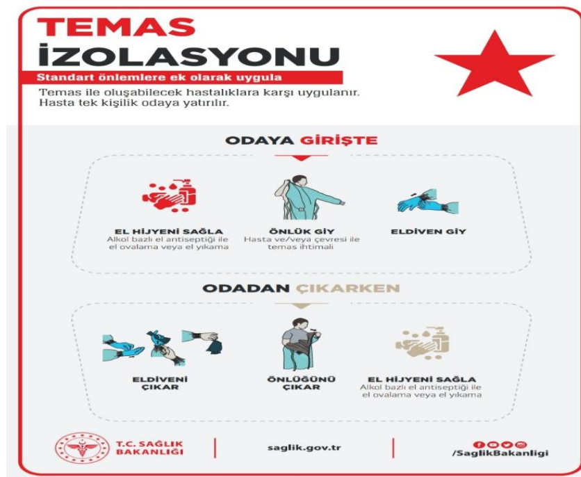
Şekil 2.2. T.C. Sağlık Bakanlığı Temas İzolasyonu Broşürü ( https://covid19.saglik.gov.tr/TR-66260/saglik-personeline-yonelik.html )

COVID-19 virüsü teması için ellerin sabun ve su veya el dezenfektanları ile yeterince yıkanması önerilmektedir (Delanghe ve Wu, 2020). Temas önlemlerinde en etkin yol el temizliğidir. Eller, sabun ve su ile en az 20 saniye boyunca yıkanmalıdır. Eğer ki sabun ve suya ulaşamıyorsak el antiseptikleriyle bu temizlik sağlanmalıdır. Temasla bulaş riskini azaltmanın en ideal yolu KKE doğru ve etkin kullanabilmektir (T.C. Sağlık Bakanlığı, 2020).