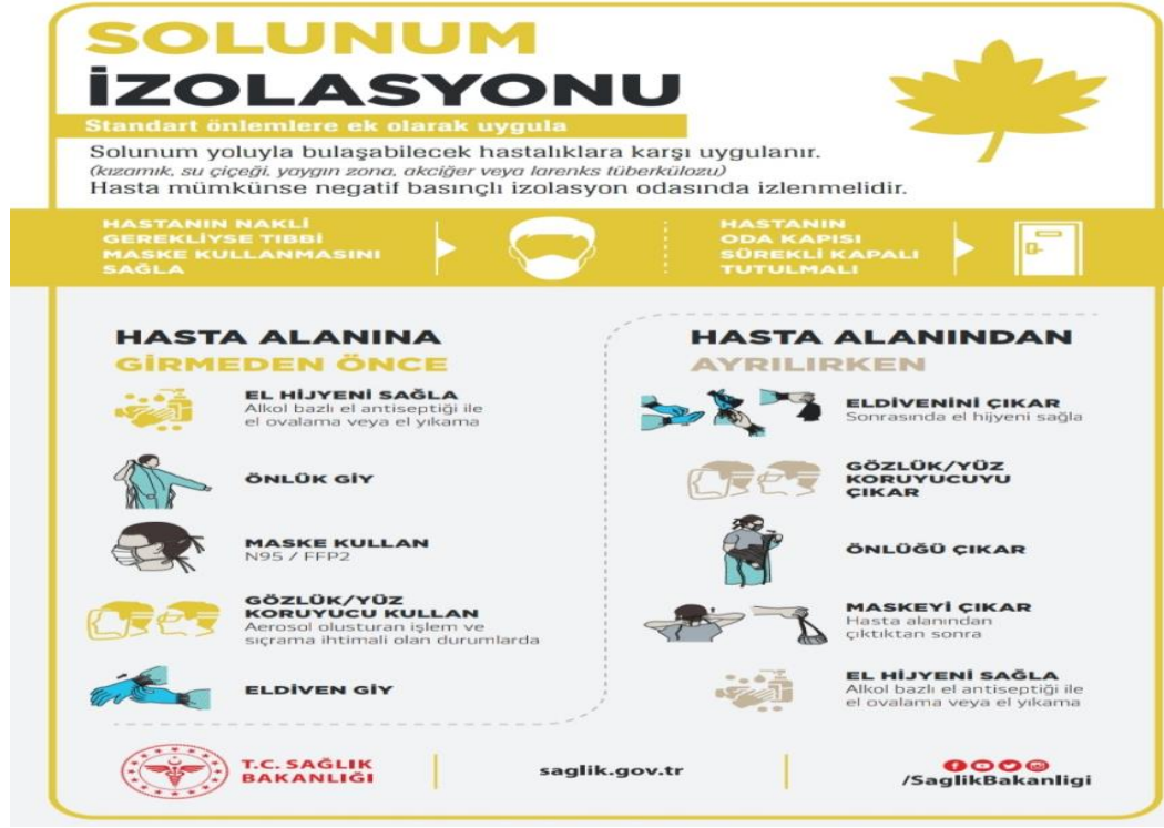
Şekil 2.3. T.C. Sağlık Bakanlığı Solunum İzolasyonu Broşürü ( https://covid19.saglik.gov.tr/TR-66260/saglik-personeline-yonelik.html )

alanlarda, sağlık çalışanları, bakıcılar ve ziyaretçiler, fiziksel mesafe korunabilse bile sağlık tesisinde her zaman maske takmalıdır. Maskeler, yemek yerken, içerken veya belirli nedenlerle maskeyi değiştirme ihtiyacı dışında, vardiya boyunca kullanılmalıdır. Aerosol üreten girişimler uygulayan sağlık çalışanları KKE ile birlikte bir solunum cihazını her zaman takmalıdır (WHO, 2020).