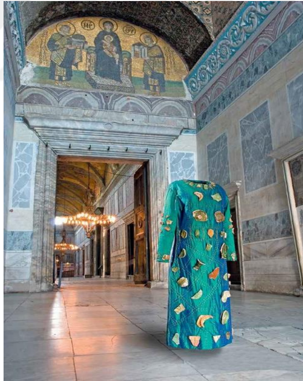
Görsel 17: Handan Börüteçene. Kendime Gömülü Kaldım, İstanbul Arkeoloji Müzeleri, İstanbul 2014

Özellikle Börüteçene’nin kültürel ifadeler taşıyan çalışmaları uzun soluklu bir sürecin izlerini taşır. Bülent Berkman ile yaptığı röportajda Börüteçene; “İşlerimde biraz eleştiren, birlikte düşünmek isteyen bir dil kullanıyorum. Bu dilin kökeni de, geçmiş uygarlıklar” (Berkman, 1987) diye belirtir. “Handan Börüteçene için mekân ve nesne birbiri ile anlaşılan. O üretimin seçilen mekânda sergilenmesi esastır. O mekân için üretilmiştir sanki. Biçimsel-mekânsal kurgudan çok anlamsal kurgu önemlidir” (Okan, 2012:25). Handan Börüteçene’nin çalışmaları yoğun araştırmalar neticesinde oluşmaktadır. Sanatçının işlerinde özellikle tarih, arkeoloji, edebiyat ve mitoloji etkisi görülmektedir. Bu etkilerin en belirgin görüldüğü çalışma ise “Kendime Gömülü Kaldım” sergisinde kullandığı temsili elbisedir.