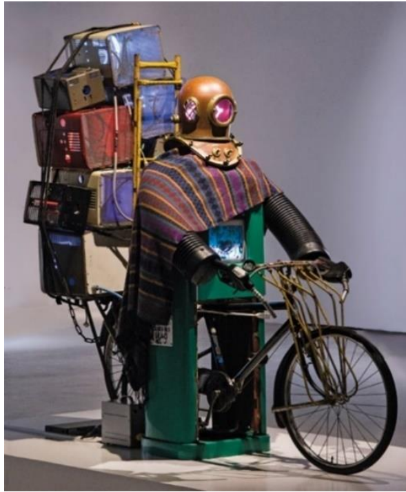
Görsel 9: Nam June Paik, The Rehabilitation of Cengiz-Khan, Chronus Art Center, 1993

Moğol İmparatorluğunun lideri Cengiz Han temsili olan çalışmanın ismi okunmasa herhangi bir şekilde imparator imajı vermemektedir. Çalışma, figürün karikatürize olduğu çeşitli nesnelere doludur. Başında dalgıç başlığı, şal, bindiği bisiklet ve vücudunda neon tüpler ,teslim ettiği monitörler imparatorun yapay zekaya sahip bir robota dönüştüğünün temsili olmuştur (Zhang, 2017). Paik geldiği coğrafyanın izlerini temsil eden sembolleri zamanın düşünce yapısında etkin olan nesnelere ile buluşturmuştur.