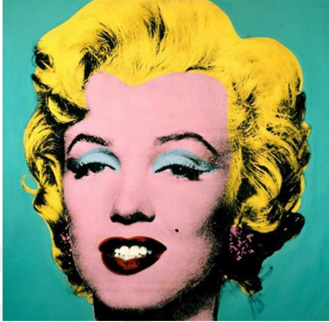
Görsel 3: Andy Warhol, Turquoise Marilyn, 1964

sıklıkla tükettiği bir çorba olması bakımından bulunduğu zamanda seri üretimin yoğun olması ve insanların makineleştiği kültürel değişimin yansıması olmuştur.