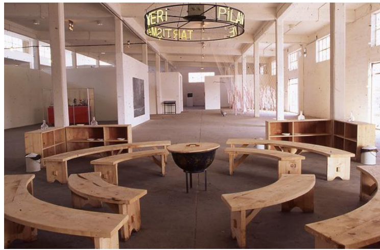
Görsel 14: Sarkis Zabunyan, Pilav ve Tartışma Yeri,4. Uluslararası İstanbul Bienali, Antrepo, İstanbul,1995.

Sarkis'in enstalasyonlarından bazıları şunlardır: 1975-1977 yıllarında gerçekleştirdiği 'Black-Out'(Karartma), 'Kriegsschatz Klassenkrieg' (Savaş ganimeti), 'Sağır Oda', 'Hamamda Dans', 'Savaş Meleği' ve 'Pilav ve Tartışma Yeri'dir (S. Öztürk, 2011:125).