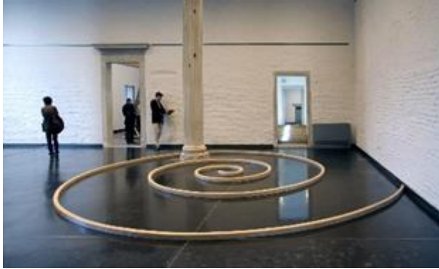
Görsel 7: Mario Merz, Spirale di cera, 1970–81

Sanat doğa bağımlı ticari nesnelere beraber vermiştir. Birçok çalışmada neon ışıklar, dairesel spiral formlar yer almıştır. Sanatçı göçebelik kavramı ile igloları sembol olarak kullanarak 2. Dünya savaşı sonrası kapitalizmin ülkesindeki etkileri ile sanayi ve kentleşmenin toplum üzerindeki sonuçlarını anlatmaktadır (Renkci Tastan, 2015:175).