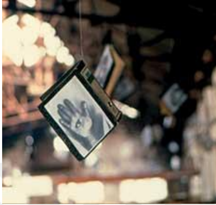
Görsel 19: Genco Gülan. Dijital Göz-el. Sinangil Un Fabrikası, İstanbul 1997. Dijital Fotoğraf.

Genco Gülan'ın Kasımpaşa Sinangil Un Fabrikası'nda yaptığı “Dijital Göz-El” enstalasyonu fabrikanın geçmişini düşündürmektedir. Fabrika Gülan'ın bir yıl boyunca çalışması için aradığı mekândır. Fabrika kurulduğunda ilkin Rumların elinde olup sonrasında birkaç el değiştirmiş en sonunda Sinangil'e devredilmiştir. Fabrika 1980'lerde kapanmıştır. “Dijital Göz-El” çalışmasının sergilenme zamanı en az çalışma kadar önemlidir. Mayıs ayında resmi ve dini bayramlar aynı döneme denk gelmiştir. Sanatçı, mayıs ayına denk gelen bu bayramların çalışmasında anlatmak istediği kavramları pekiştirdiğini düşünmektedir. Uygun zaman, mekân ve kavramları bulan sanatçı çalışmasını mekâna ait nesnelere ve uygun yerlere çeşitli işaretler ekleyerek gerçekleştirmiştir (Antmen, 1993:109-110).