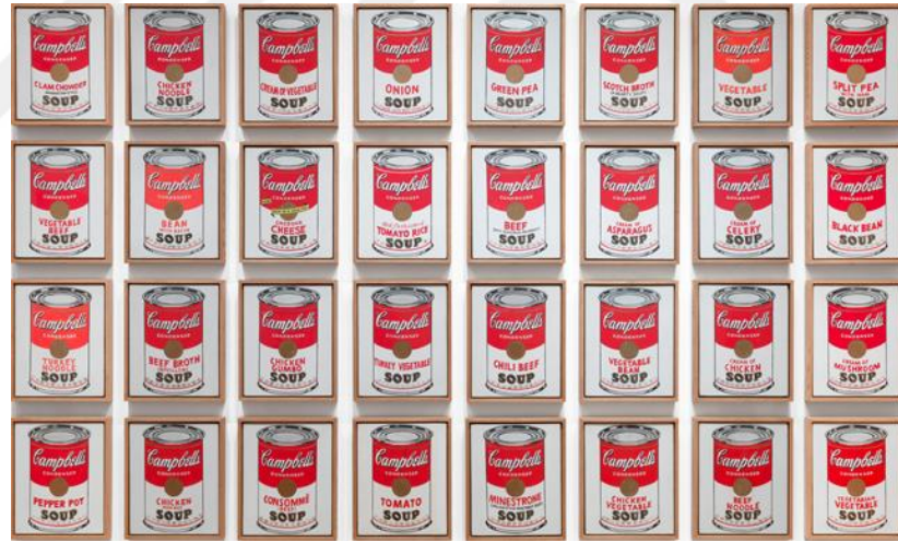
Görsel 2: Andy Warhol, Campbell's Soup Cans (Campbell'in Çorba Konserveleri), Moma, Newyork 1962

Warhol'un hâkim olduğu konu, deneyimlerinin pazarlanması olmuştur. Warhol, bu pazarlama ile ürünlerini yansıttığı markalar, (Campbell çorbaları, Coca-Cola) gibi markalaşmıştır. Warhol Pazarlamanın aşamaları olan seri üretimi örnek alarak ürünleri mekanik bir şekilde tekrar üretmiştir (Kuspit, 2018:90).