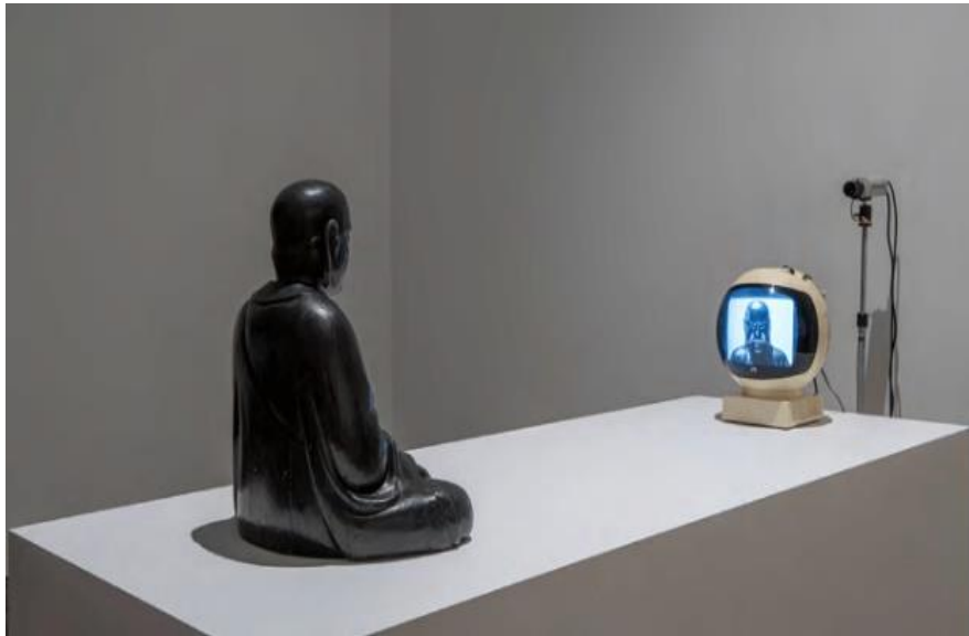
Görsel 8: Nam June Paik -TV Buddha ,1974.

Nam June Paik ilk zamanlar Fluxus hareketi içinde olsa da sonraları video sanatının öncülerinden olmuştur (Küçükcan, 2002:64). Paik'in video sanatına yönelmesindeki sebep sanayi devrimi ile birlikte endüstri ve teknolojinin gelişimiyle sanatta malzeme olarak daha çok ve farklı seçeneklerin olmasıdır. Fotoğraf, neon ışıklar, elektronik teknolojik görüntüleme cihazları bunlara örnektir. Televizyonlar popüler kültürün en etkili aracı olmakla birlikte tüketim toplumunun yaşamına dahil olmuştur. Paik çalışmalarıyla 1960lı yıllarda büyük ilgi gören televizyonun toplum üzerindeki etkilerini sorgulamıştır (Taştan, 2016:474-475). Nam June Paik enstalasyonlarında televizyon, video ve görüntüleri kullanarak dijitalleşen dünyanın sanatta ve bireydeki etkisini yansıtmıştır.