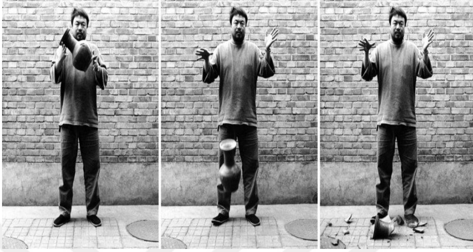
Görsel 4: Ai Weiwei, Bir Han Hanedanı Vazosunu Düşürmek, Gardiner Müzesi, Toronto, 1995

Sıklıkla Çin'in geleneksel el sanatlarından bazılarını çalışmalarında kullanarak toplumsal değerlerin değişimini sorgulamıştır (Avcı & Uslu, 2019:19).