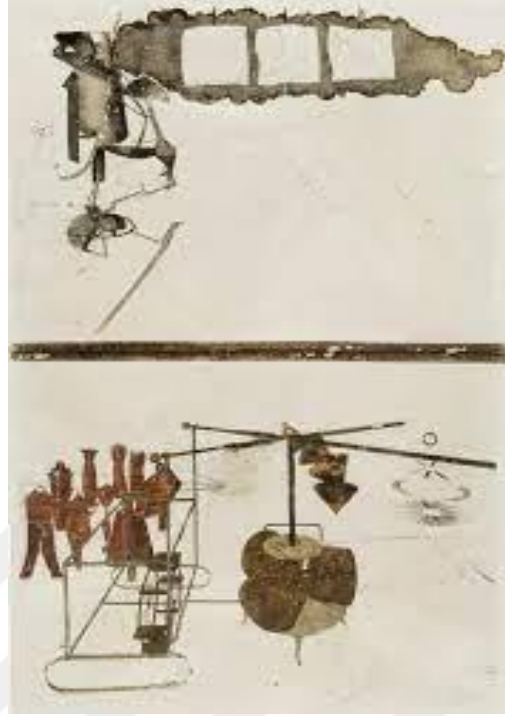
Görsel 1: Marcel Duchamp, Bekarları Tarafından Çırılçıplak Soyulan Gelin (Büyük Cam), Philadelphia Sanat Müzesi, Philadelphia, 1915.

panel arasında sanatçının evinden getirdiği parçalar olan yağ, vernik, kurşun folyo, sigorta teli ve toz yer almaktadır.