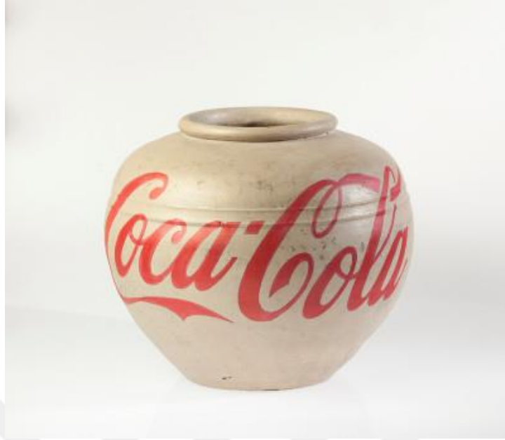
Görsel 5: Ay Weiwei, Coca-Cola Vazosu,2014. Boyalı Han Hanedanı vazosu. 42x42x35 cm.

Ayrıca sanatçı, enstalasyonlarında Çin geleneksel kültürünün yansımalarıyla, batı sanatının çağdaşlık anlayışını da eleştirmektedir (Atalay, 2018:25). Bu örneklerden en belirgin olanı “Coca -Cola Vazosu” isimli çalışmasıdır.