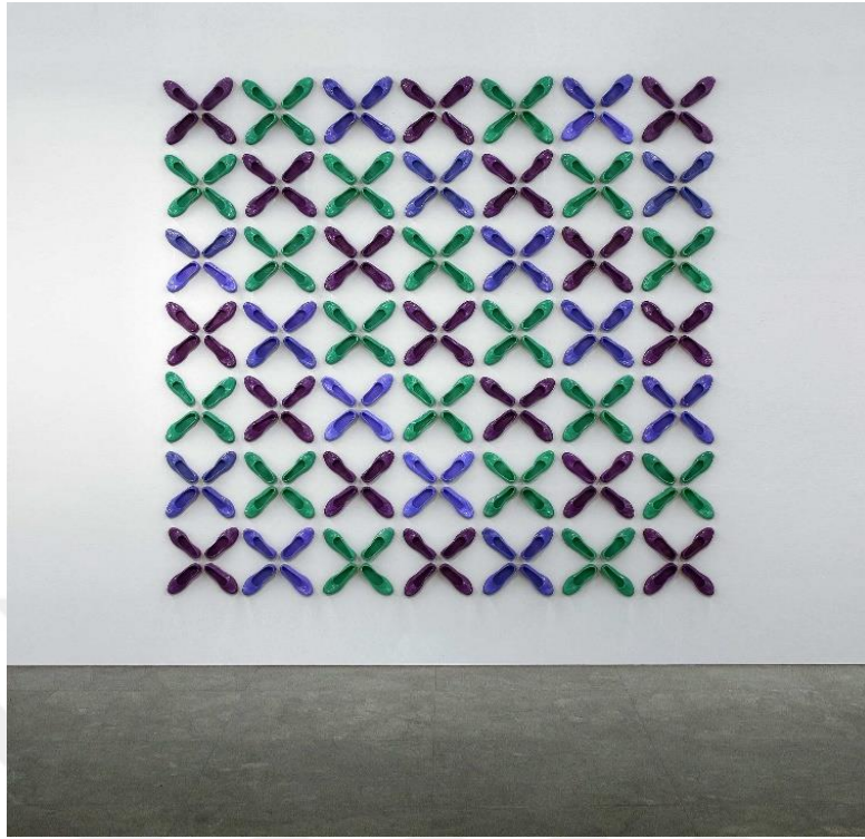
Görsel 18: Şakir Gökçebağ. Kısmet, 345 x 380 x 6 cm. Baksı Müzesi, Bayburt, 2019

Gökçebağ, “Aşına” sergisinden bir yıl önce Bayburt’u ve özellikle Baksı köyünü gezip çeşitli incelemelerde bulunmuştur. Burada yöre halkının uzun zamandır kullandığı Anadolu kültürünü yansıtan günlük eşyaları, yaşamlarını fotoğraflayarak adeta sergi öncesi bir materyal arşivi oluşturmuştur (Eren, 2019). Sanatçı “Aşına” sergisindeki “Kısmet” isimli çalışmasında ilk defa kadına ait bir nesne kullanmıştır. Çalışma için seçilen naylon ayakkabıları Anadolu’nun birçok yerinde özellikle köylerde kadınlar ve kız çocukları kullanmaktadır. Sergi mekânında duvara yerleştirilen 49 adet ayakkabı, mavi, mor ve yeşil olarak üç renktir. Naylon ayakkabıların duvardaki yerleştirilme şekli biçim olarak dört yapraklı yoncaya benzemektedir. Bunun yanında kanaviçe nakışlarındaki bezemeleri andırmaktadır. Gökçebağ daha önceki enstalasyonlarında kullandığı ayakkabılardan farklı olarak bu çalışmada renkli ayakkabılar kullanmıştır. Ayrıca ayakkabıların mekâna yerleştirilmelerinde önceki enstalasyonlarından farklı bir motif sergilemiştir. Oluşan bu motif sanatçının süsleme anlayışını göstermektedir. Kısmet’ isimli çalışma şanslı çağrıştıran yonca motifi ile Anadolu kadınının kaderine razı halini ,yalınlığını yansıtmıştır (R. Demir & Ceranoğlu, 2020:1545).