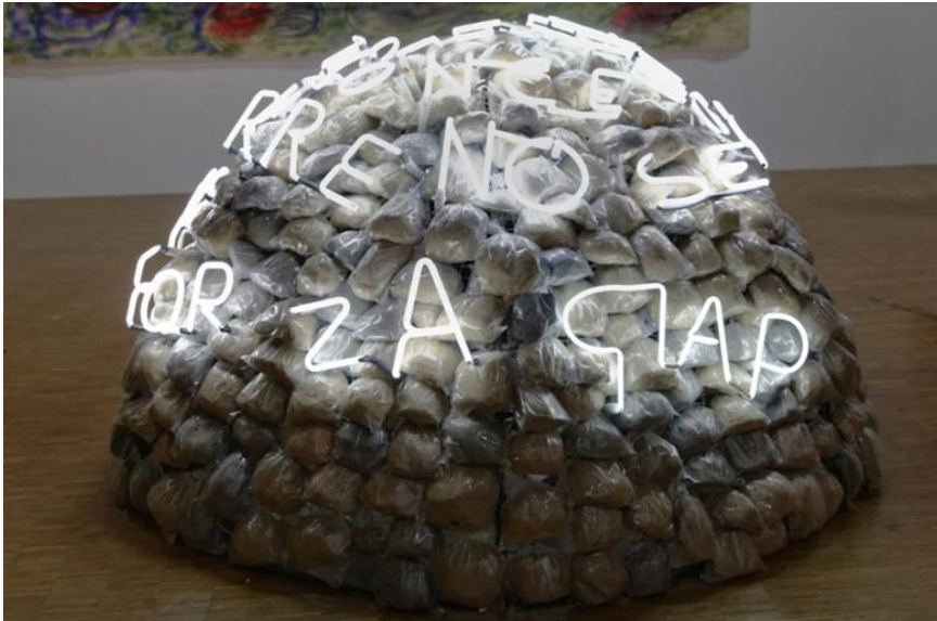
Görsel 6: Mario Merz, Igloo di Giap (Giap's Igloo), Centre Georges Pompidou, Paris 1968, 120 x 200 cm