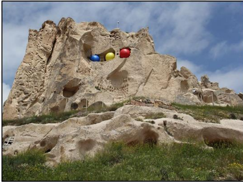
Görsel 16: Ayşe Erkmen, Üç Göz, Yerleştirme, Kapadokya, Nevşehir, 2015

bulunmaktadır (Engin, 2020:416). Günümüzde birçok sanatçının birden fazla atölyesi bulunmaktadır. Bunun yanında sanatçıların üretim alanının sınırları genişlemiş olup çeşitli sanat çalışmaları için platformlar yer almaktadır. Sanatçılar, sanat çalıştayları, sempozyumlar, sanat projelerinde çalışmalarını gerçekleştirir. Bu çalışmalar kurumsal veya bağımsız olabilmektedir. Sanatçılar, buldukları coğrafyanın sunduğu olanaklar ile çalışma düşüncesindedir. Ayşe Erkmen'in birçok çalışmasında bu anlayışı benimsediği görülür. Atölye kullanan sanatçıların aksine bu anlayış ile sanatçı daha fazla özgürleşmektedir. Mekân ve mimari yapı çok boyutlu bir ilişkisellik kazanmıştır (Engin, 2020:419). Sanatçının mekâna özgü uygulamalarından biri de Kapadokya'da gerçekleşen Cappadox Festivali kapsamında bölgede bulunan Uçhisar kalesi ile yaptığı enstalasyondur.