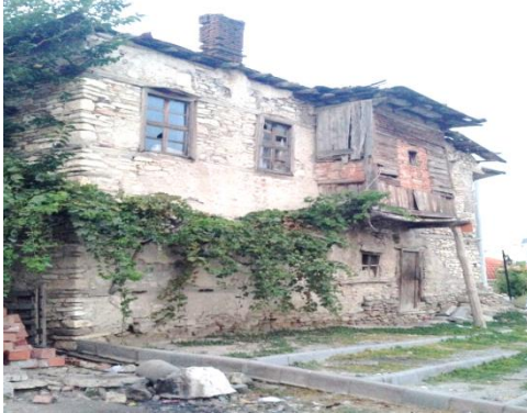
Fot. 15. Geleneksel konut örneği (Tekkanat, 2014).