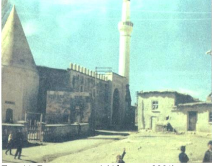
Fot. 11. Barınma ögesi (Alperen, 2001).