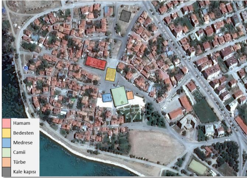
Harita 3. Eşrefoğulları Süleyman Bey Külliyesi içerisinde yer alan eserlerin konumu.

İçerişehir’de alışveriş yapanlar arasında yoğun sosyal ilişkiye imkân veren, ticaretin gelişmesini sağlayan dinamik unsur Süleyman Bey Camii’nin kuzeyinde, hamam ile cami arasında bulunan Süleyman Bey Bedestenidir (Harita 3, Şekil 1).