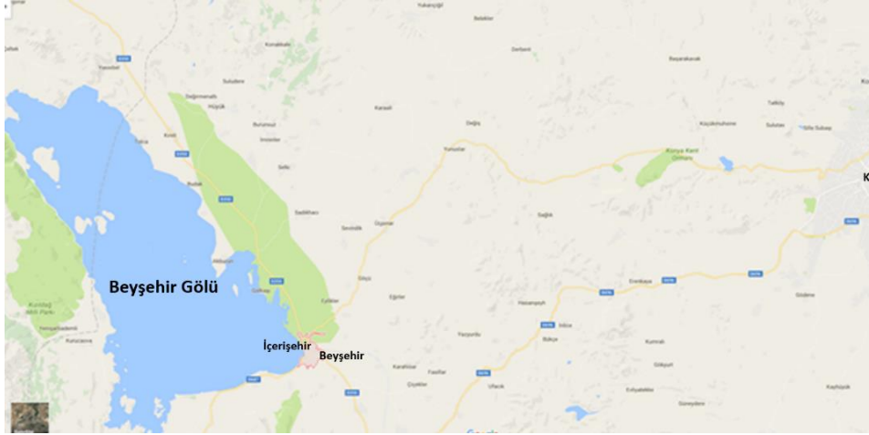
Harita 1. Beyşehir'in Konumu

yer almakta; dördüncü bölümde ise İçerişehir kent dokusu, günümüze kadar varlığını sürdüren yapı/eserlerden yola çıkarak Anadolu Türk Kenti'ni oluşturan mekânsal ögeler paralelinde değerlendirilmektedir.