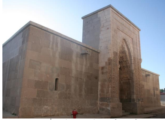
Fot. 9. İsmail Ağa Medresesi, [URL-7].

İsmail Ağa Medresesi, doğu-batı yönünde inşa edilmiş olup tek katlı, açık avlulu plan şeması, eyvanlı, türbeli ve revaklı hücreleri ve portaliyle Anadolu Selçuklu medreseleri arasında yer almaktadır (Çaycı, 2008).