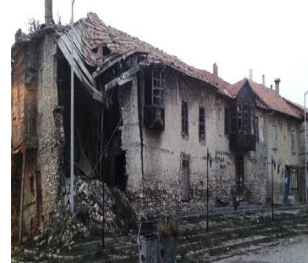
Fot. 16. Geleneksel konut örneği (Tekkanat, 2014).