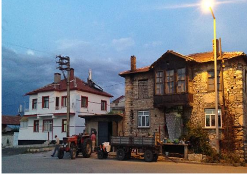
Fot. 17. Geleneksel konut örneği (Tekkanat, 2014).