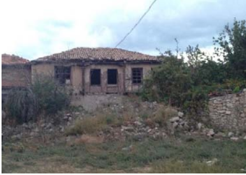
Fot. 13. Geleneksel konut örneği (Tekkanat, 2014).