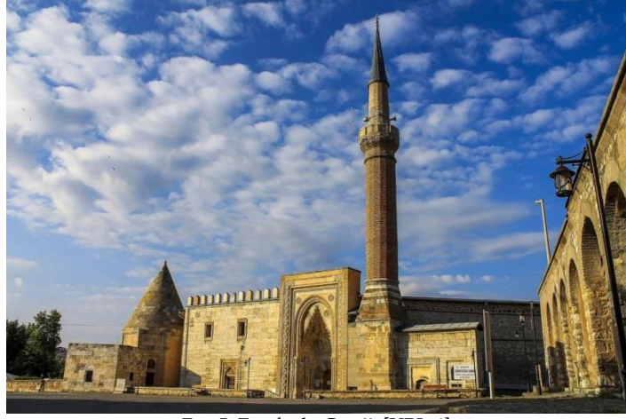
Fot. 5. Eşrefoğlu Camii, [URL-4].

Eşrefoğlu Külliyesini oluşturan yapılar arasındaki en önemli eser Eşrefoğlu Beyliği'nin kurucusu olarak kabul edilen Seyfeddin Süleyman Bey tarafından yaptırılan ve Anadolu'nun en büyük camilerinden biri olan Eşrefoğlu Süleyman Bey Camiidir. Caminin inşa tarihi ile ilgili iki kitabe tespit edilmiştir. Camide dış portalin kitabesi 1297, iç portalin çini mozaik kitabesi 1299 tarihlidir (Aslanapa, 1999; Çaycı, 2008). Cami ağaç direkler üzerindeki ahşap konsollara oturtulan düz kirişli, düz çatılı ve toprak damlı bir yapıdır. Anadolu'daki ağaç, çatı ve direkli düz tavanlı ulu camilerin en büyüğü ve görkemlisi olan caminin dikkat çekici yanları; mihrap önü kubbesinin mozaik çini kaplamaları, yüksek taş portali, girişteki hazırlık bölümünün duvarında yer alan çini mozaik kaplamaları ve ağaç işçiliğidir (Zengin, 1998). Camide ahşap, taş ve çininin mükemmel uyumu görülmektedir. Taş ve ağaç işlemleri, mozaik çini süslemeler, Selçuklu sanatının son ve en olgun şekilde gelişmiş bir üslup beraberliği içinde ahenkli bir bütün meydana getirmiştir (Aslanapa, 1999).