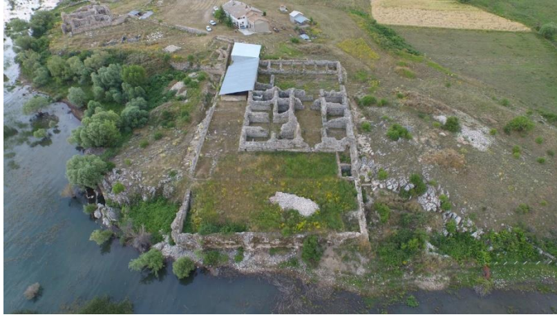
Fot. 3. Kubad Abad Sarayı, "Büyük Saray" ın Planı, [URL-2].

Arkeolojik bulgular Kubâd-âbâd saray yerleşkesinde, saraylar ve köşkler ile av hayvanları bahçesi gibi Sultan ve maiyetinin eğlenme-dinlenme mekânları yanında konutlar ile hamam, su kanalları, tersane gibi kentsel sosyal ve teknik altyapı öğelerinin varlığını ortaya koymaktadır. Bu tespitler, Kubâd-âbâd sarayı yapı gruplarının tarihsel süreç içinde kentsel yerleşme niteliği kazandığını düşündürmektedir. Nitekim Kubâd-âbâd subaşı Bedreddin Sutaş adına