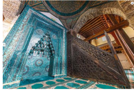
Fot. 6-Fot. 7. Eşrefoğlu Camii, [URL-5].

Özgün ve zengin mimarisi ile Eşrefoğlu Camii beylik dönemi başkenti Beyşehir'in ilk ulucamisi olmuştur. Cami gerek Beyşehir halkının gerekse beylik