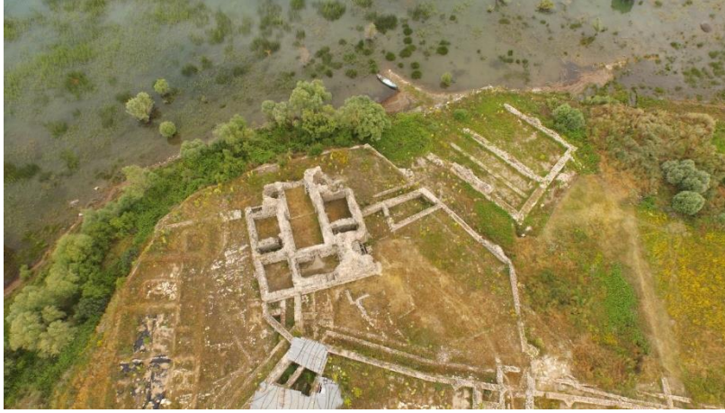
Fot. 2. Kubad Abad Sarayı, "Küçük Saray" ın Planı, [URL-2].

Saray dağınık haldeki 16 yapı ve av parkından meydana gelmiştir. Bunların bazıları, Büyük Saray, Küçük Saray, Köşk kalıntıları ve iskele yapılarıdır. Günümüze ulaşan yapılardan Büyük Saray ve Küçük Saray kısmen iyi durumdadır (Fotoğraf 2 ve 3). Pek çok alçı kabartmanın yanı sıra sarayı süsleyen çiniler, insan ve hayvan figürleri, göl kuşları ve sembolik figürlerle bezenmiştir (Zengin, 1998).