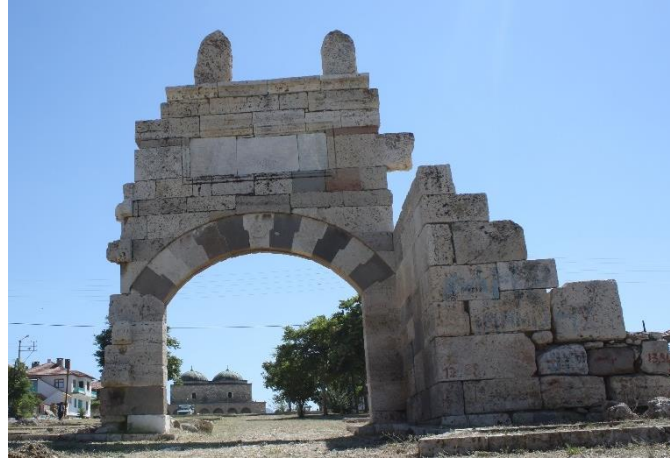
Fot. 1. Beyşehir Kale Kapısı, 2014.

Beyşehir kalesi hakkında gerek kent kalıntılarında gerekse literatürde yeterli veri olmaması nedeniyle yapı tekniği ve malzemesi açısından tam olarak yorumlanamamıştır. Bununla birlikte mevcut kale kapısının anıtsal ölçülere sahip olmadığı bu nedenle mütevazı bir yapı olduğu tahmin edilmektedir (Çaycı, 2008).