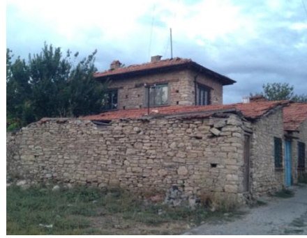
Fot.14. Geleneksel konut örneği (Tekkanat, 2014).