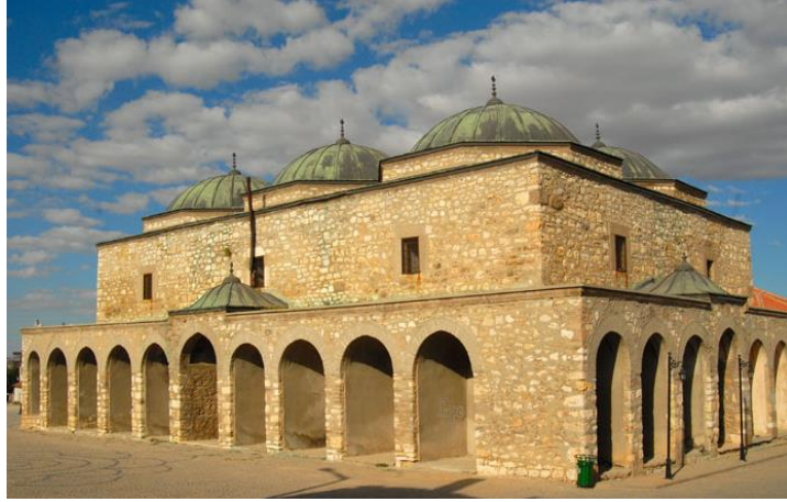
Fot. 4. Süleyman Bey Bedesteni, [URL-3].

Bedesten, Eşrefoğlu Vakfiyesi'nde "Bezzaziye Hanı" olarak tanımlanmaktadır (Çaycı, 2008). Süleyman Bey Bedesteni, külliye içinde asli hüviyetini kaybeden iki eserden birisidir. Osmanlılar zamanında 1551 yılında onarılan bedesten, adeta yeniden yapılmıştır. 1976'da Vakıflar Genel Müdürlüğü tarafından restore edilmiştir. Plan şemalarının oluşumunda etken olan kubbe sayısı bakımından tasnife göre; Süleyman Bey Bedesteni "altı üniteli bedesten" grubuna girmektedir (Alperen, 2001; Çaycı, 2008).