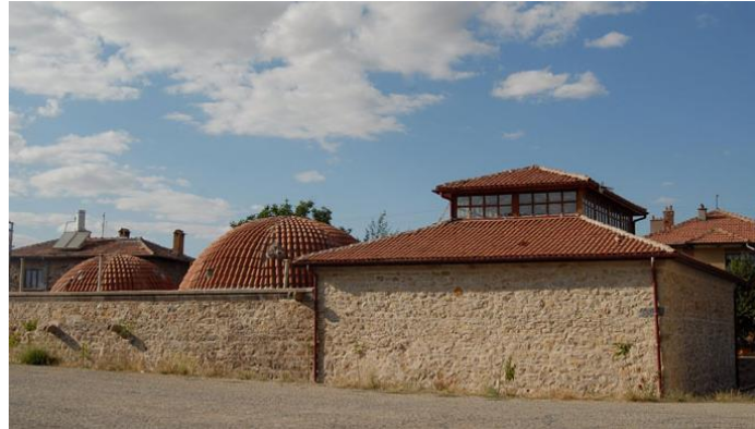
Fot. 10. Süleyman Bey Hamamı, [URL-8].

Süleyman Bey Hamamı, Anadolu Selçuklu hamamlarının karakteristik özelliklerinden olan çifte hamam tarzında olup kuzey kale kapısının güneybatı yönünde, Bedesten'in 20 m. batısında yer almaktadır (Çaycı, 2008). 13.yüzyıl sonlarında yapıldığı tahmin edilen hamamın girişi Türk mimarisiyle özdeşleşen sivri tonozla örtülmüştür (Alperen, 2001). Kuzeydoğu- güneybatı istikametinde çifte hamam olarak inşa edilen eserin kuzeybatı yönündeki kadınlar bölümü günümüze kadar ulaşmamıştır. Erkekler kısmı; plan tipolojisi, yapı elemanları, yapı malzemesi ve süslemesi bakımından döneminin önemli özelliklerine sahiptir (Çaycı, 2008). Süleyman Bey Hamamı Selçuklu dönemine ait diğer hamamlar gibi; haçvari, dört eyvanlı ve köşe hücreli tipte inşa edilmiştir (Çaycı, 2008).