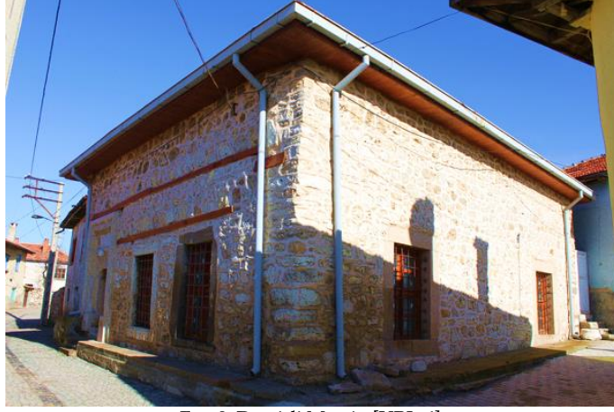
Fot. 8. Demirli Mescit, [URL-6].

Eşrefoğlu Beyliği döneminden günümüze gelen ikinci dini mekân Beyşehir’de yer alan Demirli Mescit olup Anadolu’daki tek mekânlı mescit uygulamasının örneklerindedir (Çaycı, 2008).