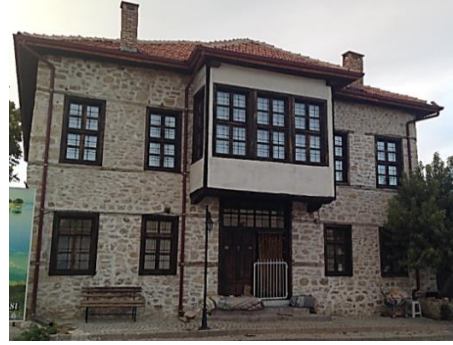
Fot. 18. Geleneksel konut örneği (Tekkanat, 2014).

Dönemin konutları taşkın vb. afetler ve geçen uzun yıllara bağlı fiziksel yıpranmalar neticesinde ayakta kalamamıştır. Dönemin kent dokusunun, diğer İslâm kentlerinde olduğu gibi, çarşı ve cami, külliye gibi İslâm toplumunun temel özelliklerini yansıtan merkezi yapıların dışında, bir cami etrafında gelişen ve yaklaşık 100 hane ya da 1.000 kişilik nüfusu barındıran mahallelerden oluştuğu düşünülebilir.