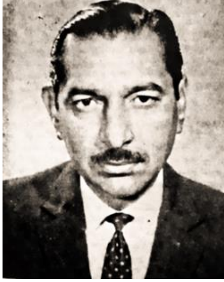
Nur ahmet İtimadi (1967-1971 yılları arasında başbakanı)