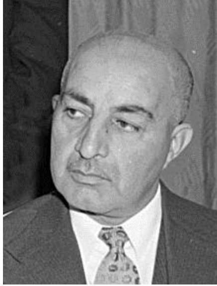
Muhammet Davut Han Afganistan'ın İlk Cumhurbaşkanı