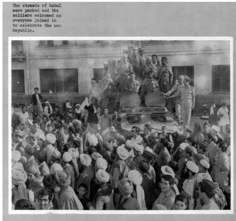
Kabil Halk'ı Krallığın Çöküşünü Karşılama Anı