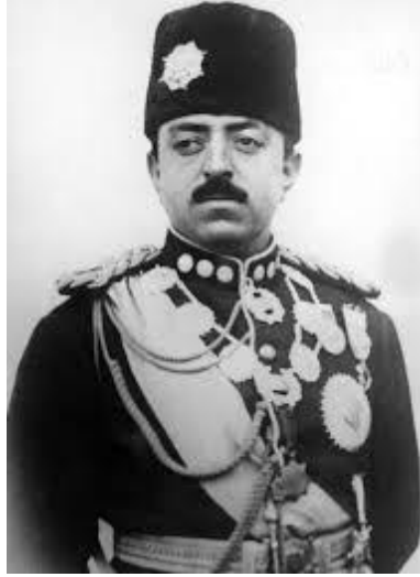
Afganistan'ın bağımsızlığını kazanan Kral Amanullah Han (1919-1929 yılları arasında kraldı.)

Çalışma sırasında adı geçen önemli kişilerin resimleri