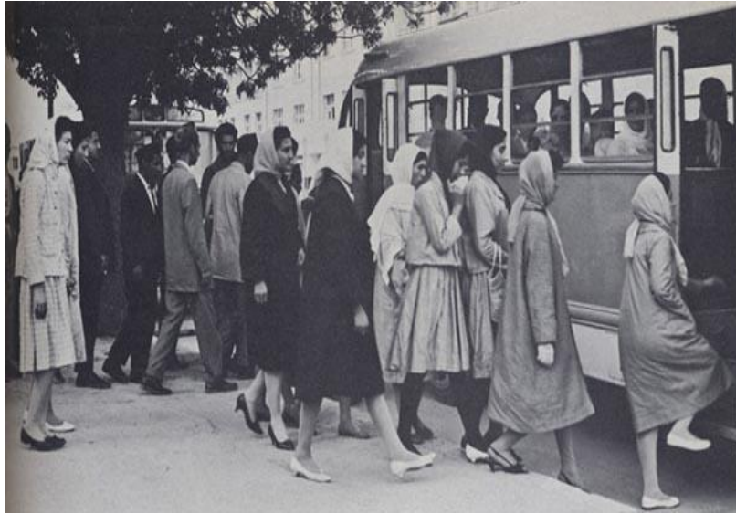
Nur Ahmet İtimadi'nin Başbakanlık Dönemindeki Üniversite Öğrencileri