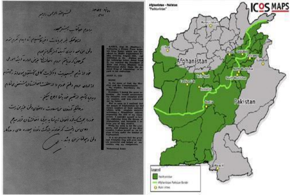
Kral Zahir Şah'ın İstifa Mektubu