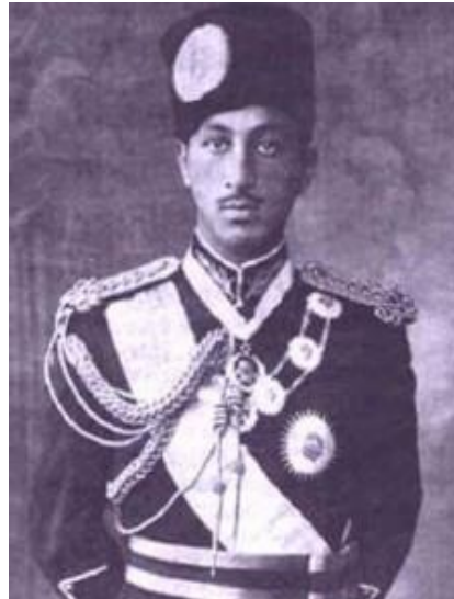
Zahir Şah (1933-1973 yılları arasında krallık yapan)