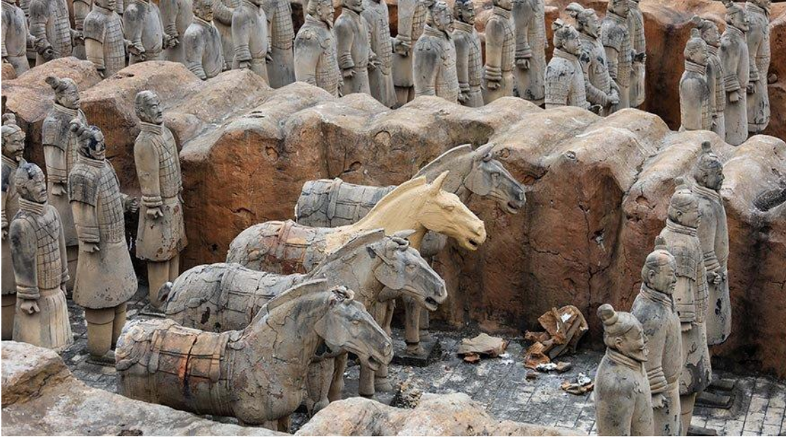
Görsel-14: Qin Hanedanlığı Terracotta Ordusu, Lington bölgesi M.Ö.246

olabileceği düşünülmektedir (Çakı, 1999: 42). Görsel-14'te, ordu nizamına göre dizilen Han'ın mezarını koruyan terracotta askerler görülmektedir.