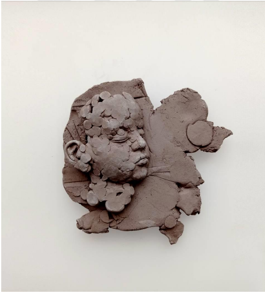
Görsel-39: “Innocence Series-1” 20x21x10cm

Eser seramik plaka üzerine, rölyef tekniği ile çalışılmıştır. Yapım sürecinde yüzey ve portre ayrı ayrı çalışılarak, sonrasında bir araya getirilmiştir. Eser üzerinde, genel kompozisyon kurallarına özen gösterilmiştir. Boşluk-doluluk dengesi ve yer yer yapısal deformasyonlar yapılarak, esere plastik bir değer kazandırmak amaçlanmıştır. Yapılan eserlerde farklı yüz hatları kullanılarak, dünyada çocuklarını temsilen, evrensel bir etki oluşturulmak istenmiştir.