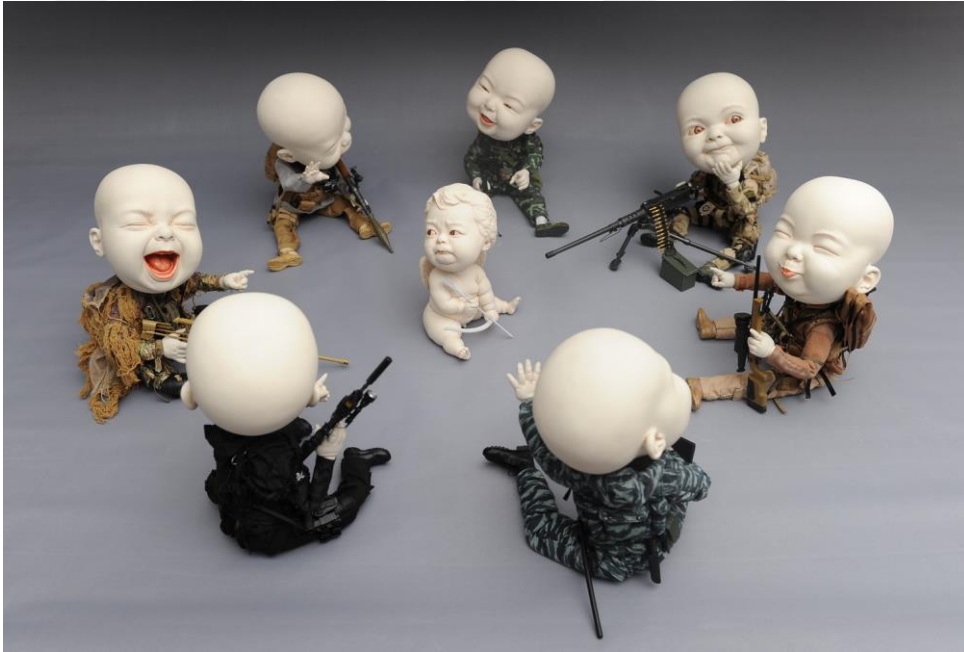
Görsel-18: Johnson Tsang, “İsimsiz”

Sanatçının çalışmaları incelendiğinde, toplumsal olaylara karşı hassas bir bakış açısına sahip olduğu söylenebilir. Eserlerinde sürrealist-gerçeküstü bir yaklaşım tercih ederken, ifadenin forma dönüşmesi noktasında ise realist bir tekniği tercih etmektedir. Çoğu sanatçıda olduğu gibi Tsang’de büyüdüğü sosyokültürel çevreden etkilenmiştir. Eserlerinde bunların yansımaları görülmektedir. Bu noktada eserlerinde, çocukların dünyaya esprili ve ironik bakış açısını odak noktası haline getirmiştir. Sanatçının eserlerinde en dikkat çeken noktalardan biriside, yapmış olduğu çocuk figürlerinde cinsiyet kavramının olmayışıdır. Bu yaklaşım sayesinde toplumsal cinsiyet ayrımı gözetmeksizin, insan merkezli olarak eserlerini biçimlendirmektedir (Gülbahar, 2019: 27-29).