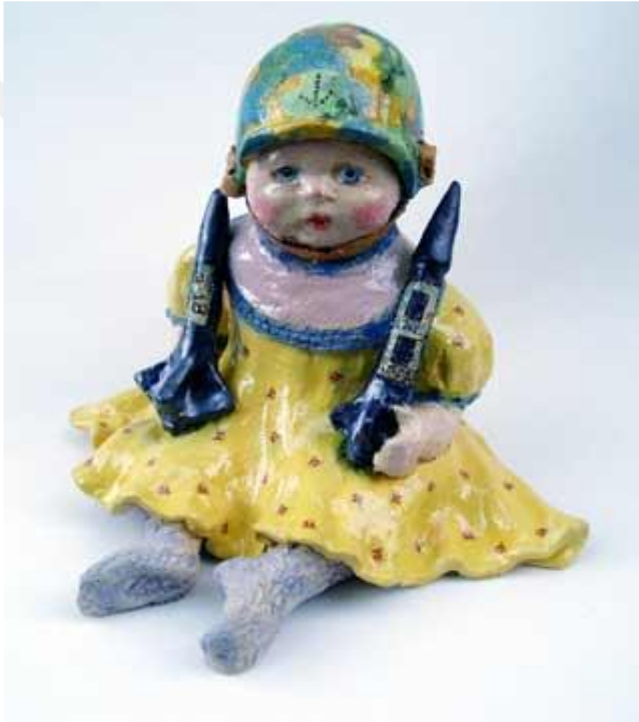
Görsel-36: Nuala Creed, "Babes in Arms"

Ceramics Monthly ve Ceramics Ireland gibi çeşitli sanat dergilerinde yayınlanmaktadır ( https://www.nualacreed.com , 2024). Görsel-36'da sunulan eserde, sanatçı ellerinde füze tutan bir çok imgesi betimlemiştir. Savaşın çocuklar üzerindeki etkisine dikkat çekmek isteyen Creed, tezat kavramlar olan çocuk ve silahı bir arada kullanmıştır. Süslü kıyafetler içerisinde, donuk bir poz veren figür, iradenin kendi elinden alınışını temsil edebilir. Aynı zamanda, silahla poz veren çocuk imgesi ile, sanatçının maruz kaldığı şiddet neticesinde, kişiliği değişecek ve belki de geleceğin gaddar bireylerinden birisine dönüşecek figürü vurgulamak isteği düşünülebilir.