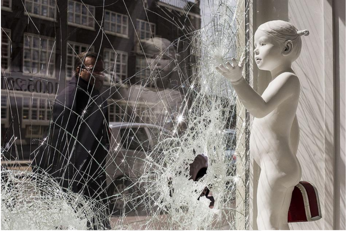
Görsel-33: May Von KROGH, “Little girl with suitcase”