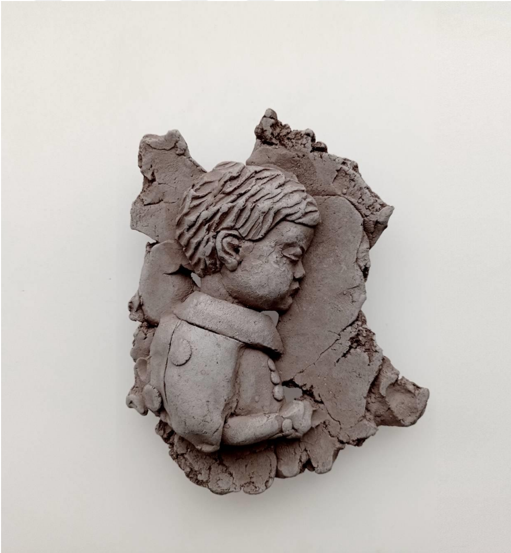
Görsel-46: "Innocence Series-8" 22x21x7cm

Bu eser mülteci çocukları konu almaktadır. Figürün üzerindeki kıyafet yolculuğu, üzerindeki yırtık ve yama ise bir anlamda yoksulluğu temsil etmektedir. Yüzey üzerindeki tekilliği, süreçteki içsel yalnızlığına bir gönderme yapmaktadır.