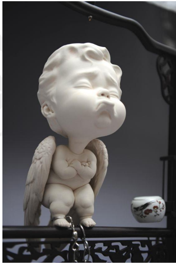
Görsel-19: Johnson Tsang, “İsimsiz”

Aynı zamanda kompozisyonun merkezinde yer alan eros figürü, mutluluğu temsil etmektedir. Mutluluk ve aşk figürünün, mutsuzluğundan keyif alan çocukların oluşturduğu bir eser ile sanatçı, şiddetin ve savaşın, masumlar üzerindeki derin etkilerine dikkat çekmek istemiş olabilir. Görsel-19’da sunulan eserde, kanatları olan fakat ayaklarından zincirlenerek hareket fonksiyonları kısıtlanan bir figür görmekteyiz. Bu donelerden yola çıkarak sanatçının eserde, masumiyetin ve saflığın yitirilişi, aynı zamanda özgürlüğün kısıtlanması temalarına ışık tuttuğu düşünülebilir.