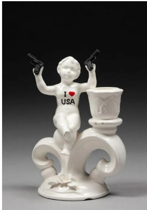
Görsel-30: Penny BYRNE, “I Heart USA”, 2011, Vintage earthenware figurine

Penny Byrne, eserleri aracılığı ile, çağdaş siyasi ve sosyal meselelerle derinden ilgilenen Melbourne merkezli bir sanatçıdır. Byrne, dünya çapındaki zulümlere karşı gösterdiğimiz kayıtsız tepkilere yönelik şok ve öfkeyi ifade eden heykelsi çalışmalar üretmek için çeşitli araçlardan yararlanmaktadır. Bu bağlamda araç olarak, kendisine seramik malzemeyi seçmiştir. Byrne, günlük haberlerden ve sosyal medya akışlarımızdan görüntüleri pasif bir şekilde tüketme şeklimizi eleştiren, bunları sorgulamaya ve içselleştirmeye iten eserler üretmektedir. Byrne, seramik konservasyonu konusunda köklü bir geçmişe sahiptir. Vintage porselen heykelcikler pek çok eserinin temelini oluşturmaktadır. Bu bağlamda, çağdaş küresel krizlere gönderme yapan, figürlere hem mizah hem de korku katan yeni çalışmalar yaratmak için konservasyon tecrübelerini seramik eserlerine aktarmaktadır ( https://pennybyrneartist.com , 2024). Görsel-30'da bulunan eserde, geleneksel bir dekor üzerine oturtulmuş, günümüz çocuğu tasvir edilmiştir. Kullanılan beyaz renk masumiyeti temsil etmektedir. Bunun yanında sanatçı figürün ellerine silahlar vererek, masumiyetin kirletilişini gözler önüne sermektedir.