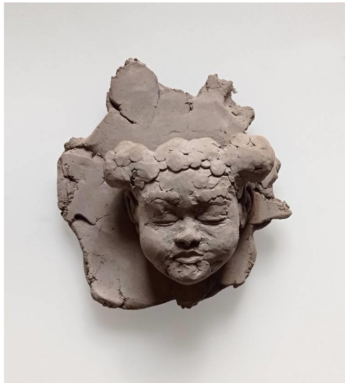
Görsel-43: "Innocence Series-5" 21x21x9cm

Eserlerin arka planında bulunan hem askı aparatı hem de taşıyıcı yapı görevi gören ayaklar, eseri yüzeyden bağımsızlaştıracak şekilde tasarlanmıştır. Bu sayede duvar üzerinde sergilenen esere, yerçekimsiz bir duruş kazandırılmış, mekânda hem bir bütünlük yakalaması hem de mekândan tekil olarak bağımsızlaşması amaçlanmıştır. Bu dokunuş sayesinde sergileme esnasında, zaman ve mekân ölçeğinde, anda kalmışlık hissinin verilmesi amaçlanmıştır.