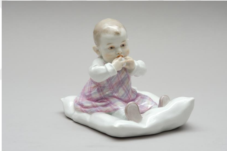
Görsel-17: Conrad HENTSCHEL, “Child on Cushion”, Size, 13x15x11cm

Bu bağlamda modern sanatçılar içerisinde Hentschel, yapmış olduğu çocuk figürlü biblolarıyla tanınan bir isimdir. Eserlerinde malzeme olarak porselen kullandığı görülmektedir. Kendi ismiyle özdeşleşen “Hentschel’in Çocukları” isimli eseri, gündelik hayatın içerisinde, en doğal halleriyle yorumlanmış çocuk imgeleri içermektedir. Dönem sanatçıların çoğunda, çocukların masum ve saf dünyasının betimlendiği figüratif seramik eserler görebilmekteyiz (Gülbahar, 2019: 17). Görsel-17’de yumuşak bir minder üzerine oturur şekilde betimlenen çocuk figürü formu, soft hatları sayesinde naif bir görünüme sahiptir. Kullanılan renk ve tonların, masumiyeti çağrıştıran nitelikte olduğu görülmektedir. Çocuğun bakışlarındaki dalmışlık hissini, hayalperest yanına atıfta bulunarak çalışıldığı düşünülebilir.