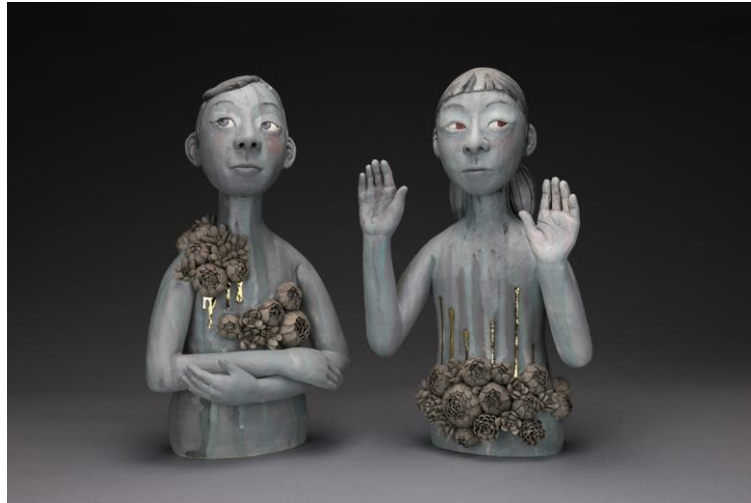
Görsel-28: Gunyoung KİM, "Enigmatic Eyes series", 2019

Sanatçı eserlerinde genellikle kültürel, tarihi ve sosyal konuları ele almaktadır. Yüz ifadeleri, jestler, sahneleme ve şekil bozuklukları yoluyla içsel psikolojiye odaklandığını söylemektedir. Yakalamak istediği duygusal argümanlar, kendi yaşantısı ve iç dünyasından gelmektedir ( http://www.gunyoungkim.com , 2017). Görsel-28'de sunulan eser, "Enigmatic Eyes" isimli bir seriye aittir.