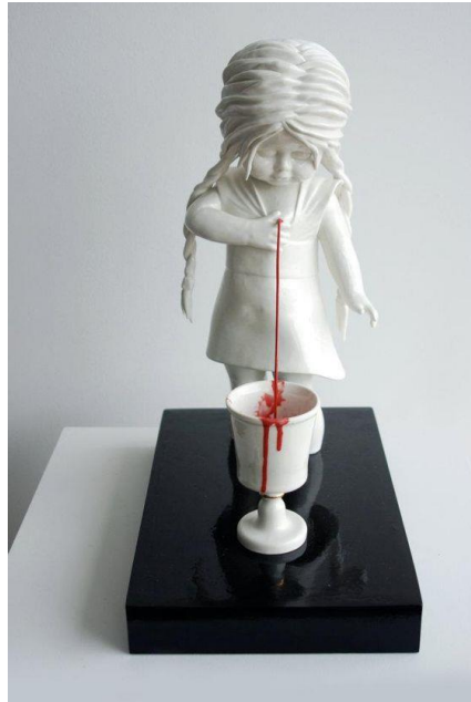
Görsel-20: Maria RUBİNKE, “İsimsiz”

Rubinke'nin eserlerinde bilinçsiz arzu ve mağduriyet kavramları, bu kavramların arasındaki rahatsızlık verici ilişki genel bir hakimiyet oluşturmaktadır. Modern sanat eserlerinin çoğunda gözlemlenen bu ilişki, Sigmund Freud'un tekinsizlik kavramı ile bağlantılıdır. Eserlerindeki farklı anlamlar, rüyalarda olduğu gibi, değişime muhatap kılınarak, alışlagelen anlamlarından koparılır ve seramik çocuk imgeleri çok farklı durumlar ve olaylar içerisinde gösterilir. Bu sayede, sanatçı alımlayıcının var olan bilgisini yıkarak, onu farklı bir evrenin büyüyle baş başa bırakır (Sülüsoğlu, 2019: 109).