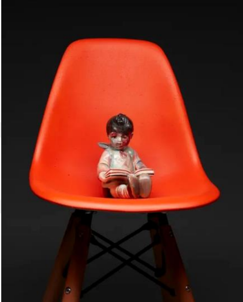
Görsel-31: Penny BYRNE, “Omran”, 2017, Repurposed vintage ceramic figurine

Günümüz popüler kültüründen donelerde taşıyan eserde, bir anlamda katliamın kendisine olan sempati, ironik bir şekilde ele alınmıştır. Sanatçının figürü antik dönem heykellerinin kompozisyonu şeklinde yansıması, duyguların yitirilmesine, donuklaşmasına atıfta bulunuyor olabilir.