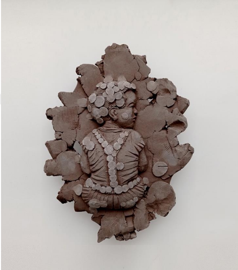
Görsel-50 “Innocence Series-12” 27x22x8cm

yapı bir bakıma, hayatındaki bölünmüşlüğü temsil edebilir. Nitekim masum bir çocuk için mülteci olmak zorlayıcı bir süreçtir. Aidiyetsizlik hissi insanı yalnızlaştıran ve ötekileştiren bir duygudur. Figürün tekil yapısı da buna çağrışım yapabilir.