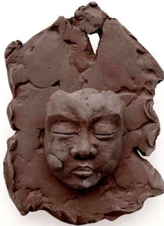
Görsel-51 “Innocence Series-13” 21x19x7cm

Doğa ile iç içe bir yaşamı gösterebilmesi adına, diğer eserlerden farklı olarak zemin doğal amorf bir levha biçiminde yorumlanmıştır. Eserde kullanılan çamura yapılan kırmızı kil katkısı, siyah Stoneware ile birleşerek, coğrafya insanlarının ten rengini çağrıştıracak hale getirilmiştir. Bu noktada levha ve portre arasındaki tonun aynı olması, doğa-insan uyumunu anlatmayı amaçlamaktadır.