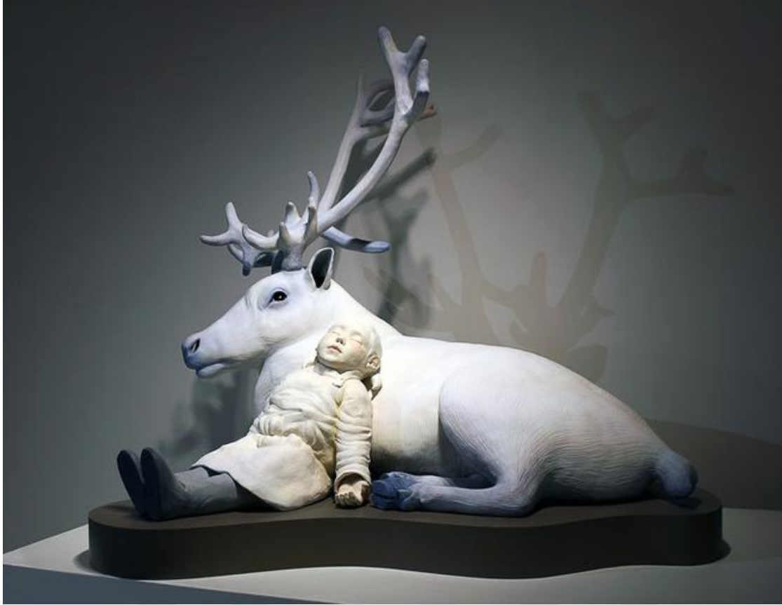
Görsel-25: Kyungmin PARK, “Guardian”, 2015 Stoneware, Underglaze, Resin, milkpint 50x42x44cm

Park’ın eserlerinin seçilmesindeki etken ve tez çalışmalarına olan katkısı, uyku, gerçeklikten kopuş ve masumiyet üzerine olmuştur.