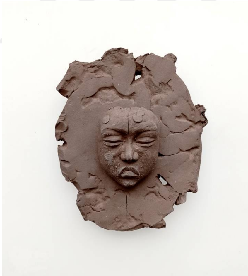
Görsel-52 “İnnocence Series-14” 21x19x7cm

Eserlerin tamamında, temel sanat kaidelerine özen gösterilmiş, form içinde çeşitli kompozisyonlar hazırlanmıştır. Stilize, yapısal deformasyon, plastik doku, boşluk, iz, parça bütün ilişkisi gibi unsurlar dikkatle ele alınmıştır.