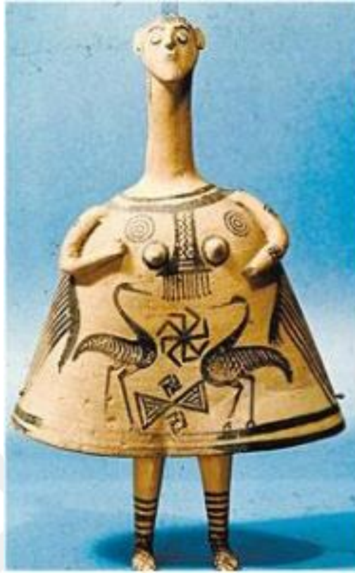
Görsel-13: Oyuncak Bebek, Boeotia M.Ö.7 yy.