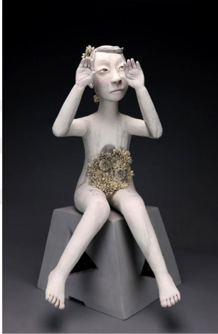
Görsel-29: Gunyoung KİM, “Enigmatic Eyes series”, 2019

kullanılması, çocukların değerine ve günahsızlığına dikkat çekmektedir. Aynı zamanda eserler üzerinde solmuş çiçekler bulunmaktadır. Buda masumiyetin kirletilişi mesajını verebilir. Görsel-29’da serini bir diğer eseri görülmektedir. Önceki eserde olduğu gibi bu çalışmada da eller teslim olduğunu temsilen, havaya kaldırılmıştır.