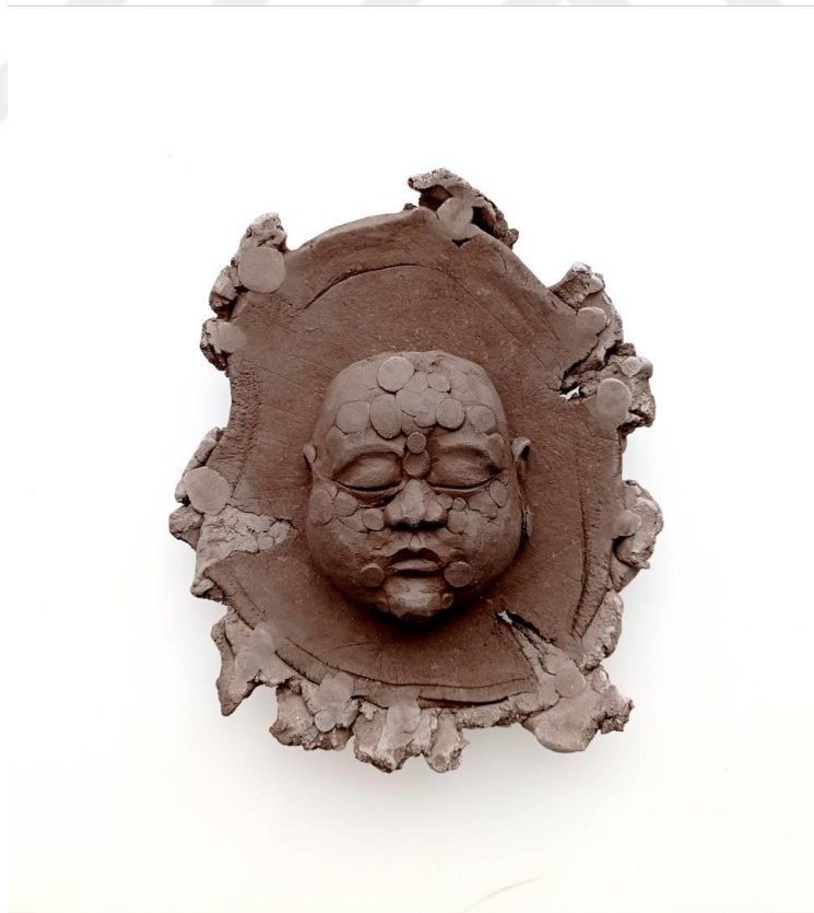
Görsel-49 “Innocence Series-11” 24x21x9cm

Bu eser Hintli çocuklara dikkat çekmeyi amaçlamaktadır. Eser üzerindeki argümanlarla anlatı yalın bir şekilde desteklenmek istenmiştir. Zemin üzerindeki renk farklılığı, toplumsal sınıflandırmaya bir atıftır. Orta alanın daha koyu tonda olması ve kenarlarda beyaz bir çerçeve olması, özgürlük alanının kısıtlanmasına çağrışım yapmaktadır. Yüz hatlarındaki masumiyet kaderine olan mecburi kabullenişini anlatırken, lekeler yaşadığı zorlukları temsil etmektedir. Kaşlarının arasında bulunan belirgin leke, Hint kültürünü çağrıştırması adına tercih edilmiştir.