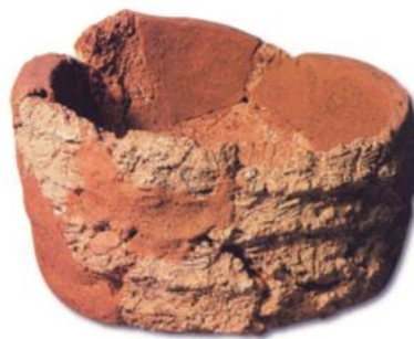
Görsel-1: Güneşte Kurutulmuş Kap Örneği, Çayönü Yerleşkesi

Arkeolojik araştırmalara göre seramiğin kullanımı ile alakalı olarak çok sayıda tarihsel veri bulunmaktadır. Fakat insanoğlunun kili pişirmeyi öğrenmeden çok daha önceleri, kili ham haliyle kullandıkları bilinmektedir. Kili pişirilip seramikleşmesinden önce insanlar, onu plastik yapısı sayesinde, el ile şekillendirerek birtakım objeler üretmişlerdir. Yapılan bu objeler çamurun plastisitesi sayesinde belirli bir mukavemet sağlasa da ufak bir darbeye kolaylıkla dağılıp ufalanabilmekteydi. O nedenle üretilen bu ilkel çömlekler, arkeoloji ve seramik sanatının tarihlenmesinde sağlıklı bir bilimsel altyapı oluşturmamaktadır. Diyarbakır/Ergani’de yapılan kazılarda bu gibi örnekler ele geçirilmiştir (Şahbaz, 2006: 5). Pişmeden şekillendirilmiş bir kase örneği Görsel-1’de sunulan arkeolojik buluntudur.