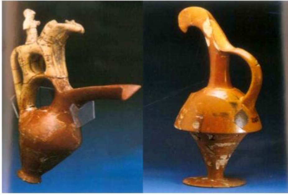
Görsel-8: Gaga Ağızlı Testiler, Hacılar M.Ö. 1700-1900