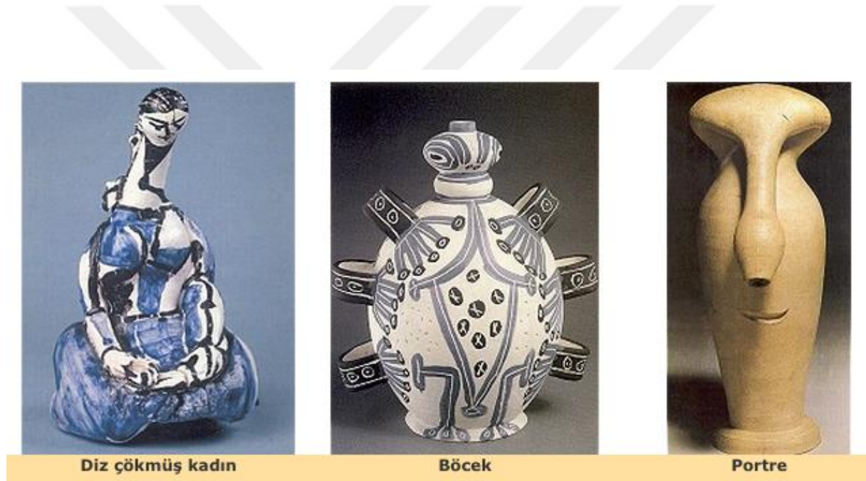
Görsel-6: Pablo Picasso, Figüratif Seramik Soyutlamalar

şırmış ve bu yorum biçimiyle, plastik bir sanat olan seramiği, kendi plastikliği içerisinde forma dönüştürmüştür. Pablo Picasso'nun atölyesinde çalıştığı yıllarda, Abidin Dino, Chagall gibi ünlü sanatçılarda, onunla beraber çalışma imkânı bulmuştur. Picasso, seramik sanatı ile birlikte imgeden forma uzanan bir serüven yaşamıştır. Eserlerinde imge-işlev ilişkisiyle ilgilenmiştir. Bu sayede, günlük kullanım objelerine benzersiz anlamlar kazandırmıştır. Picasso ilk seramik sergisini 1948 yılında Vallauris 'ta açmıştır. 1978 yılına kadar takip eden yıllar içinde, düzenli olarak sergiler açılmıştır (Ünal, 2021: 207-212). Görsel-6'da "Diz çökmüş kadın, Böcek ve Portre" olarak isimlendirilen eserler Picasso'nun resim üslubunu seramik üzerine yansıttığı üç farklı örnektir. Eserler tornada çekilerek, sonrasında serbest şekillendirme tekniği ile yorumlanmıştır.