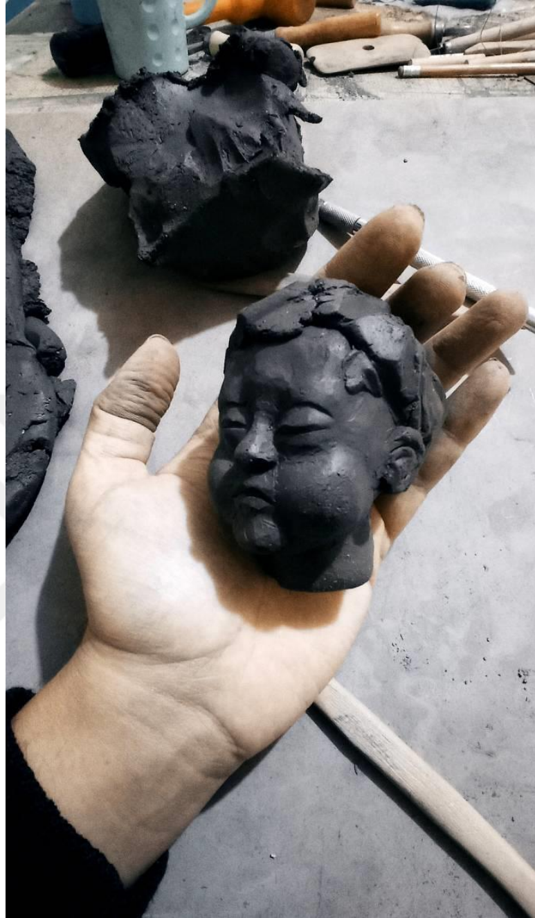
Görsel-38: Çocuk Büstü Modellemesi

Eserlerin yapımı aşamasında, serbest şekillendirme yöntemi kullanılmıştır. Oluşturulan çocuk konsepti üzerine, yüksek rölyef, ya da bir anlamda yüzey heykeli diyebileceğimiz figürler, öncesinde yüzeyden bağımsız olarak, portre ve vücut parçaları şeklinde modellenmiş, sonrasında ise yüzey üzerinde bir araya getirilerek, kompozisyon kurgulanmıştır.