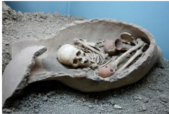
Görsel-4: Antalya Elmalı, Karataş Mezar Alanı "Karataş-Semayük", Küp Mezar

Küp mezarların yapılması fikrinin, insanın cenin şeklinde anne karnında dünyaya gelmesi ve yine aynı şekilde uğurlanması felsefesine dayandığı düşünülebilir. Bu durum öte dünyada bir tür yeniden doğuş olarak yorumlanabilir. Görsel-4'te küp mezar geleneğinin güzel örneklerinden bir kalıntı yer almaktadır. Ölü içerisine cenin pozisyonunda yatırılmış, inanç gereği ihtiyacı olabileceği düşünülen bazı eşyalarla birlikte gömülmüştür.