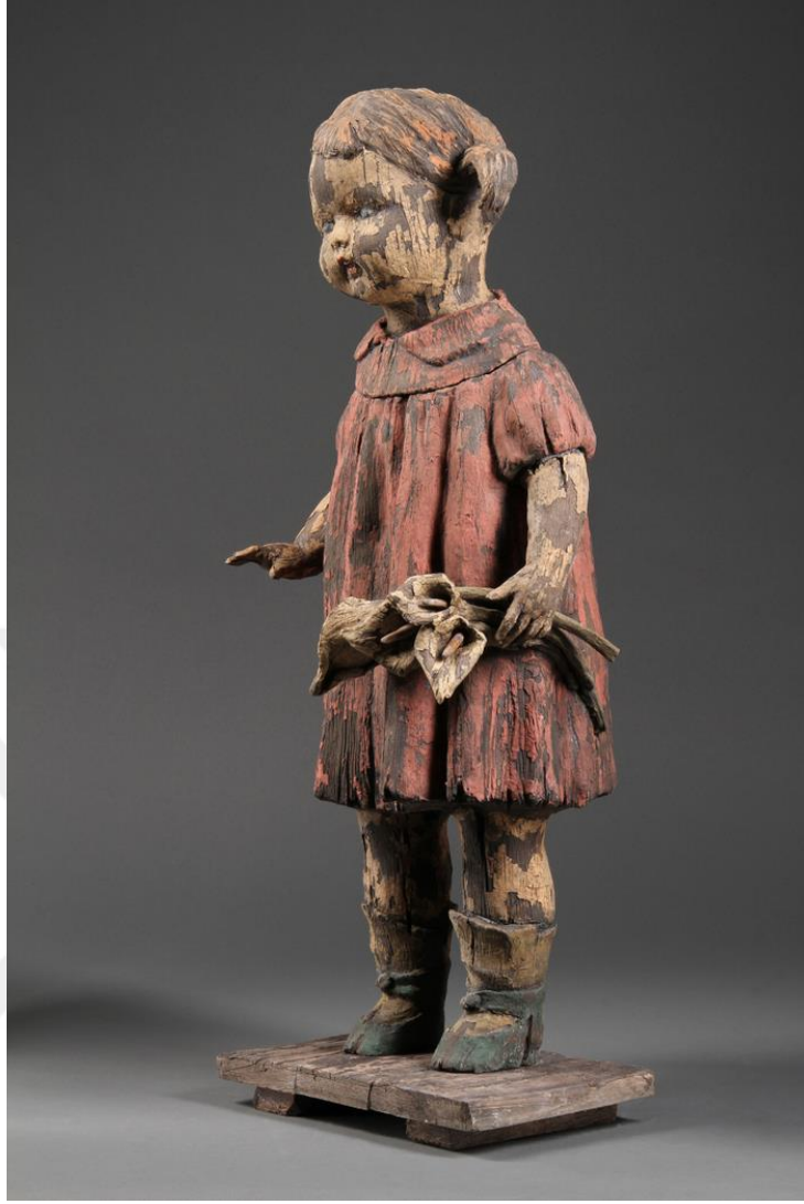
Görsel-27: Margaret KEELAN, “Girl with Flowers”, 2010, 27x12x9cm

Üzerinde bulunduğu kaide ile kendisine bağımsız bir alan oluşturan eser, çocuğun kendi özelindeki masum dünyasını temsil edebilir. Ellerinde tutmuş olduğu çiçeklerde bu anlatıyı destekler nitelikte bir argümandır. Sanatçının çoğu eserinde olduğu gibi masumiyet kavramının ön planda olduğu söylenebilir. Yüz hatları duygusuz bir yapıya sahiptir. Bu noktada esere atfedilen metafor açısından, savaşın çocukları duygusuzlaştırması meselesine değindiği söylenebilir.