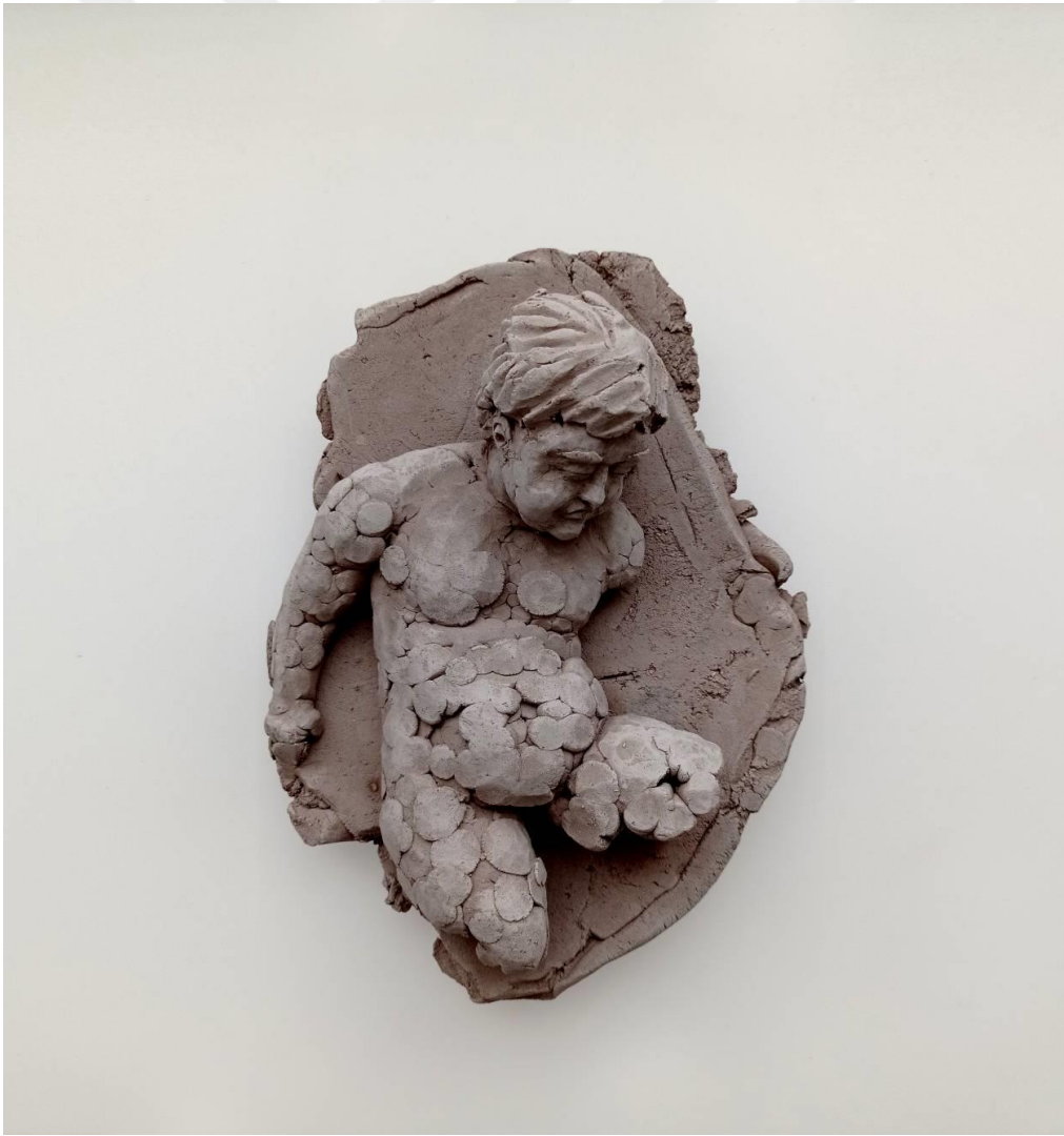
Görsel-44: “Innocence Series-6” 25x20x10cm

Bu eser dünyanın dört bir yanında savaşın mağduru olan, masum çocuklara ithafen yapılmıştır. Beden üzerindeki parçalanmalar, savaşın tahribatını anlatırken, sessizliği, çaresizliğini temsil etmektedir. Vücudundaki her bir leke, insanlığın ona layık gördüğü acıların hatırasıdır.