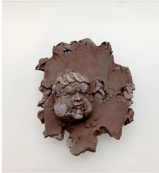
Görsel-48: “Innocence Series-10” 22x22x7cm

Eserlerde özel bir renk unsurunun tercih edilmemesinin temel etmeni buna dayanmaktadır. Yüzey üzerinde yapılan gölge oyunları sayesinde, eserin sahip olduğu antik terracotta renginin, ışık vasıtası ile birçok tonunun yakalanması amaçlanmıştır. Bu sayede izleyici için hem bir seyir zevki hem de tezin özünde anlatılmak istenen, insanlığın çocuk imgesi vasıtası ile kökenine yapılan yolcuğunu primitif olarak temsil etmektedir. Bu bağlamda ilkeli yakalamak ve bunu en verimli şekilde değerlendirmek, oldukça önemlidir.