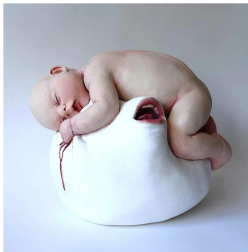
Görsel-22: Ronit BARANGA, “İsimsiz”

1973 senesinde İsrail'de dünyaya gelmiştir. Psikoloji, İbranice ve Sanat Tarihi gibi alanlarda akademik eğitim almıştır. Eserlerinde imge olarak çocukluğun erken evrelerinden yararlanmaktadır. Sanatçı bugüne kadar çok sayıda seri içerisinde, farklı duygu ve davranışların betimlendiği, ilginç sanat eserleri üretmiştir. Eserlerinde ürkütücü ve tehditkâr bir ifade dili kullanan sanatçının, aktarmak istediği düşünceleri, bütün çıplaklığı ile göstermeyi tercih ettiği görülmektedir (Gülbahar, 2019: 36). Görsel-22'de sunulan eserde, tüm masumiyetiyle uyuyan bir çocuk figürü görülmektedir. Sanatçı beden üzerinde kıyafet kullanmayarak, savunmasızlığına dikkat çekmek istemiş olabilir. Çocuğun elleri ile üzerinde uyuduğu formu sıkması ve bunun sonucunda kan akması, bastırılan içsel duygularını bir kâbus şeklinde dışa vurduğunu düşündürebilir. Aynı zamanda bunca sessizlik içerisinde konuşmak ve belki de haykırmak istemesine atıf yapan ağız figürü de sessiz çılgınlıklarını dile getiriyor olabilir.