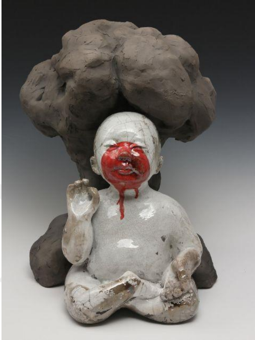
Görsel-37: Nuala Creed, "Lament for Fukushima"

Görsel-37'de bulunan eserde, sanatçının sıkça değindiği toplumsal olaylar ve sorunlardan bir tanesini görmekteyiz. Nükleer enerjinin kullanımı ve bu noktadaki ihmaller ölçeğinde, yaşanan Fukushima kazasını merkezine almıştır. Eserin ağız kısmında görmüş olduğumuz kan, söz hakkı olmadığına işaret edebilir. Aynı zamanda meditasyon pozisyonundaki duruşu hem masumiyetini hem de yaşanan her şeye rağmen mutlu olma çabasını anlatıyor olabilir.