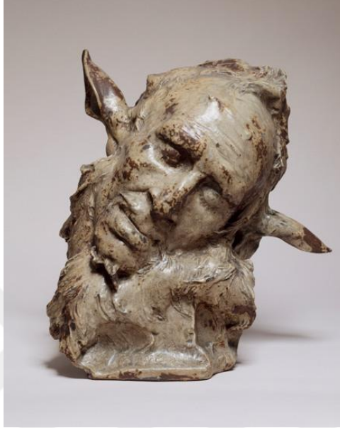
Görsel-16: Head of Fawn, Jean Carries- Stoneware, Paris, Petit Palais