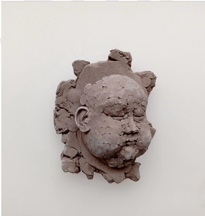
Görsel-40: "Innocence Series-2" 20x20x8cm

Eserin yapımında kullanılan stilize kompozisyon, bozunumu anlatmak adına modele edilmiştir. Portre ve yüzey arasındaki ilişki, dokuların uyumu açısından bütünlük gözetilerek tasarlanmıştır. Çocuğun masum yüz ifadesi savunmasızlığını ve kendine biçilen kader karşısındaki çaresizliğini gösterir niteliktedir.