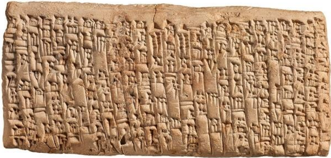
Görsel-3: M.Ö. 1750’li Yıllara Ait Olduğu Düşünülen Bir Kil Tablet

Üzeri yazılı kil tabletler, kazı yapılan alanlar hakkında direkt bilgi vermeleri bağlamında, büyük bir önem arz etmektedir. Antik dönem insanları seramiği, ödeme, oy kullanma, vergi, reçete ve liste gibi kısa vadeli belge olması amacıyla kullanmışlardır. Bu tarz seramik parçalarına “Ostrakon” denilmektedir. Bunun yanı sıra ostrakon’ların edebiyat ve felsefe yazıları yazmak için kullanıldığı da bilinmektedir. Bu yazılar seramik üzerine kazıma tekniği ile (graffito) yahut pigment (dipinto) ile aktarılmışlardır (Okumuş, 2013: 4).