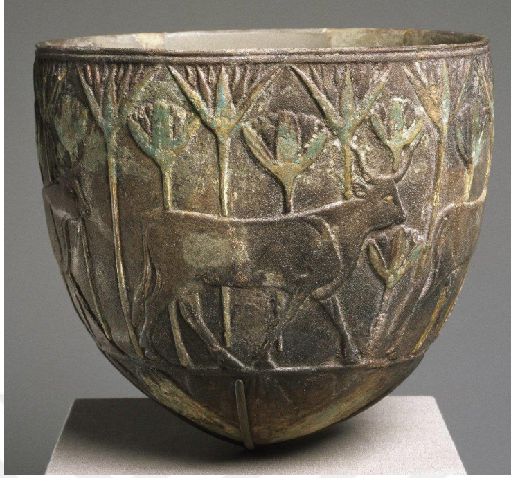
Görsel-11: Dört Boğa Alayı Motifli Seramik Kap c. 775-653 BCE Brooklyn Müzesi