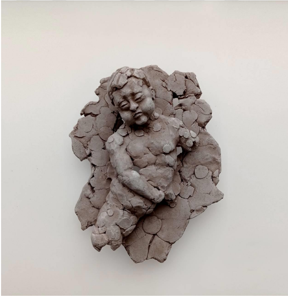
Görsel-45: “Innocence Series-7” 24x21x10cm

Eserlerin bazılarında portre odaklı tasarımlar yapılırken, bazı eserlerde ise, beden imgesi de eserlere dahil edilmiştir. Yapılan bu çalışmalarda, figürlere bazı pozlar ve duruşlar verilerek, esere kinetik bir etki kazandırmak amaçlanmıştır.