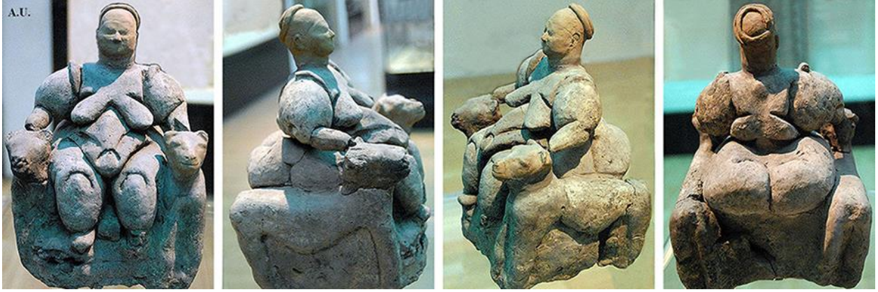
Görsel-9: Aslanlı Oturan Tanrıça – Çatalhöyük, M.Ö. 6000

Ana tanrıça figürlerinin içerisinde en eski olanı, M.Ö. 30000-25000 arası tarihlenen “Willendorf Venüs’ü” isimli buluntudur. Bunun yanı sıra, M.Ö. 25000 olarak tarihlenen “Lespugue” Venüs’ü de bilinen en eski örnekler arasında yer almaktadır. Fakat bu iki çalışma malzeme olarak kil kullanılarak yapılmamıştır. Bilinen en eski seramik ana tanrıça figürü, Çek Cumhuriyeti’nde bulunan ve Prag’da sergilenen, Dolni Vestonice Venüs’üdür. M.Ö. 25000 – 29000 aralığında tarihlenmiştir (Erman, 2019: 145-146). Görsel-10’da figüratif seramik sanatının en eski buluntularından olan Dolni Vestonice Venüs’ü iki açıdan görülmektedir.