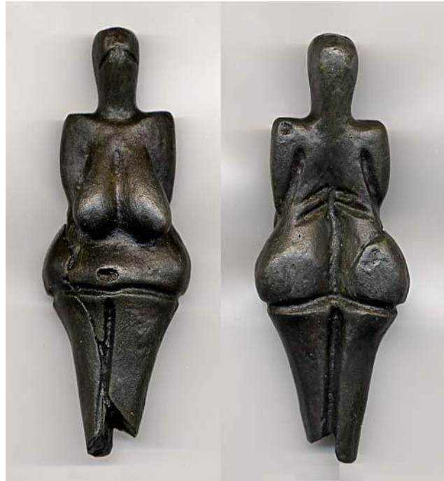
Görsel-10: Dolni Vestonice Venüs’ü, Pişmiş Seramik Ana Tanrıça.

Ana tanrıça figürlerinin içerisinde en eski olanı, M.Ö. 30000-25000 arası tarihlenen “Willendorf Venüs’ü” isimli buluntudur. Bunun yanı sıra, M.Ö. 25000 olarak tarihlenen “Lespugue” Venüs’ü de bilinen en eski örnekler arasında yer almaktadır. Fakat bu iki çalışma malzeme olarak kil kullanılarak yapılmamıştır. Bilinen en eski seramik ana tanrıça figürü, Çek Cumhuriyeti’nde bulunan ve Prag’da sergilenen, Dolni Vestonice Venüs’üdür. M.Ö. 25000 – 29000 aralığında tarihlenmiştir (Erman, 2019: 145-146). Görsel-10’da figüratif seramik sanatının en eski buluntularından olan Dolni Vestonice Venüs’ü iki açıdan görülmektedir.