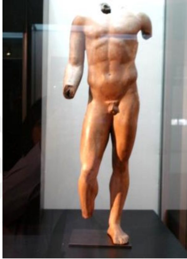
Görsel-12: Smyrna Atölyelerinde Yapılan Figür, Terracotta, M.Ö.I, Louvre Müzesi

edilen bu eserde, kırmızı astar etkileri, kısmen insan teni etkisini çağrıştıracak şekilde yorumlanmıştır.