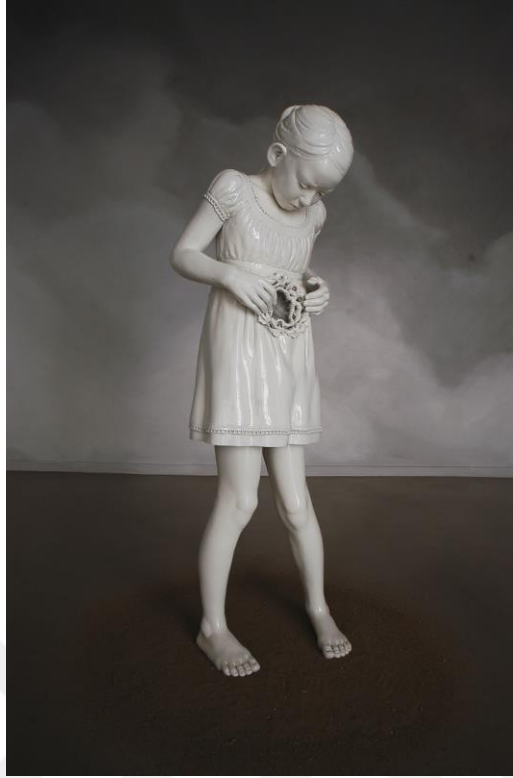
Görsel-32: May Von KROGH, “Angels Trumpet and The Milky Moon Violin”

Görsel-33’de, kırık bir camın ardından dış dünyayı izleyen bir kız çocuğu görülmektedir. Camın kırık olması, geri dönüşü olmayan zararların verildiği yönünde bir çağrışım yapabilir. Çünkü cam doğası gereği zarar gördüğünde dönüşüm yaşayan bir materyaldir. Yansımada gördüğümüz insan ise, sanatçının acı gerçeklerle yüzleşme anını anlatıyor olabilir. Bu bağlamda sanatçının eserini bu şekilde fotoğraflaması sunumun bir parçasıdır. Aynı zamanda çocuğun heykelsi yapısı ve aynı karede gerçek bir insanın bulunması, çocuklara verilen zararın gösterilmesi noktasında kontrast bir etki uyandırmaktadır. Son olarak elinde bulunan çanta beklide, içinde bulunduğu korkunç dünyadan çıkma arzusunu dile getiriyor olabilir. Krogh’un eserlerinden, yapı bozunumu ve masumiyet imgeleri bu tez çalışmasının ortaya çıkış noktalarından biri olmuştur