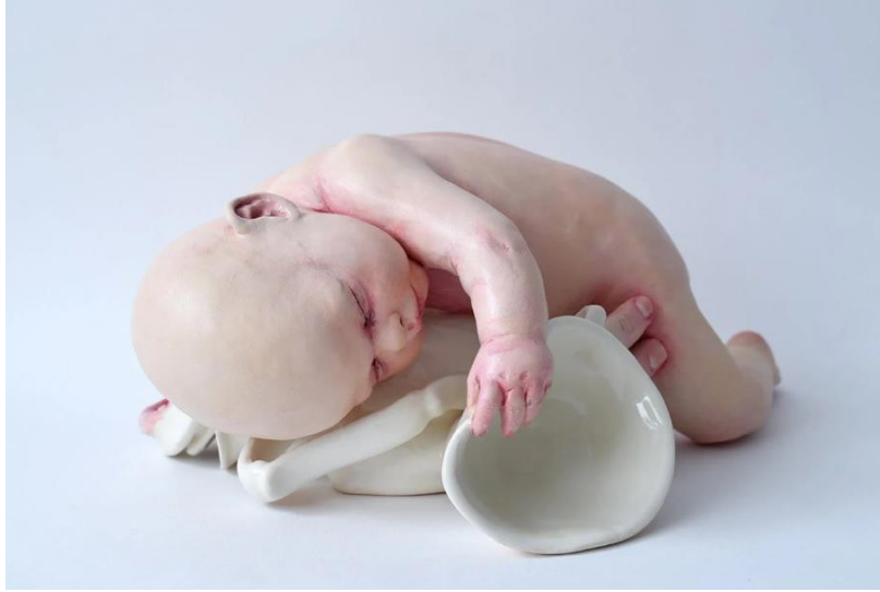
Görsel-23: “Baby and a Kettle”- Clay, Glaze, Acrylic Paint

Görsel-23'teki eserde, uyumakta olan bir bebek figürü daha görmekteyiz. Sanatçının çok sayıda eserinde görebileceğiniz nesne-uzuv ilişkisi burada, fincan üzerinde yorumlanmıştır. Fincanın elastik formu organikleştiğini, bir anlamda nesne olmaktan öteye geçtiğini göstermektedir. Fincan forumu üzerindeki parmakların çocuğa dokunması, onun üzerinde bir irade yahut kontrol sağladığını gösterebilir. Nitekim fincan bir çeşit tüketim kabıdır. Bundan dolayı sanatçı çocuk üzerinde söz sahibi olduğunu, masumiyetinin idare altına alındığını anlatmak istemiş olabilir. Baranga'nın eserlerinden ve üslubundan, çocuk imgesindeki masumiyet, düş dünyasındaki çocuk, anlatılarından bu çışmada faydalanılmıştır.