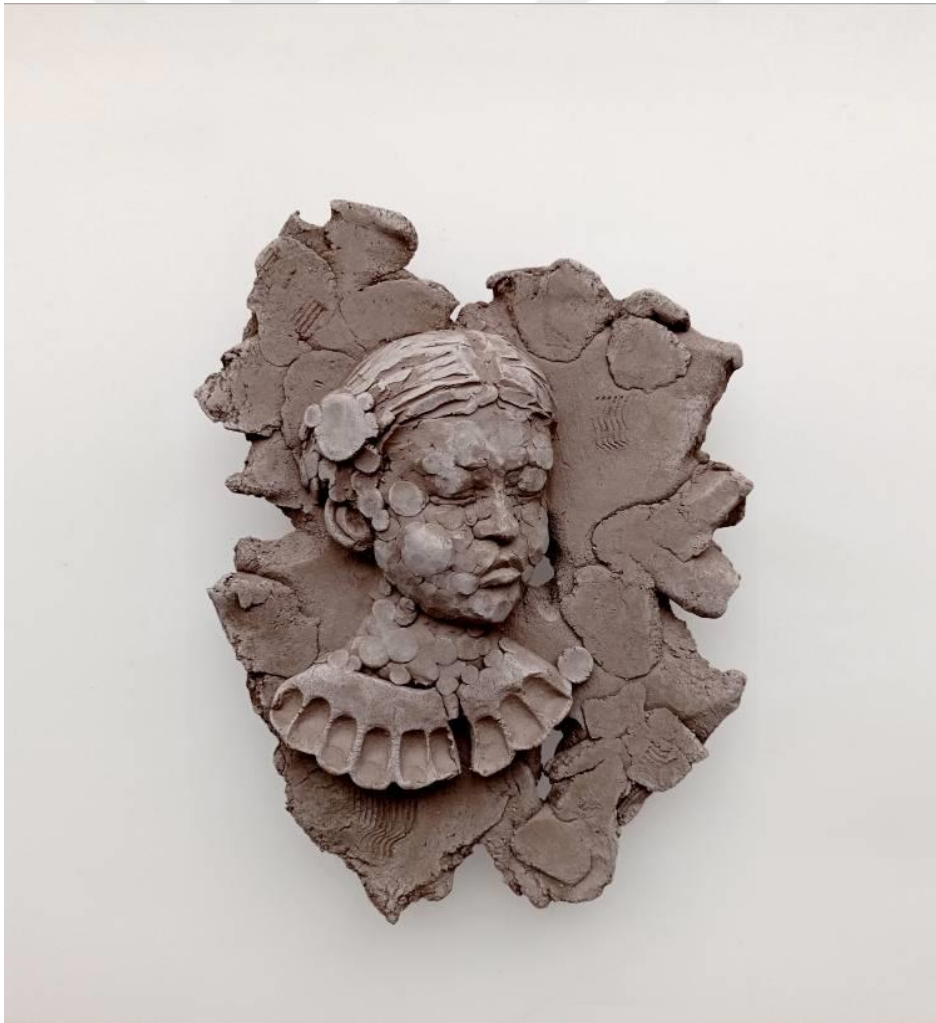
Görsel-47: "Innocence Series-9" 25x21x8cm

Eserde anlatıyı desteklemek adına, işlemeli bir yaka formu betimlenmiştir. Buda onu bir anlamda daha soylu bir noktaya konumlandırmaktadır. Yüzündeki ve bedenindeki lekeler, yetişkinlerin çocuk üzerindeki iradesi neticesinde, yozlaşma sürecini temsil etmektedir.