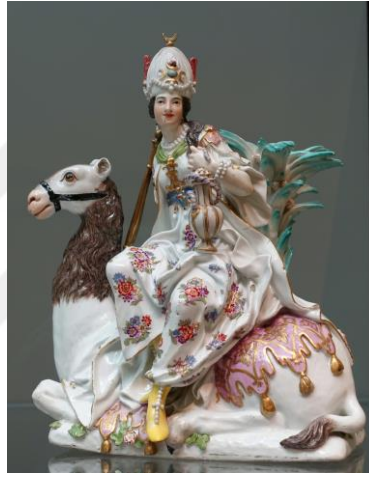
Görsel-15: Meissen Porselen Figür, Meissen, Almanya

yelpazesinin genişlemesinde belirleyici etken olmuştur. Uzakdoğu'dan gelen seramik ürünlerin kraliyet ailesi ve bu zümreye mensup soyluların koleksiyonları içerisinde sıklıkla tercih edildiği görülmektedir. Batı liderleri içerisinde bilhassa Alman kral II. Frederick, dünya çapında seramik sanatçılarının, Berlin'e getirilmesi ve daha iyi kalitede seramik ve porselenlerin üretilmesinde, kraliyet seramik fabrikalarının kurulmasına kadar uzanan bir sürece öncülük etmiştir (Önal, 2015: 16). Görsel-15'te Meissen seramik fabrikalarında üretilen, porselen bir biblo kompozisyonu görülmektedir. Sır altı ve sır üstü dekor teknikleriyle üretilen bu eser, detaylı bezemeleriyle dönemin güzel örneklerinden birisidir.