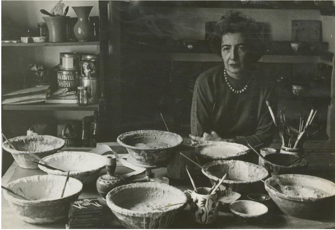
Görsel-7: Füreyya Koral Atölyesi

sayıda genç sanatçı, Füreyya Koral aracılığı ile seramikle tanışır ve kendisiyle çalışma fırsatı bulur. Sanatçı 1950’li yıllardan 1970’in ortalarına uzanan süreçte, duvar panoları üzerinde çalışmıştır. 1980’li yıllara gelindiğinde ise sanatçının terracotta evleri ve bunların içindeki insanların konu alındığı eserleri görülmektedir. Sanat hayatının son dönemlerinde doğru kadın figürünü yoğun olarak kullanmıştır (Erman, 2008: 57). Görsel-7’de Füreyya Koral’ın kişisel seramik atölyesinden bir kare görülmektedir.