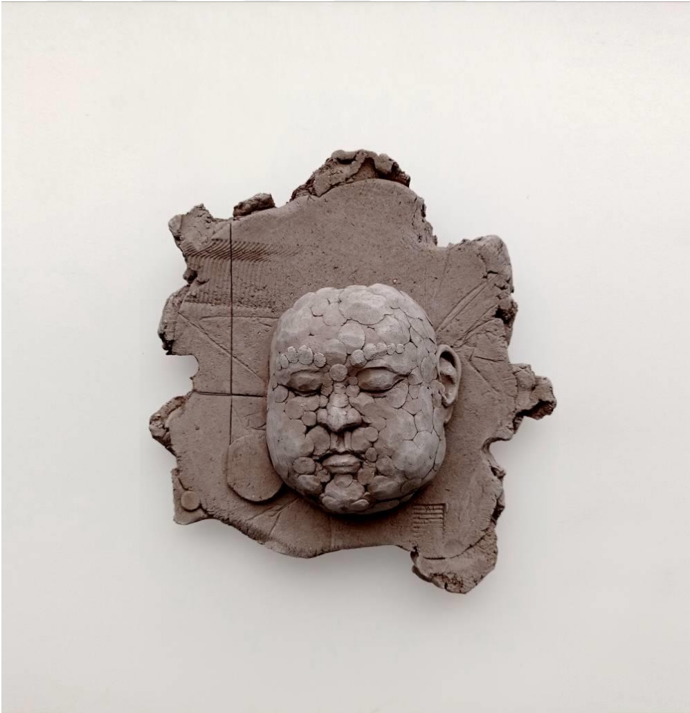
Görsel-41: "Innocence Series-3" 20x21x7cm

Kompozisyonun oluşturulması noktasında belirleyici faktör yapı-bozunumdur. Eserin figür kısmı ve yüzey bölümü arasında, bütünleyici bir ilişki kurulmuştur. Eser üzerinde yüzey daha yalın yorumlanarak, portre lekesele çalışılmıştır. Yüzey üzerinde, yer yer izler bırakılarak, iki ayrı birim arasındaki etkileşimi sağlamak amaçlanmıştır.