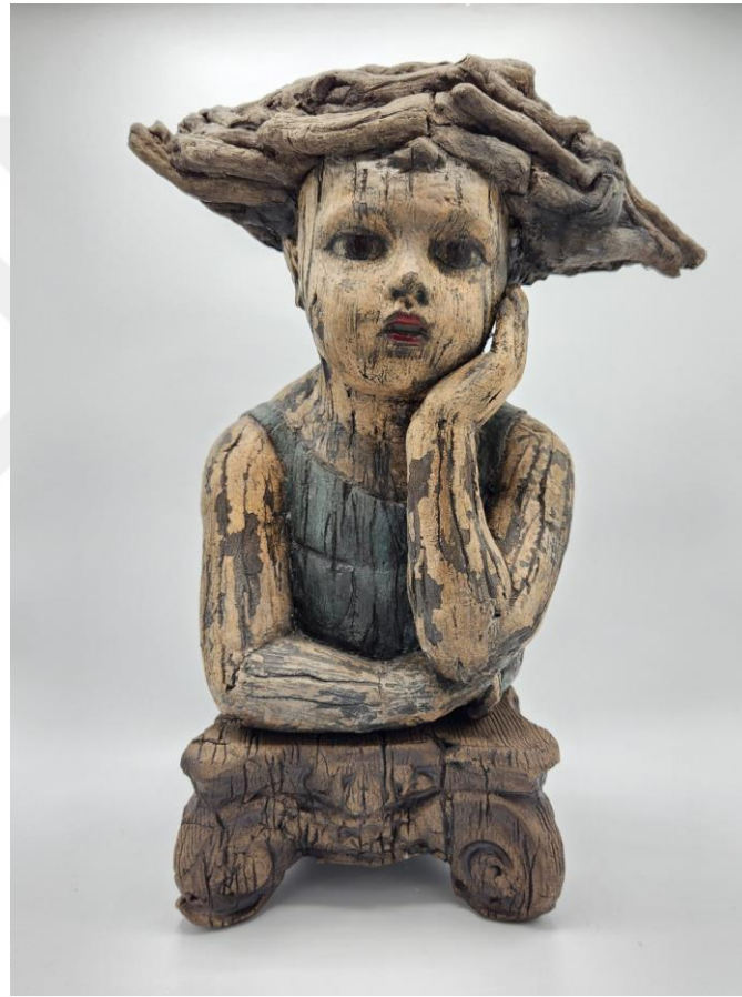
Görsel-26: Margaret KEELAN, "Contemplating Air and Water", 2022, Ceramic cast acrylic, 16" x 7" x 7"cm

yıpranmış, eski ahşap dokularına sahip muazzam eserler üretmektedir. Eserlerinde çoklu katmanlar halinde sırlama çalışmaları yaparak, eski bir görünüm elde etmektedir. Sanatçının eserleri üzerine oturduğu ana tema, yıpranmış dokuların, insan hayatındaki anıları ve yaşanmışlıkları temsili üzerinedir (Almalı, 2024: 62). Görsel-26'da sunulan eser, farklı sırlama teknikleri sayesinde, doğal bir ahşap görünüm elde edilecek şekilde tasarlanmıştır. Uzaklara dalmış şekilde imgelenen figür, yüz hatları itibariyle, duygudan uzak bir görünüme sahiptir. Aynı zamanda çocuğun saçlarının modellenmesi noktasında elde edilen form, yetişkin elini çağrıştırabilecek bir biçime sahiptir