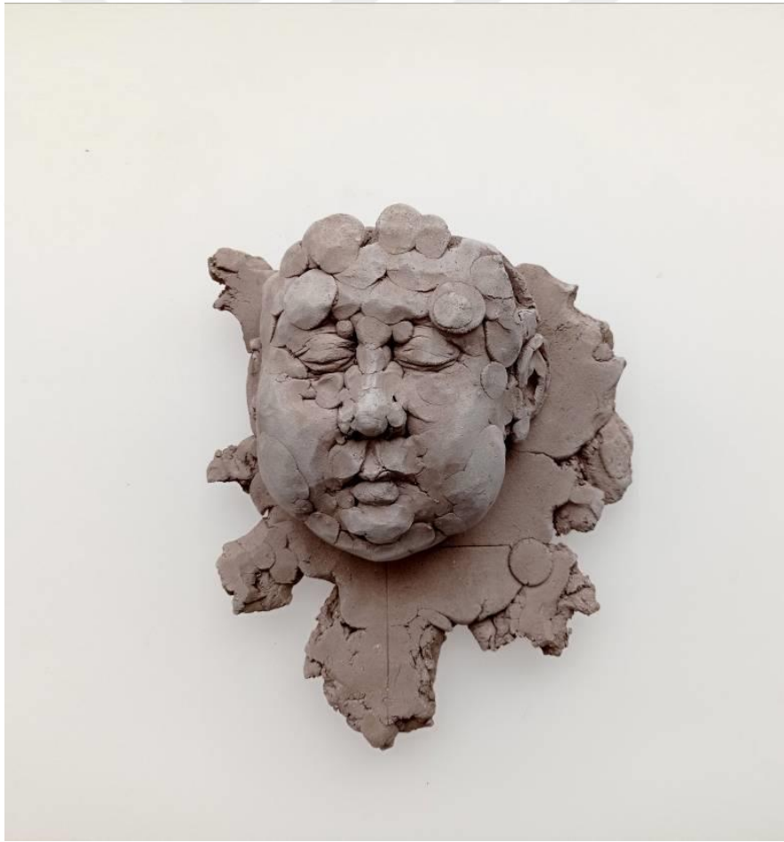
Görsel-42: “Innocence Series-4” 24x20x8cm

Bu bağlamda yapılan eserde Asyalı bir çocuğu çağrıştıracak yüz hatları tasvir edilmiştir. Eserde yer yer kopan parçalar, ailelerinden, yurtlarından koparılmalarına gönderme yapmaktadır.