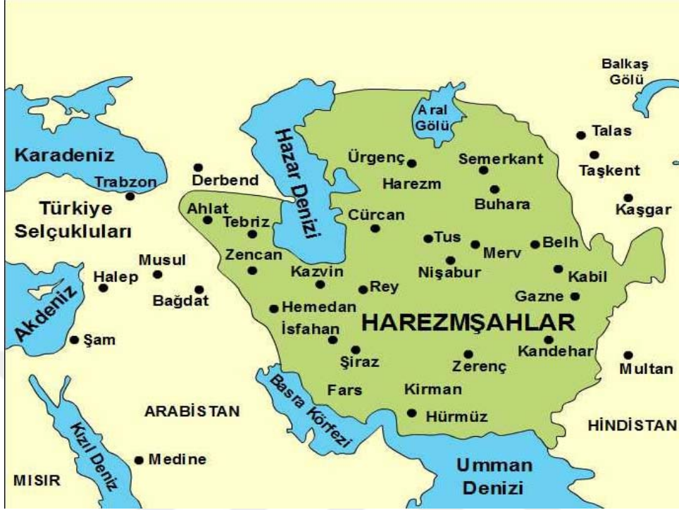
Harezmşahlar Devleti Haritası

http://www.kerimusta.com/wpcontent/uploads/2013/11/0d9b8d66110d8c984492ba96346d26c01a978ba89e014.jpeg , 11.04.2019, saat 18:32)