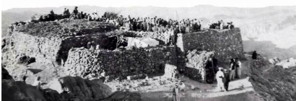
Fotoğraf-4: Sefine Tepesi'nin 100 yıl önceki ve günümüzdeki görünümü