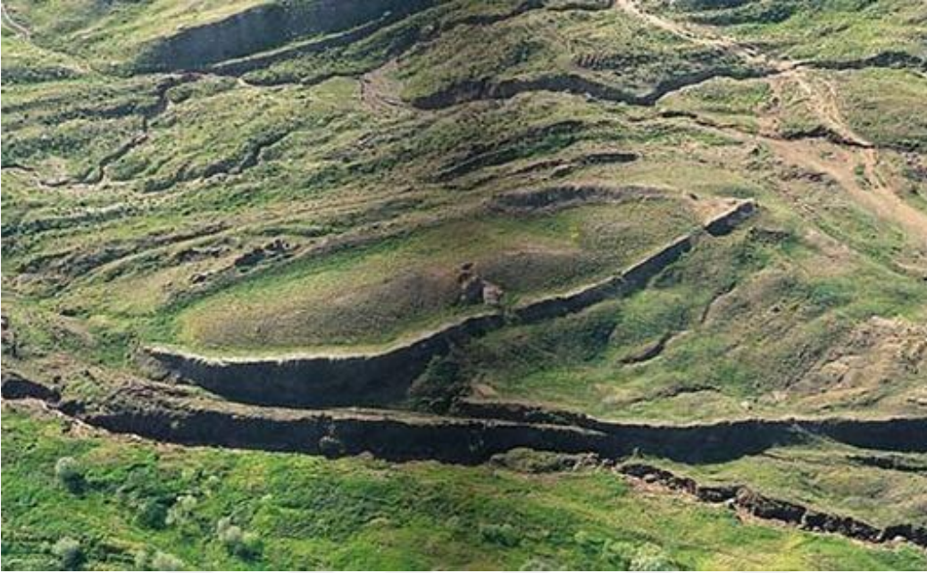
Fotoğraf-1: Ara Güler' in Ağrı Dağı' nda fotoğrafını çektiği gemi şekline benzer yer şekli