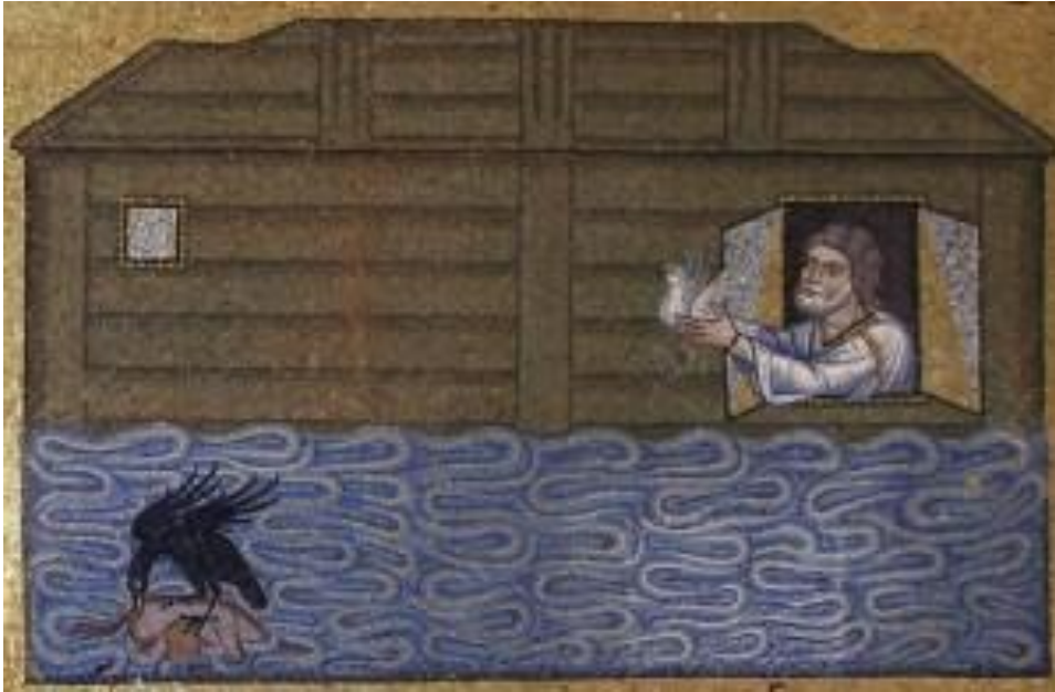
Resim - 4: Hz. Nuh'un gönderdiği kuzgunun dönmeşi ve yerine güvercinin gönderilmesi (St. Marko Kilisesi, Venedik/İTALYA)