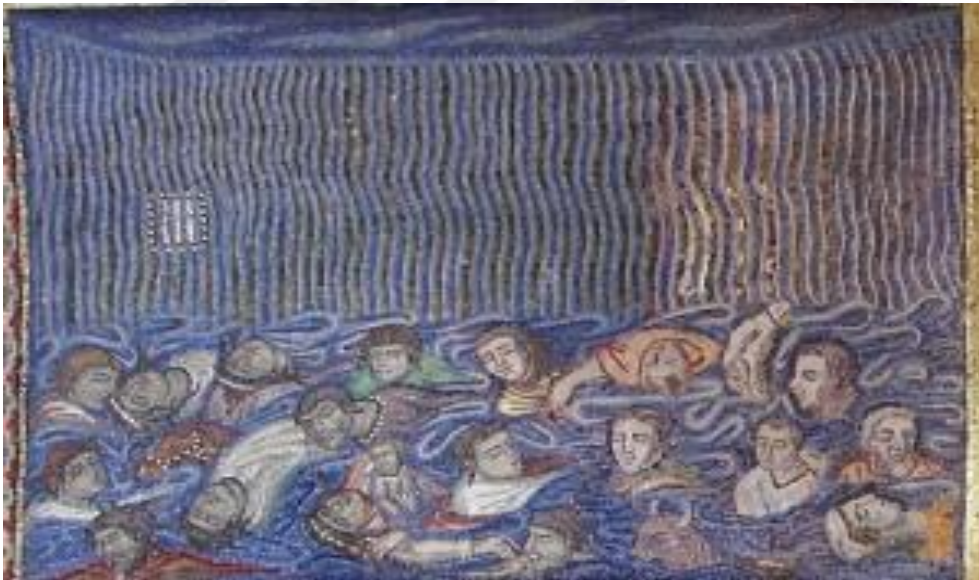
Resim - 3: Suların yükselişi ve tufanda boğulanlar (St. Marco Kilisesi, Venedik, İTALYA)