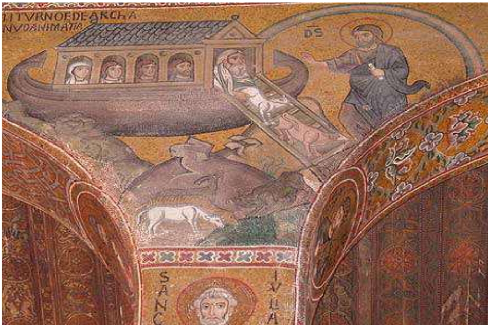
Resim - 5: Tufanın bitişi ve gemiden iniş (Palatina Şapeli, Venedik/İTALYA)