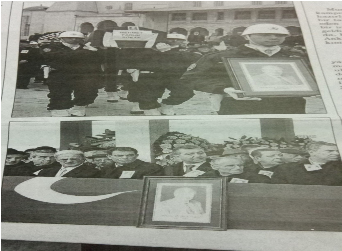
27-Faruk Sükan'ın TBMM'de cenaze töreni 568