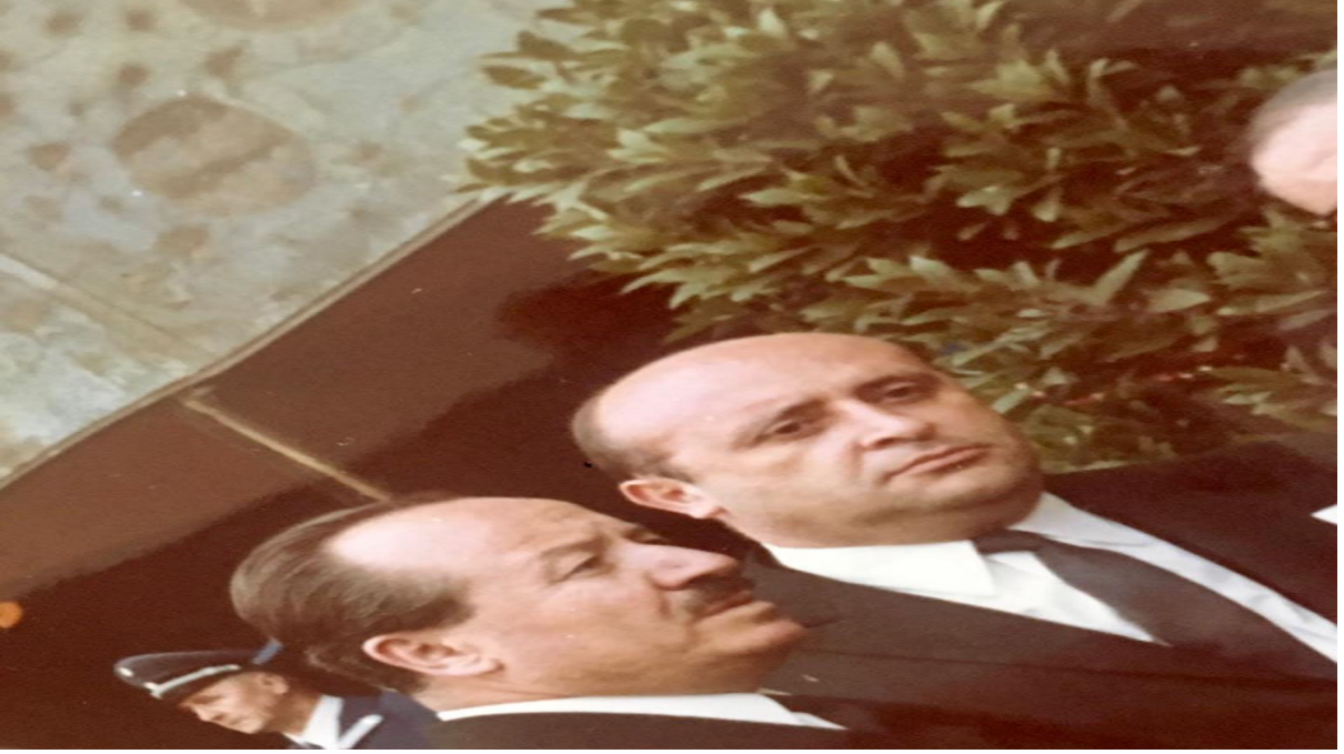
5-Faruk Sükan ve Süleyman Demirel 545