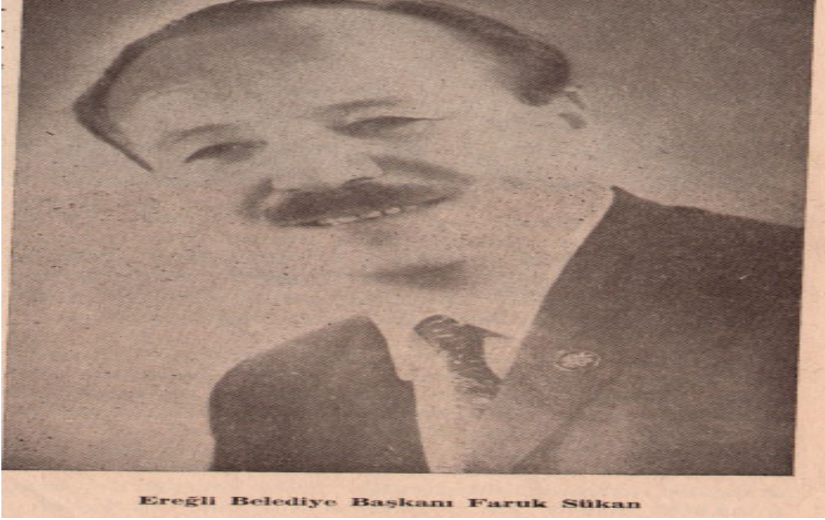
1-Ereğli Belediye Başkanı Faruk Sükan 541