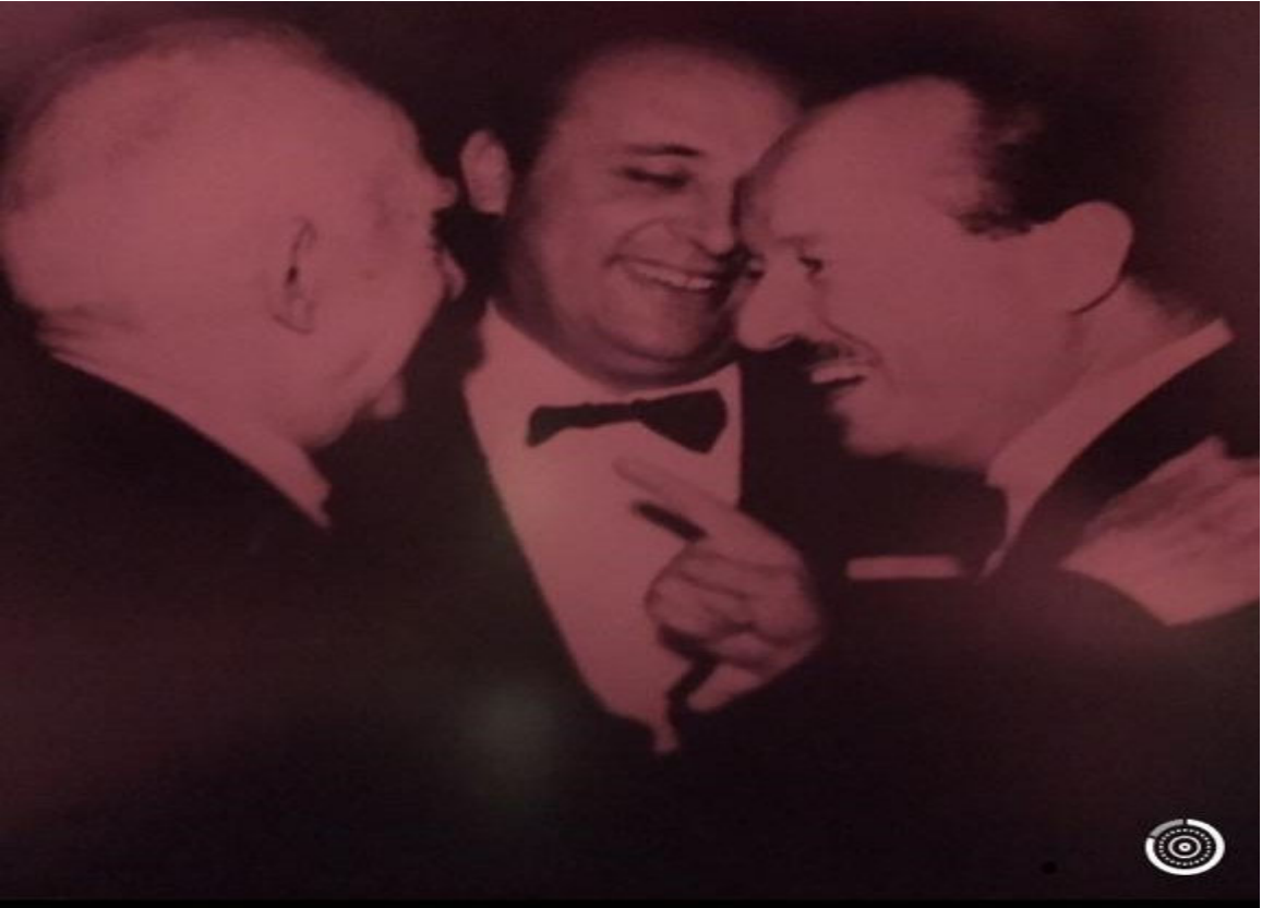
6-Faruk Sükan, Süleyman Demirel ve İsmet İnönü 546