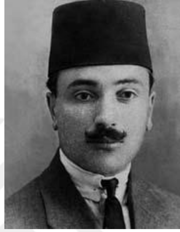
Bekir Refik Koraltan