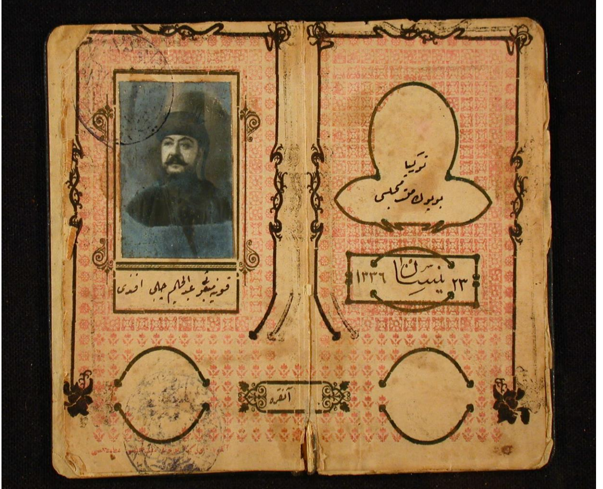
Ek 3: Abdülhalim Çelebi Efendi'nin TBMM Kimliği