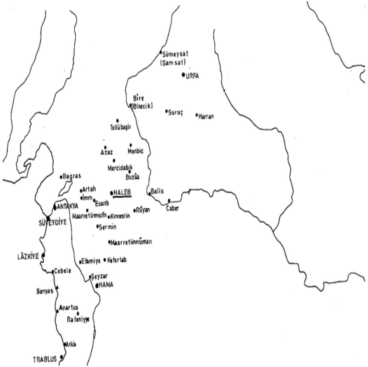
Harita 4. Urfa, Halep, Antakya ve Trablus Bölgesi Bu harita, Haçlı Devletlerinin coğrafi konumunu ve çevresindeki başlıca önemli şehir ve yerleşim merkezleri (Halep, Antakya, Trablus vb.) göstermektedir.