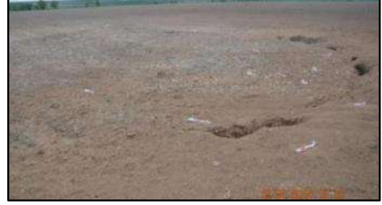
Fotoğraf 21 ve 22: Hançerli Obruğu'nun oluşum ve kapatılmış görüntüsü