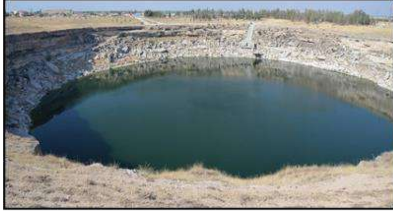
Fotoğraf 4: Timraş Obruk Gölü'nün güneyden görünümü

Apa Obruğu: Çumra ilçesinin Apasaraycık mahallesinin güneybatısında yer alır. Obruk, Miosen yaşlı konglomeralar içerisinde oluşmuştur. Deniz seviyesine göre üst yüzey yüksekliği 1065 m, obruğun göl suyu derinliği 37 m.dir. Elips şeklindeki obruğun uzun eksenini 225 m, kısa eksenini ise 150 m ölçülmüştür (Fotoğraf 5). Obruğun yamaçları oldukça dikdir. Obruk gölünün suyu içilebilir nitelikte olup, içerisinde tatlı su balıkları yaşamaktadır. Önemli bir doğal turizm değeri olan obruğun kenarında bulunan pompa istasyonu kaldırılmalı ve obruk gölünden su çekilmesine izin verilmemelidir.