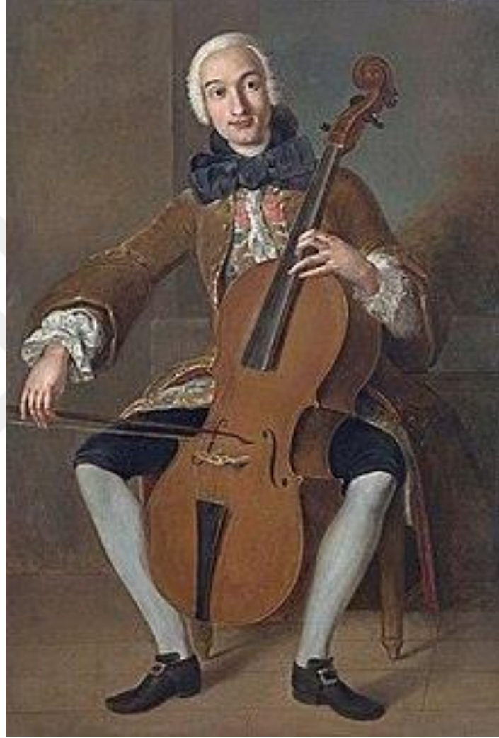
Şekil 2.3. Luigi Bocherini