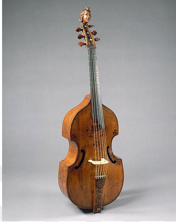
Şekil 2.1. Viola da Gamba

Aşağıdaki görselde Viyolosel'in atası kabul edilen Viola da Gamba yer almaktadır.