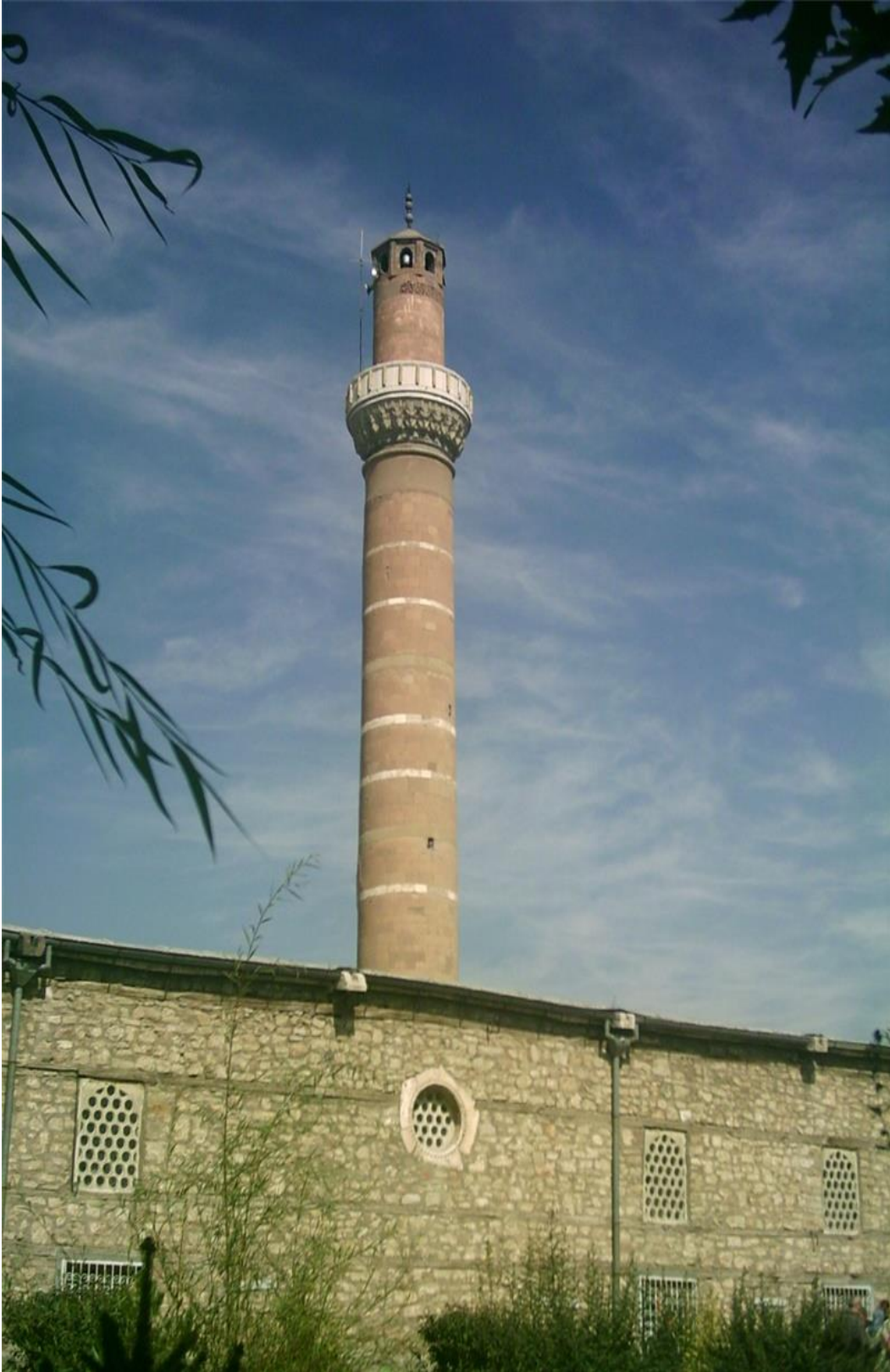
Şekil 1.5. Ereğli Ulu Camii