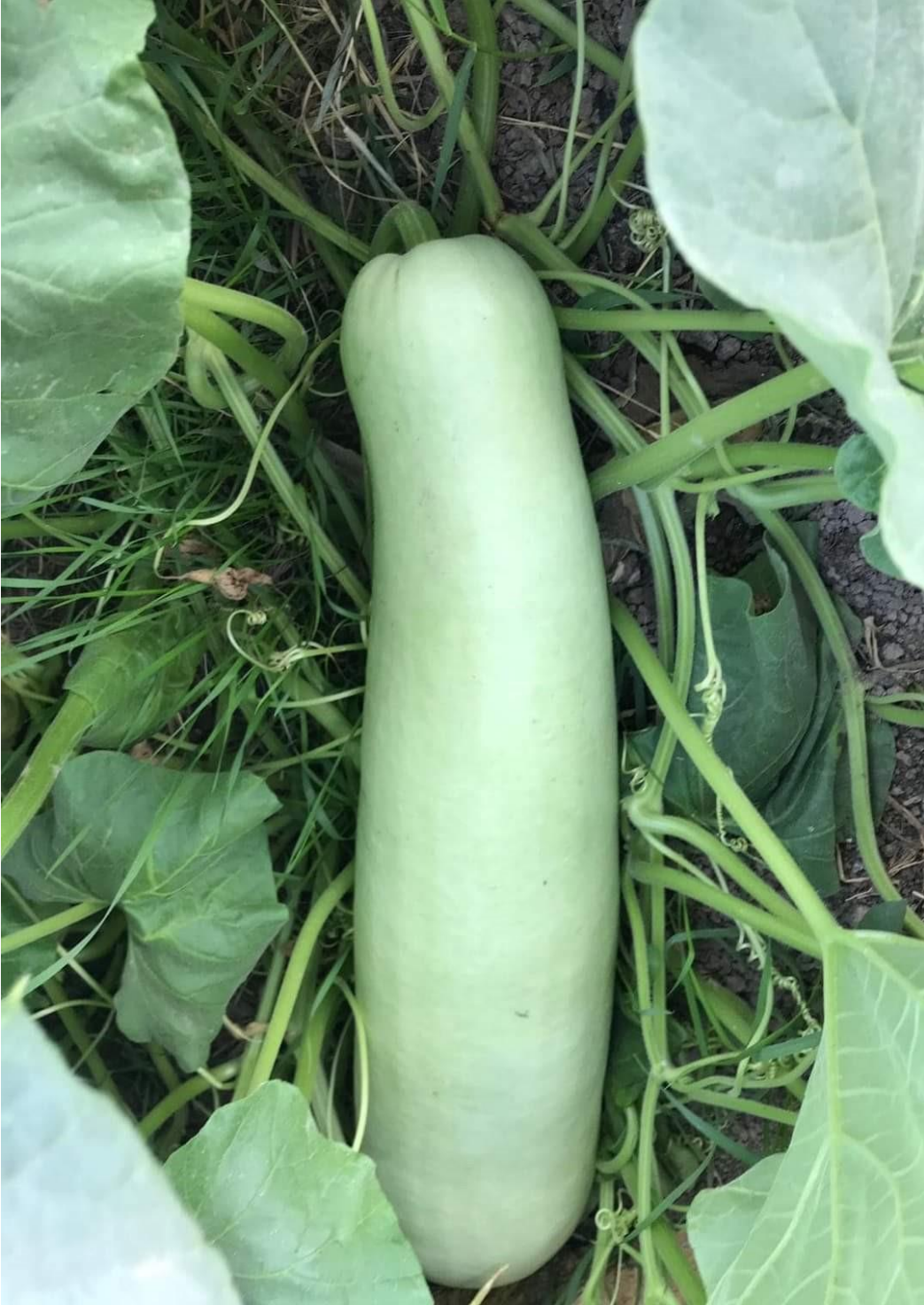
Şekil 1.11. Ereğli Uzun Kabağı