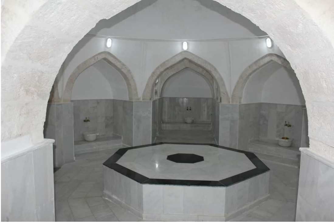
Şekil 1.6. Tarihi Şifa hamamı

Selçuklu döneminde yapıldığı ve Karamanoğulları döneminde de kullanıldığı bilinmektedir. Yazılı bir kitabesi bulunmadığından yapım tarihi bilinmeyen bu yapı, Ulu Cami'nin güneyinde yer almaktadır. Genel görüş, Karamanoğlu İbrahim Bey tarafından yaptırıldığı yönündedir. Binasının büyük bir kısmı sağlam olup günümüze kadar ulaşmış olmakla birlikte, sadece büyük kubbe yıkılmış ve restore edilmiştir. Büyük ana kubbe 3'ü büyük, 51'i küçük toplam 54 pencere bulunmaktadır (Gürbudak, 1993; www.eregli.gov.tr , 2023).