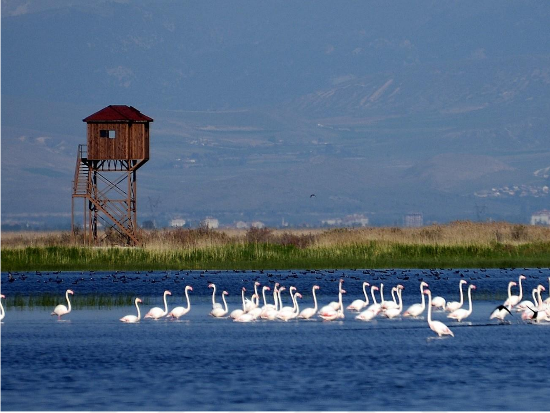
Şekil 1.4. Ak göl