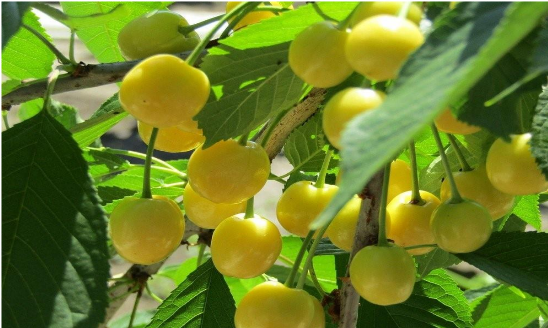
Şekil 1.8. Ereğli beyaz kirazı

Yıllık beyaz kiraz üretim miktarı İklim faktörleri (İlkbahar geç donları) dikkate alındığında yaklaşık 10.000 ton dur. Bu miktarın %60 – 70'i, İtalya başta olmak üzere diğer Avrupa ülkelerine sapı ve çekirdeği ayıklandıktan sonra salamura olarak ihraç edilmektedir.