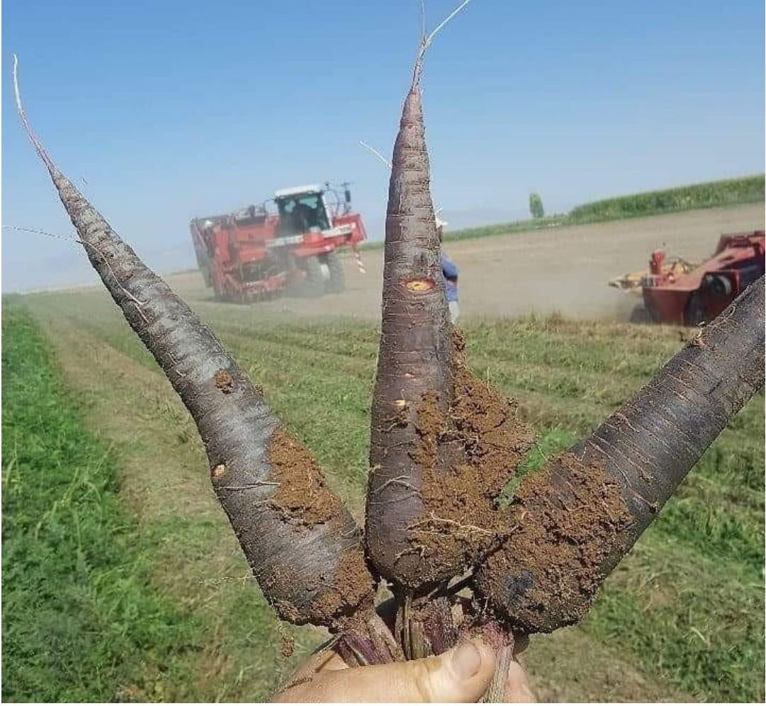
Şekil 1.9. Ereğli Siyah Havucu