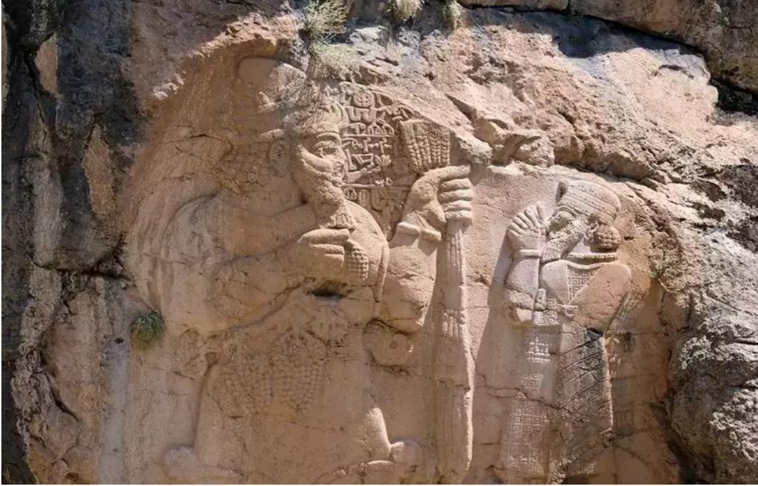
Şekil 1.3. İvriz kaya anıtı