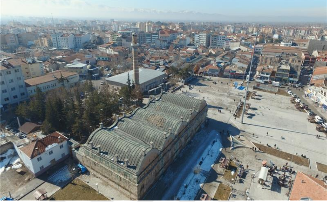
Şekil 1.2. Rüstem Paşa Kervansarayı