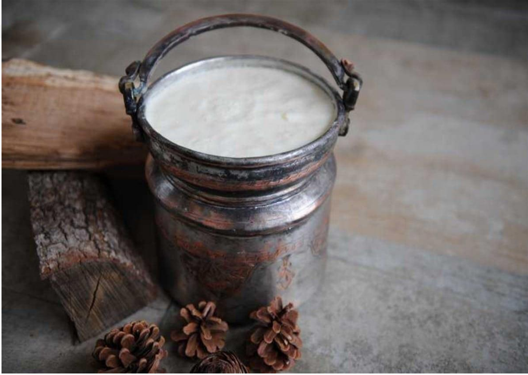
Şekil 1.10. Ereğli Koyun Yoğurdu

saat dinlendirilir. Sütün sıcaklığı 40-45 °C'ye düşünce, daha önceden yapılmış olan Ereğli Koyun Yoğurdu kullanılarak süt/maya oranı %2 olacak şekilde mayalanır. Mayalama sırasında kabın üzeri bir bez ile kapatılır ve oda sıcaklığında yaklaşık 2-3 saat bekletilir. Ereğli Koyun Yoğurdu farklı gramajlarda ambalajlanarak piyasaya sunulur. Ürünün muhafazası 0- 6 °C ± 2 °C sıcaklıkta gerçekleştirilir. Yukarıda belirtilen üretim yöntemi ev tipi üretim yöntemi olup, endüstriyel tip üretimde odun yerine doğal gaz, LPG veya elektrikle çalışan pişiriciler kullanılarak üretim gerçekleştirilir” (TPE, 2021).