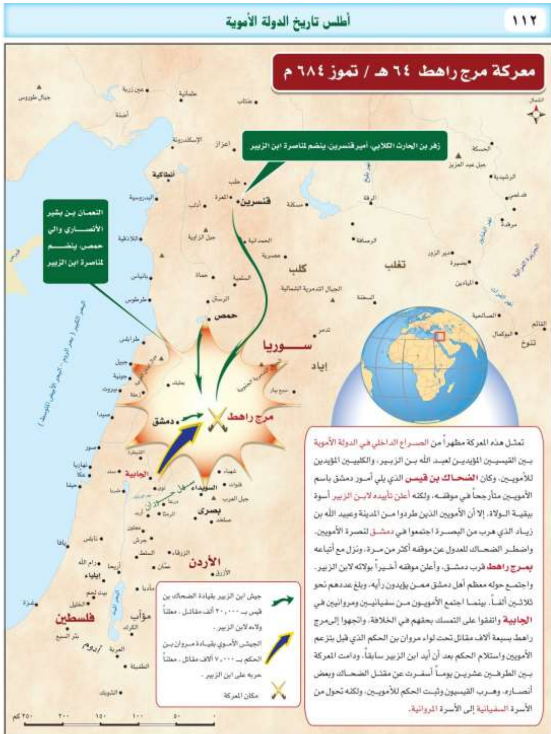
Sâmi b. Abdullah b. Ahmed el-Mağlûs, Atlas Târihu 'd Devleti 'l Ümeviyye (Riyad: 'Ubeykân, 2001), 112.