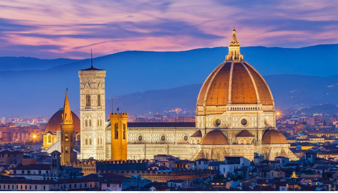
Şekil 6: St. Maria Katedrali, Floransa. 286