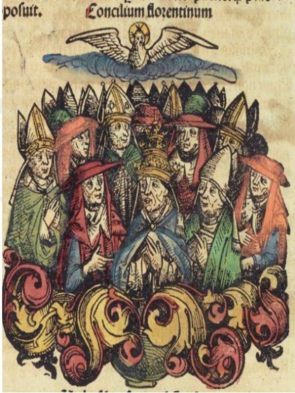
Şekil 1: Floransa Konsili tasviri 281