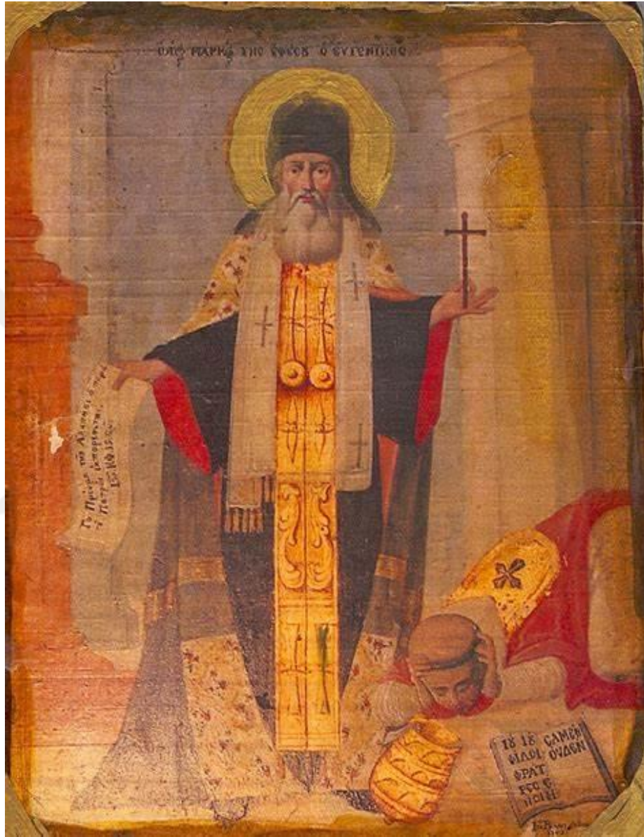
Şekil 7: Markos Eugenicus 287