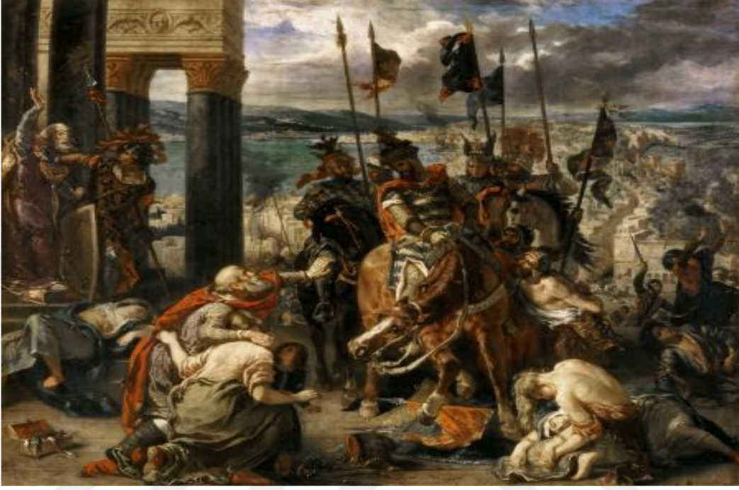
Şekil 3: Latinlerin Konstantinopolis'i işgali, Louvre Müzesi, Paris 283