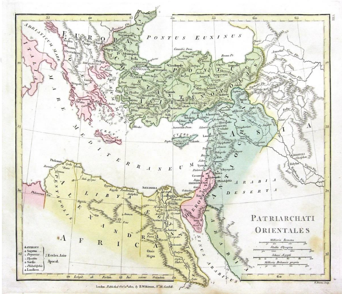
Şekil 2: İmparator Justinianus döneminde Pentarşi dağılımı 282