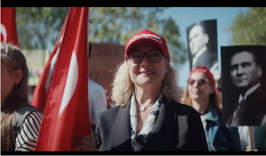
Görsel 3.14. Yapı Kredi Bankası “Çok Yaşa Cumhuriyet” Filminden Görsel

kullanılan hareketli çerçeveler birleştğinde izleyiciler için seyir zevki üst seviyede olan bir film ortaya çıkmaktadır. Kurgu esnasında bilinçli bir şekilde uygulanan bu yöntem ile çerçeveler arasındaki bağı kavrayabilmesi ve filmin hızını arttırarak izleyicinin bu dinamizmi hissetmesi amaçlanmaktadır. Bu filmde kesme ile yapılan geçişler gerek ses efektleri gerekse müzik ile desteklenerek çok daha etkili hale getirilmiştir.