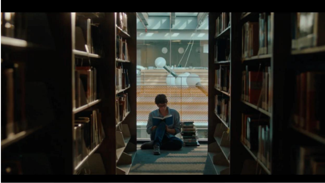
Görsel 3.5. Fiba Banka “Hayallerin Peşinde” Filminden Görsel

şekilde çalıştığı vurgulanmak istenmektedir. Ayrıca kameranın sağa ya da sola gerçekleştirdiği ani dönüşlerle de geçişlerin sağlandığı olmuştur. Ani pan olarak adlandırılan bu geçiş ile farklı ortama geçiş sağlanmaktadır.