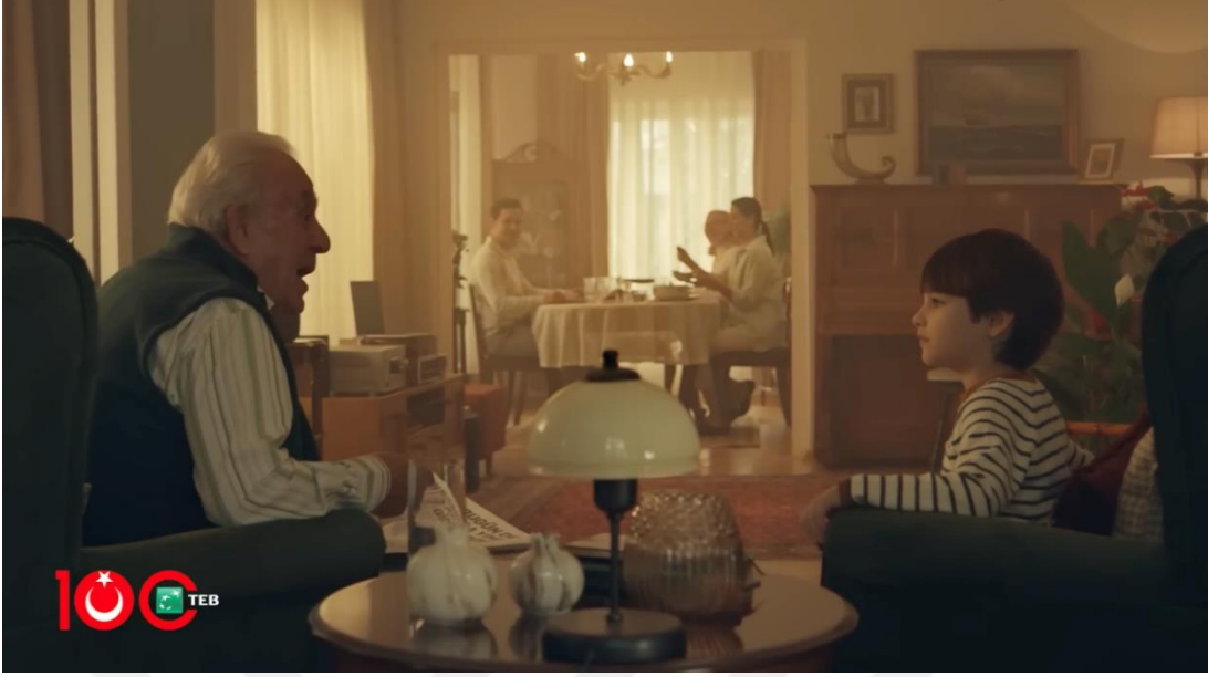
Görsel 3.10. TEB “Cumhuriyetimizin 100. Yılı Kutlu Olsun” Filminden Görsel

Söz konusu filmde kadrajlar kesme olarak adlandırılan klasik geçişi yöntemi ile birbirine bağlanmaktadır. Bu kesme yöntemi ile filmde anlatılmak istenen hikâyeyi iletirmek ve dramatik yönünü ön plana çıkarmak için uygulanmaktadır. Bunun dışında zincirleme geçiş yöntemiyle filmin final sahneleri birbirine bağlanarak duygusal olarak etkisinin artırılması amaçlanmaktadır.