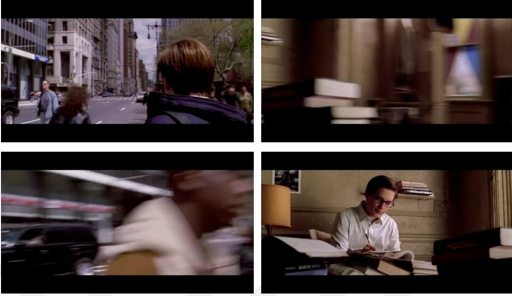
Görsel 2.7. Ani Pan Yönteminin Uygulanması