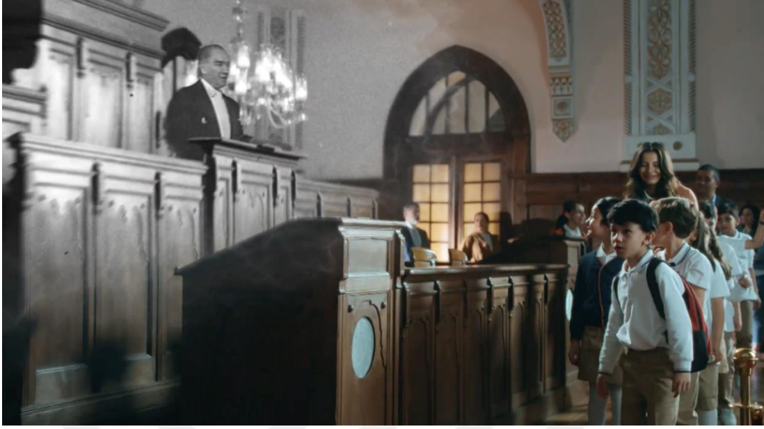
Görsel 3.12. Vakıfbank – “Daima Cumhuriyet’le” Filminden Görsel

Kurgu tekniklerine gelirsek, filmde kullanılan müziğin de etkisiyle normalden uzun planlar kullanılmaktadır. Burada kullanılan bu yavaş kurgu tekniği ile hem duygu seviyesi şiirsel bir anlatım yakalayarak yükseltilmesi hem de az önce bahsedilen bindirme geçiş yönteminin daha net olarak algılanması amaçlanmaktadır. Bununla birlikte birbiriyle zaman ve mekân anlamında ilişkisi olmayan görüntüler derleme kurgu tekniği ile belirli bir mantık çizgisinde kurgulanarak bir bütün haline getirilerek izleyiciye sunulmuştur.