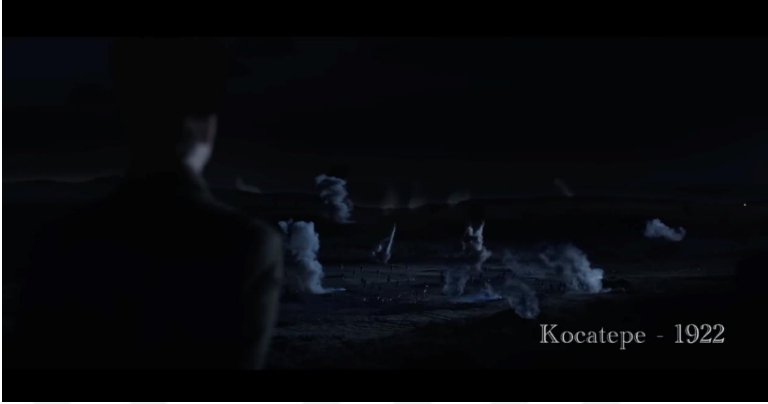
Görsel 3.18. Ziraat Bankası “Cumhuriyetimizin 100. Yılı Kutlu Olsun” Filminden Görsel

Reklam filminde birden fazla hikâyenin anlatıldığı sahneler vardır. Bu sahnelerin farklı zaman ve mekânlarda olmasından izleyicinin de zaman algısını bozmamak adına sahnelerin uygun yerlerine yer ve tarih yazılmaktadır. Bu sayede izleyenlerin olaylar, zamanlar ve mekânlar arasında kolay bir şekilde geçiş yapması amaçlanmaktadır. Burada amaç gereksiz sahnelerin izleyicide gösterilmemesi ve böylece filmin akışını hızlandırarak daha dinamik bir anlatım sağlamaktır.