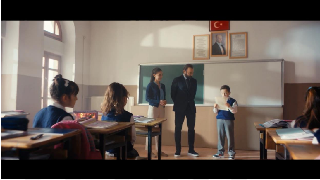
Görsel 3.6. Halkbank “Türkiye’nin Yeni Yüz Yılına Mektup” Filminden Görsel

Hazırlanan reklam filmin bir parçası olan görüntüler, klasik kesme yöntemi aracılığıyla birbirine bağlanmaktadır. Kesmeler, filmin hikâyesini ilerletmek ve görüntülerde gösterilen olayların ilgi çekiciliğini artırmak için en sık kullanılan yöntemdir. Bu yöntem uygulanırken filmde geçen karşılıklı konuşmalar temel alınarak yapılmaktadır. Bu sayede izleyicinin dikkati senaryo gereği konuşan karaktere çekilerek verilmek istenen duygunun etkisini arttırmak amaçlanmaktadır. Burada dikkat edilmesi gereken husus, her bir görüntünün özenle oluşturulduğu ve birbirine bağlanmasının rastgele bir şekilde yapılmadığıdır. Oluşturan planlar kurgulanırken devamlılık ilkesinin öne çıktığı görülmektedir. Bu sayede izleyiciyi filmin içine çekmek ve kurgunun akıcı kalmasını sağlanması amaçlanmaktadır. Kesme dışında filmin son kısmında ise farklı mekânla gerçekleştirilen çekimlerin birbirine bağlanmasında zincirleme geçiş kullanılmaktadır. Bu sayede izleyiciler art arda gelen iki çerçevenin farklı mekânlarda geçtiğini anlamaktadır.