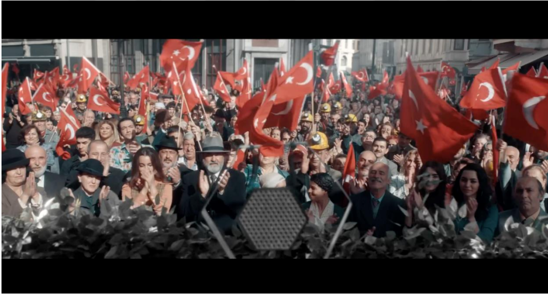
Görsel 3.7. İş Bankası “Yaşasın Cumhuriyet” Filminden Görsel

Bankası'nın Cumhuriyet'in 100. yılını kutlamak için yaptığı reklam filmi, Türkiye'nin kuruluşunun yüzüncü yıl dönümünü kutlamak için önemli bir döneme odaklanmaktadır. Bu reklam filmi, Türkiye Cumhuriyeti'nin kurucusu Mustafa Kemal Atatürk'ün mirasını ve Türkiye Cumhuriyeti'nin değerlerini vurgulayarak bu önemli yıl dönümünü Türkiye ve tüm dünyada tanıtmaktadır. Reklam filminin amacı, tarihi olaylara çağdaş bir bakış açısı vererek geniş bir izleyici kitlesine ulaşmaktır. İş Bankası'nın bu stratejisi, bankanın kültürel mirasa verdiği önemi ve dünya çapında bir marka olarak güçlü bir varlık gösterme hedeflerini göstermektedir. Reklamın içeriği, Atatürk'ün Cumhuriyet'i ilan edişine atıfta bulunarak hem tarihi bir olayın önemini vurgulayarak hem de izleyicilere bu önemli anı çağdaş bir şekilde sunarak zenginleştirilmektedir. Cumhuriyet'in ilan edildiği 1923 yılındaki mücadelelerden başlayarak Atatürk'ün 10. Yıl Nutku'na vurgu yapılmış ve Cumhuriyetimizin kuruluş gayesinin her şeyden önce mutlu etmek olduğu ön plana çıkartılmaktadır. Bu, İş Bankası'nın Türkiye'nin tarihi ve kültürel mirasını uluslararası bir platformda tanıtmaya ve kutlamaya çabalarının bir parçası olabilir.