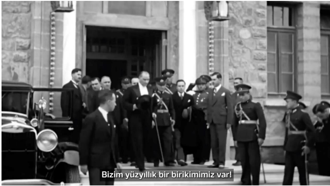
Görsel 3.3. AnadoluBank “En Değerli Birikim Cumhuriyet” Filminden Görsel

Anadolubank’ın yayınlamış olduđu bu filmde görüntüler arası geçişte en fazla başvurulan yöntemin kesme olduđu fark edilmektedir. Kesmenin yanı sıra bir görüntüden diđer görüntüye geçerken temel geçiş yöntemlerinin dışında kalan ve yukarıdaki tabloda diđer geçiş yöntemi olarak adlandırılan tür de kullanılmaktadır. Gelişen teknoloji ve kurgu sistemlerindeki dijitalleşmenin sonucunda farklı isimde ve şekilde binlerce yeni geçiş yöntemi oluşturulmaktadır.