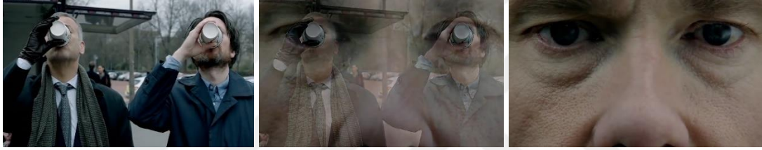
Görsel 2.2. Zincirleme Yönteminin Uygulanması

Zincirleme geçişler, bir hikâyede iki veya daha fazla olayın aynı anda veya hemen hemen aynı anda ilerlediği bir kurgu tekniğidir. Bu teknik, farklı mekânlarda veya karakterler arasında gidip gelmeyi içermektedir. Böylece izleyiciye birbiriyle bağlantılı iki olayın gelişimini takip etme fırsatı verir. Zincirleme geçişler, hikâyenin gelişimini hızlandırmakta, gerilimi arttırmakta ve izleyiciyi farklı unsurlar arasında bağlantılar kurmaya teşvik etmektedir (Belkaya, 2001:97).