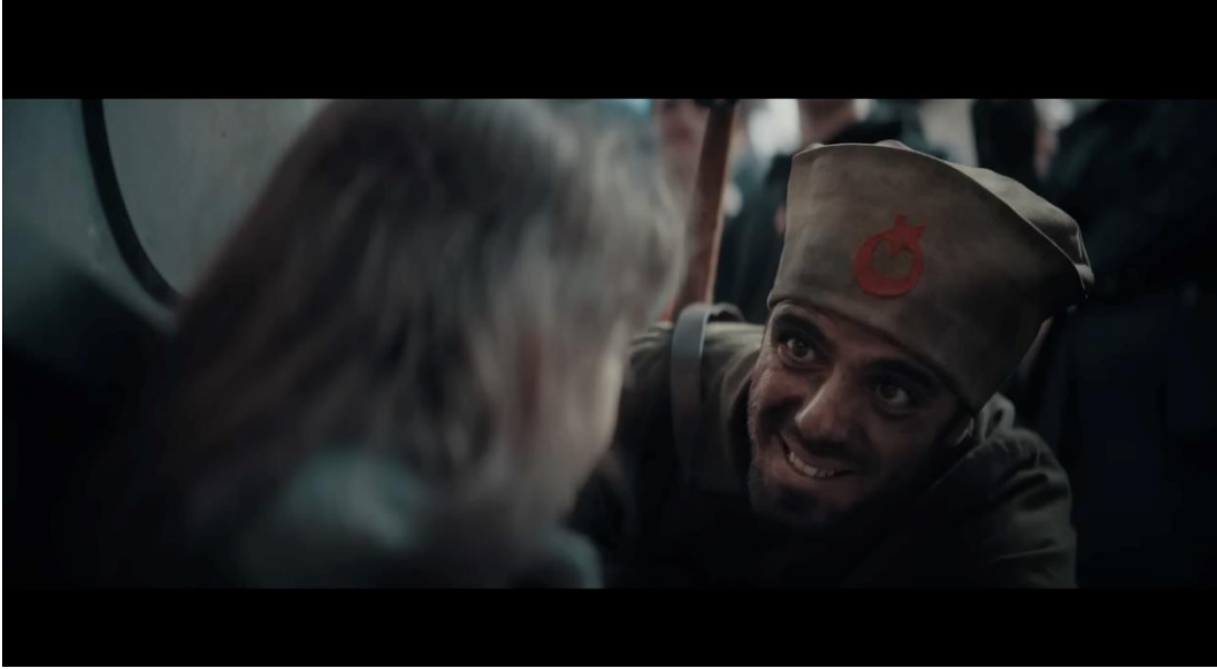
Görsel 3.8. İş Bankası “Yaşasın Cumhuriyet” Filminden Görsel

Reklam filmi, kurgu ile hikâyeye anlatmada sıkça kullanılan tekniklerden biri olan paralel kurgu ile kurgulanmıştır. Karakterlerden kesitlerin izleyiciye gösterildiği sahneler senaryodaki sıraya ve zaman akışına uygun olarak paralel biçimde kurgulanmakta ve ardından karakterlerin birlikte yer aldığı sahne ile paralel kurgu sonlanmaktadır. Gerek kullanılan müzik gerekse final bölümünde Mustafa Kemal Atatürk'ün Cumhuriyet'in 10. yılı törenlerinden görüntülerinin gösterilmesiyle çok güçlü bir drama ile sona ermektedir.