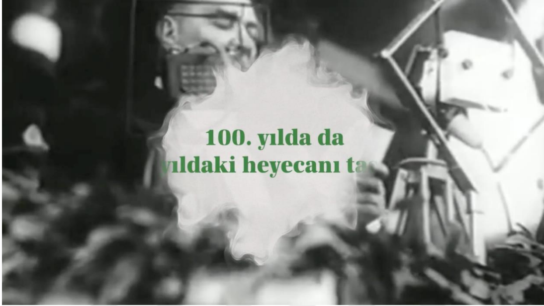
Görsel 3.9. Şekerbank “Cumhuriyetimizin 100. Yılı Kutlu Olsun” Filminden Görsel

anlatılan ve damla efektine benzeyen geçişlerle görsel açıdan zenginleştirilmektedir. Finalde ise verilmek istenen yazılı mesajlar zincirleme yöntemiyle birbirine bağlanarak sona ermektedir.