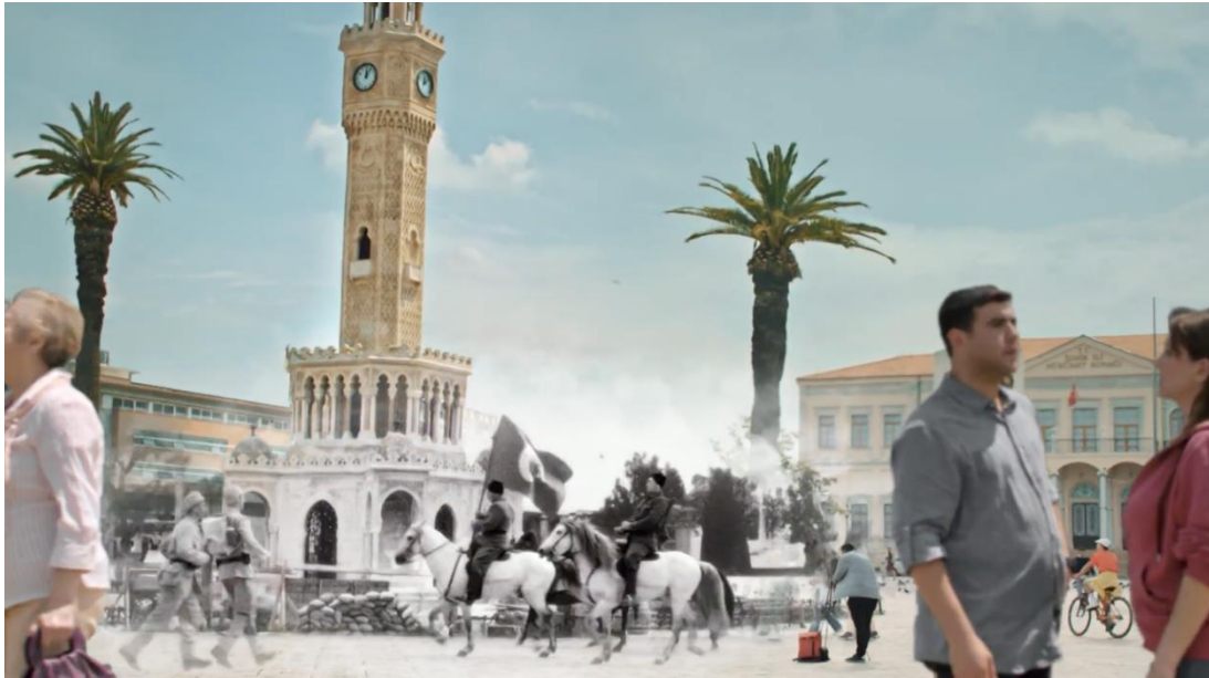
Görsel 3.11. Vakıfbank – “Daima Cumhuriyet’le” Filminden Görsel

Vakıfbank, Cumhuriyet’in 100. yılına özel olarak hazırladığı reklam filmini “100 Yıldır Cumhuriyet Daima Seninle” başlığıyla geleneksel ve dijital mecralarda yayınlamıştır. 70 saniye olarak kamuoyu ile paylaşılan filmde, siyah beyaz görüntüler ile güncel görüntüler kullanılmaktadır. Film, Türkiye’nin dört önemli şehri olan İstanbul, İzmir, Ankara ve Samsun’da çekilmektedir. Reklam filmi, Türkiye Cumhuriyeti’nin kuruluşundan bu yana geçen yüz yılı anlatmaktadır. Bu süreçte, Türkiye’nin karşılaştığı zorluklar, önemli anlar ve dönemler dramatize edilmektedir. Film, Mustafa Kemal Atatürk’ün Bandırma gemisi ile Samsun’a çıkışı ile başlayıp, Cumhuriyet’in ilanına kadar olan önemli dönemeçleri anlatmaktadır. İzmir’in kurtuluşu, sanayileşme, eğitim ve havacılık alanındaki atılımlar da dahil olmak üzere önemli dönemeçleri içermektedir. Reklam filmi, Vakıfbank’ın kamu bankası olarak üstlendiği görevlerin ve Türkiye’nin en büyük bankalarından biri haline gelmesinin bir örneğidir. Bu reklam, Türkiye’nin tarihine bir saygı duruşu olarak hizmet ederken, izleyicilere ülkenin nasıl geliştiğini ve bu süreçte karşılaştığı zorlukları göstermektedir.