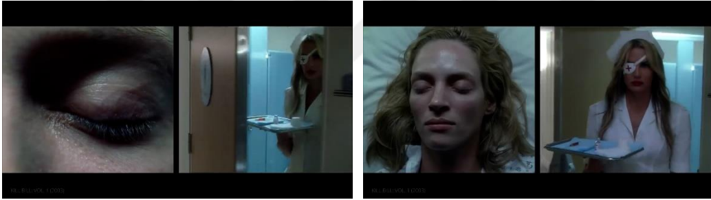
Görsel 2.9. Bindirme Yönteminin Uygulanması

Bindirme, farklı kaynaklardan gelen iki görüntünün üst üste bindirilmesi olarak tanımlanır. Bu teknik, görsel anlatıda çeşitli amaçlar için kullanılmaktadır. İki farklı sahnenin aynı anda ekranda görünmesi, bu sahneler arasında bağlantı kurulmasını sağlar. Özellikle kurguda şiirsel bir hava yaratmak amacıyla tercih edilir. Bindirme, iki görüntünün aynı anda sabit bir şekilde ekranda görünmesiyle gerçekleşir. Bu teknik, zamanın geçişini, mekân değişimini veya duygusal bağlantıları vurgulamak için kullanılır. Birinci görüntü üzerine şeffaf ya da şeffaf olmayan bir diğer görüntü eklenerek gerçekleştirilebileceği gibi, ekran çerçevesi dikey veya yatay olarak bölünerek birden fazla kamera görüntüsü aynı anda ekrana da sığdırılabilmektedir (Büker, 1985:163-165).