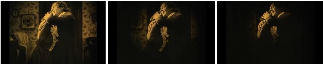
Görsel 2.6. İris Yönteminin Uygulanması

İris efekti, film kurgusunda özellikle görüntünün belirli bir alanını giderek küçülten veya büyüten bir efekti ifade etmektedir. Bu efekt genellikle bir dairenin veya ovalin açılma veya kapanma şeklinde olup, bir sahneyi başlatma veya bitirme, bir detaya odaklanma veya bir geçiş yapma amacıyla kullanılmaktadır. Bu tekniğin adı, insan gözünün iris adı verilen renkli kısmına benzemesinden gelmektedir. İris efekti, sahnenin belirli bir noktasına odaklanmayı sağlar ve izleyiciyi o noktaya yönlendirir. Film kurgusundaki önemli geçiş tekniklerinden biri olan iris efekti, Griffith'ten bu yana kullanılan ve hala varlığını sürdüren bir yöntemdir. Bu teknik, siyah bir ekranda beliren ve giderek büyüyen bir daire içinde sahnenin ilk görüntülerini ortaya çıkaran “iris-in” ve sahnenin kenarlarından beliren geniş bir daire ile ekranı karartıp kaybolana kadar küçülen “iris-out” olmak üzere iki temel türde kullanılmaktadır.