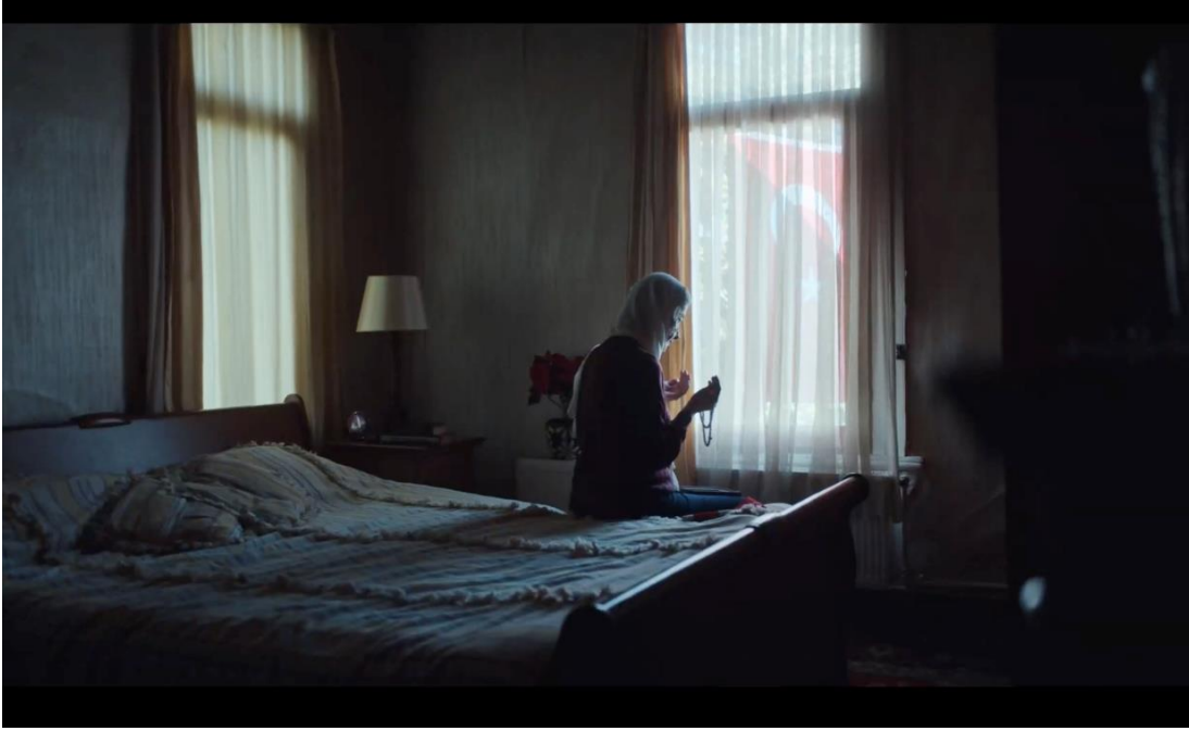
Görsel 3.15. Yapı Kredi Bankası “Çok Yaşa Cumhuriyet” Filminden Görsel

Reklam filminin kurgu aşamasında kullanılan kurgu tekniklerini incelediğimizde ise paralel kurgu, derleme kurgu, çarpıcı kurgu, 25. Kare, montaj sekans, ağır çekim ve hızlı çekim kullanılmaktadır. Bu kullanılan birden fazla teknik reklam filmini seyir açısından oldukça başarılı kılmıştır.