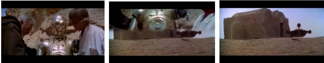
Görsel 2.3. Silinme Yönteminin Uygulanması

Silinme terimi, kurgusal bir hikâyede belirli bir nesnenin, karakterin veya konseptin bilinçli bir şekilde veya sembolik olarak ortadan kaldırılması, kaybolması veya değişmesi anlamına gelmektedir. Bu kavram, hikâyenin gelişimi, karakter gelişimi veya tema üzerinde çeşitli etkiler yaratabilmektedir. Silinmenin kullanımı, hikâyenin türüne, temalarına ve amaçlarına bağlı olarak değişebilmektedir.