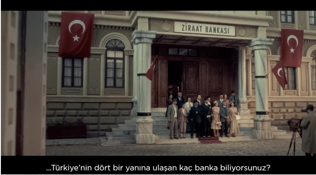
Görsel 3.17. Ziraat Bankası “Cumhuriyetimizin 100. Yılı Kutlu Olsun” Filminden Görsel

Bu reklam filminin kurgu aşamasını ele aldığımızda ise görüntülerin kesme geçiş yöntemiyle birbirine bağlandığını görmekteyiz. Bu yöntem daha önce de bahsettiğimiz gibi kurguda en fazla tercih edilen geçiş yöntemidir. Kesme aktarılmak istenen hikâyenin gelişmesinde ve sonuçlanmasında önemli bir etkiye sahiptir. Senaryoya göre önceden planlanmış kadrâjların birbirine bağlanmasında devamlılık ilkesine uyulduğu görmekteyiz. Böylece izleyicinin dikkatinin sadece senaryoya odaklanması amaçlanmaktadır. Bununla birlikte kesme yönteminin doğru zamanda doğru görüntüye uygulandığını fark etmekteyiz. Bu kurgu tekniğine eşlik eden dramatik bir müzik ile beraber filmin izleyicide bıraktığı etkinin çok daha derin olması sağlanmaktadır.