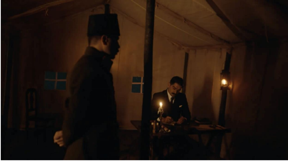
Görsel 3.4. Fiba Banka “Hayallerin Peşinde” Filminden Görsel

yapılmıştır. Film, Cumhuriyet’in ilham verici mirası ve hayallerin peşinden gitmenin önemini vurgulamaktadır. Bu tema, özellikle Mustafa Kemal Atatürk’ten ilham alarak hayallerini gerçekleştiren kişilerin hikâyeleri üzerinden işlenmektedir. Filmde, Mazhar Müfit Kansu’nun anılarından esinlenilmiştir ve Cumhuriyet hayalinden kaynaklanan girişimcilik, spor ve bilimdeki başarılar vurgulanmaktadır. Bu özel filmin amacı, Cumhuriyet’in mirasını ve başarılı kişilerin hikâyelerini tanıtmaktır.