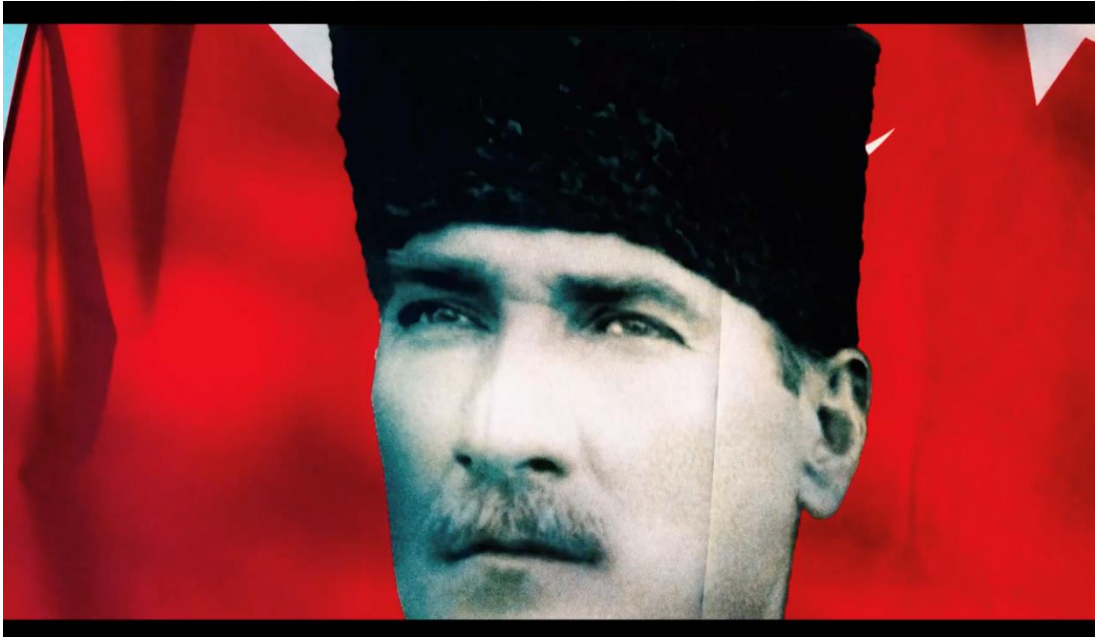
Görsel 3.16. Yapı Kredi Bankası “Çok Yaşa Cumhuriyet” Filminden Görsel

Montaj sekans yöntemiyle senaryo dahilinde anlatılan birden fazla olayların örgüsü bozulmadan izleyiciye hızlı bir şekilde aktarılmaktadır. Bu sayede geniş bir perspektif ortaya koyarak filmin temposunu ve ritmini olumsuz bir şekilde etkilemeden izleyiciye sunulmaktadır.