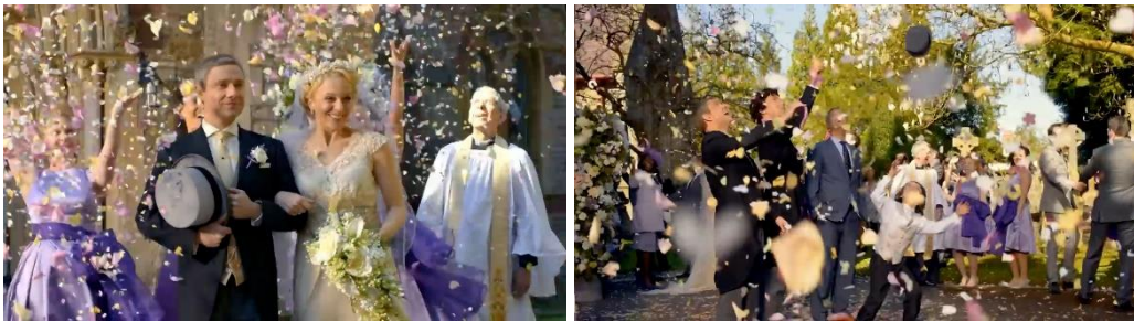
Görsel 2.8. Donma Yönteminin Uygulanması

Donma tekniği, bir sahnenin etkileyici bir sona ulaştığı anlarda kullanılan güçlü bir film kurgu aracıdır. Genellikle filmin sonunda tercih edilen bu teknikle, sahnenin son karesi bir anlığına dondurularak ekranda sabitlenir. Bu, seyirciyi o andaki atmosferi hissetmeye ve karakterlerin son durumlarını gözlemlemeye yönlendirir. Özellikle oyuncuların yüz ifadeleri bu dondurulmuş karede ön plana çıkar, duygusal bir yoğunluk yaratılır. François Truffaut'un "400 Darbe" filmindeki son sahne, bu tekniğin etkileyici bir örneğidir (Parsa, 1989:93).