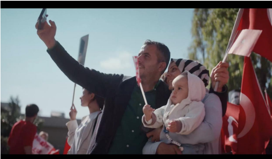
Görsel 3.13. Yapı Kredi Bankası “Çok Yaşa Cumhuriyet” Filminden Görsel

ögeler ve sinematografi, izleyiciyi duygusal olarak etkilemek ve Cumhuriyet'in önemini vurgulamak için tasarlanmıştır. Filmin yaratıcı ekibi ve yönetmeni, bu derinlemesine ve duygusal mesajı güçlü bir görsel dille aktarmak için bir dizi farklı yöntem kullanmaktadır. Yapı Kredi'nin bu filmi, Türkiye'nin 100 yıllık Cumhuriyet tarihini kutlamak ve bu dönemin değerlerini gelecek nesillere aktarmak için tasarlanmıştır. Film, Yapı Kredi'nin Cumhuriyet ilkelerine bağlılığını ve Türkiye'nin ekonomik ve toplumsal gelişimine katkıda bulunmasını gösteren bir çalışma olarak değerlendirilebilir.