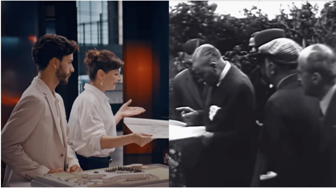
Görsel 3.1. Akbank “Ayrılamam Yolundan” Filminden Görsel

sanata kadar çeşitli alanlarda Türkiye'nin tarihi ilerlemesini duygusal karelerle göstermektedir. Cumhuriyet'e derin bir bağlılık gösteren mesajlar içermektedir. Cumhuriyet Bayramı'nı kutlayarak ülkenin ilerlemesine ve gelişimine katkıda bulunmaya söz vermektedir. Akbank, bu film ile Cumhuriyet'i, Türkiye'nin geleceği için savunmaya devam edeceğini belirtmektedir. Akbank'ın bu reklam filminde, Cumhuriyet değerlerine olan saygısını ve ülkenin 100 yıllık ilerlemesini göstermektedir.