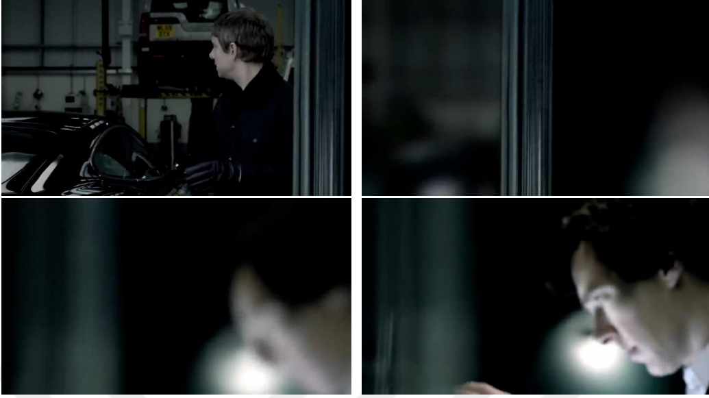
Görsel 2.5. Bulanıklaşma-Netleşme Yönteminin Uygulanması

Bu geçiş yöntemi genellikle iki sahenin birbirine geçişini ifade etmektedir. İlk sahne, görüntüsü gittikçe bulanıklaşarak belirsizleşir (out of focus). Bu teknik, odak dışındaki alanları özellikle vurgulamak ya da bir geçişin daha yumuşak olmasını sağlamak için kullanılır. Örneğin, bir sahneden diğerine geçerken bulanıklaştırma efekti kullanılarak odak noktası değiştirilebilmektedir. Ayrıca, bir karakterin hatırladığı bir anıyı canlandırmak veya rüya sekanslarını göstermek için de tercih edilebilmektedir. Bu belirsizlik içinde, ikinci sahenin görüntüsü yavaş yavaş daha belirgin hale gelir (sharp focus) Buna, netleşme denir. Bulanıklaşmanın tam tersidir; belirsizleşen ya da bulanıklaşan bir görüntüyü daha keskin ve detaylı hale getirme işlemidir. Bu genellikle bir karakterin ya da nesnenin öne çıkmasını sağlamak için kullanılır. Örneğin, bir karakterin önemli bir karar anını vurgulamak ya da izleyicinin dikkatini belirli bir detaya çekmek için netleşme efekti kullanılabilir (Toprak, *).