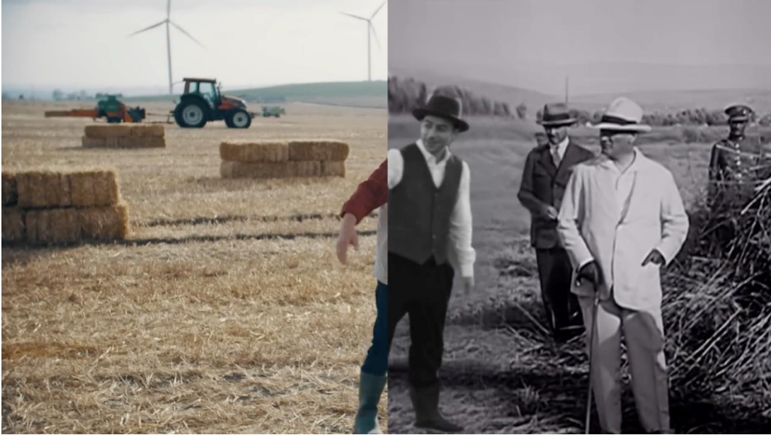
Görsel 3.2. Akbank “Ayrılamam Yolundan” Filminden Görsel

Filmin ilerleyen bölümünde ise hem geçmişe hem de günümüze ait çeşitli planlar, kesme yöntemiyle birleştirilmektedir. Bu kısımda kullanılan müzik de hızlandığı için yükselen müzik ritmiyle beraber kullanılan bu geçiş yöntemiyle filmin kurgusal anlamda da hızlanması sağlanmaktadır.