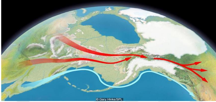
Şekil 6 Beringia kara bağlantısı

kıtasına doğru hareket ettiler. Ortalama 20.000 yıllık bir süre içerisinde Amerika kıtasının yerlileri, kıtaya yayıldılar. 37