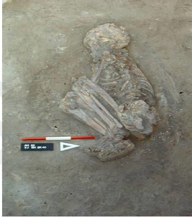
Şekil 3 Aşıklı Höyük'te bulunmuş cenin pozisyonunda iskelet ( http://www.tayproject.com )

görülmüştür. 5 Nevali Çori'de yerleşimlerin altına gömülmüş kafatasları bulunmuştur. Nevali Çori'de tıpkı Göbekli Tepe'deki dikitler gibi yapılara rastlanmıştır. 6 Görüldüğü üzere kafatası veya cenin halinde cesetler yerleşim yerinin altına gömülüyordu. Atalar kültürüne işaret eden bu durumu destekleyen bir diğer durum ise