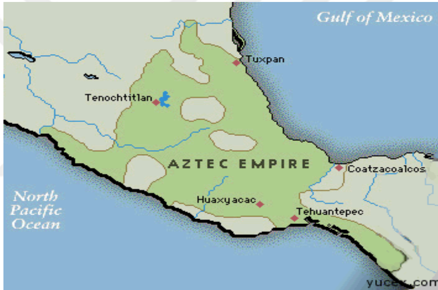
Şekil 8 Aztekler ( https://yucex.com )

haline getirmiştir. Ancak 10. Yy. da kuzeyden gelen savaşçı barbarların göçleri ile Toltek hümanizmi etkisini yitirmeye başlamıştır. 1168’de Tula yağmalanmış ve terk edilmiştir. Quetzalcoatl ile sembolize edilen uygarlık, refah ve barış; kuzeylilerin büyücü-tanrısı Tezcatlipoca ile temsil edilen insan kurbanları, militarizm ile karşılaşmıştır. Yerli Toltekler ile göçebe kuzeylilerin arasındaki bu zıtlıklar ileride Aztek dininde senkretik bir yapı haline gelecek ve iyilik-kötülük düalizmi olarak karşımıza çıkacaktır.