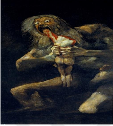
Şekil 13 Çocuğunu Yiyen Kronos (Francisco Goya)

ve gökler ne kadar uzaksa topraktan toprağın o kadar altına gömdüler onları.” 131