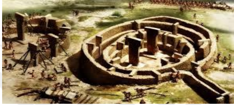
Şekil 1 Göbeklitepe'nin muhtemel ilk hali

insanlığın neden böylesi bir yapılar bütünü yaptıği sorusunu gündeme getiriyor. Zira tapınak yapımının yerleşik hayata tam olarak geçildikten sonra görülmesi gerekmektedir. Yukarıda ismini saydığımız yakın coğrafyadaki höyüklerin varlığı, Göbekli Tepe ve yakınlarındaki diğer tepelerdeki anıtların, farklı yerlerde yaşayan klanların muhtemel kült merkezi halinde ortak kullanıldığı izlenimini yaratmaktadır.