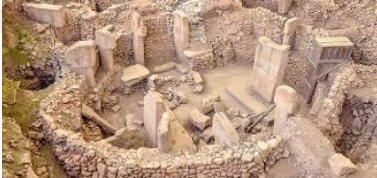
Şekil 2 ( https://www.ntv.com.tr )

Göbekli Tepe'deki inancı anlayabilmek için yakınlarındaki diğer höyüklerdeki kalıntılara da bakmak gerektir. Aşıklı Höyük'te yapılan kazılarda ölülerin evlerin tabanına cenin pozisyonunda gömüldükleri görülmüştür. 4 Çayönü'nde akeramik dönemdeki kalıntılarda yine cenin pozisyonunda gömülmeler