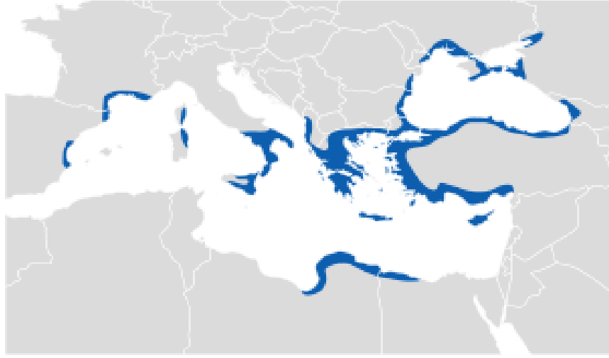
Şekil 12 Antik Yunan kültür havzası ( https:// wikimedia.org )

Paleolitik ve Neolitik'te bu coğrafyadaki yaşayış ve göçler üzerinde durmaktan ziyade Tunç çağı dönemiyle birlikte antik Yunan kültürünü incelemek gerekir. Zira Yunan din ve kültürü bu dönemde belirgin şekilde ortaya çıkmaya başlamaktadır. Yunan kültürü net olarak Tunç çağında Girit adasında ilk olarak kapsamlı bir şekilde karşımıza çıkmaktadır. Homeros'un destanlarında da anlatılan Knossos sarayı gibi büyük saraylar adanın birçok yerinde bulunmuştur. 102 Yunan mitlerinde Knossos sarayının kralı Minos'un güçlü ordularının ve donanmasının Ege adalarını ele geçirip, anakaradaki şehirleri işgal edip haraca bağladığı anlatılmaktadır. 103 Anakara Yunanistan'da ise Akalar m.ö. 3. binyılda yerleşmeye başlamışlardır. Homeros'un İlyada'sında Yunanlıları ifade etmek için Akaları kullandığı görülmektedir. Nereden geldikleri noktasında tartışmalar olan bu topluluk İlyada'da anakara halklarını kapsamaması nedeniyle ilk etnik Yunan toplumu olarak görülebilir. Giritlilerden fazlasıyla etkilenmiş olan bu topluluk Miken kültürü adı altında kendi kültür havzasını oluşturmuştur. M.ö.1600'lerde Peloponez yarımadasında Aka şehir devletleri kurulmuşlardır. 104 Akalara dair bilinen en önemli olay