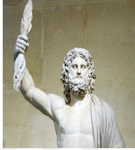
Şekil 9 Zeus ( https://arkeofili.com )