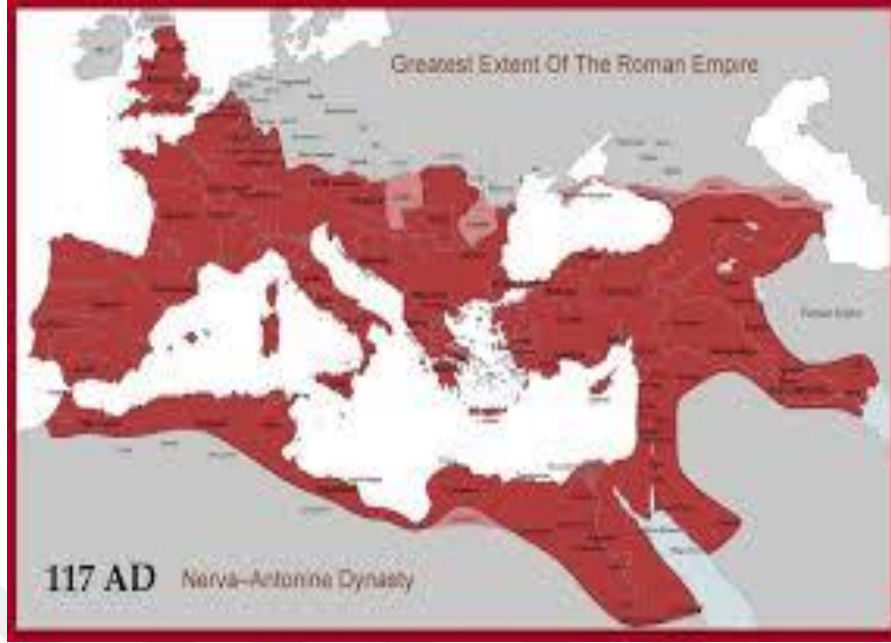
Şekil 14. En geniş sınırlarına ulaşmış Roma uygarlığı ( https://www.irfankaygisiz.com/2018/11/16/roma-imparatorlugu )