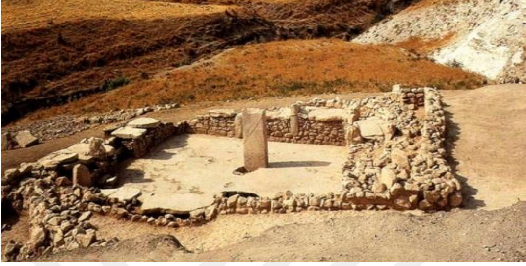
Şekil 4 Nevalı Çori'de bulunmuş dikit

Göbekli Tepe'deki dikitlerin insan formunda dikilmesidir. Ayrıca dikitlerin üzerlerinde hayvan figürleri bulunmuştur. Atalar kültürünün olması durumunda Göbekli Tepe'deki dikitlerin her biri bir klanı temsil ediyor ise burasının ortak kült merkezi olması olasılığını açıklamaktadır. Cenin şeklinde gömülme yukarıda da belirtildiği gibi ilkel bir toprak ana kültüne işaretler. Bu noktada Göbekli Tepe ve Anadolu'nun güneydoğusundaki diğer yerleşim yerlerinde Akeramik Neolitikte bir tür atalar kültü ve totemizm kökenli inançların olduğu görülmektedir.