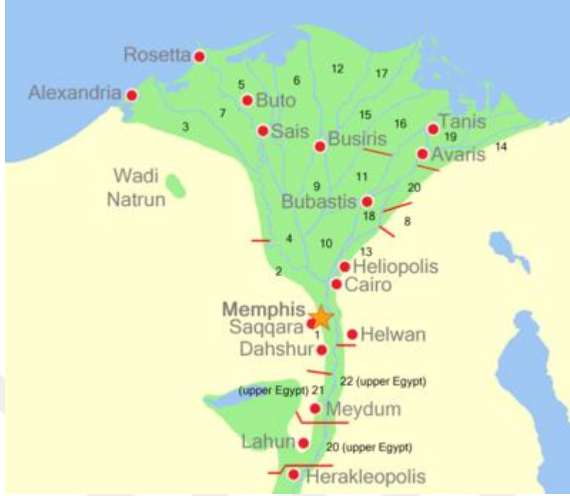
Şekil 10 Antik Mısır ( https://www.wikiwand.com/tr/Nom )