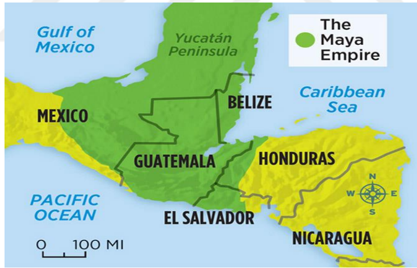
Şekil 7 Maya Medeniyeti

başlaması ve şuan henüz tam anlamıyla tasnifli bir tarih yazımı ortaya çıkmaması sebebiyle yerli kültürlerin tarih öncesi pekde açıklanamayacak durumdadır. Mayalarında nasıl tarih sahnesine çıktıklarına dair elde fazla delil yoktur. Maya önce orta Amerika'da takribi m.ö. 1200 ile 400 yılları arasında yaşayan Olmek kültürünün varlığı ortaya çıkarılmışsada bu kültüre ve dinine ait bir bilgi yoktur. 38 Mayaların da bu Olmek kültürünün devamı olduğu düşünülmektedir. Mayalar tarihsel olarak üç döneme ayrılırlar. Bu topluluğa ait ilk izler, klasik öncesi dönem olarak adlandırılan m.ö. 3.yy. dan kalmadır. Guatemala'da Peten bölgesinin kuzeyindeki Nakbe ve El Mirador şehirlerinin kalıntıları bulunmuştur ki bu alan mayaların dini merkezleri olarak bilinmektedir. 39 Guatemala, Belize, Honduras, Meksika topraklarında maya şehirlerine rastlanmaktadır.