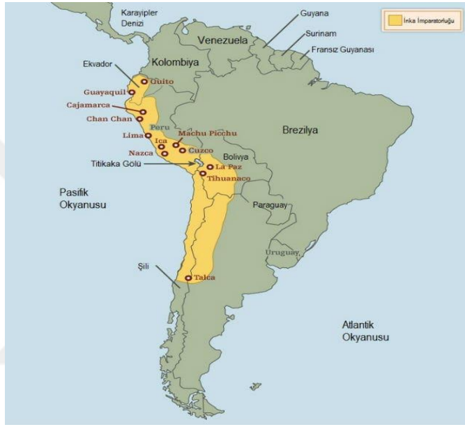
Şekil 9 İnkalar

kurulmuş ve bu devlet 14. Yy'da İnkaya yayılmağına kadar And bölgesinde hakim toplum olmuştur. Cuzco'da efsanevi kurucusu Manco Capac'ın devleti kurması ile birlikte İnkalar, İspanyolların 1532'de bölgeye gelişine kadar geçen bir yüzyıllık sürede Andlar bölgesinde Kolombiya'dan Şili'ye kadar olan kuzey-güney ekseninde 4000 km. bir bölgede hakimiyetlerini kurmuşlardır.