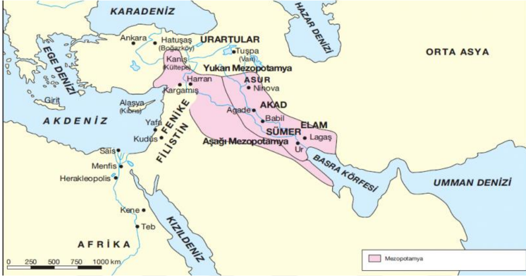
Şekil 5 Mezopotamya coğrafyası

eşsiz sembiyozlar oluşturulmuştur. Dördüncü bin yıldan itibaren kullanılmaya başlanan çivi yazısı sayesinde insanoğlunun kayıt tutması ana kaynak noktasında elimize eşsiz bilgiler geçmiştir. Bunun yanında genel anlamda tarihin kaydedilmeye başlaması ile birlikte prehistorik dönemden çıkılıp tarih çağlarına geçilmiştir. 7