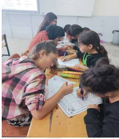
Şekil 3.10. Deney grubu öğrencileri Abe bağlama oyunu oynaması

zamanlı iletişim sürecini kavrar.” ve “iletişim süreci açısından araçlar arasındaki farklılıkları tartışır.” kazanımları işlenmiştir. Oyunda harfleri birbirine bağlarken iletişim kurduklarını ve farklı yolları ise iletişim araçları olarak benzetme ile kavramlar öğrencilere aktarılmıştır.