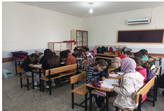
Şekil3.2.Deney grubu öğrencileri kelime tamamlama oyunu oynaması

Kelime tamamlama oyunu kâğıt üzerinde oynanan oyunlardır. Kâğıtta verilen harflerden anlamlı bir kelime türetme oyunudur. Kelimeleri bulmak için bazı harfler ipucu olarak verilmiştir. Öğrenciler bu harfler sayesinde kelimeyi bulmaya çalışırlar. Kelimeleri bulurken saat yönünde veya saatin tersi yönünde gidilebilmektedir. Bu oyunla birlikte öğrenciler bir problemi anlayarak çözüm bulmayı gerçekleştirirler. Kelime tamamlama oyunu tüm öğrencilere üçer fotokopi şeklinde dağıtılarak ilk kâğıdı etkileşimli olacak şekilde oynanmıştır, diğer iki kâğıt ise öğrenciler kendi aralarında yardımlaşarak sonuca varmışlardır. Bu oyunumuzda işletim sistemini tanıyorum konusunun” işletim sistemi kavramını açıklar.” ve “işletim sistemlerinin bileşenlerinin görevlerini kavrar.” adlı kazanımları elde edilmiştir. Kelimeleri işletim sistemi kavramları ile özdeşleştirilerek dokümanlar hazırlanmış ve öğrencilerle oynanmıştır.