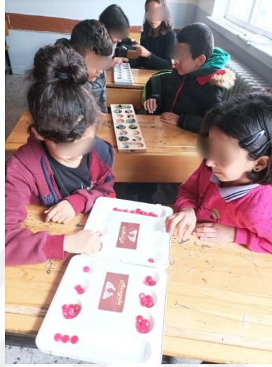
Şekil 3.3. Deney grubu öğrencileri mangala oyunu oynaması

uygulayarak oyunu daha kolay ve eğlenceli şekilde oynamışlardır. Bu oyunumuzda sayılarla oynuyorum konusunun “belirli bir amaç için oluşturduğu tabloyu biçimlendirir.” isimli kazanımı gerçekleştirilmiştir. Mangala oyununda amacına göre taşları düşünerek, biçimlendirerek dağıtımı yapıldığından dolayı bu konu ile bağlantı kurulmuştur.