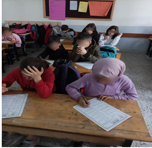
Şekil 3.4. Deney grubu öğrencileri zeka çöpü oyunu oynaması