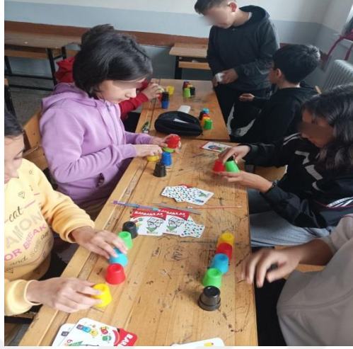
Şekil 3.7. Deney grubu öğrencileri akıllı bardaklar oyunu oynaması

kadar tüm öğrenciler aktif katılım göstermiştir. Bu oyunumuzda böl, parçala, çöz adlı konunun “temel fonksiyonları problem çözme sürecinde kullanır.” adlı kazanım uygulanmıştır. Oyundaki bardaklar ile temel fonksiyonlar benzetilerek verilen katlardaki şekiller oluşturularak oyun oynanmıştır.