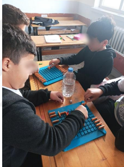
Şekil 3.9. Deney grubu öğrencileri koridor oyunu oynaması

taşları koyacaktır. Sırası gelen oyuncu isterse piyonunu hareket ettirir isterse de engel koyar. Piyonlar her hareketinde sadece bir kare olacak şekilde ileri, geri, sağa ve sola hamle yapabilmektedir. Piyonlar çapraz hareket edemez ve engellerin üstünden atlayamaz. Oyuncular rakiplerine engel koyarken muhakkak ilerleyecek bir yol seçeneği bırakmak zorunda olduğunu unutmamalıdır. Koridor oyunu daha önceden oynadıkları bir oyundur. Öğrenciler bildiklerini söylemişlerdir. Böylece ders saati içinde tekrar tekrar oynanan bir oyun olmuştur. Öğrenciler arasında rakip değişimleri de yapılmıştır. Bu oyunumuzda dijital tehlikeler konusunun “zararlı yazılımları kavrar.” ve “güvenlik yazılımlarının kullanım amaçlarını açıklar.” olmak üzere iki adet kazanım gerçekleştirilmiştir. Oyunda güvenli yollar oluşturması güvenlik yazılımı ile tehlikelere karşı duvarlar koyası ise zararlı yazılımlar eşleştirilerek kavramlar öğrencilere aktarılmıştır.