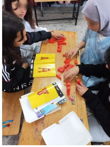
Şekil 3.11. Deney grubu öğrencileri Architecto oyunu oynaması