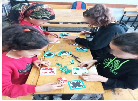
Şekil 3.6. Deney grubu öğrencileri Q-Bitz oyunu oynaması

Q-Bitz oyunu renkli küpler ismiyle de bilinen bir kutu oyunudur. Bu oyun dört kişi oynanır. Kutunun içinde dört oyun tahtası ve bu oyun tahtası yerleştirilecek 16 küp olacak şekilde toplam 64 küp ve oyun kartları bulunmaktadır. Küpleri her bir yüzeyinde farklı şekil ve sembol bulunmaktadır. Her bir oyuncuya bir oyun tahtası ve 16 küp verilir. Oyunun amacı 16 küpü kullanarak oyun tahtasının içine belirlenen kart üzerindeki şekilleri oluşturmaktır. Q-Bitz oyununun başlangıç, orta ve ileri olacak şekilde üç seviyesi bulunmaktadır. Oyun kartları bu seviyelere göre gruplara ayrılmıştır. Bu oyundan 8 adet temin edilerek öğrenci sayısı kadar temin edilememiştir. Öğrenciler sıra ile birer defa oynamıştır. Diğer öğrenciler ise daha önce oynanan oyunlardan pekiştirme yapmıştır. Bu oyunumuzda ara-tara, sor-sorgula konusunun “bilgiye ulaşırken zararlı ve gereksiz içerikleri ayırt eder.” ve “bilgi yönetimi kavramını ve önemini ifade eder.” isimli kazanımları uygulanmıştır. Q-bitz oyununda karttaki görselleri yaparken kişiye gerekli olan küpleri bilmesi ve gereksiz küpleri ise kullanmaması kazanımlarla ilişkilendirilerek oyun oynatılmıştır.