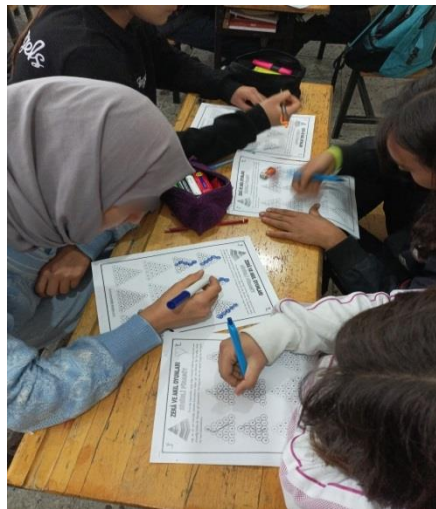
Şekil 3.5. Deney grubu öğrencileri sihirli piramit oyunu oynaması

Sayı, harf veya sembollerden oluşan piramit oyunu mantıksal yollar çizerek oynanan oyundur. Piramidin tabanındaki şekil miktarı kadar kullanılan sayıları piramidin tepesinden başlayarak her sayıyı bir defa kullanarak piramidin tabanına inerek yol çizilir. Piramidin her katında farklı sayı kullanılması gerekmektedir. Piramidin tepesinden aşağı doğru inerken sadece hücrenin sağ ve sol alt kısmında bulunan komşu hücrelere doğru bir yol çizilmektedir. Yolu çizerken sağa ve sola doğru yol çizilemez sadece aşağı doğru ilerleme yapılabilir. Bu oyun öğrencilerin en kolay bulduğu bir oyun olmuştur. Renkli renkli boyayarak ve hızlı bir şekilde oyun oynanmıştır. Bu oyunumuzda farklı yollardan aynı çözüme adlı konunun “problemin çözümü için bir algoritma geliştirir.” kazanımı gerçekleştirilmek hedeflenmiştir. Piramit üzerindeki yolu çizebilmek için öğrencilerle farklı algoritmalar oluşturularak oyun oynanmıştır.