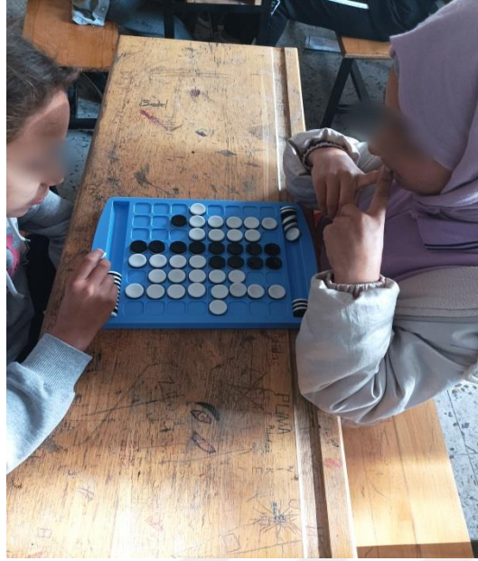
Şekil 3.1. Deney grubu öğrencileri reversi oyunu oynaması