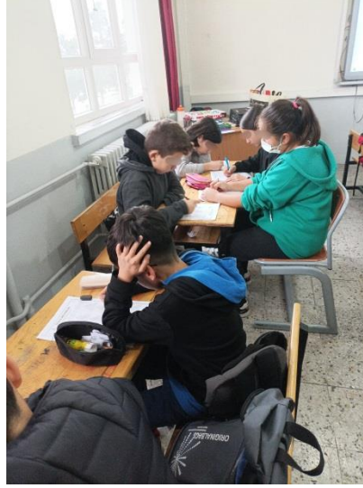
Şekil 3.8. Deney grubu öğrencileri sudoku oyunu oynaması