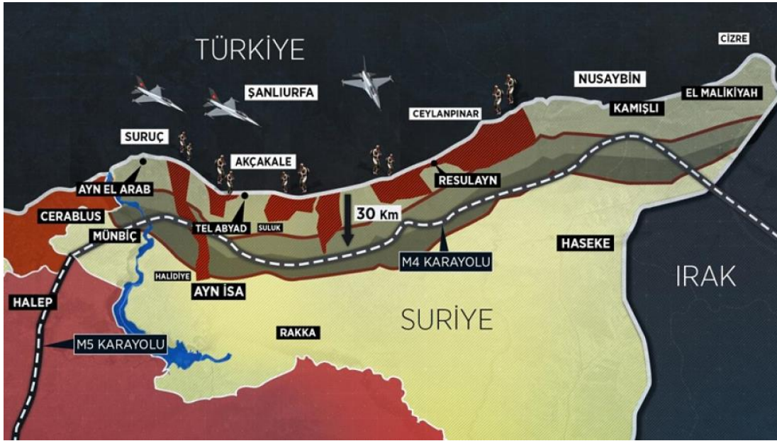
Şekil 3.5. Barış Pınarı Harekât Sahası