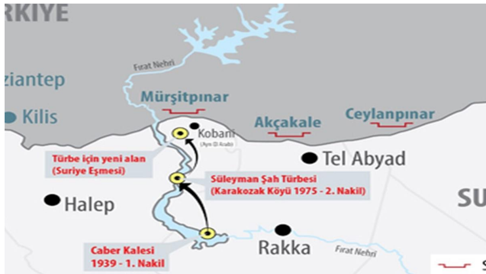
Şekil 3.1. Şah Fırat Operasyonu

Operasyonda 572 asker, birçok tank ve F-16 uçakları görev yapmıştır. DAESH, Türk ordusunun türbeye ulaşmasını engellemek için yol boyunca bombalar yerleştirip yolları kullanılamaz hale getirmiştir. Teröristler türbenin taşınması sırasında askerlerin olduğu tanklara silahlı saldırıda bulunmuştur. Bu operasyon esnasında 1 Türk askeri şehit olmuştur. Türbe olası bir bombalı saldırı tehdidine karşı yerinden alınarak güvenliği bölgeye nakledilmiştir. Naaşın yerinden alınmasından sonra Süleyman Şah Türbesi imha edilmiştir.