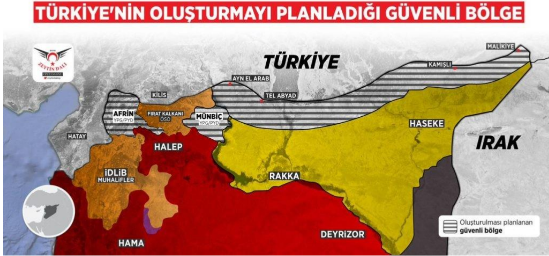
Şekil 3.4. Afrin Harekâtı