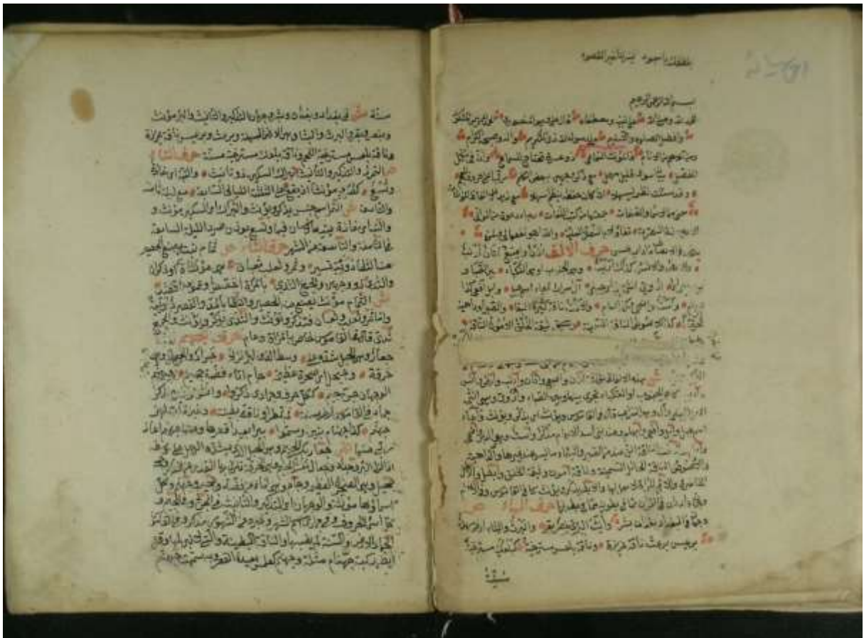
Çorum Hasan Paşa İl Halk Kütüphanesi, nr. 2694/4, vr. 35b-36a.